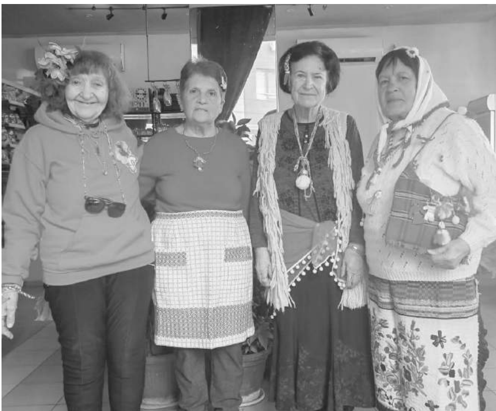
Екипът, подготвил мартенския празник