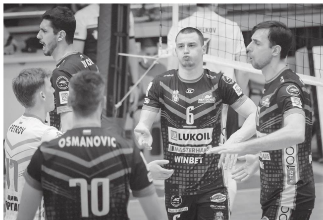
Бургас отново ще е арена на волейболна сблъсък

Серията беше затвърдена и в последния кръг, когато „Нефтохимик“ спечели