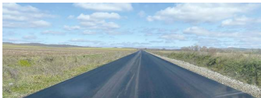
ФОТО: ЖИТЕЛ НА ПЕЩЕРСКО