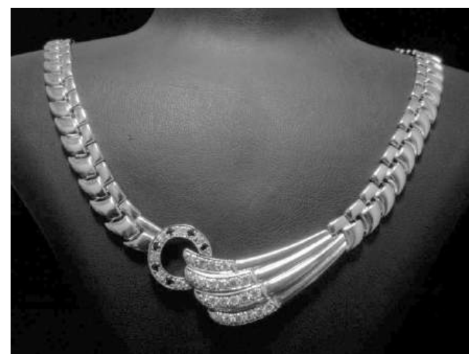
Цените в заложените къщи са една идея по-евтини, но също държат висока стойност

Ефектът върху бижутерийния сектор вече е видим. По-високите борсови цени на суровините директно откъпяват производството. Златните и сребърните бижута поскъпват, а в отделни пазари се на-