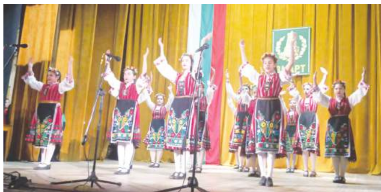
ТС „Шарено гайтанче“ на НЧ „Васил Левски 1869“