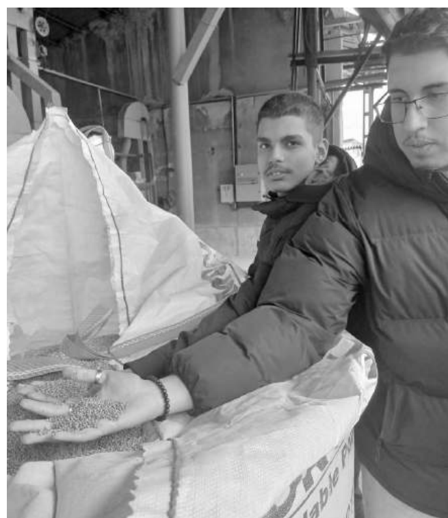
Всичко за сеитбата – не по учебник, а в реална среда