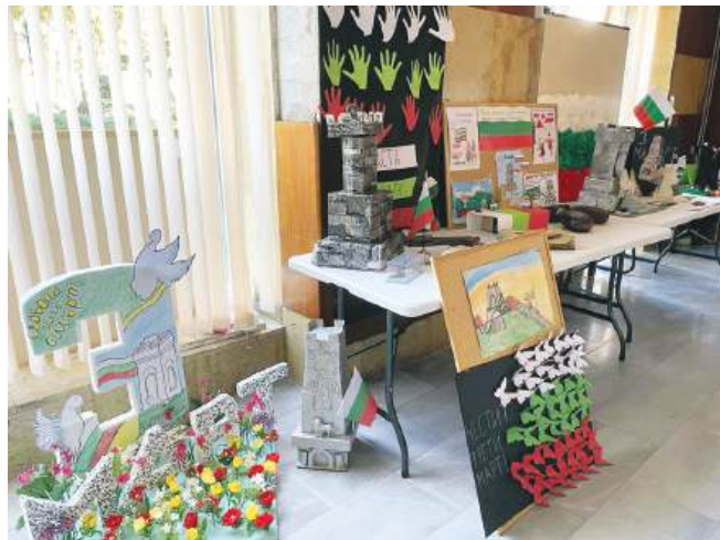
Дни наред, малки и големи ученици се трусиха за родолюбивата украса на класните стаи

Чрез творческите си проекти учениците показаха, че познават и почитат делото на героите, отдали живота си за свободата на родината. Учители споделиха, че инициативата не само развива художест-