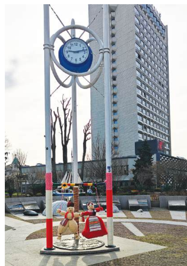
Символът на Бургас-Часовника в центъра на града в мартенска премяна. Огромна мартеница създава пролетно настроение