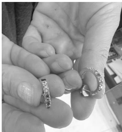
Скокът в цените на златото и среброто се отрази и на бижутата

Поскъпването не е изненадващо. Комбинация от геополитическо напрежение, отслабване на щатския долар, агресивни покупки от централните банки и трайно висока инфлация изстреля цените нагоре,