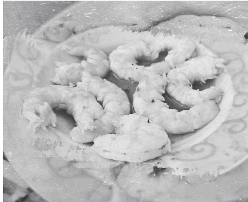
Ястие, приготвено от Аделина

Освен общата им мисия, връзката им е много повече от организационна. „Често ѝ се обаждат просто да я чуя или да ѝ споделя нещо“, споделя Светлозара. „Толкова често се чувам с нея, че мъжът ѝ Велко ѝ казва: „Щерка ти ти звъни“.