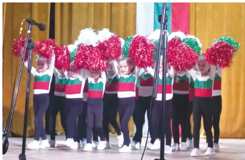
Най-малките читалищни танцьори