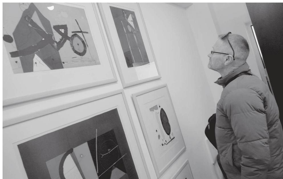
Изложбата на Стоян Цанев в галерия „Пролет“