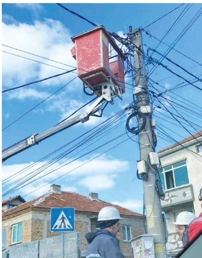
Подменя се уличното осветление