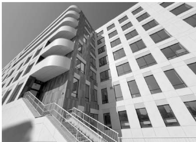
Лечебното заведение ще разполага със 142 болнични легла, разпределени в клиници и отделения по основни медицински специалности