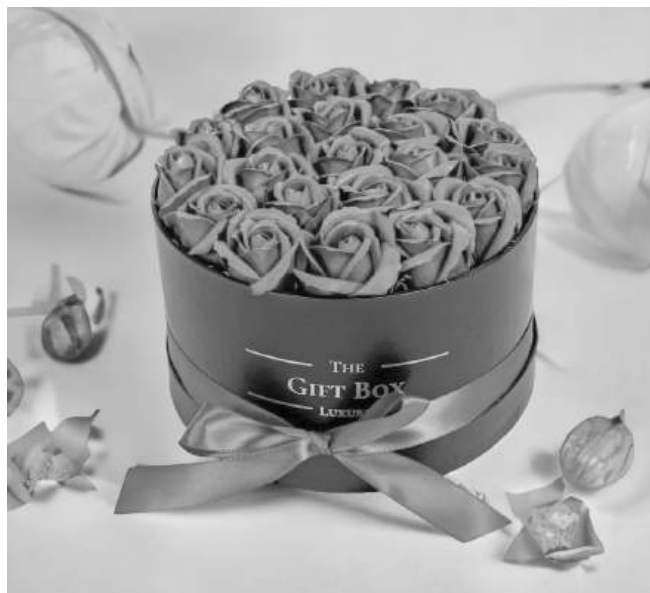
Кутия със сапунени рози в бордо

се изчерпват дотук. В интернет пространството могат да се открият още много подобни предложения. Със сигурност всеки ще може да намери най-подходящия вариант – според собствените си изисквания и, разбира се, според предпочитанията на жената, за която е предназначен подаръкът – било то майка, баба, приятелка.