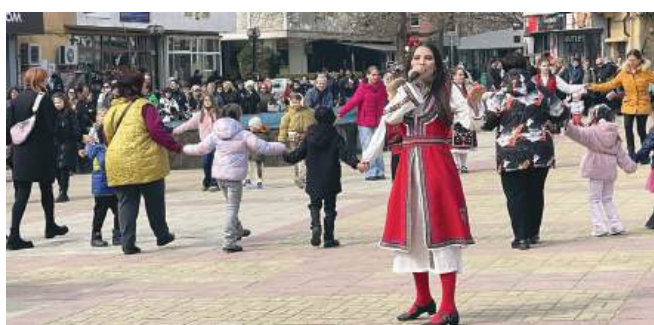
Песните на Теодора наредиха дълги хора на площад „Свобода“