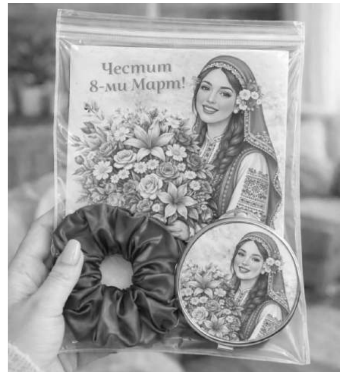
Готов подаръчен комплект

Възможностите включват семена от гетелина, чери домати или лавандула. Така картичката може