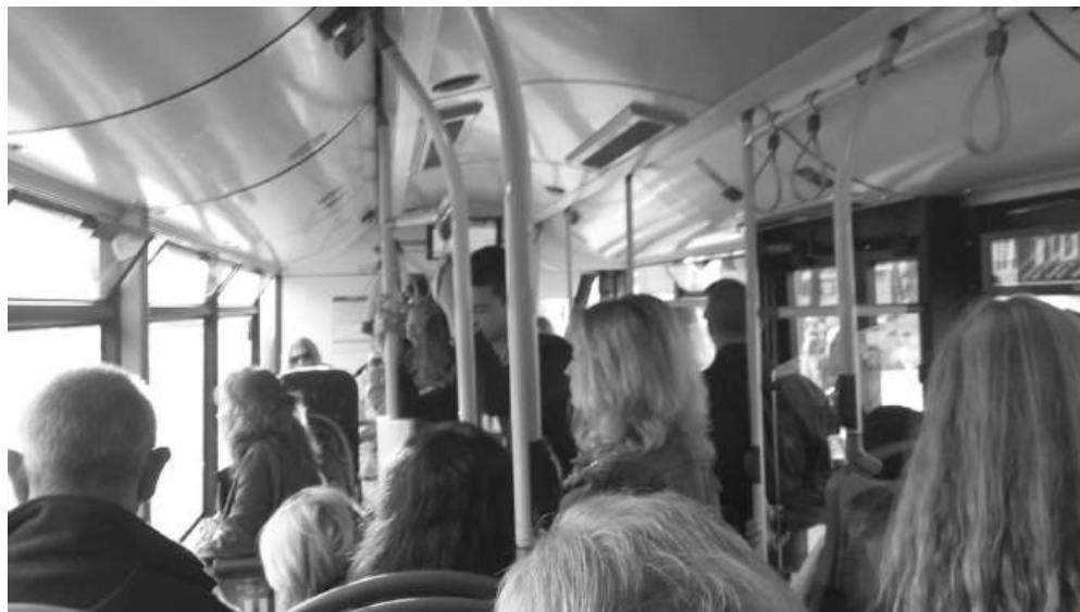
От Община Бургас обещаха по време на дебата, че след като направят анализ на преференциалното пътуване за ученици и студенти, ще вкарат и пенсионерите като следваща група

Това означава, че макар Пловдив да е индустриален център, осигурителната история на днешните му пенсионери е различна. В Бургас тежката индустрия, нефтопреработката и силовите структури са оставили по-силен отпечатък върху пенсионната картина през годините.