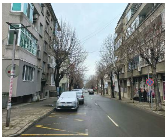
Новото осветление на ул. „Станционна“ в Айтос