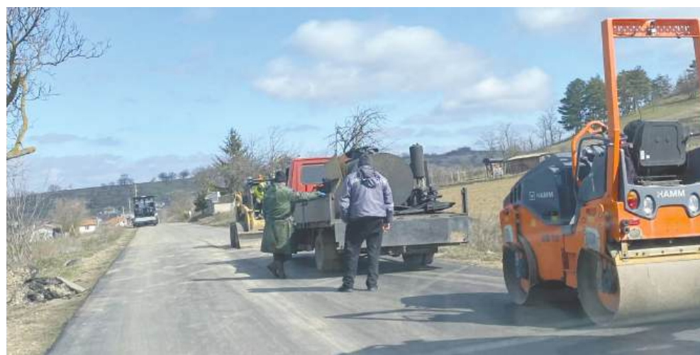
Новата настилка на пътя до селото

Местните от години чакаха ремонта на точно този пътен участък, който беше в лошо състояние. Настилката е съвсем прясно излята и на този етап проблемът е решен.