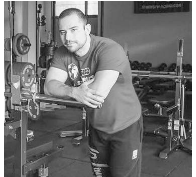
В тренировъчната зала - години на постоянство, прецизна подготовка и силна психика