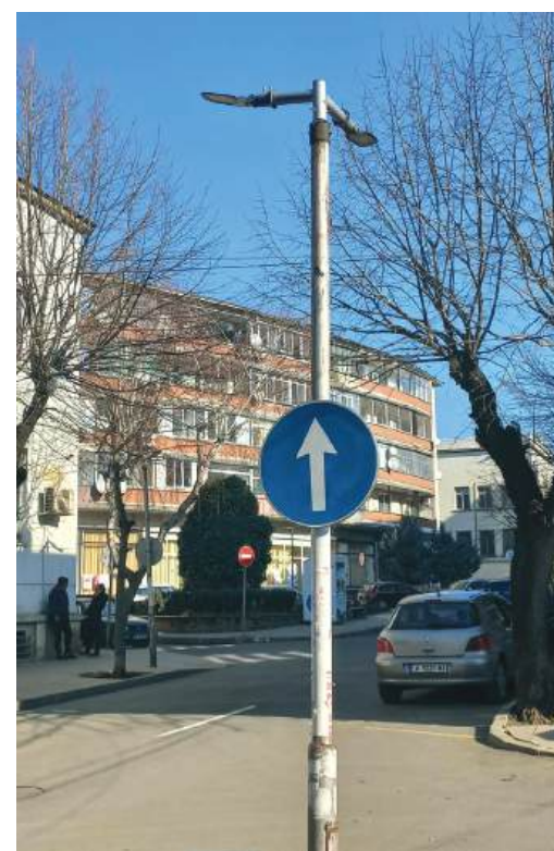
Целта е не само съвременно улично осветление, но и по-малко разходи за енергия

Проектът включва град Айтос и селата с. Дрянковец, с. Зетъво, с. Карагеоргиево, с. Караново, с. Лясково, с. Малка поляна, с. Мъглен, с. Пещерско, с. Пирне, с. Поляново, с. Раклиново, с. Съдиево, с. Тополица, с. Черна могила, с. Черноград, с. Чукарка. Демонтирани се съществувалите улични осветителни тела /3220 бр./ и конзоли /3220 бр./.