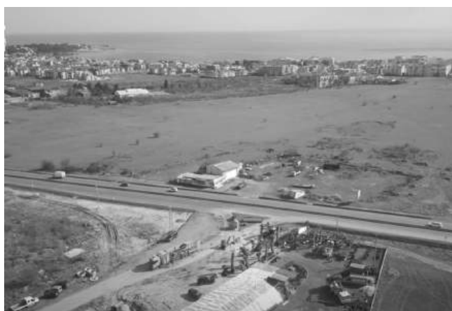
Проектът е част от интегрирания воден проект на област Бургас – фаза 2

Строителните дейности ще се извършват и през летния сезон. Общината предупреждава, че това ще създаде известен дис-