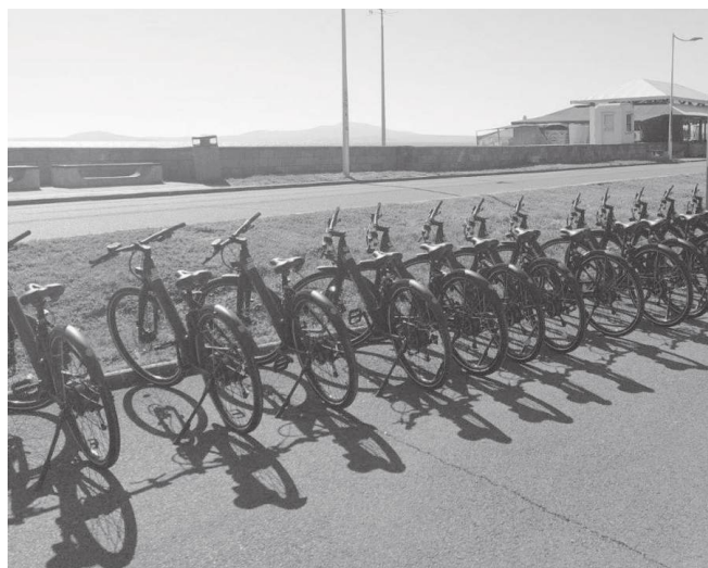
Броят им постепенно ще нарасне до 200

На разположение на бургазлии и гостите на града ще бъдат 100 велосипеда, като техният брой постепенно ще нарасне до 200. Те ще са разпределени на 10 стоянки, разположени на ключови и удобни локации: Автогара Юг; Хотел „Приморец“; Гъбката; Пантеон; Капани; Двете брези; Изгрев парк; Славейков – разделителна; ОЗК Плувен басейн; Младежки дом.