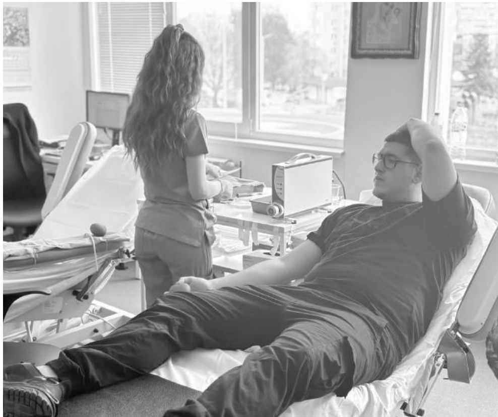
На учителите не им се налага да мотивират учениците да даряват кръв

Акция. Ученици от Механотехникума и Строителния са сред първите ентузиастисти