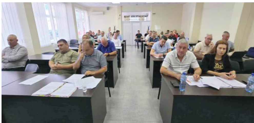
За подаване на проектното предложение е необходимо решение на Общинския съвет.

Като партньор по проекта Община Айтос ще има възможност да осигури защитни облекла за горски пожари и ръчни уреди за пожарогасене на доброволното формиране на стойност 9 294,05 евро.