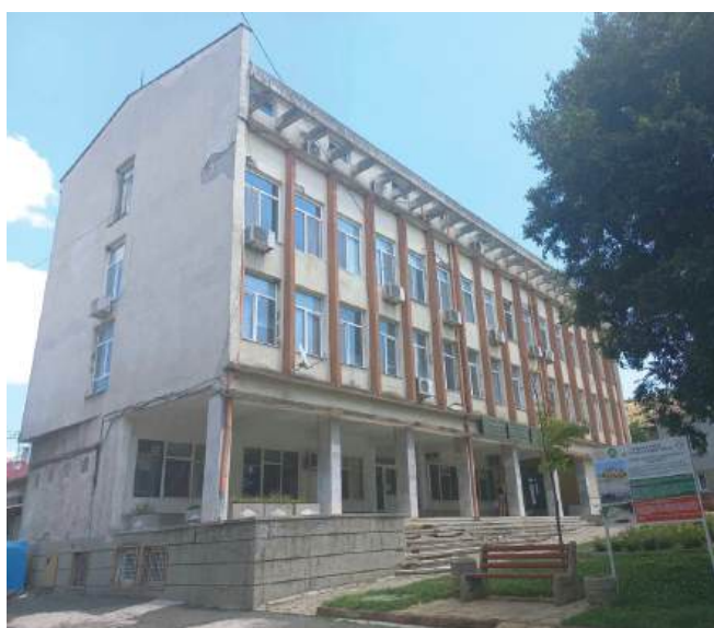
Общинската сграда, в която се намира ДСП-Айтос

Решението по искането на кмета ще бъде гласувано от Общински съвет - Айтос на 29 януари.