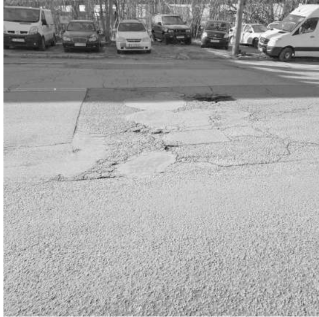
Бул. „Мария Луиза“ вече има нужда и от ремонт след работите на ВиК

Вторият проект обхваща разширение на съществуващия паркинг на ул. „Гурко“, като целта е капацитетът му да бъде значително увеличен. Новият паркинг ще включ-