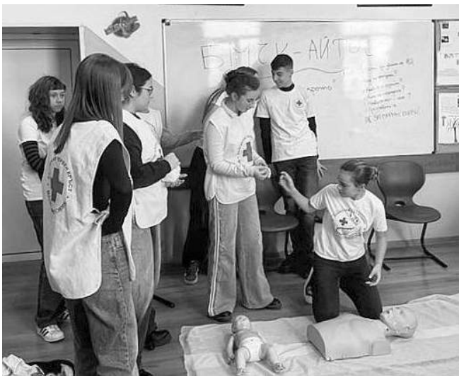
БМЧК: Знанията оказване на първа помощ са умение за цял живот

Подобни инициативи ни напомнят, че знанията оказване на първа помощ са умение за цял живот и могат да направят всеки от нас герой в точния момент. Благодарност получава всички участници за споделените знания, както и домакините - за топлото посрещане и гостоприемството.