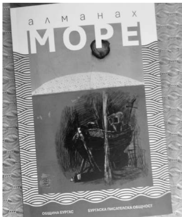
Корицата на новия брой на алманах „Море“

Акцент в раздел „Преводи“ е подборка от съвременна полска поезия, реализирана със съдействието на Полския културен институт. Представени са водещи полски автори, които дават цялостна картина на съвременната поетична сцена в Полша.