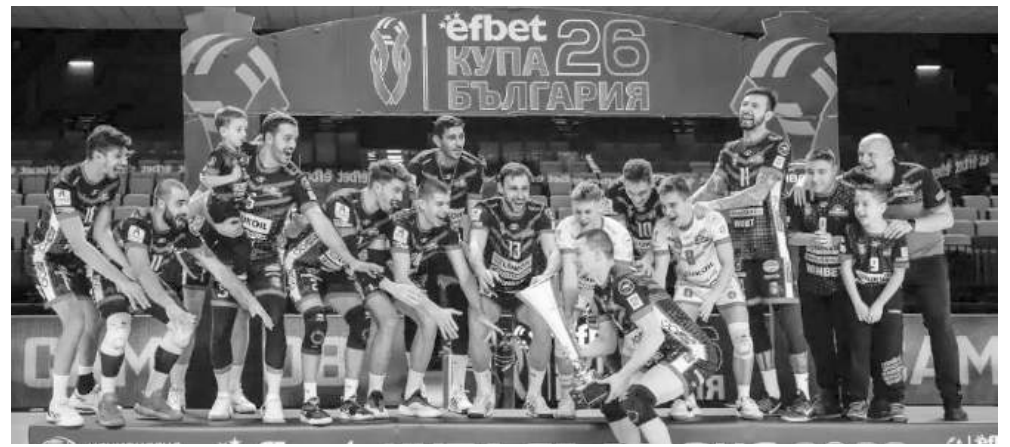
Бургазлии надделяха над силния „Пирин“ (Разлог)

Трофеят вече е в Бургас, еуфорията не стихва, а Нефтохимик 2010 показа, че дори когато е подценяван, остава отбор с характер, класа и навика да печели, когато залогът е най-висок.