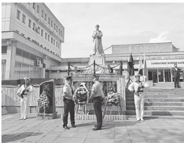
Гарнизонният военен клуб

„Залата на ДНА има сходен капацитет и много добри гадености. Макар и вековна, един ремонт може да я превърне в изключително функционално