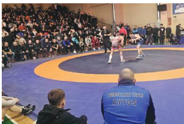
На тепиха на Държавното първенство

фаворити на първенството в Сливен двойдохамного състезатели на клуба и родители. Благодарим на всички за мощната айтоска подкрепа“, коментира за НП, президентът на СКБ „Айтос“.