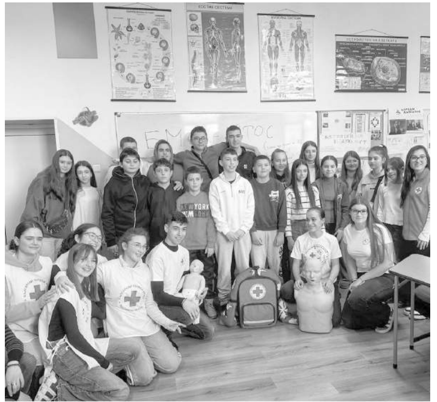
Не само съвети, но и нови приятелства