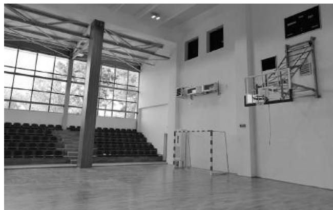
Община Айтос е с грижа да спортната база не само в града, но и в населените места

СПОРТЕН КЛУБ „ДРАКОН“ – АЙТОС също направи своя безапелационен избор – НЕ-