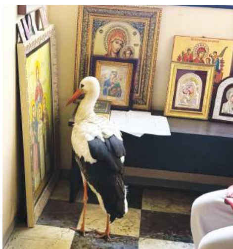
Щъркелът бе открит вперил поглед в иконата „Вяра, Надежда и Любов“