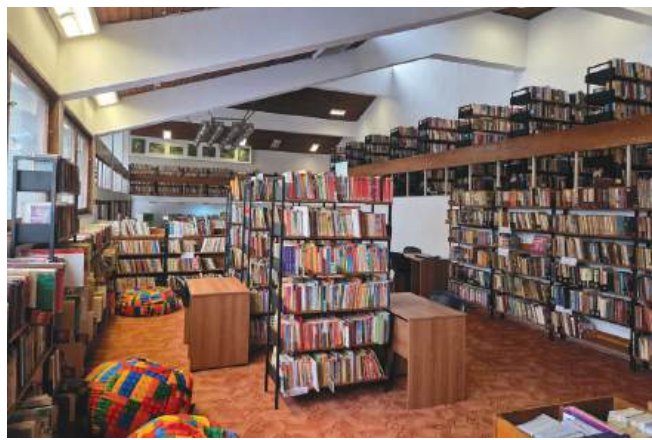
Библиотеката при НЧ „Отец Паисий – 1896“ съчетава традиция и модерност

В двата отдела е налична заемна литература на свободен достъп, която може