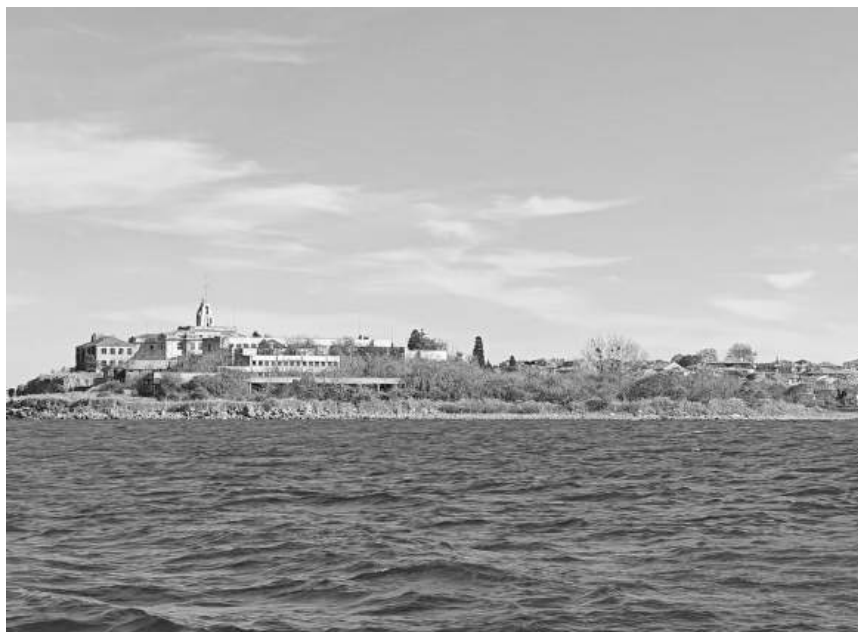
Остров „Св. св. Кирик и Юлита“