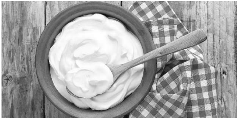
В България киселото мляко е навсякъде. Ше го намерите във сандвичите с фалафели, върху мусаката, по хладилниците на супермаркетите. То е основна съставка на традиционни български ястия като таратора – студена супа с кисело мляко, вода, краставица, орехи и копър; и снежанката – салатата от кисело мляко, краставица, чесън и копър. Хората пият мляко по улицата и заливат пържените си тиквички с него – така започва обширният репортаж на Би Би Си Травъл за България