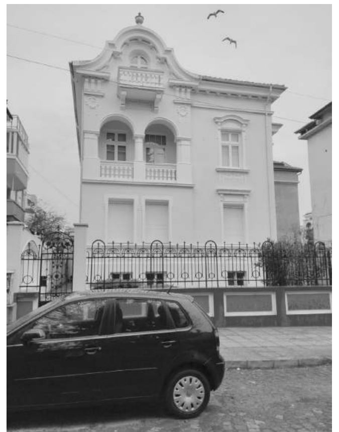
Съвременен изглед 2025 г.