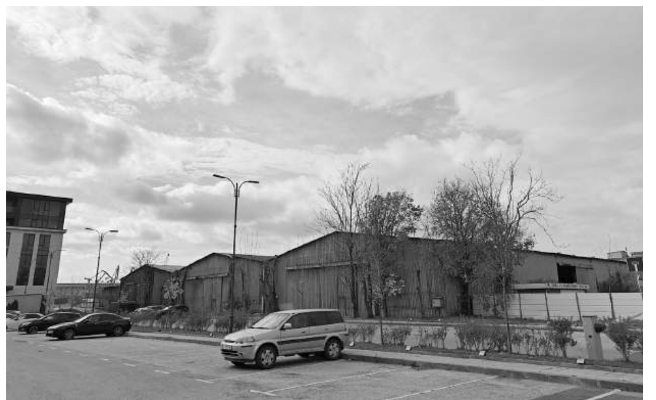
Прогнозната стойност на обществената поръчка възлиза на 6 181 518,84 евро без ДДС.

Инвестицията е част от по-широката концепция за развитие на зоната за обществен достъп на пристанище Бургас и цели подобряване на транспортното обслужване, реуизиране на уличното паркиране и създаване на вторичен градски обслужващ център в близост до морската зона.