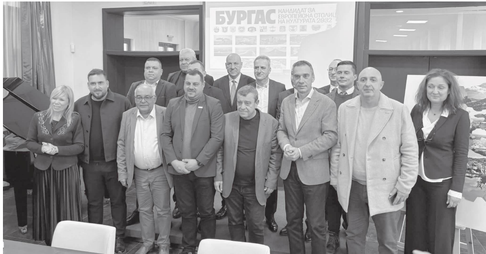
Всички се обединиха около каузата и изразиха надежда за реализирането на голямата цел

Подписването на меморандума поставя началото на по-тясно сътрудничество между общините в област Бургас в рамките на подготовката на кандидатурата за Европейска столица на културата.