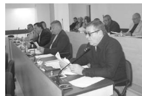
Общинските съветници гласуваха броя и тарифата за превоз

„Институциите трябва спешно да се намесят и озаптят цените навсичко в Несебър. Това не е единственото на селено място морето в България, никъде няма такива високи цени. То бива алчност...“, пише друг потребител.