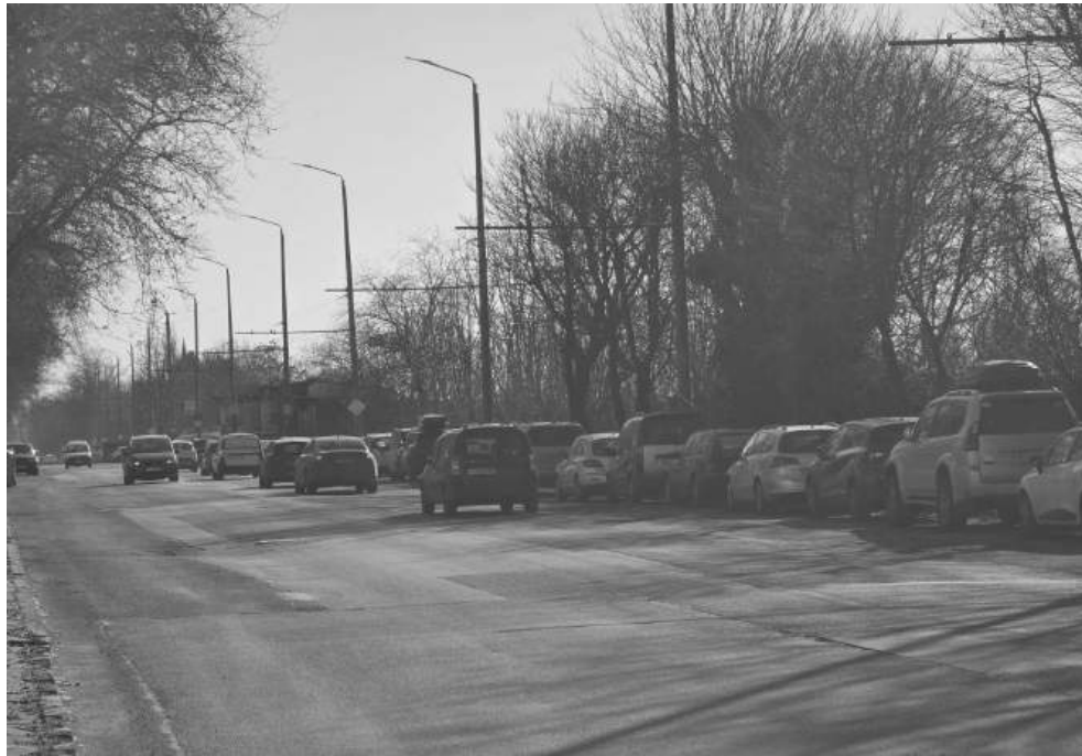
200 паркоместа в тази част на „Възраждане“ ще дадат временно глътка въздух

В същото време местата за паркиране в комплекс „Възраждане“ са кътм. Натискът расте, автомобилите се множат, а решенията се бавят. Единственият реален напредък към момента е извън темата за етажните паркинги. Съвсем скоро ще започне облагородяването на два терена по бул. „Мария Луиза“, които общината придоби. Единият вече е закупен, а за втория се очаква прехвърляне от държавата. Там ще бъдат обособени около 200 паркоместа – временна глътка въздух,