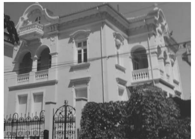
Изглед на къщата през 70-те години