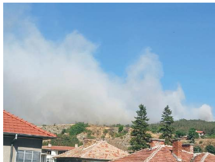
3 юли 2025 г. – пожар край Айтос.

Основната цел на проектното предложение на Община Айтос е да се повиши готовността за