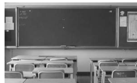
Илюстративна ФОТО: ИНТЕРНЕТ

По данни на здравните власти, най-тежко боледуват децата на възраст 0-4 години, както и възрастните над 65 години, при които по-често се наблюдават усложнения. Най-много заразени са от възрастова група 5-14 г.