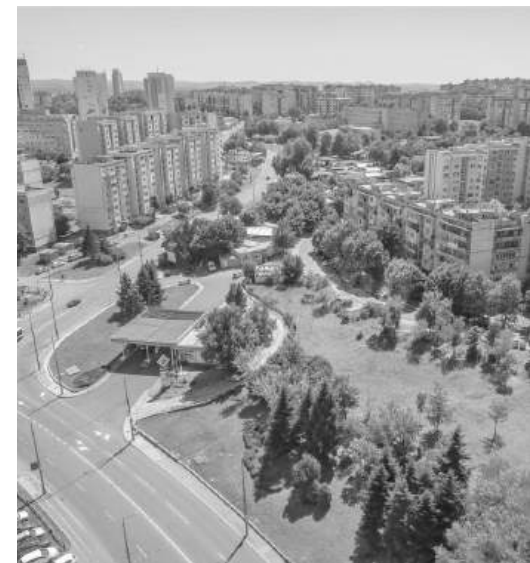
Имотите са с обща площ 11 799 кв. м и се намират в жилищен район „Меден рудник“, местността „Върли бряг“

Областният управител на Бургас трябва да разработи механизъм за контрол, чрез който да извършва периодични проверки за изпълнение на условията, при които имотите се предоставят на общината.