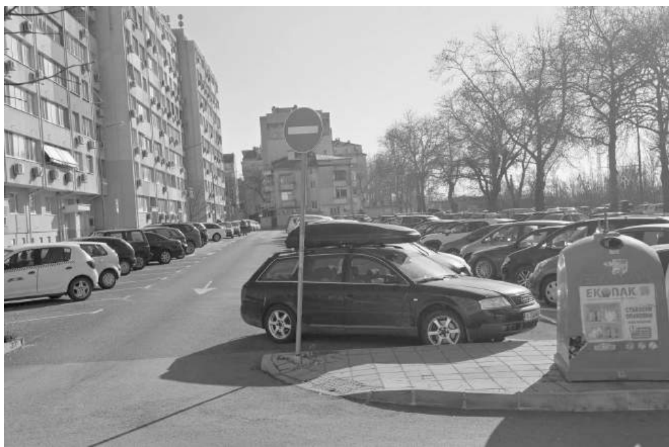
На тази локация бургазлии отказаха да има етажен паркинг