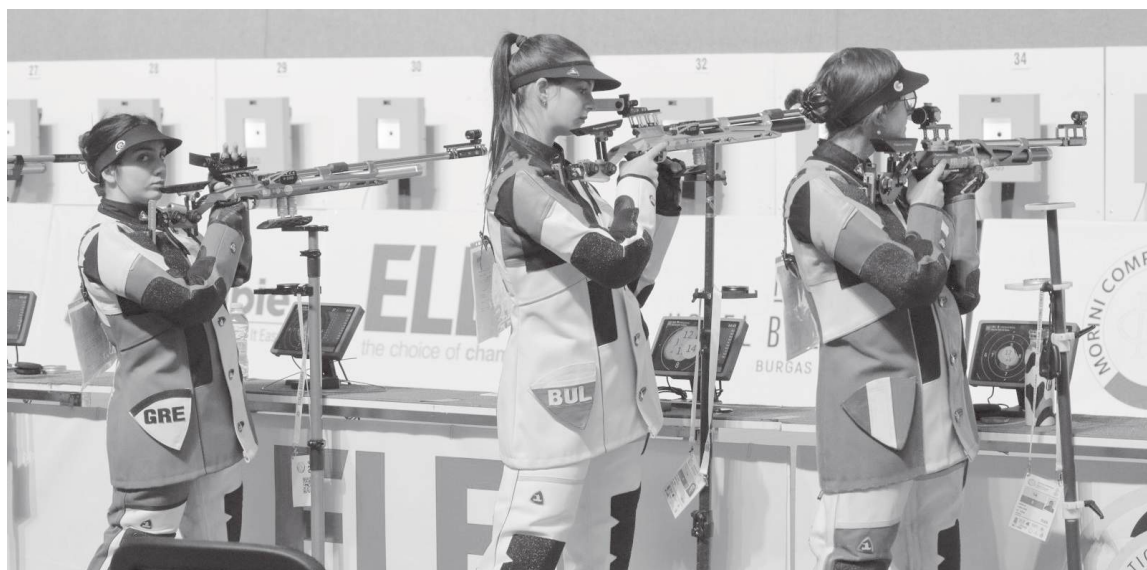
Българските състезатели завоюваха общо седем медала – един златен, четири сребърни и два бронзови

В „Арена Бургас“ при състезаваха и студенти от магистърската програма по фотография на Националната художествена академия – филиал Бургас, които запечатаха атмосферата на шампионата.