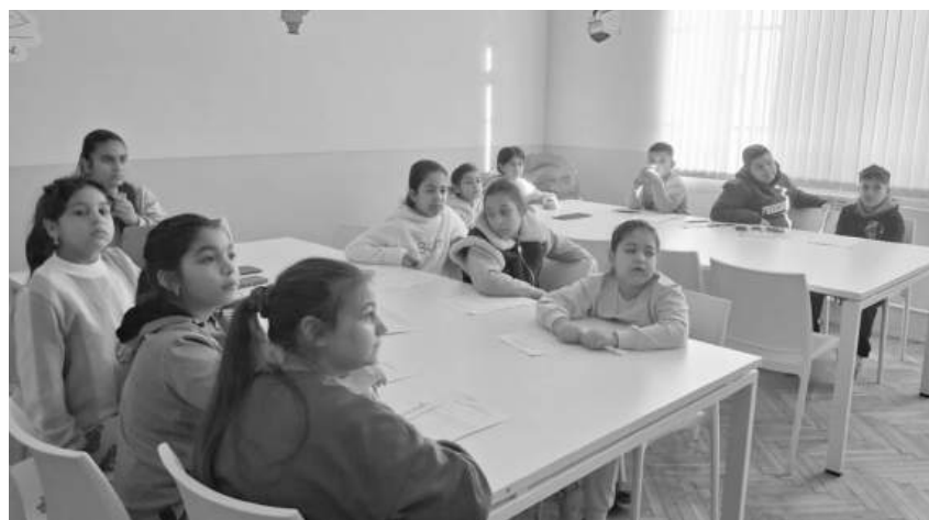
Учениците с ентузиазъм дойдоха на срещата, макар и в съботен ден

Община Карнобат е сред районите, които през последните години са засегнати от демографски процеси и изселване на работоспособното население. Част от децата в региона израстват при