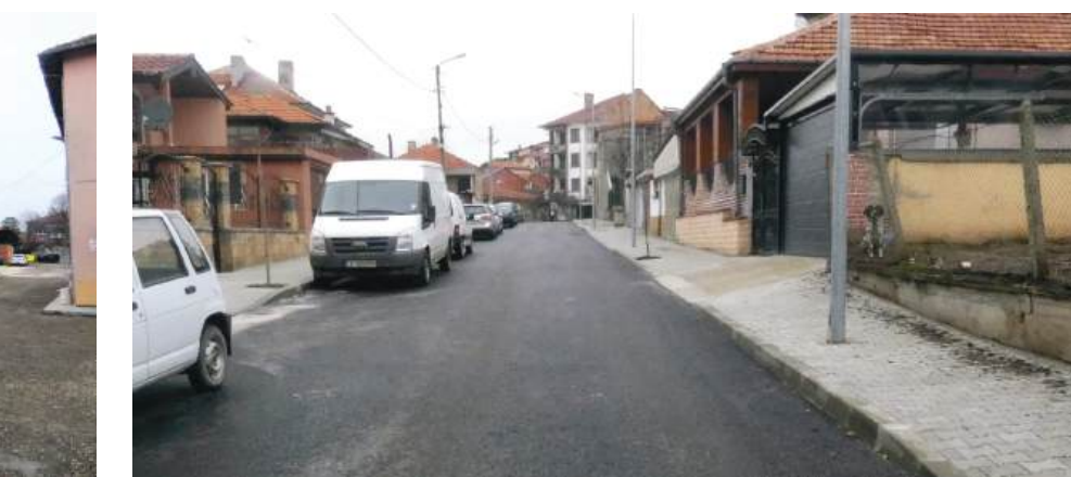
Основен ремонт и на ул. „Баба Стамата“, която води към МБАЛ Айтос ЕООД

По проекта се изпълняват основни ремонти на улици, довеждащи до Детско отделение на МБАЛ – Айтос: ул. „Ген. Гурко“, ул. „Баба Стамата“. Благоустроява се теренът около болницата. Цялостно се обновяват съществуващите пешеходни и автомобилни настилки, както и зелените площи. Целта е създаване на завършена