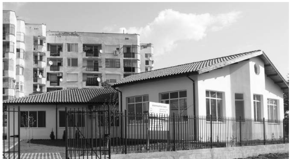
Защитено жилище – Айтос

Срокът на изпълнение на инвестицията е 30.06.2026 г.