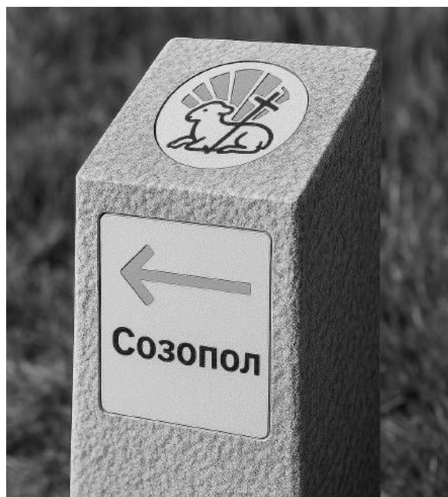
„Пътят до мощите на Свети Йоан Кръстител“ ще свързва Малко Търново със Созопол