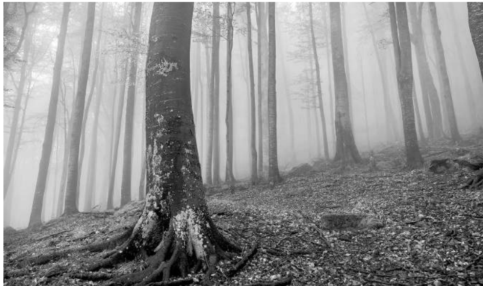
Поклонническият маршрут ще е с дължина 180 километра

Проектът, който ще свързва Малко Търново със Созопол през Странджа планина, се ражда не като туристическа инициатива, а като естествено продължение на личен път – духовен, професионален и човешки.