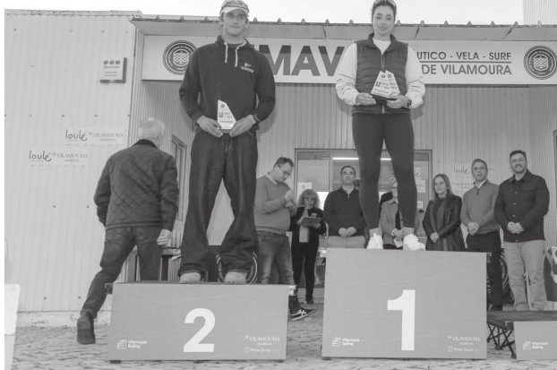
Това е първа регата за сезона за българската състезателка, която демонстрира отлична форма още в началото на годината

Регатата събра близо 400 състезатели от 18 държави и няколко ветроходни класа, сред които ветроходни величини като Ирландия, Португалия, Румъния, Хонконг, Финландия, Чехия, Нидерландия, Канада, Белгия, Швеция и Испания. В из-