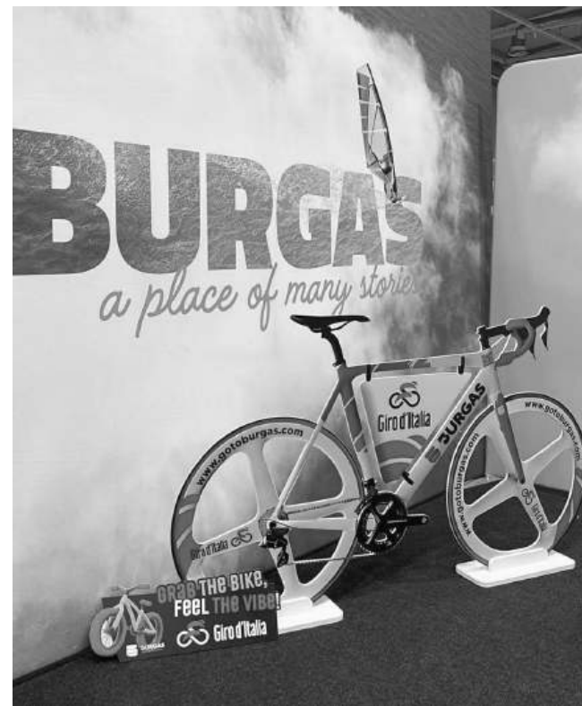
Колелото Giro d'Italia беше част от изложението

Хотелите със СПА услуги в региона не са много, но предлагат високо качество. Работи се и по концепции за разширяване на развитието на Акве калиде, където има минерална вода. В следващите две-три години се очакват нови и по-сериозни проекти в зоната.