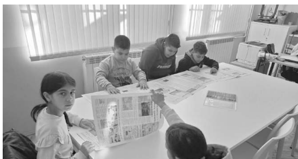
Деца с любопитство разглеждат вестник „Черноморски фар“