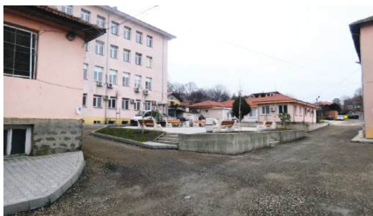
Благоустроява се теренът около болницата