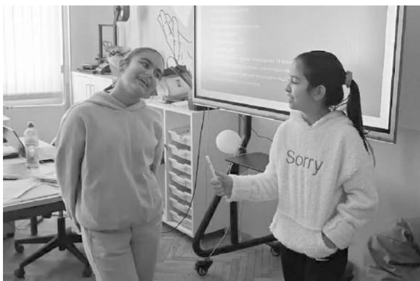
Бъдещ журналист се упражнява да взема интервю от знаменитост

Най-важното послание, което остана след разговора, беше, че новината не е просто текст. Тя е отговорност. А когато учениците започнат да осъзнават това още в училище, вероятността да бъдат активни, мислещи и информирани граждани нараства значително.