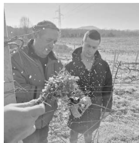
С 10 000 нови лозички е допълнен масивът

След поливането на лозите с вино последва благословия за здраве и плодородна година.