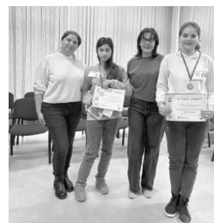
Най-добрите продължават напред