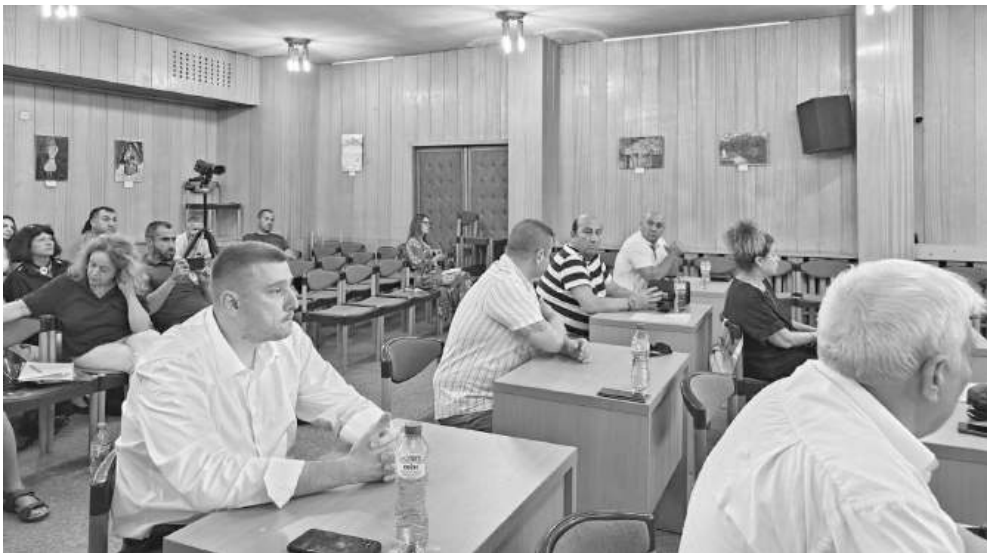
Общинските съветници ще разгледат отново темата през следващата седмица

Реакция. Възможни са подписки, протести и местен референдум