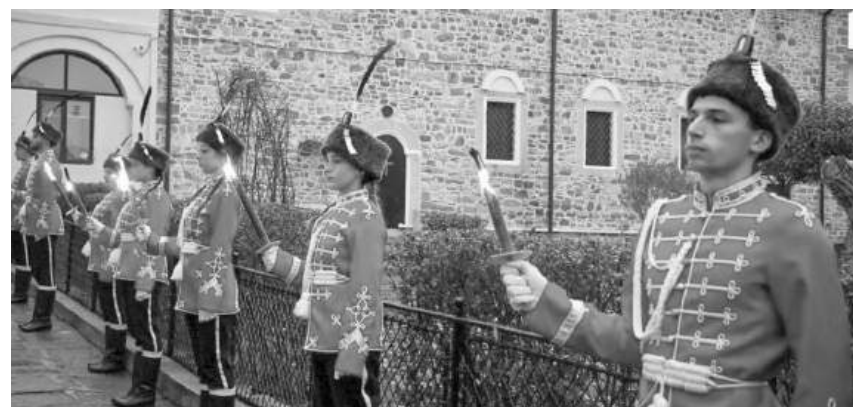
Факелно шествие в памет на Апостола – 2025 година

ставители на училища, детски градини и институции поднесоха венци и цветя пред паметната плоча на Апостола. Паметният знак е поставен на една от стените на църквата преди 25 години, по инициатива на Общински комитет „Васил Левски“ – Айтос.