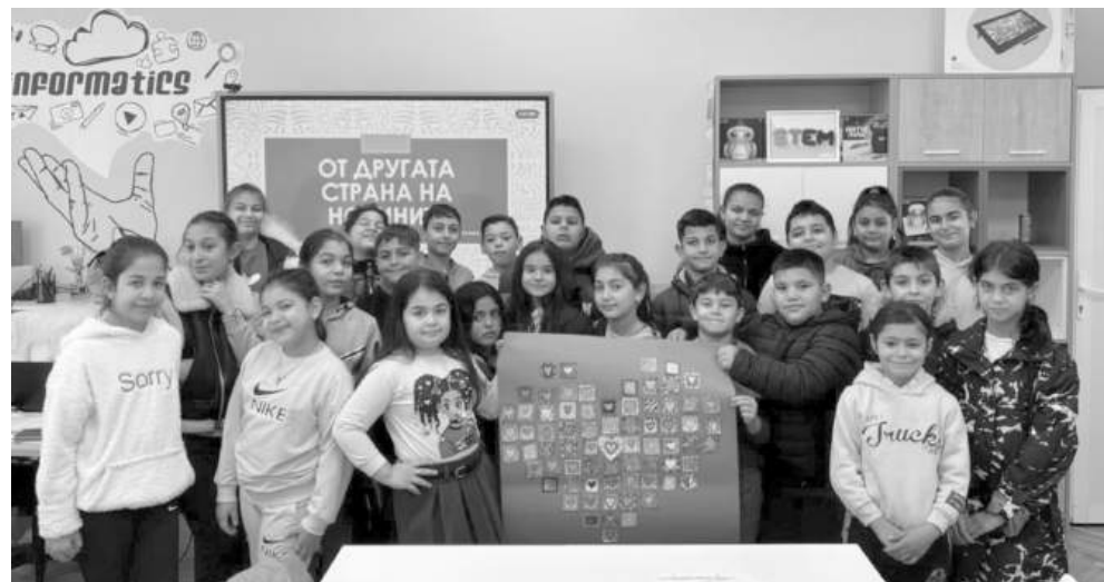
Учениците, които взеха участие в открития урок по журналистика