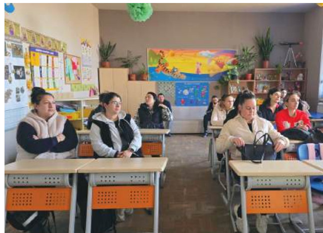
180 родители от трите училища участват в проекта