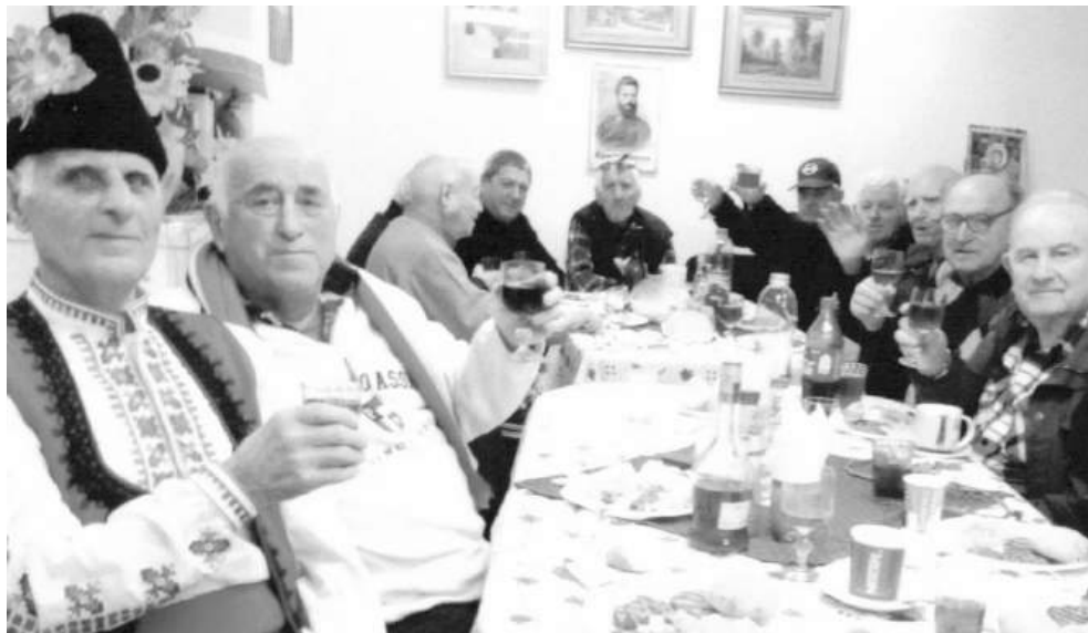
Празнуване на Трифон Зарезан

Но къде са сега созополските лозя със сладкия памид? Те рагнаха очите с различни сортове грозде, от които трудолюбиви стопани правеха бяло и червено вино, а от гжибритите – парлива ракуйка.