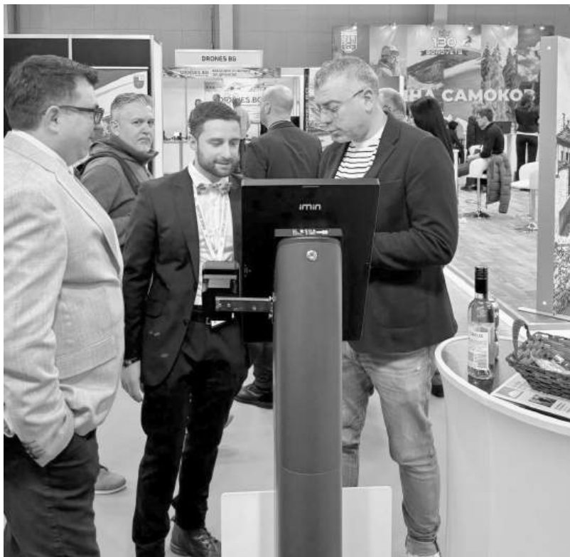
В рамките на изложението Община Бургас е представила и новия си виртуален асистент „Go to Burgas Assistant“, разработен по модела на ChatGPT

спортен фокус, дигитални решения за по-добро обслужване и конкретни стъпки за разширяване на туристическия профил на града.