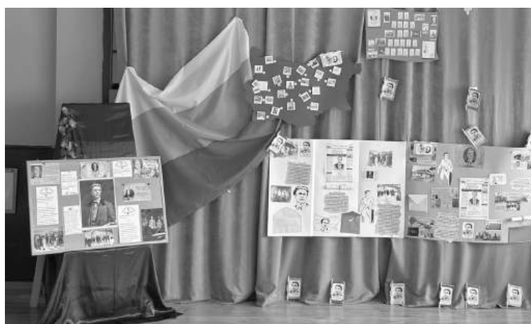
Детската изложба, посветена на Апостола

хове, посветени на Васил Левски, и по детски, не принудено, отдадоха своята почит към делото му.