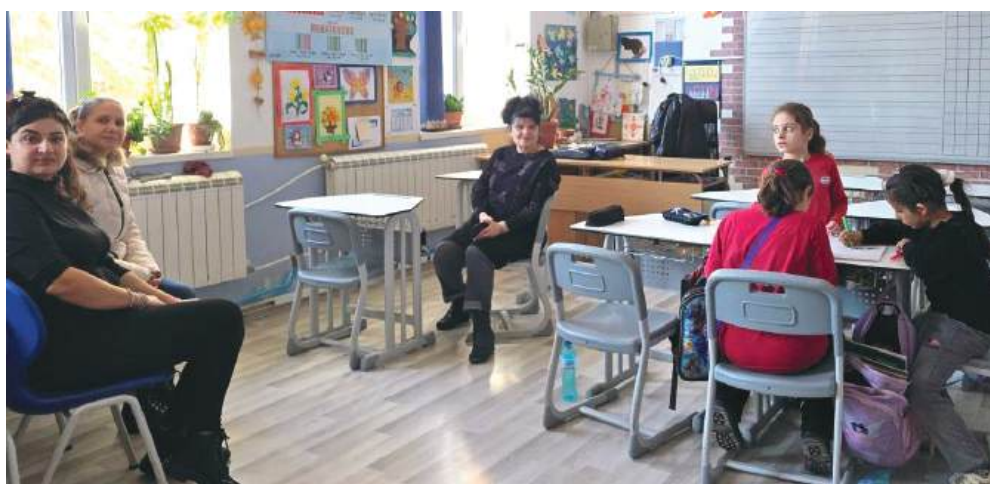
Част от децата в Клуб по интереси „Театър“

Иновативното училище с нов проект - „Заедно за по-добро бъдеще“