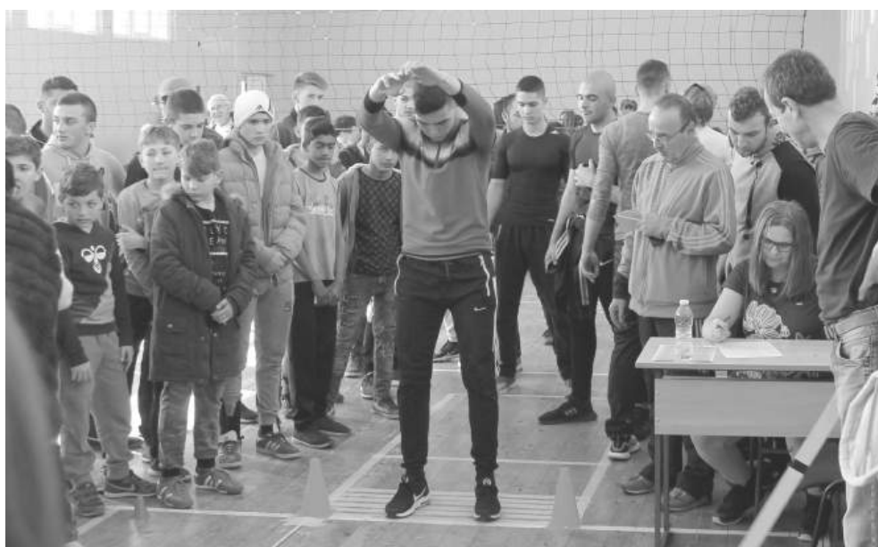
„Лъвски скок“ е с дългогодишни традиции в Айтос

„Лъвски скок 2026“ е не само спортно събитие, но и символ на смелост и воля – качества, които Апостолът на свободата завещава на поколенията“, коментират организаторите.