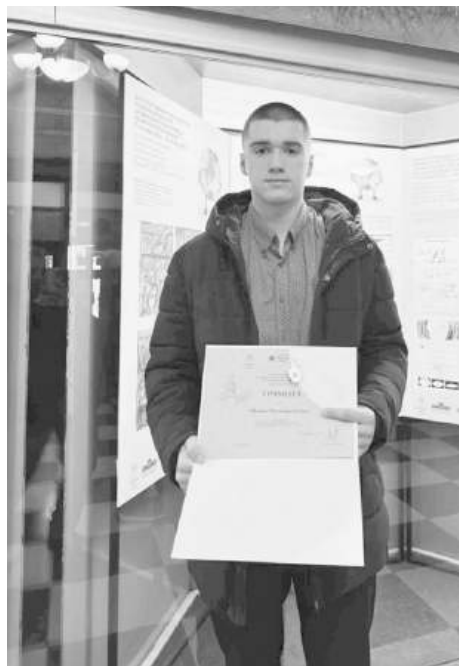
Мюмюн Керим

Конкурсът е организиран от авторитетни институции - Биологическия факултет на Софийския университет „Св. Климент Охридски“ и Националния