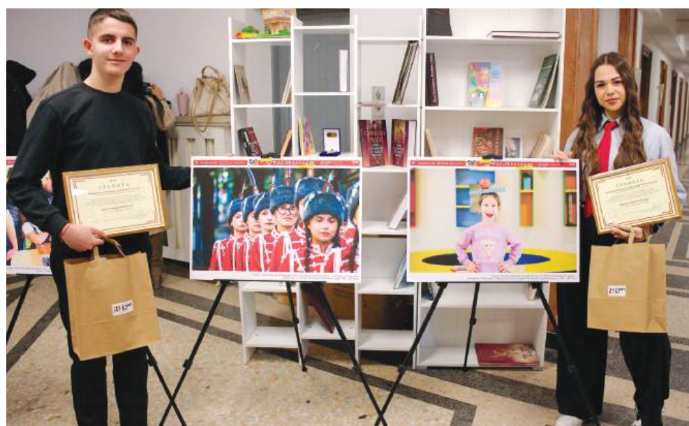
Победителите през своите фотографии.