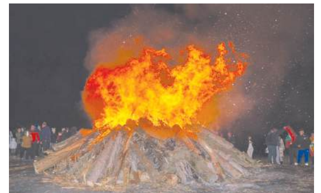
„Сирнишкият огън“ ще бъде запален на хълма над ул. „Христо Ботев“

Кулминацията на празника ще бъде запалването на „Сирнишкия огън“ или както в квартала мест-