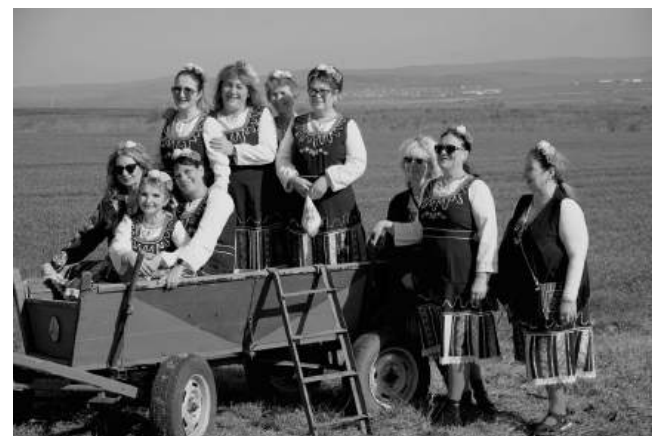
На лозята с каручка