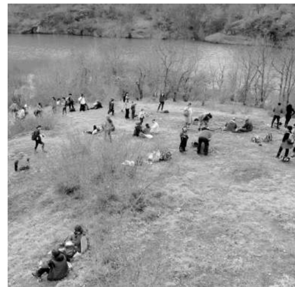
Тази неделя групата тръгва на пълна пешеходна обиколка на язовир Ново Паничарево с начало и край в село Ново Паничарево