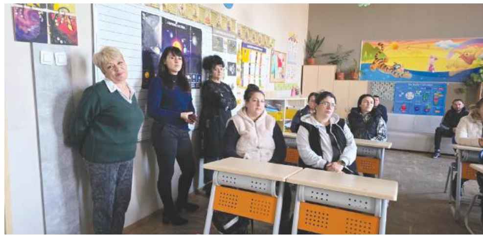
Учители и родители заедно за качествена образователна интеграция