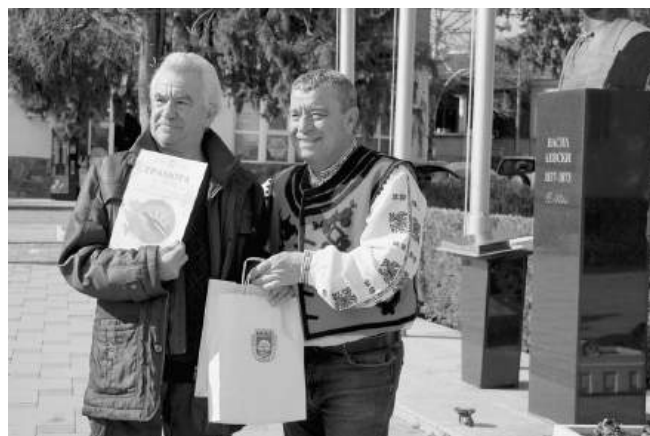
Грамоти за първенците