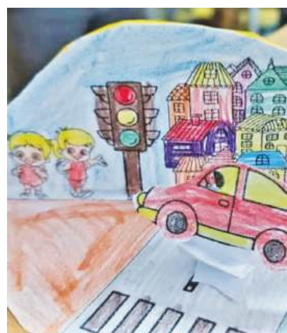
А накрая, подредиха изложба с рисуваните от тях картини

няма нищо страшно и опасно, когато познават и спазват правилата.