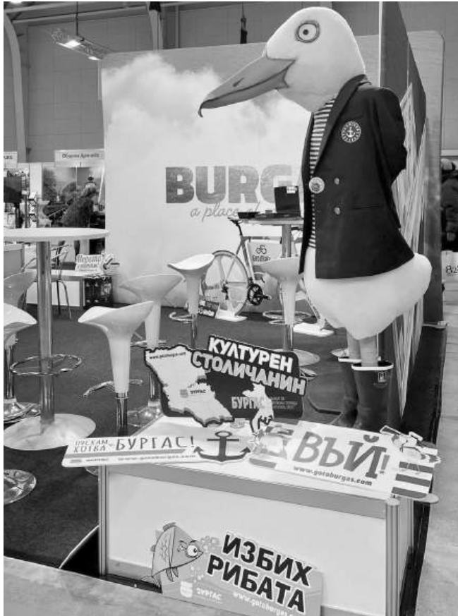
Интересни експонати имаше на щанда на Бургас в София

Нови маршрути. Директните полети до Рим отварят ниша и за италианския пазар