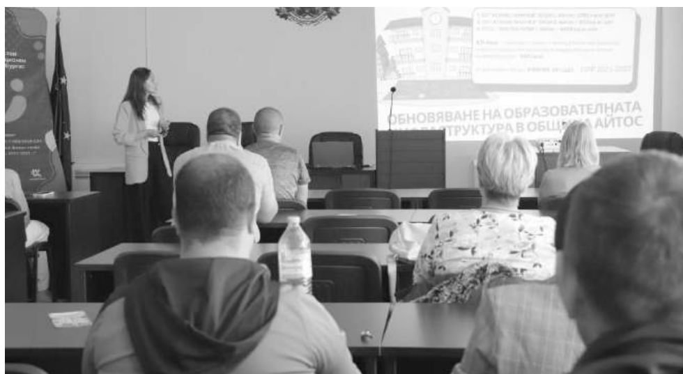
Публичната консултация в Айтос, организирана от Областен информационен център – Бургас

Участниците в дискусията подчертаха значението на междуобщинското партньорство и съвместните действия