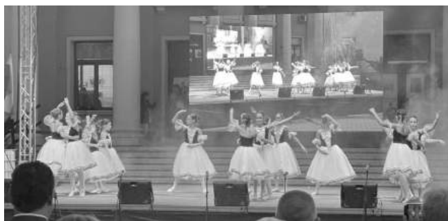
Денят на Карнобат завърши с концертна програма на гостувачи състави и местни таланти