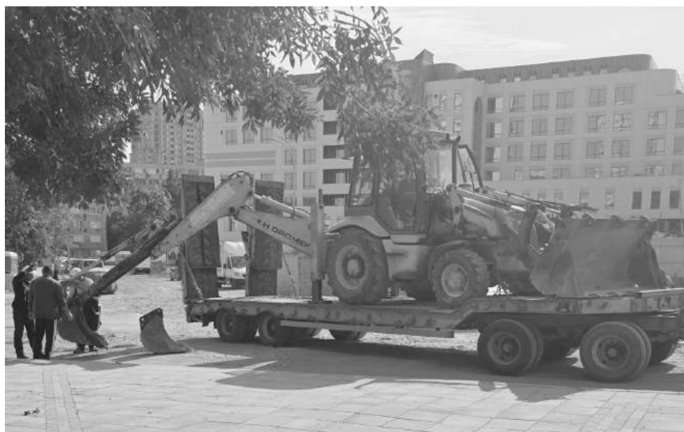
Цяла „Зорница“ в момента е почти разкопана за големи ВиК ремонти

„Отговори или няма, или казват, че ще го направят в удобно време. А междуременно кърпките