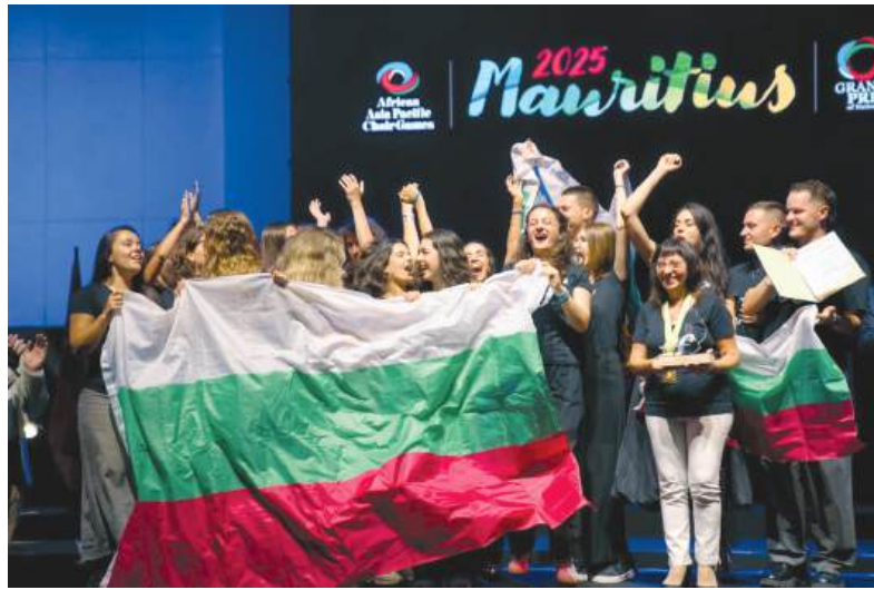
„Фортисимо“ спечели Гран При титлата в категория „Фолклор“ и златен медал в „Камерни хорове“

С бурни емоции и радостни сълзи „Фортисимо“