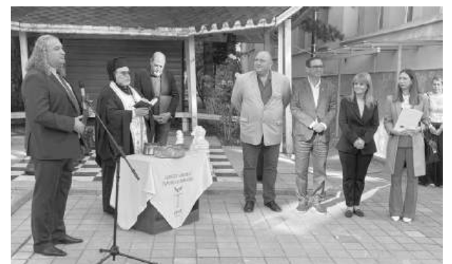
На събитието бе отслужен водосвет за здраве и просперитет

„Ако духът дава посоката, то волята е силата, която превръща амбицията в конкретно постижение“, допълни Чепов, отбелязвайки, че именно дисциплината, упоритостта и стремежът към усъвършенстване правят учениците конкурентоспособни