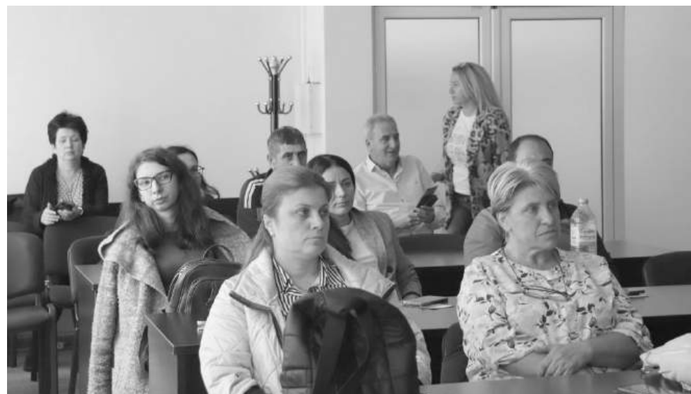
Всички заинтересовани страни имат възможност да изразят становища