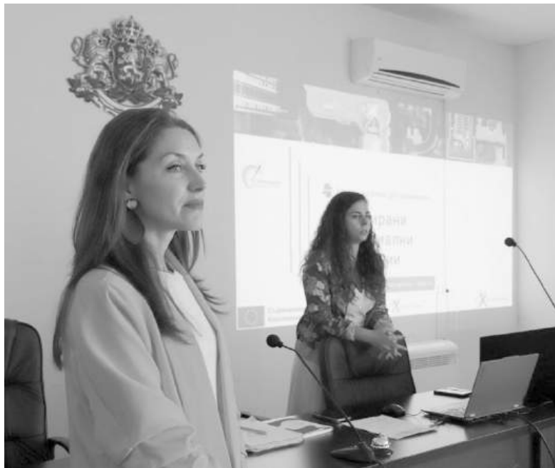
Участваха представители на местните власти, здравните услуги и образователния сектор.