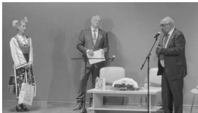
Кметът на Карнобат коментира представянето на книгата „Съсед и не само“

Празничният ден съвпадна и с откриването на X юбилейно издание на Балканския фестивал на