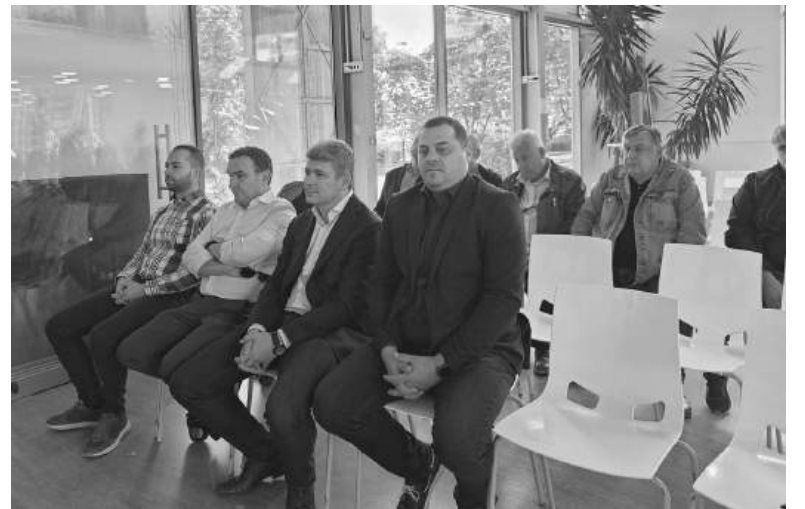
Според ръководството на холдинга след реконструкцията 50% ще бъде намалена загубата на вода