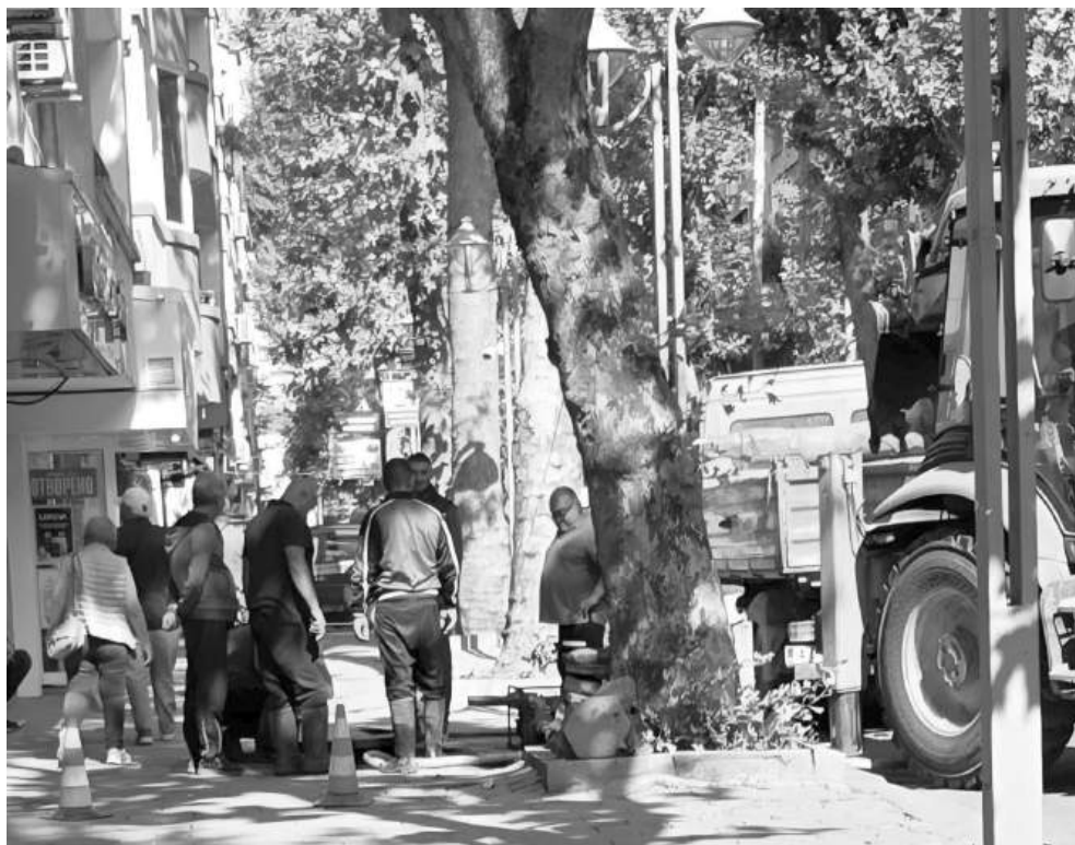
Териториалните директори не отричат, че аварията се отстраняват бързо, проблем е асфалтирането след това

Жителите на Бургас вече могат да разчитат на модерна, надеждна и устойчива водна инфраструктура, която осигурява по-добро качество на живот и опазва околната среда.