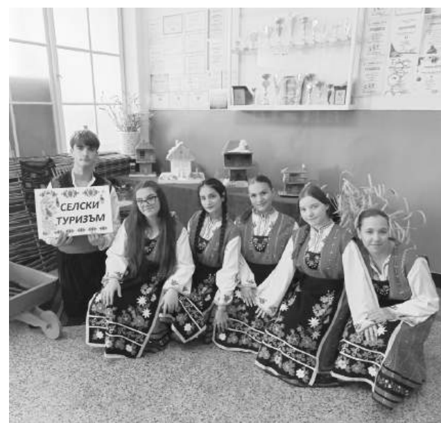
Пресъздадоха представата си за атмосфера, която да губне вниманието на туристите.

В часа по „Бум и култура“, облечени в народни носии, единадесетокласниците "Златна нива" – Айтос тази година по интересен начин отбелязват професионалния си празник – ДЕН НА ТУРИЗМА. Учениците от 11 б клас, професия :Организатор на туристическа агентска дейност", специалност "Селски туризъм" подготвиха впечатляваща изложба от макети на селски къщи с различна архитектура и към на селския бум, които да пресъздават представителите им за атмосфера, раваща се на вниманието на туристите.