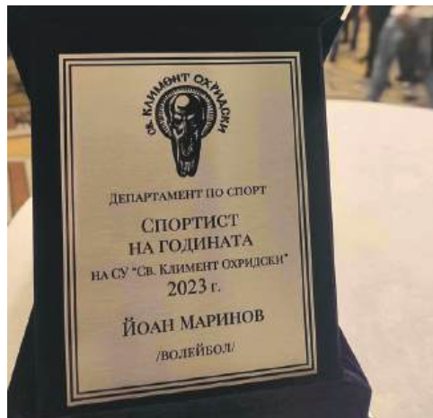
Спортист на 2023 г.