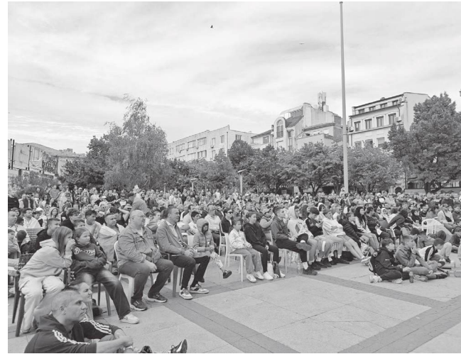
Бургаслии посрещаша с възгласи и аплодисменти всяко отиграване на нашите момчета срещу Италия