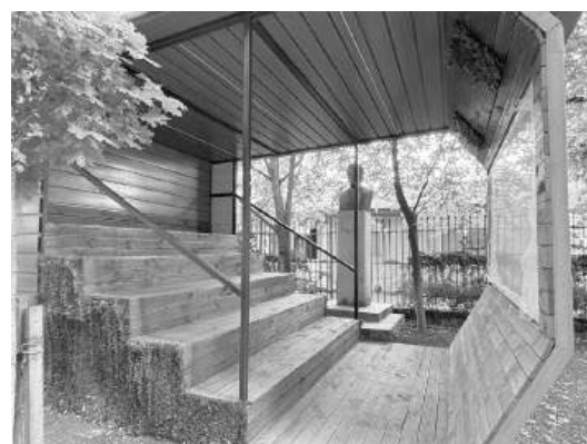
Външното лятно кино