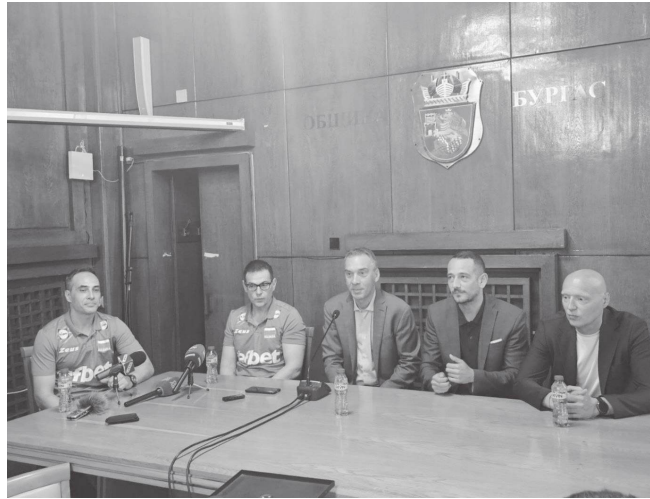
Селекционерът (вторият от ляво на дясно) не е забравил успехите на играчите си, които се представиха много силно в Бургас през лятото

Финалът бе проследен на живо от стотици бургаслии, които се събраха пред сградата на Общината. Атмосферата напомни на легендарното лято на 1994 г., когато нацио-