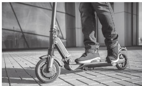
Индивидуалните електрически превозни средства ще имат конкретни зони за паркиране