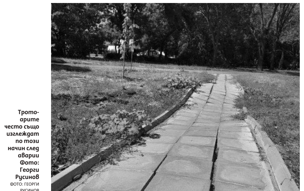
Тротоарите често също изглеждат по този начин след аварии