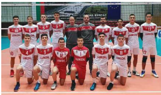
С Волейболен клуб "Нефтохимик - 2010"