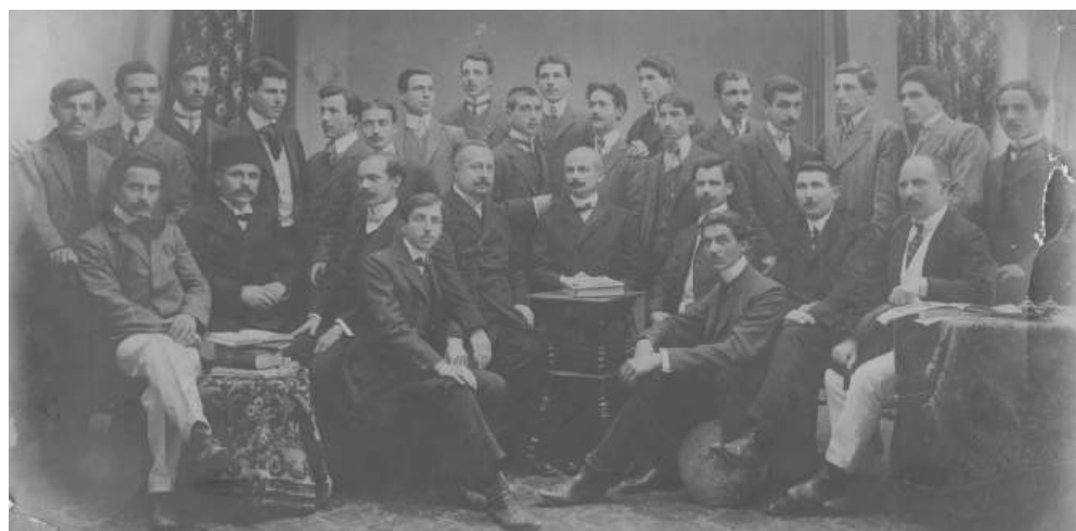
Първият випуск на Държавна търговска гимназия. 1909 г.