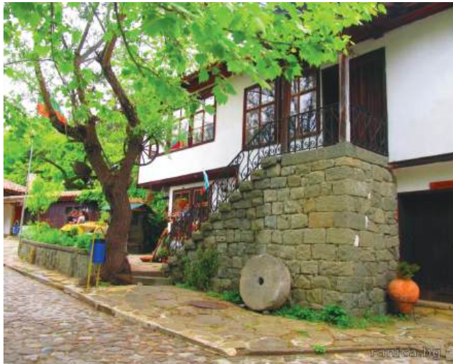
Етнографският комплекс в Айтос носи името "Генгер"

и не могат да се самовъзпроизвеждат. Така в пожарите умират декари борови гори.