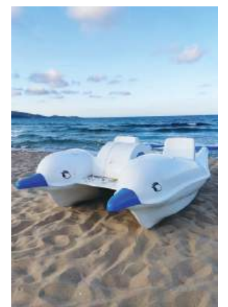
Водно колело от Северен централен плаж

Разровете се в галерията на телефона си и изберете снимка от любимия ви момент през това лято. Може да е всичко – преживявания със семейство или приятели, морски или планински пейзаж. На нас остава да организираме