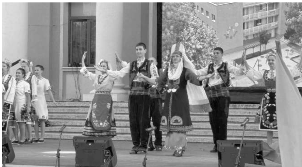
Балканският фестивал на изкуствата завладя Карнобат за десета поредна година