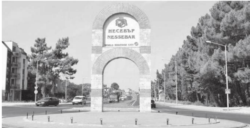
Инициативата се финансира изцяло със собствени средства на общината

Програмата насърчава собствениците на имоти да реставрират и поддържат сградите си и да развиват културни и образователни инициативи. Подкрепа ще получават както проекти за реставрация и социализация на недвижими културни ценности, така и