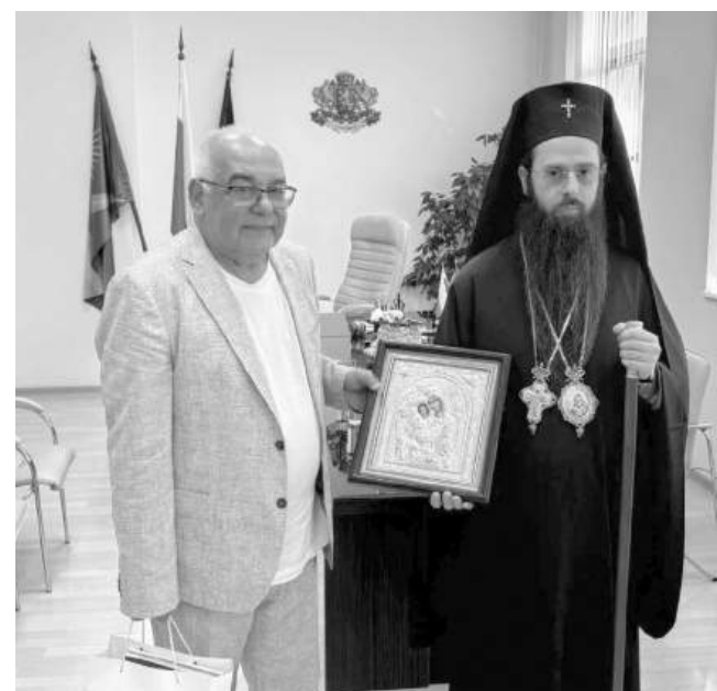
Кметът Георги Димитров със Сливенския митрополит Арсений

Осигурени бяха 300 екземпляра от книгата, като парите от продажните книги бяха дарени на карнобатското читалище.