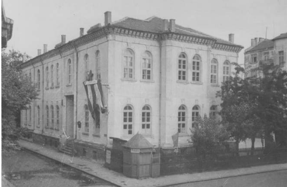
Старата сграда на гимназията. [1950г.]