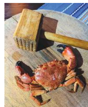
Порция рак от заведение в центъра на Приморско

Дамама ни изпрати снимка от бургаския плаж и по-конкретно – от бар, намиращ се на една крачка разстояние от брега. Каква по-добра комбинация от това да прекараш време на плажа, и то в