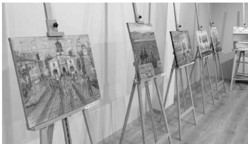
Художествена изложба с платна от традиционния Пленер-живопис