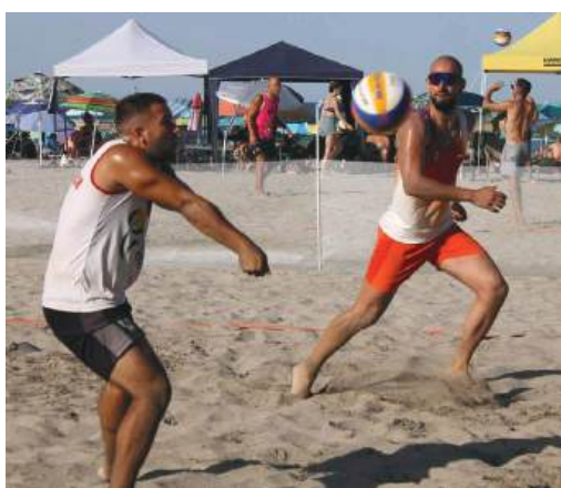
Спомен за страховотните турнири, организирани на корта по плажен волейбол в градската градина в Айтос.