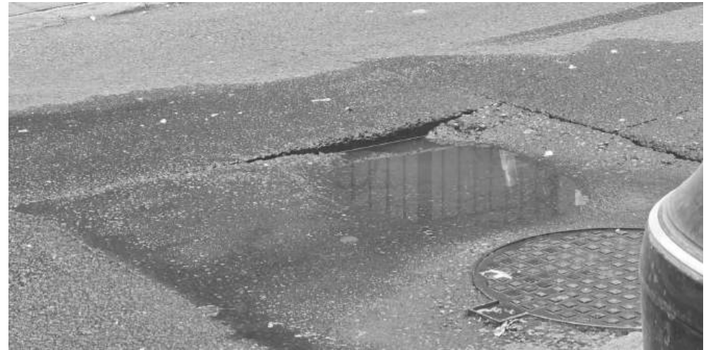
Такъв трап зее на централната улица „Мара Гигук“

Проблеми се отчитат и по ключови участъци като кръстовището на ул. „Александър Стамболийски“ и „Дебелт“, както и на самата „Дебелт“ при №27 и при кръстовището с ул. „Христо Фотев“. Не липсват сигнали и за централните пешеходни