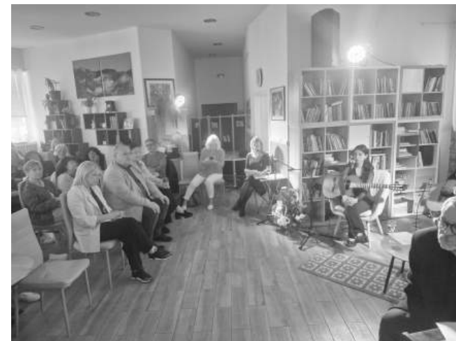
От 1 октомври стартираха Есенните литературни празници именно в Дома на писателя

ми, които бяха изказани и в зала, решението не бе взето. Така бъдещето на Дома на писателя остава неясно – на кръстопът между историческите претенции на „Самосъзнание“ и културната мисия на бургаските писатели, които за десет години превърнаха малката къща на ул. „Вола“ в едно от най-значимите духовни