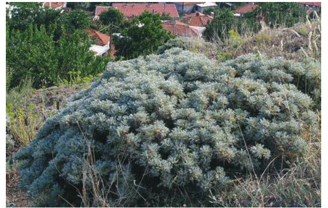
Айтоският клин ( A. aitosensis ), наричан в разговорния език генгер (гингер) дълго време е стоял в папките неопределен като вид.

възбудило интересът на фармацевтиката към храстчето А заради високата температура,