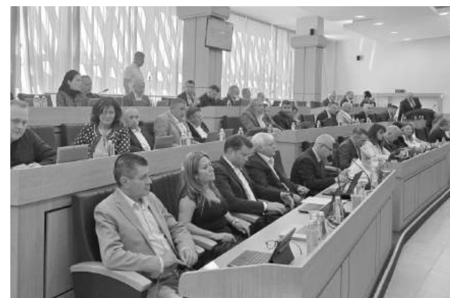
Общински съвет – Бургас одобри новата цена, макар и не с пълно мнозинство, от опозицията бяха против

Успоредно с тарифните промени „Бургасбус“ планира и нови инвестиции. Дружеството поиска съгласието на Общинския съвет за поемане на банков кредит до 5 млн. лв., за да осигури собствено участие по проект за доставка на електробуси и го получи. Два от тях – съчленени 18-метрови, ще заменят дизеловите машини по линия Б1, която ще се превърне в първата изцяло „зелена“ линия в Бургас с нулеви емисии. Допълнително ще бъдат закупени още пет по-малки електробуса.