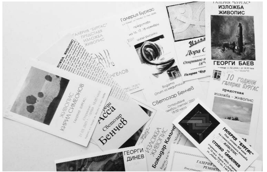
Галерия Бургас-покани