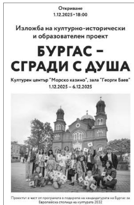
Проектът е част от програмата в подкрепа на кандидатурата на Бургас за Европейска столица на културата 2032

Проектът е част от програмата в подкрепа на кандидатурата на Бургас за Европейска столица на културата 2032.