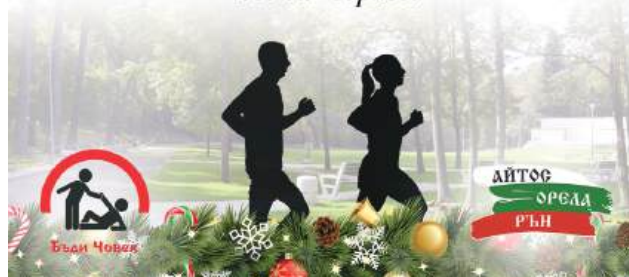
Организаторите очакват това да е най-масовата спортна проява в Айтос през 2025 г.

Подари празнична вечеря на възрастни, а на себе си - здраве!