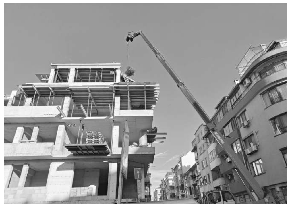
На мястото на някогашните еднофамилни къщи изникнаха до пет и седем етажни сгради

На този фон Бургас затвърждава позицията