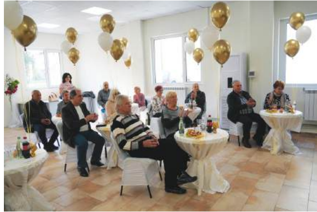
Осемте двойки слушат церемонията. Всичко бе като за сватба и то златна- кетеринг, украса и настроение

Инициативата се провежда за втора поредна година и е лична идея на кмета, чиято цел е да вдъхнови младите хора и да подчертае значението на семейството, християнските ценности и брака като основа на българското общество.