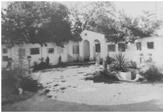
Галерия КА- дворот

Но идва промяната, появяват се хора инициативни и с желание да направят нещо различно за своя град. Те отворят нов тип галерии, финансирани и поддържани с лични средства.