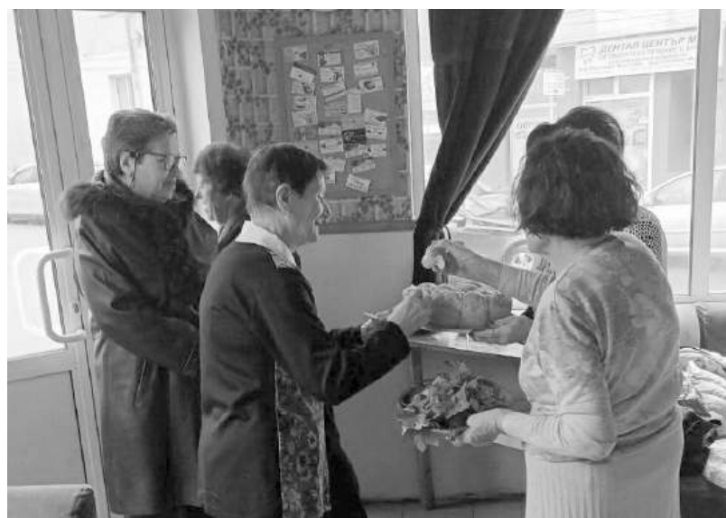
Много спомени и носталгия по отминалите години

Имаше много разкази, вълнуващи спомени за интересни и необичайни преживявания, весели случки и малко носталгия по онези години на съвместна работа в детската градина. Спомените преляха в песни, изпънени със затрогваща емоция. Последната от тях „Старото приятелство“ завърши с горещи пожелания за още и още такива срещи, независимо от повода - ей така, заради старото приятелство.