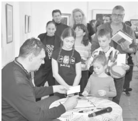
Отборът на СУ „Иван Вазов“ чака за автограф