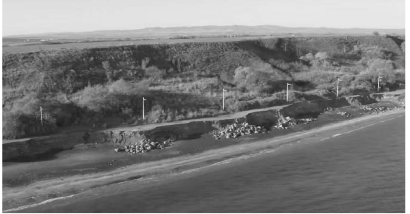
Възстановяването започва след 5 години чакане

Една година е изпълнението на първия етап от проекта.