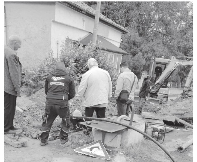
Общинари, доброволци и работници на „Хадистрой“ ЕООД заедно за подмяна на стария водопровод

тази чешма е задоволявала потребностите от вода на стотици домакинства.