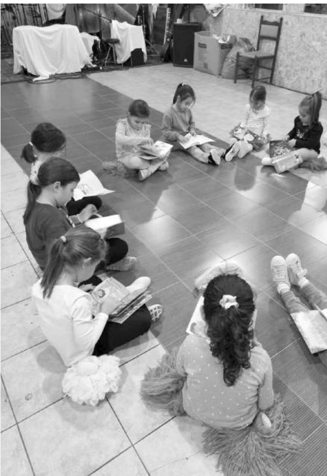
Малките читалищни танцьори

Благодарим на всички деца, учители и класове, които се включиха с четене в Седмицата на четенето, и се увериха, че четенето е забавно, важно и нужно.