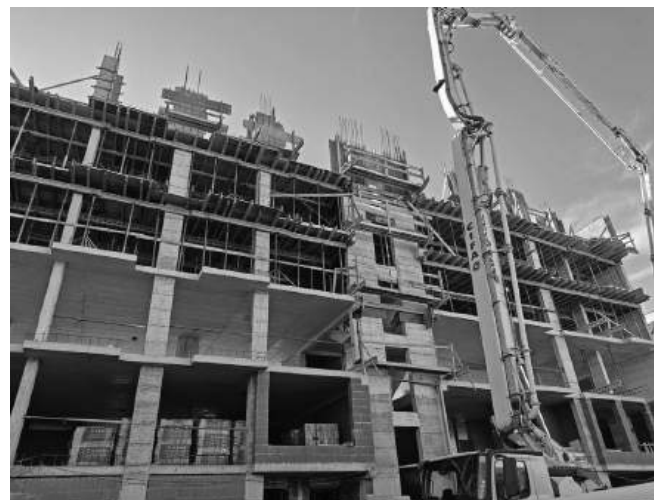
Огромни кооперации променяха облика на Централна градска част