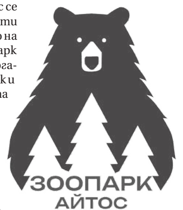
Логото на Зоопарк-Айтос

Първото място журито присъди на Айлин Мехмед, ученичка от СУ "Христо Ботев" - Айтос, която впечатли с оригинален и естетически издържан дизайн. Официалното награждаване се състоя в СУ „Христо Ботев“, отличието беше връчено от ръководителя