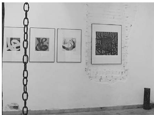
Луна от корени- изложбена зала 1998 г.