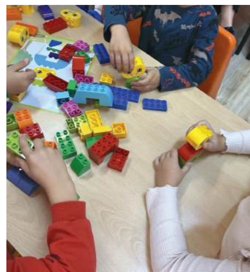
„Строим емоции – тъжни и щастливи“

вето, избор на храни и значението на добрата хигиена. Практическата част на занятието прогължи във вид на интерактивна игра. Децата подбиха изображения на различни храни и ги подреждаха върху два големи модела на зъбки. Вместо механично изпълнение, се получи смислен разговор – кое би помогнало на Мими