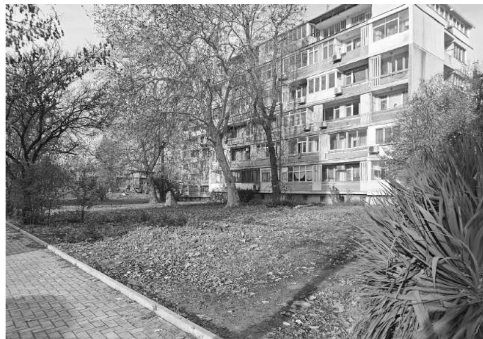
Теренът в края на „Фердинандова“, който остава зелена площ