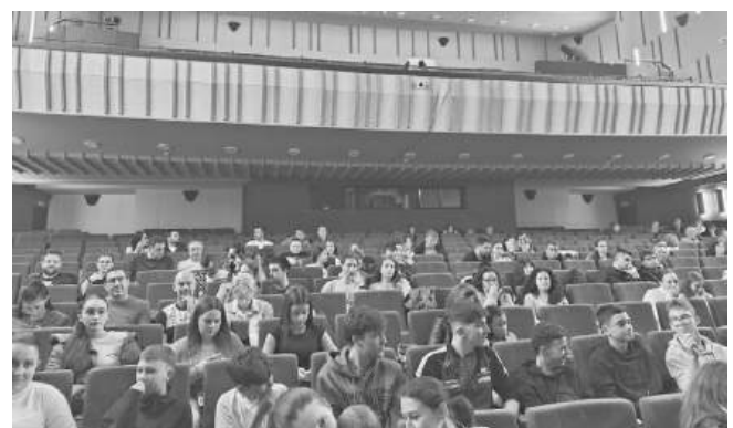
Една човечна, искрена и мотивираща за публиката среща бе представянето на книгата

„На европейското щени бъде много сложно, защото в нашия поток са Франция и Полша - два от най-силните отбори в света. Въпреки това смятам, че трябва да се борим за финална шестима на Лигата на нациите и финална четворка на Европа.“