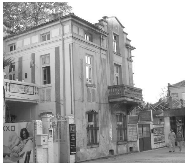
Галерия Бояджиев на ул. Богоридги