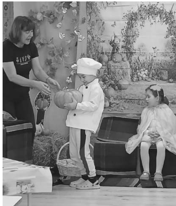
Деца от ДГ „Делфинче“ в Черноморец разбраха повече за тиквите чрез игри и сензорни предизвикателства

Малките изследователи научиха как расте тиквата и какви грижи са необходими, за да бъде