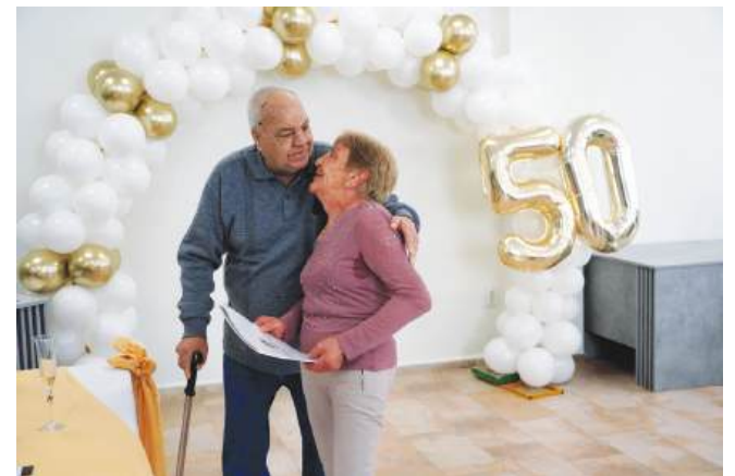
И след 50 години отново „Горчиво“