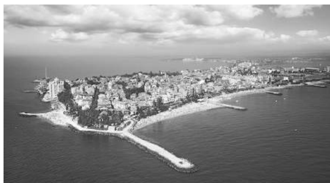
Последната стъпка преди окончателното приемане на ОУП е Националният експертен съвет към МРРБ

Проектът за нов ОУП идва след почти 20-годишна пауза, през която предходният план, изготвен през 2006 – 2007 година, така и не беше приет заради няколко отрицателни екологични оценки.