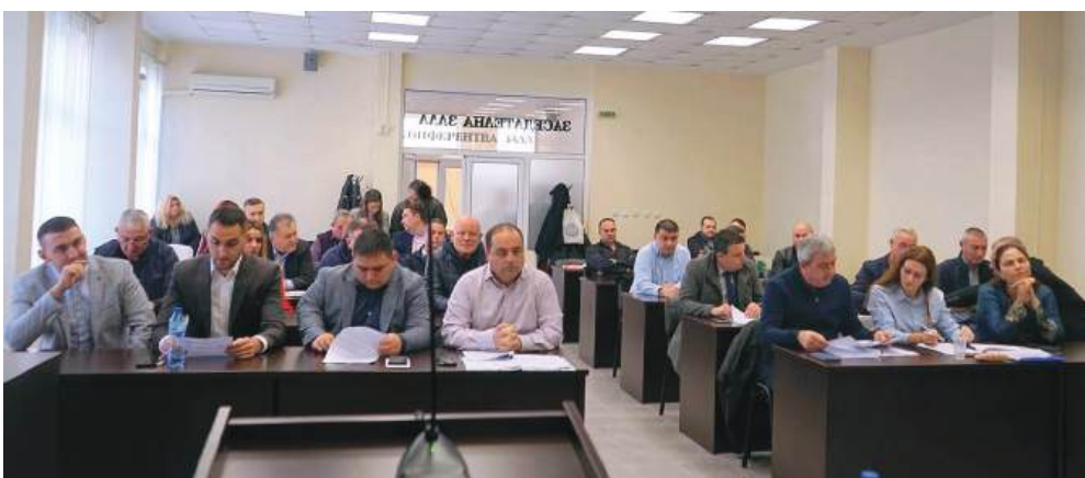
Съветниците единодушни – необходима е местна подкрепа за децата с таланти

Общинската администрация подготвя предложение по процедурата, която цели насърчаване на деца и ученици да демонстрират талантите си, за