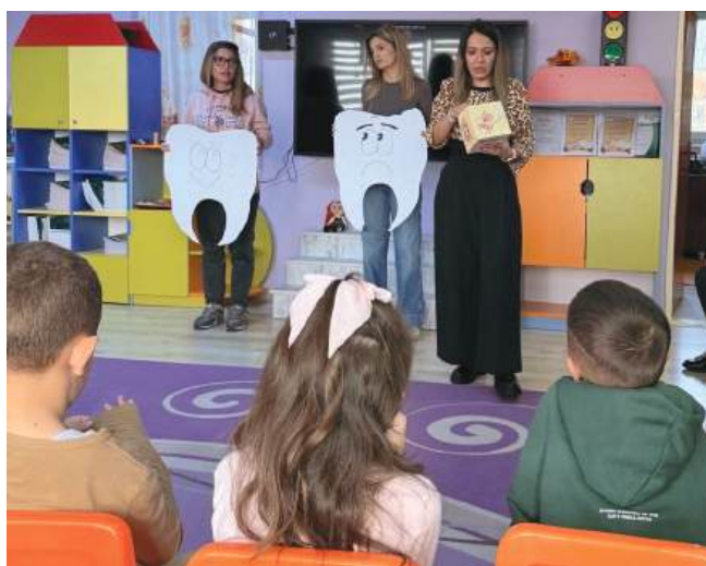
Педагозите успяха да изградят среда, в която всяко дете се почувства значимо