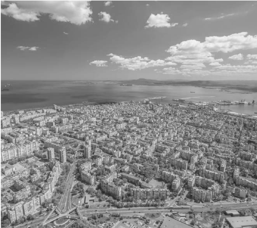
Бургас се разширява към комплексите и кварталите

Тенденция. Българи изкупуват апартаменти на руснаци, после ги продават