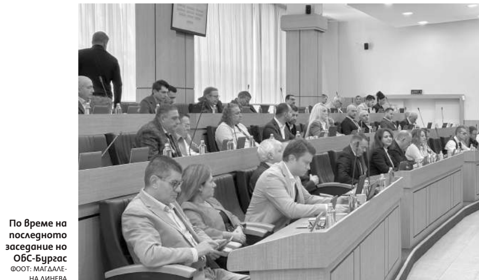
По време на последното заседание на ОБС-Бургас

Комисията, която ще проведе конкурса, ще бъде в състав: юрист, магистър по медицина, представител на РЗИ – Бургас, представител на БАС – Регионална колегия Бургас, експерт от педиатрично лечебно