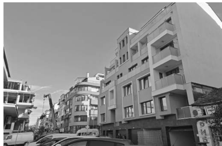
Българите традиционно искат да имат собствен дом