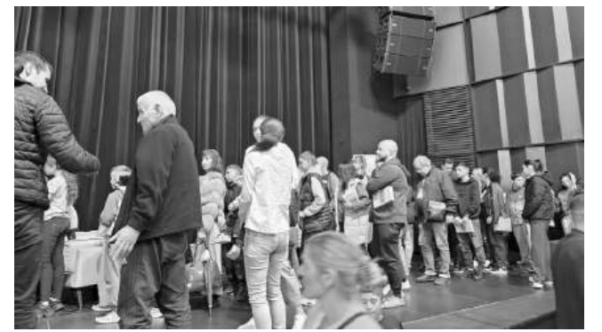
Опашка за автограф и снимка от фенове

Това е късмет. Но за да не си мислите, че само с късмет се стига дотам