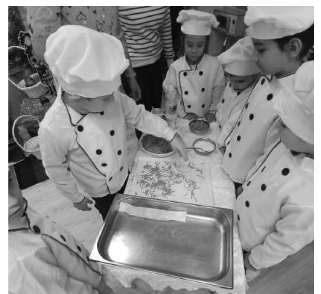
Малчуганите приготвиха и сладък тиквеник, който по-късно с удоволствие опитаха

отгледана. С голям ентузиазъм те сами засадиха тиквени семена, за да наблюдават развитието им през следващите месеци.