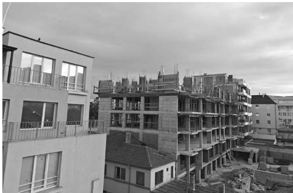
Най-гъсто населеният комплекс Възраждане – строителството продължава с бясна сила