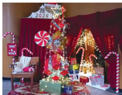
Пощенската кутия е във фоайето на Читалището.

Още по-важно е навреме да пуснеш своето писмо във вълшебната пощенска кутия на НЧ „Васил Левски 1869“ - Айтос до 15-ти декември 2025 г. Ако си го направил – очаквай отговора!