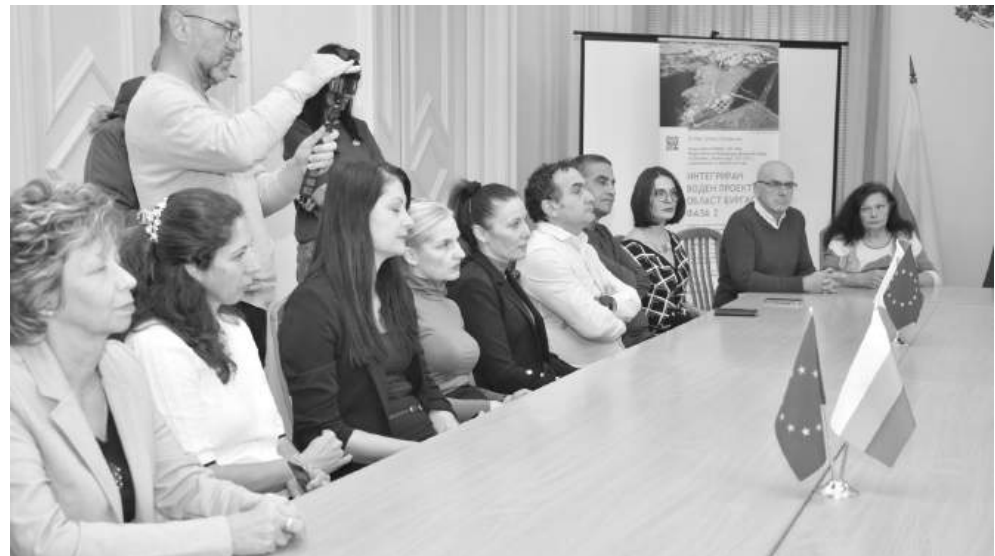
Присъстваха и представители на общините