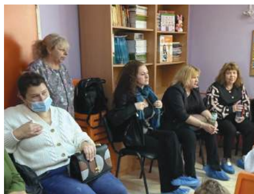
Ръководството на РЦПППО – Бургас, педагози и гости на откритата практика