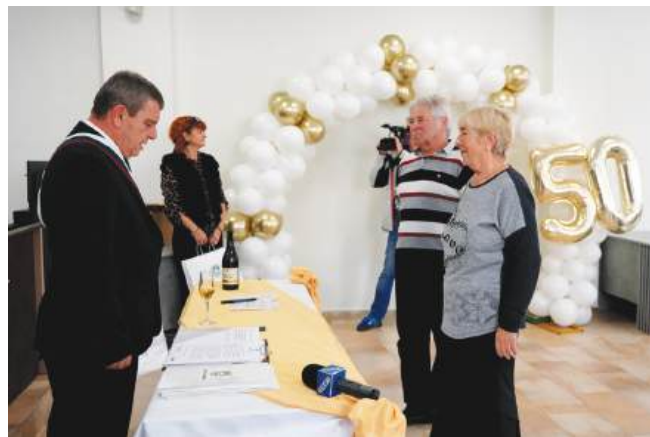
Отново пред дължностно лице