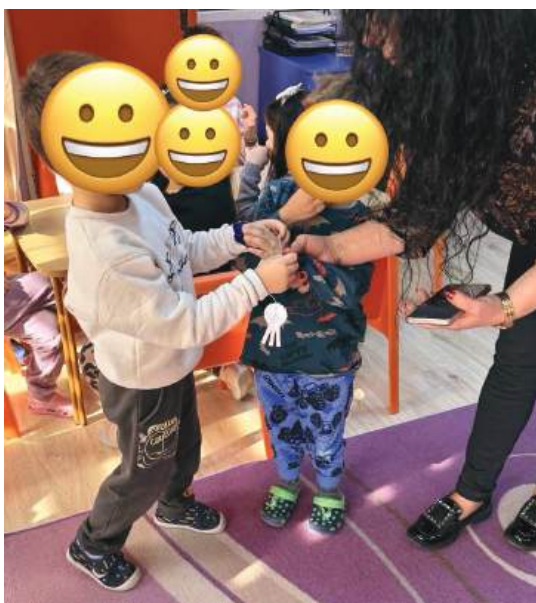
Спецификите при работа с всяко дете.

Това открито занятие показа, че когато учителите, ресурсните специалисти и институциите работят заедно, резултатите са видими и устойчиви. Децата учат по-лесно, чувстват се уверени, спокойни и подкрепени. Най-важното – растат и се развиват заедно, в среда, която ги приема такива, каквито са, проявявайки толерантност и взаимопомощ. За нас възрастенето това занятие бе много добър модел, който представи реалния смисъл на приобщаването – заедно, подкрепени, равни и обичани.