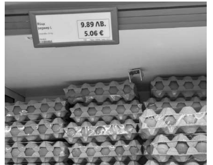
Опаковка от 20 броя яйца може да бъде закупена срещу 9.89 лева

За сравнение дава примери с промяната на цените на различни видове продукти. По неговите думи, пиперът от 2.50 лева е станал 3.50. Свинското месо, което той си купува, също бележи скок в