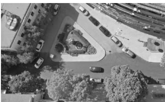
Айтос, ул. „Станционна“

ОСВОБОДЕТЕ СЕ ОТ НЕНУЖНОТО ОБОРУДВАНЕ СЪС ЗАЯВКА НА БЕЗПЛАТЕН ТЕЛ. 0 800 14 100