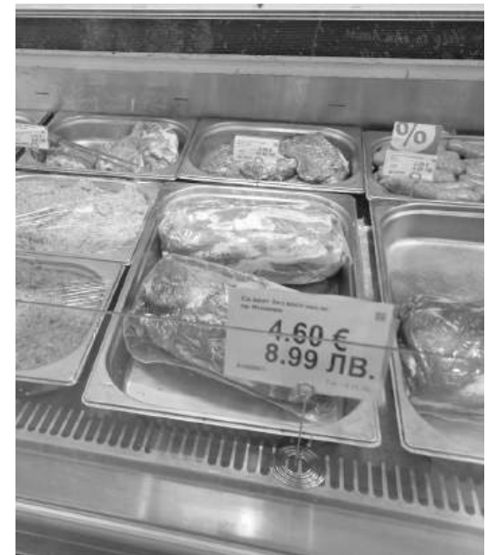
Свинският врат без кост вече достига 8.99 лв. за килограм

обикновена закуска с яйца, хляб и кисело мляко трудно може да излезе под десет лева.