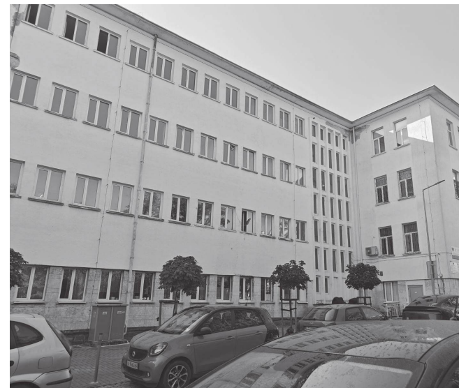
Вчера децата бяха освободени от занятия след евакуация