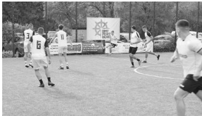
110 бяха участниците в тазгодишното издание

Като основен спонсор и двигател на инициативата, БМФ Порт Бургас АД за пореден път организира турнира, следвайки своята дългосрочна стратегия за подкрепа на младите хора в региона. Кампанията ясно показва, че върва в силата на спорта като средство за изграждане на здравословни навики, дисциплина, чувство за общност и отговорност.