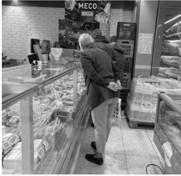
Хора споделят, че при месата също отчитат повишаване на цените

Цените на някои плодове и зеленчуци също