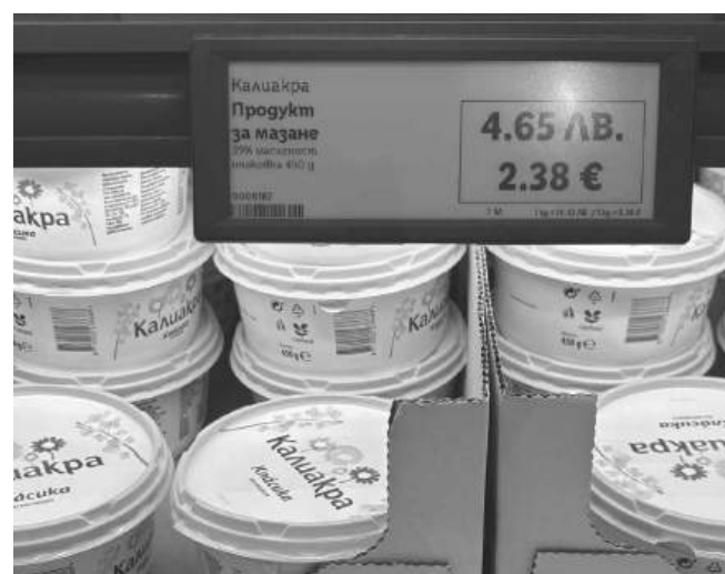
Опаковка от 450 грама масло струва 4.65 лева

е 2 лв., а пълнозърнестите варират от 1.70 до 4 лв. за брой. Маслините, които преди са стрували