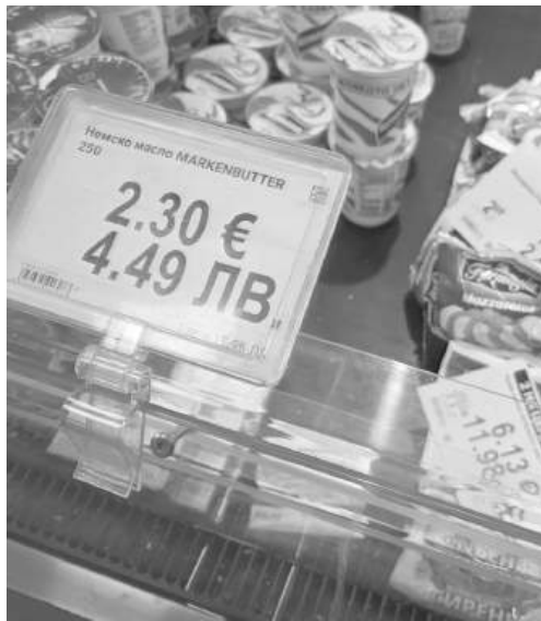
Почти 5 лева гони цената на маслото

Тенденцията е ясна – промоциите са все по-кратки, продуктите все по-скъпи, а двойните етикети подсказват не само предстояща промяна на валутата, но и нова ценова реалност. В нея стабилно остава само едно – посоката на цените, която продължава да сочи нагоре.