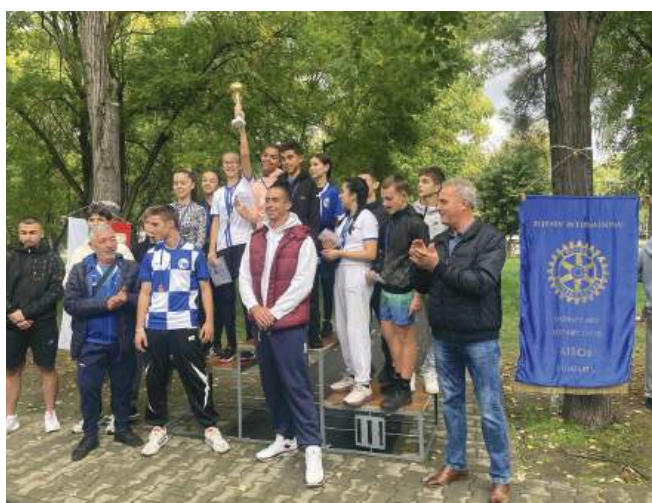
Отборът на СУ „Никола Й. Вапцаров“ с почетната Купа „Айтос“

Тази година организаторите Община Айтос, Ротари – Айтос и Младежки център – Айтос, решиха да придат нова, по-атрактивна форма и състезателен характер на традиционния крос. Идеята за щафета в Градската градина, с трасе от 1 км, и с четири поста по 250 м, беше приета едновременно и с желание от всички училища в града и от основно-