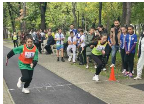
На старта