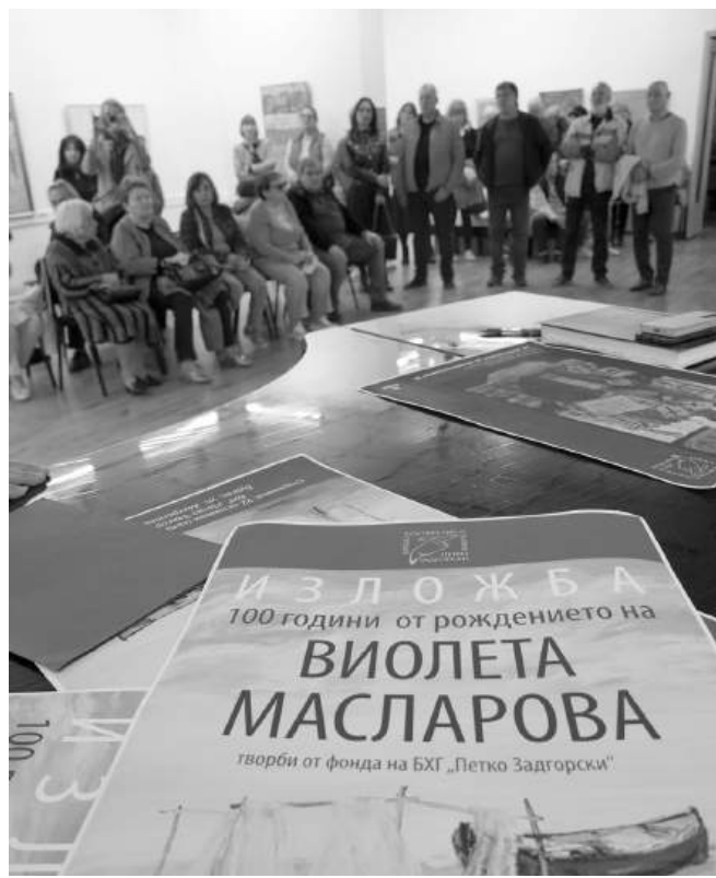
Изложбата може да бъде видяна в БХГ „Петко Задгорски“

„Виолета беше изключително фин човек и такава е, и в творчеството си. Получи се великолепна изложба с нейни картини и от всяка една от тях блика светлина. И морето и хората, те просто са озарени, вътрешно са озарени от тази светлина. Забелязва се тази специфична женска мекота и елегантност, но и в същото време много овладяна емоция“, каза директорът на галерията Георги Динев