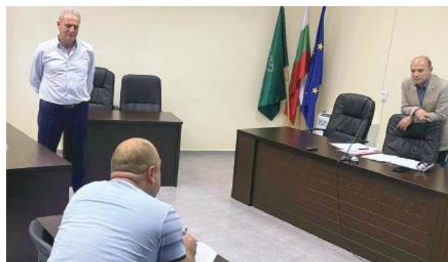
Граждани разискваха конкретни казуси с кмета и зам.кмета

Режимът на паркиране да е валиден всеки ден от 09:00 часа до 17:00 часа, с изключение на събота и неделя и официалните почивни дни. Оперативната дейност по въвеждането и прилагането на режима да се организира и осъществява от дейност „Обслужване и контрол на платено и безплатно паркиране“ към Община Айтос, Общинска администрация. Превозните средства със