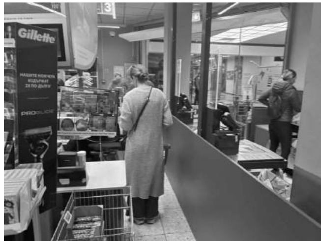
Пенсионери споделят, че все по-често търсят да купят стоки на промоция

Сред зеленчуците също има сериозно повишение – глава лук, която преди е струвала около 50-60 стотинки, вече се продава за 2 лв. Килограм гъби е поскъпнал от 5 лв. на 8-9 лв., чесънът е скочил от