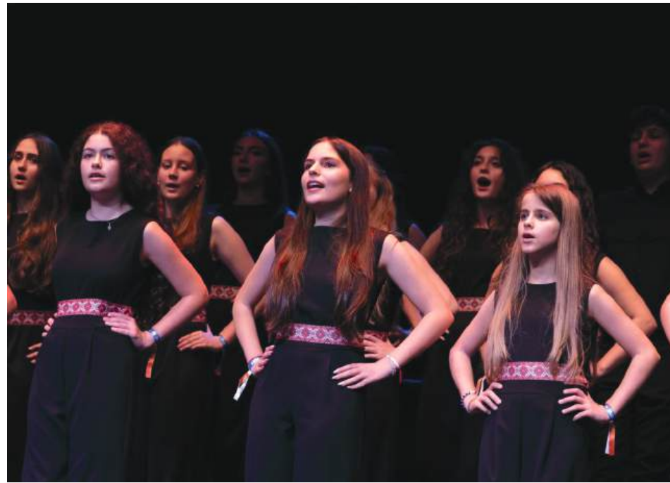
Чористите на формацията по време на участието си в Испания