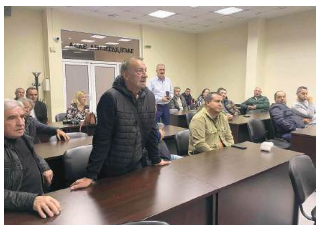
Много въпроси – все пак „синя“ зона в Айтос ще има за първи път.