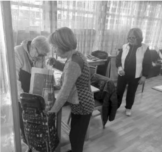
Не само време и грижа, доброволците даряват на нуждаещите се внимание и усмивки...

Раздаването на пакетите продължава до 22 ноември, в пункта на ул. „Паркова“ 52