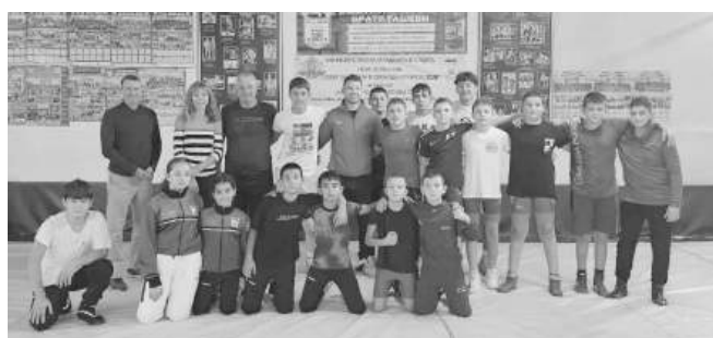
СКБ "Айтос" е сред спортните клубове в Айтос с най-много спечелени проекти през годините

"Голямата цел е заниманията беше да мотивират децата за системно спортуване. В същото време, под-