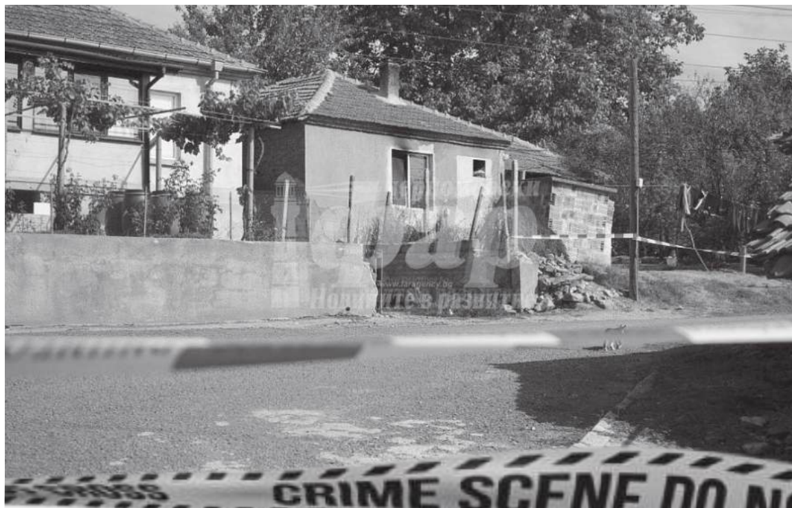
Къщата, в която се разиграл ужаса

Ужас. Фахри Мустафа екзекутира майка си, леля си и сестричката си, след което подпали къщата