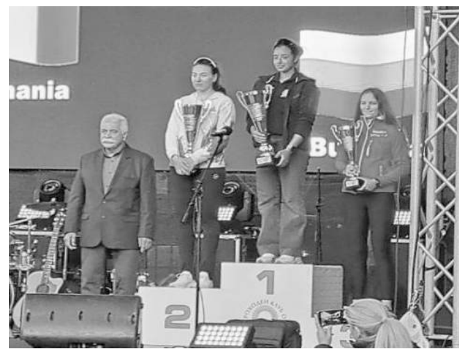
Гордост за Бургас – балкански шампион по ветроходство

Балканиадага се проведе с участието на 125