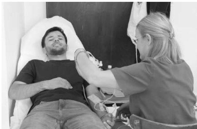
Самуил дарява и усмивка

Кръводарителите участваха във видео за популяризиране на кръводаряването. По тяхна идея, през следващата година ще се организира още по-мощна акция с участието на повече техни съученици. Призивът им