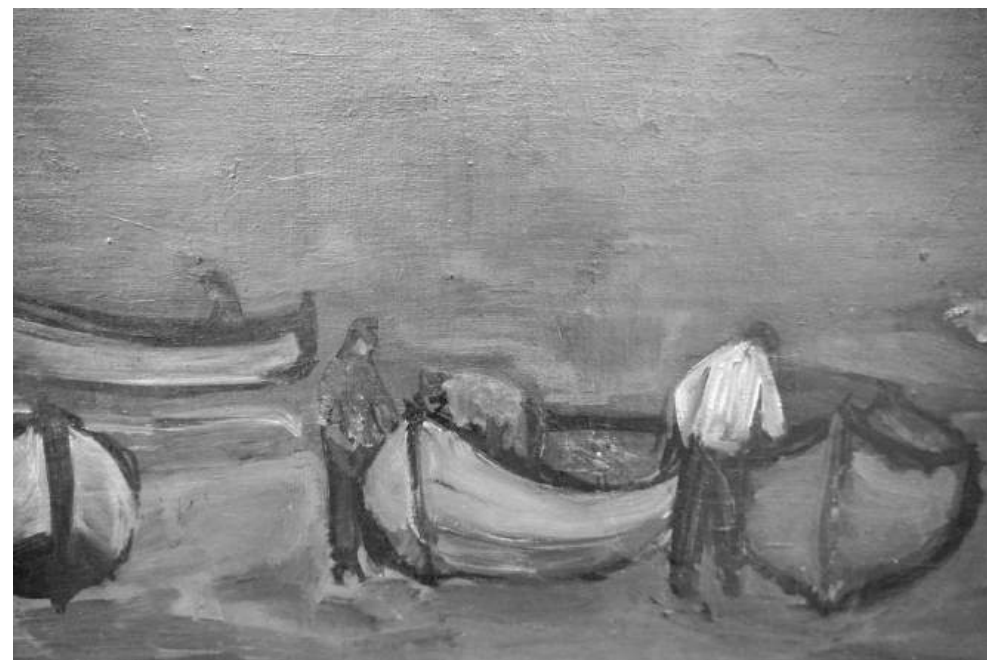
Една от прекрасните картини, които с основание ѝ дават титлата – „маринист на страната“

В изложбата има три такива цветни сюжета, няколко портрета, пейзажи и фигурални композиции. Сред платната е и картината спечелила първа награда за живопис на националното биенале „Приятелите на морето“ през 2004 г.