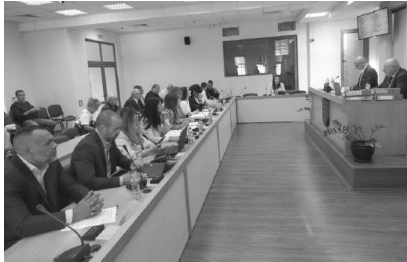
Общинските съветници единодушно приехо новите правила, които уреждат безопасното управление на тротинетки в населените места в община Созопол.

Загържаното индивидуално електрическо превозно средство се връща на законния му собственик или оператор, след представяне на доказателство за платена глоба или имуществена санкция.