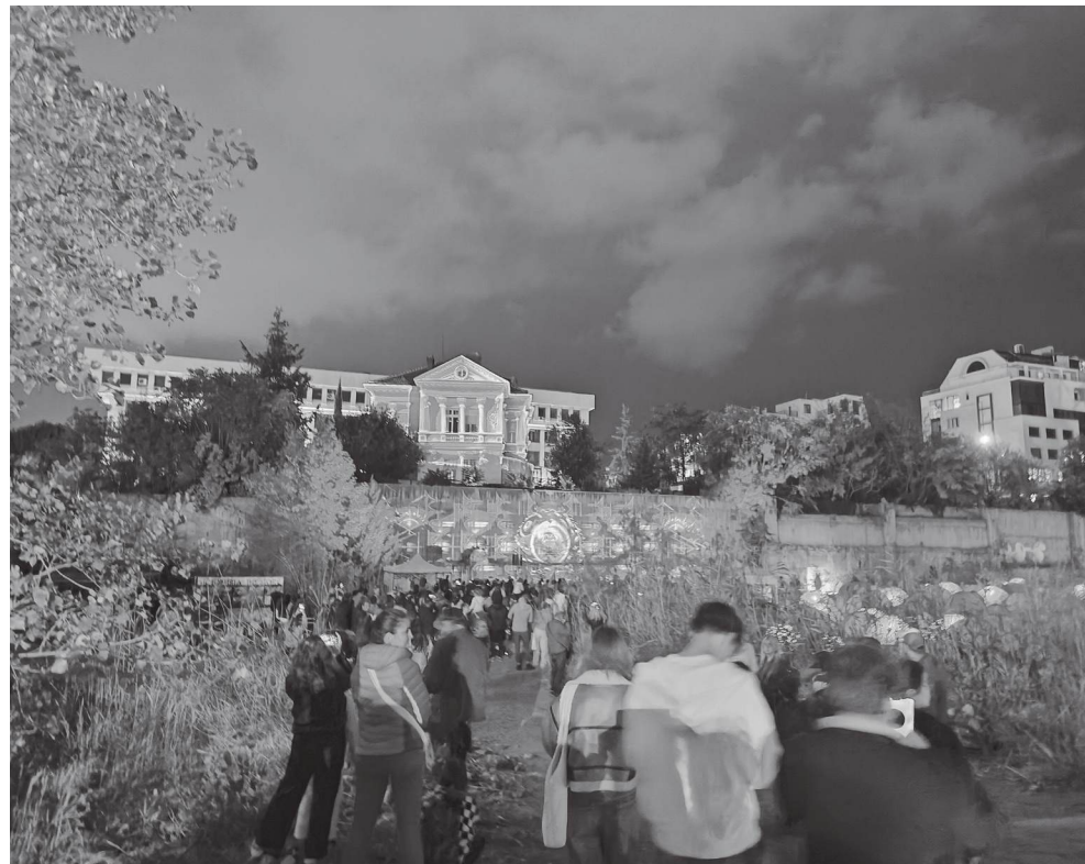
Бургазлии и гости на града се стекоха да видят арт инсталациите в „Дупката“

те на прочутия герой Шерлок Холмс и да размишляваме, дори и без шлифер.