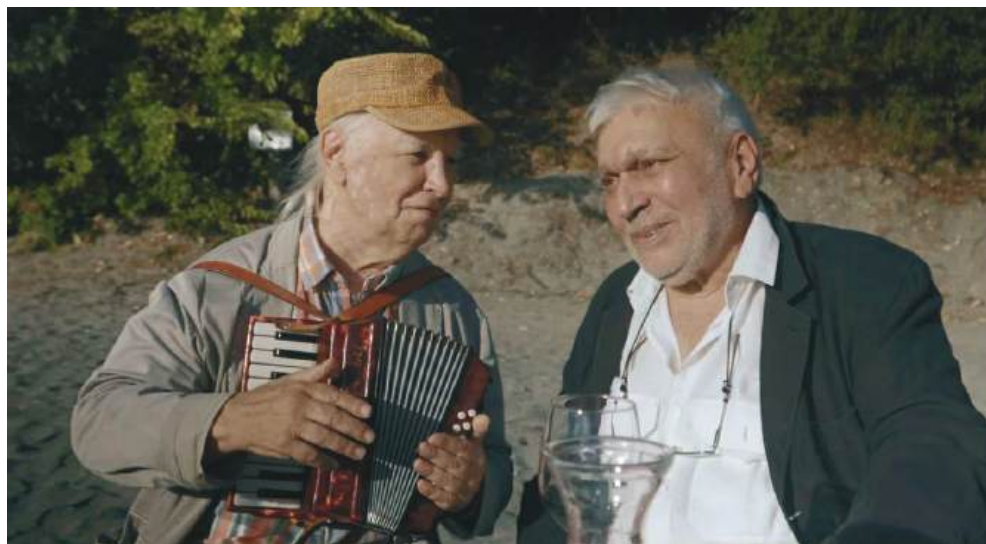
Момент от видеоклипа

По време на снимките на видеоклипа, които са се провели край морето в къмпинг, се виждат красиви кадри с море, скали, пясък и приятели, създаващи атмосферата