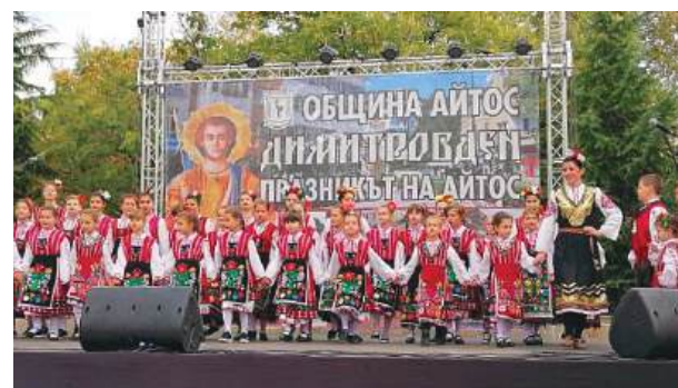
Най-айтоският празник – Димитровден