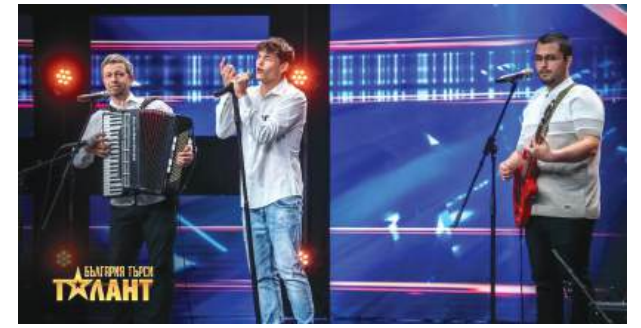
Бургаската група „Alive band“