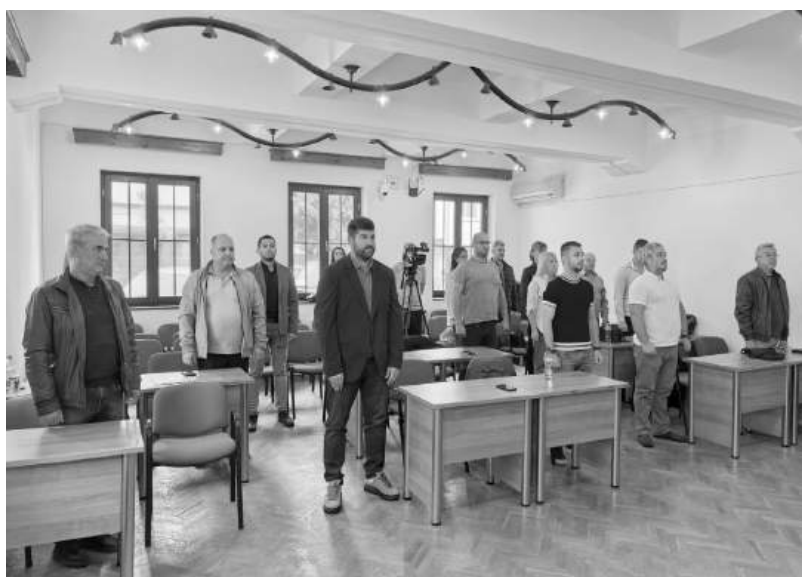
По време на последното заседание на общинския съвет в Царево

Тази година в класацията фигурират 91 български учени. Фактът, че един от тях е част от академичния колектив на Бургаския държавен университет, говори за високото ниво на научната дейност, развивана във висшето училище.