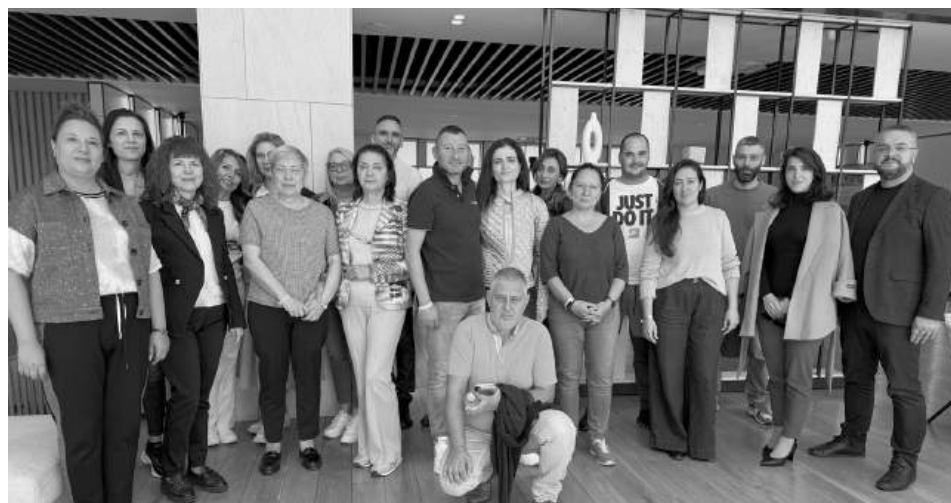
Фармацевтите подкрепиха личните лекари и настояват за реформа в оценката на здравната грижа

Таксата „рецепта“ и процентните надценки върху лекарствените продукти не са актуализирани повече от десетилетие, а аптеките продължават да функционират в условия на тежка регулация, растящи разходи и липса на кадри.