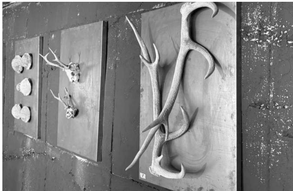
Фестивалът „Вода“ продължи три дни и остави траен отпечатък

Каквато и да е истината зад стълбището на „Дупката“, едно е сигурно - възможността да се докоснем до него чрез международния фестивал „Вода“ ни позволи да влезем в обувките