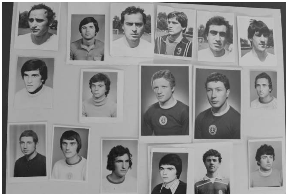
Десетки си припомниха най-изкусните майстори на пряк-свободните удари на „акулите“