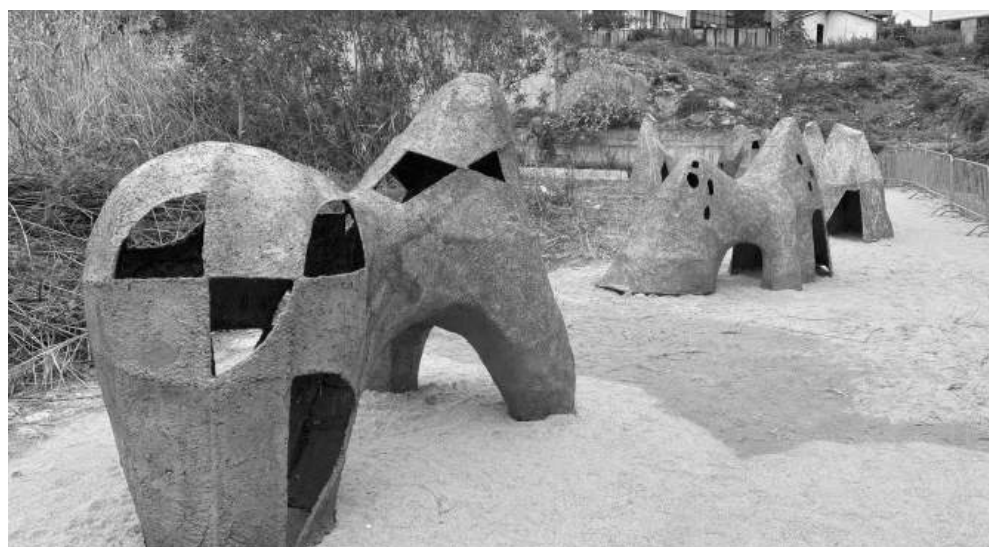
Всяка атракция носеше своя собствен чар