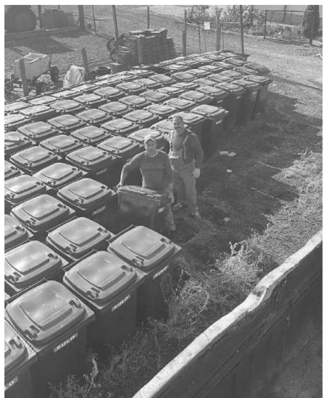
В село Мъглен раздадоха на домакинствата 240-литрови кофи за отпадъци.