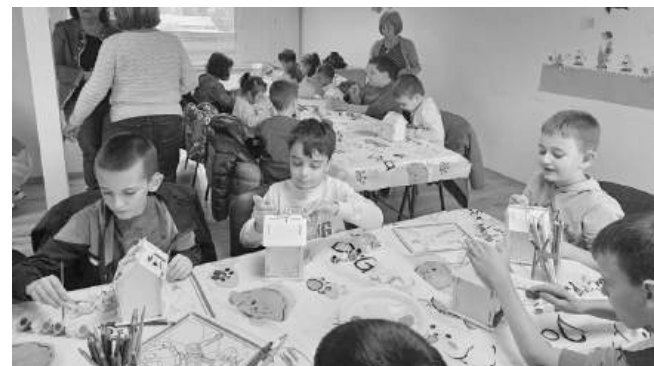
Творчество, с грижа за птиците