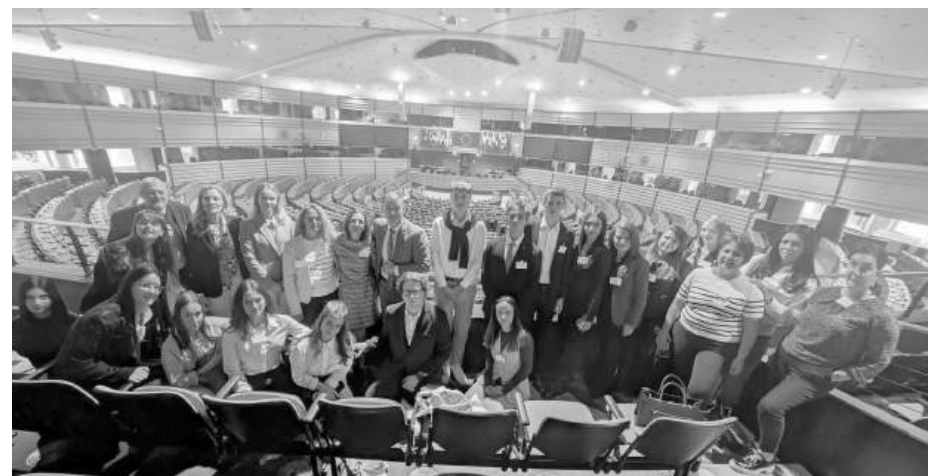
В парламентарната зала