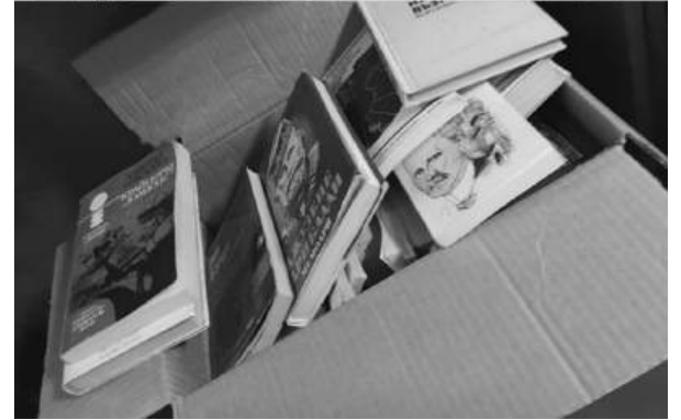
За библиотеката на клуба