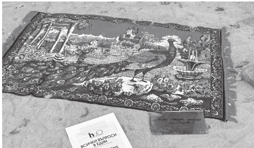
Събитието бе в подкрепа на кандидатурата на Бургас за Европейска столица на културата 2032