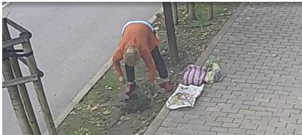
Жената е уловена от камерите по сградата на Библиотеката

Те добавят, че розите разказват без думи за щеростта на духа и онази тиха доброта, която не търси признание, а просто прави света по-хубав.