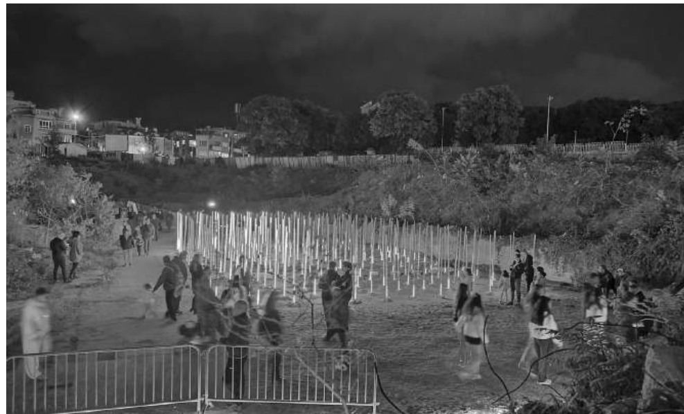
Въпреки трудностите с лошото време, „Вода“ устоя и зарадва публиката