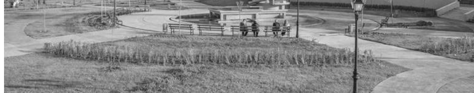
Община Сапарева баня желае да си сътрудничи с Община Бургас в сферата на туризма и балнеолечението

Проектът залага на публично-частно партньорство и цели постигане на световен стандарт в медицината, балнеолечението и СПА туризма, устойчиво икономическо развитие и превръщането на общината в цялогодшна туристическа дестинация. В него са включени и подобекти, насочени към Бургас и