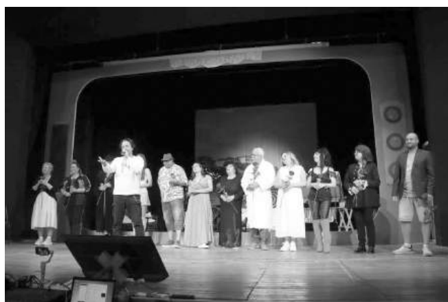
Любителската театрална трупа „Антеа“ към НЧ „Отец Паусий – 1896“ вече е изнесла две представления пред созополската публика

От тази учебна година малките таланти могат да се включат и в театрална трупа за деца от 1-ви до 4-ти клас. Под ръководството на актьори професионалисти, децата ще направят своите първи стъпки в магичния свят на театъра – ще се запознаят с основните на актьорското майсторство, ще развият въображението, паметта и увереността си пред публика, ще се учат да работят в екип, да импровизират и да изразяват емоции чрез движение, глас и мимика. Театралната трупа е приключение, в което всяка репетиция ще носи ново откритие – за героите, за сцената и за самите участници. А в края на учебната година малките актьори ще излязат под светлините на прожекторите, за да представят спектакъла, който