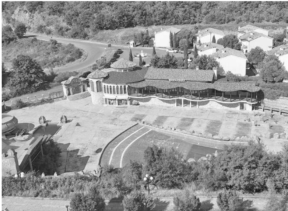
Преди да мине стихията и природата да си каже думата

Отговорност. Местната Най-логично е собственикът на вилното селище да бъде призван да предостави цялата документация за изградените постройки и инфраструктура