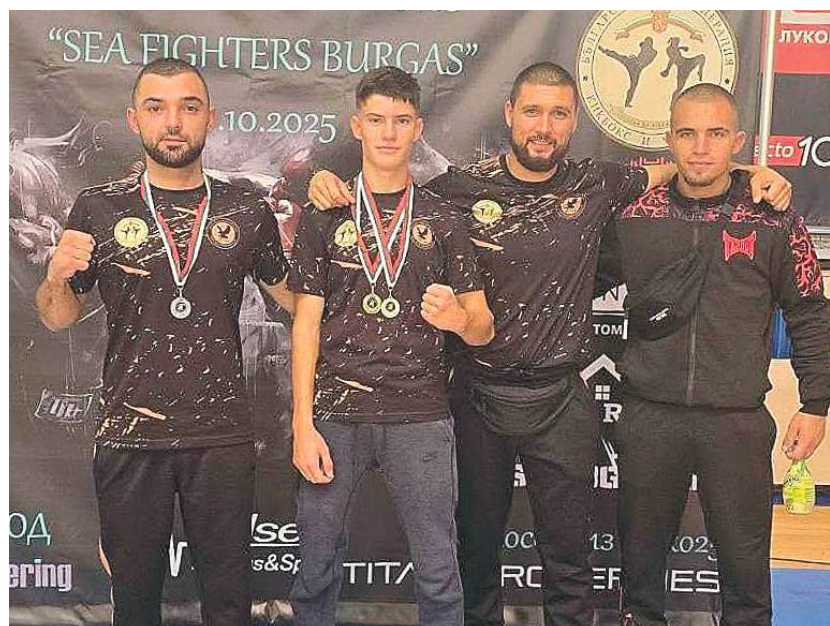
СК „ОРЕЛ“ - Айтос с амбиция да е сред водещите в кикбокса в България