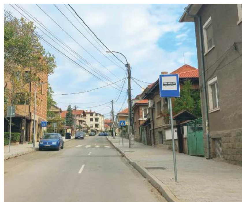
Докато текат ремонтите на ул. „Паркова“, маршрутът минава по ул. „Д. Зехирев“