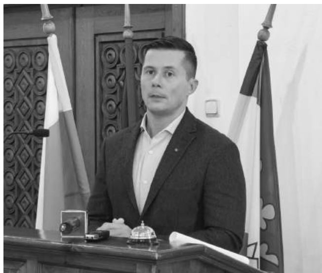
Кметът Марин Киров