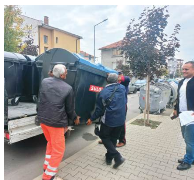
През тази седмица, работниците на отдел „Благоустройство“ подмят контейнерите на фирма-изпълнител с нови, закупени от Общината

Целта е организация на движението, която да облекчи придвижването,