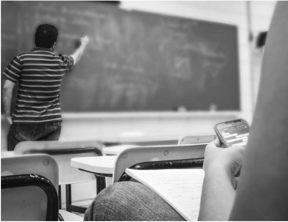
Мярката е противоречива – ученици и родители са на различни мнения за поzlата от нея

Нови правила. Промените в закона влизат в сила още през ноември