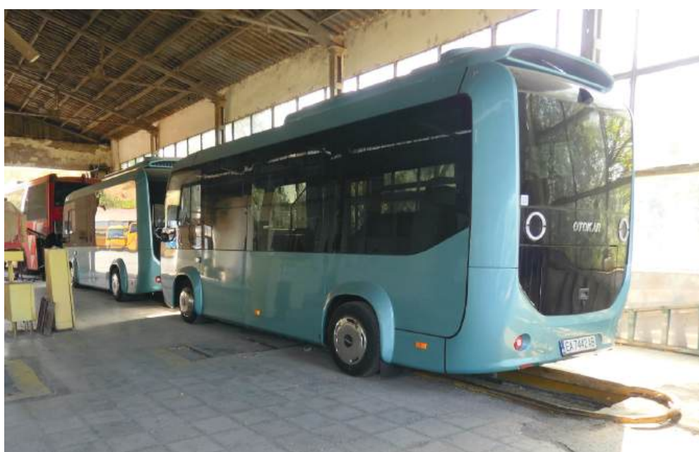
Електробусът, който на 20 октомври тръгва по градска линия №1