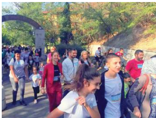
Леккоатлетически крос 2024

Със съдействието на ОБЩИНА АЙТОС, РОТАРИ КЛУБ АЙТОС, UNITE FOR GOOD, МЛАДЕЖКИ ЦЕНТЪР АЙТОС