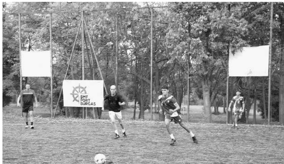
Голямата награда тази година е билети за футболния мач от Лига Европа между „Лудогорец“ и „Селта Виго“, който ще се състои на 27.11.2025 г. на стадион „Хювефарма Арена“ в Разград