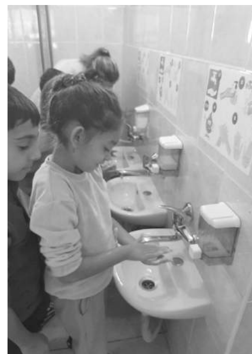
Простичка, но ефективна мярка за превенция на заболявания

Световният ден на чистите ръце се отбелязва от 2008 г., която Общото събрание на ООН обявява за Световна година на хигиената. Целта на Деня е да напомни за значението на правилното и редовно миене на ръцете за превенция на много болести.