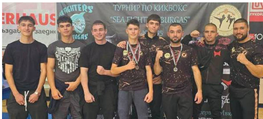
На финала