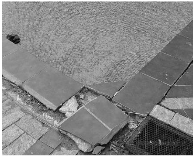
Изпучени плочки, празни рушаци се басейни и фонтани, излюпени фасади, неработещ аквапарк в окаяно състояние допълват мрачната гледка и преди бедствието

Като възпитаник на Геолого-географския факултет при СУ „Св. Климент Охридски“, специалност климатология и хидрология считам, че е