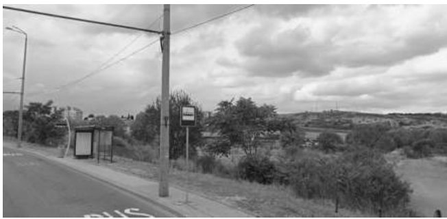
Това е районът, в който живеещите имат нужда от подобрение на инфраструктурата