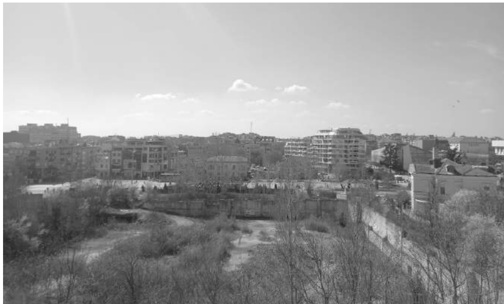
„Дупката“ от високо

Трансформация. От забравен строеж и градска легенда до сцена за култура и въображение