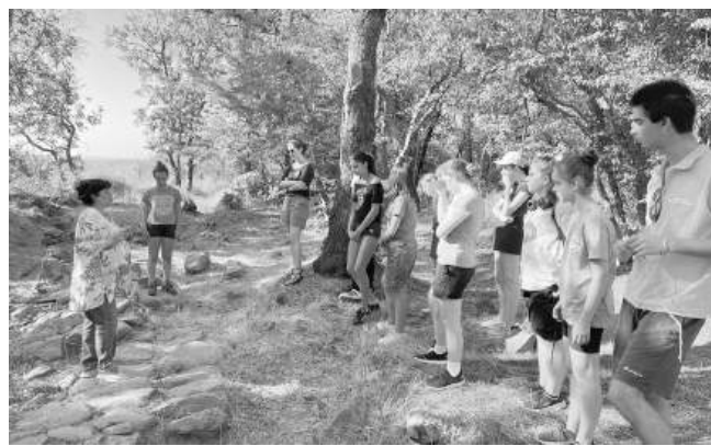
Участниците в „Аполоновия семинар“ се докоснаха до света на археологията под умелото ръководство на специалисти в областта

И тази година „Аполоновия семинар“ събра десетки ученици, студенти и млади специалисти от 12 различни населени места в страната, включително и от Созопол. Участниците имаха възможност да се потопят в богатия свят на културното наследство чрез атрактивни занимания като участие в теренни археологически дейности в Равадиново под ръковод-