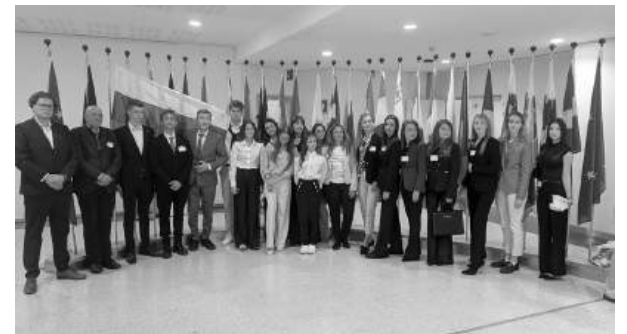
Младежката група на BRIDGES