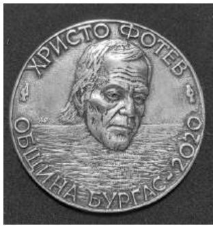
Плакета за поезия „Христо Фотев“

Съгласно новия статут, в сила от 12 октомври 2025 г., и тази година ще бъдат присъдени престижните плакети: „Христо Фотев“ – за поезия, „Петко Росен“