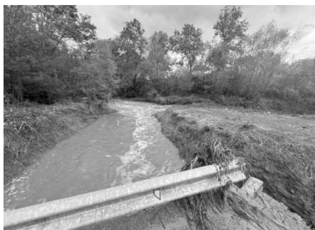
Наводнението в „Черниците“ на 3 октомври