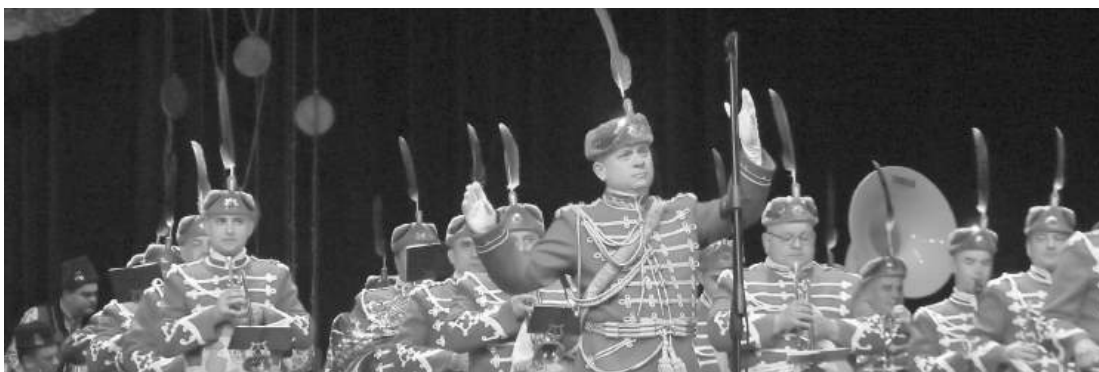
Военното окръжие търси оркестранти на военна служба в представителните духови оркестри и военнослужещи за ВМА

Военно окръжие II степен – Бургас съобщава, че със заповед № ОХ-900/29.09.2025 г. на Министъра на отбраната, са обявени за военнослужещи във Военномедицинска академия 2 длъжности за офицери и 11 длъжности за сержанти за приемане на военна служба след конкурс на лица, завършили граждански висши училища в страната или в чужбина.