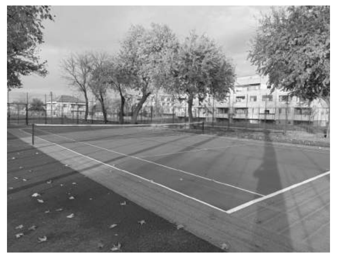
Новата спортна площадка ще бъде на разположение както на всички над 300 ученици от местното училище

общински център за комплексна работа с деца, ученици и младежи, който ще се помещава в сградата на старото училище.