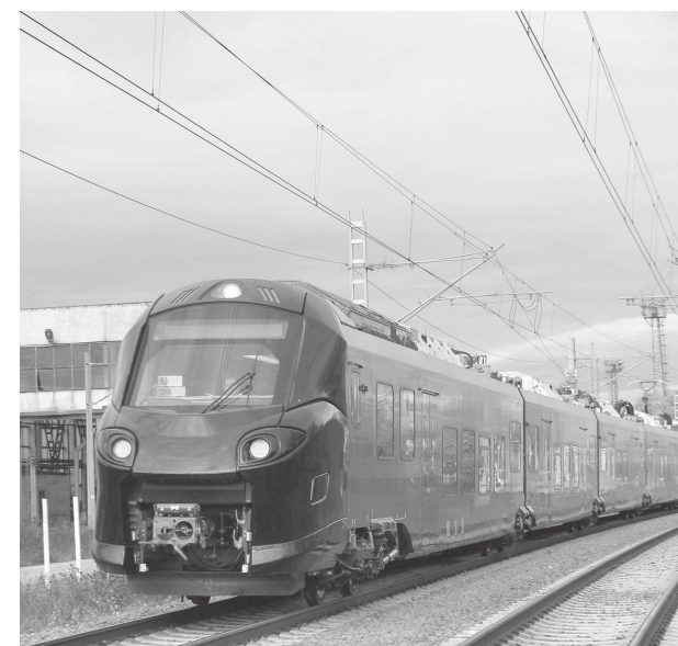
Кадър на новата моториса на Alstom в България

Снимките на влака бързо се разпростриха в интернет и предизвикаха смесени реакции – част от хората приветстват модернизацията, други са скептични за състоянието на релсите и възможността новите влакове да се поддържат в добро състояние от пътниците.