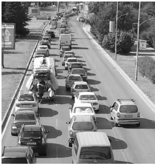
Подобна беше картинката в иначе спокойния от трафик неделен ден по бургаските улици СНИМКАТА Е ИЛЮСТРАТИВНА

И макар събитието да приключи с аплодисменти и много усмивки, остана и усещане, че въпросът за мястото на масовите спортни прояви в градската среда ще бъде все по-дискутиран.