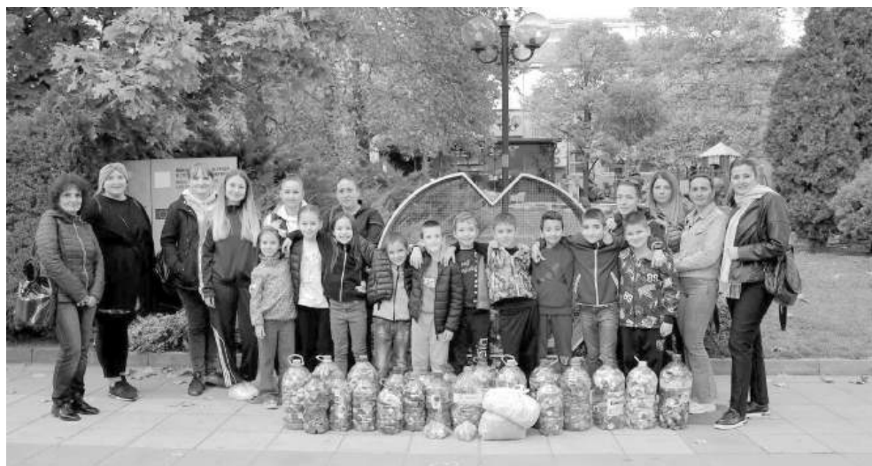
Второкласниците заедно с родители и учители

ва, да се включат заедно със своите родители в благотворителното събиране на пластмасови капачки. Учениците с огромно желание се заеха да помагат, убедени, че по този начин се грижат едновременно за