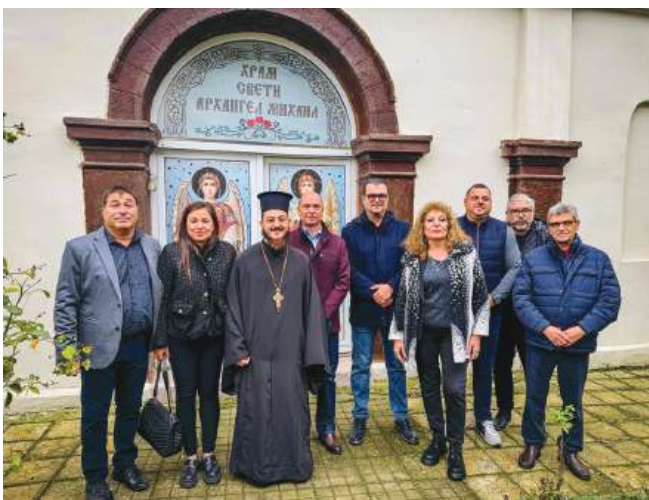
Домакини и гости пред храма

г. Защо точно Караново? Възрастни хора разказват, че по това време в района е върлувала тежка болест, погубила много хора. Наричали я „каран“ или „черна болест“. От там и името - Караново.