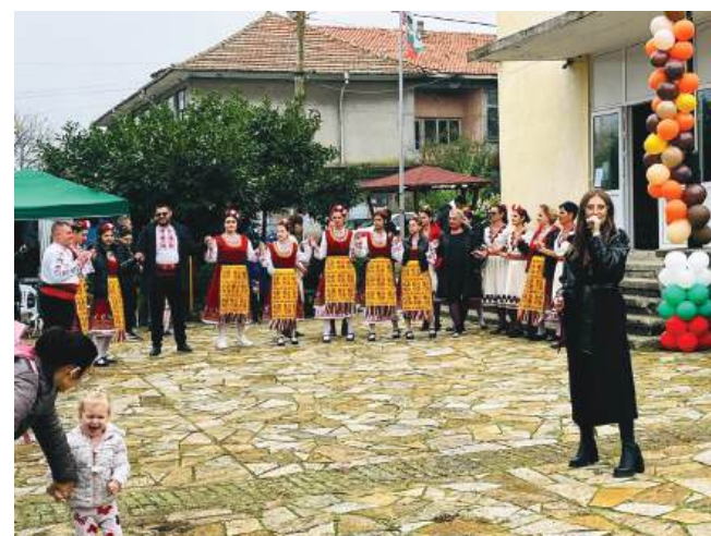
Празнично настроение пред Читалището

Карановци има с какво да се гордеят. Селото им е сред най-старите населени места в общината, с богати традиции и приемственост. След проучване, направено от Сливенска митрополия за възникването на село Азаплий /Караново/, през 1972 г. местните узнаха, че селото съществува от близо седем столетия. Тази година карановци