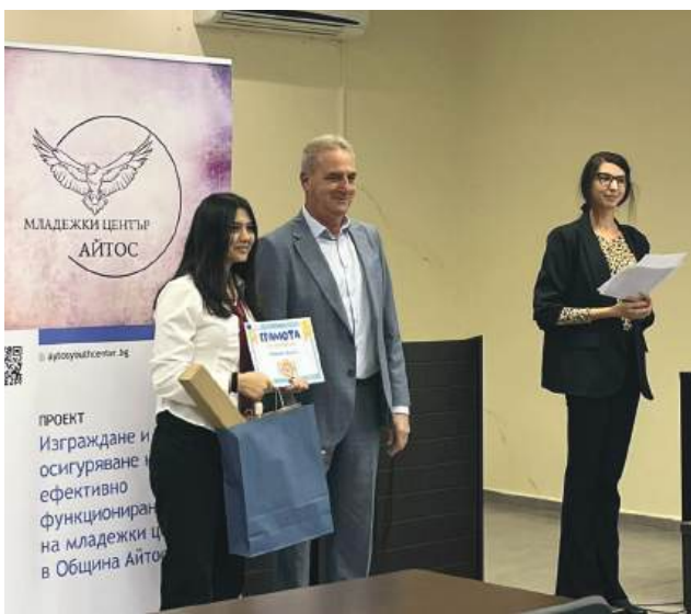
Награди за участниците в конкурси и турнири