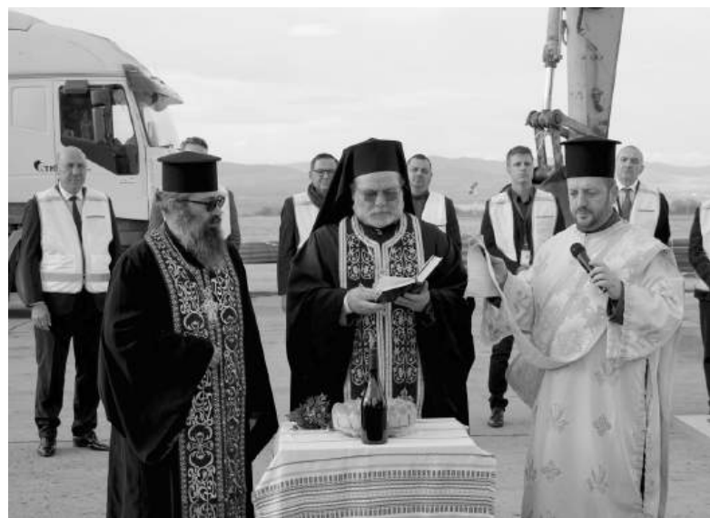
С водосвет бе съпътствана официалната част

ри са преминали бързо и в срок. Надяваме се пистата да бъде готова навреме и това да доведе до повече полети до и от Бургас, както и до по-голяма сигурност и устойчивост на въздушния транспорт в региона, каза той.