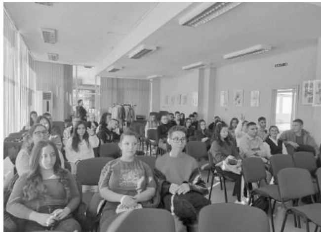
С гимназистите на СУ „Никола Й. Вапцаров“

Дванадесетокласниците, повечето от които вече са пълнолетни и правоспособни шофьори, бяха запознати с най-основните ефекти, които оказва алкохола върху организма. Научиха, че алкохолът променя баланса на веществата в мозъка и може да доведе до промяна в поведението, мисленето, чувствата и емоциите – част от тези състояния учениците са наблюдавали, както вър-