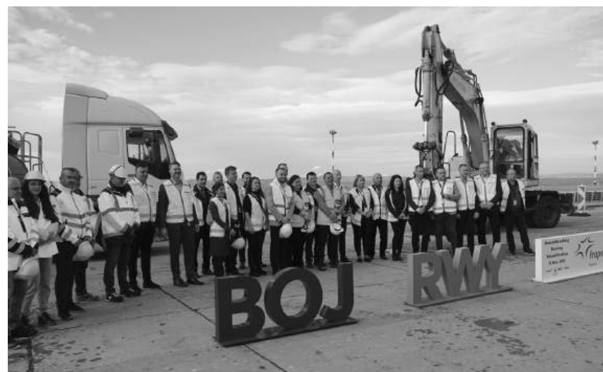
Гостите по време на историческия момент