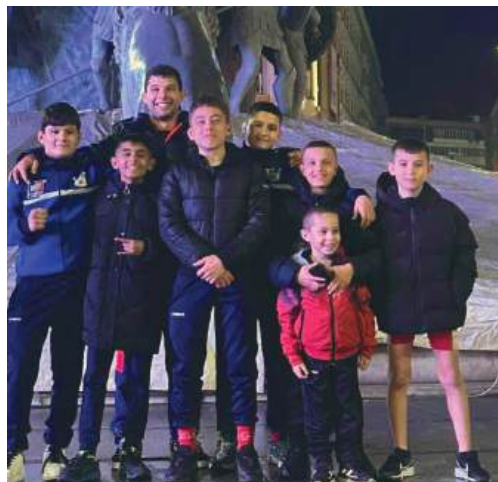
Отборът в Скопие