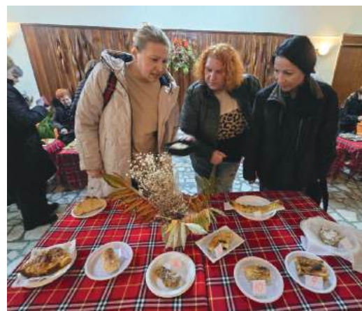
Журито се затрудни пред майсторлъка на местните жени

Празникът на баницата за пореден път доказва, че когато се съберем заедно, за да споделим традиции, вкус и веселие – българският дух остава жив!“, заявиха от кметството.