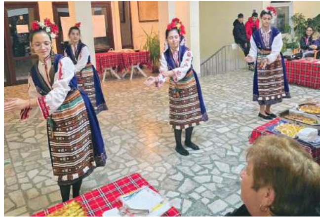
Самоейната танцова група донесе допълнително настроение

Специални благодарности бяха отправени и