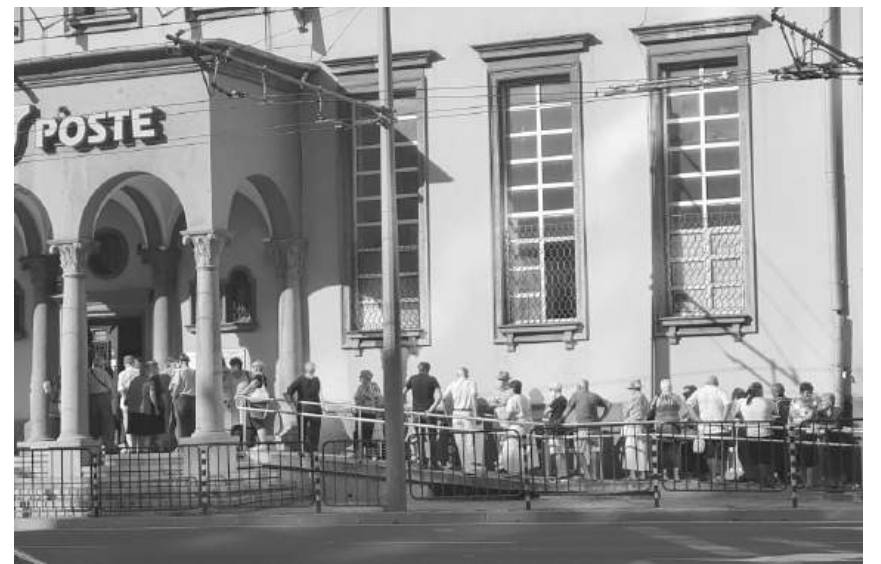
Ден за пенсии и плащане на сметки пред сградата на „Български пощи“

Това е от особено важно значение за възрастното население, за което пощенският клон или визитата от пощальон са единственият начин да получат пенсиите си заради липсата на банки и банкомати в голяма част от селата. Друг въпросът как точно ще бъде направена организацията за обмяна на левове в евро именно, когато липсва и пощенски клон.