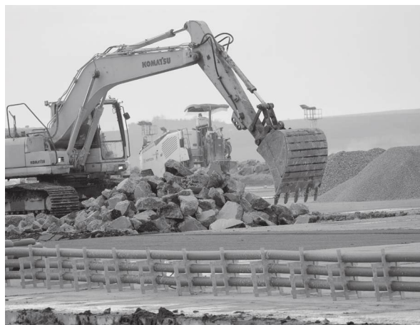
Тежката техника вече е на терен

Заместник-кметът по финанси на община Бургас Станимир Анос-