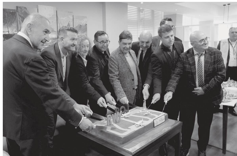
Тортата във формата на пистата