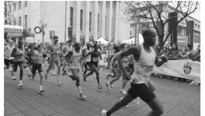
Над 2000 участници от 17 националности се включиха в бягането

Бургазлима добавя: „Нашият град разполага с паркови пространства с подходяща гръбнина, затова предлагам подобни мероприятия в бъдеще да се провеждат в парк „Приморски“, парк „Езеро“, евентуално по крайбрежната алея към Солниците и квартал „Сарафово“.