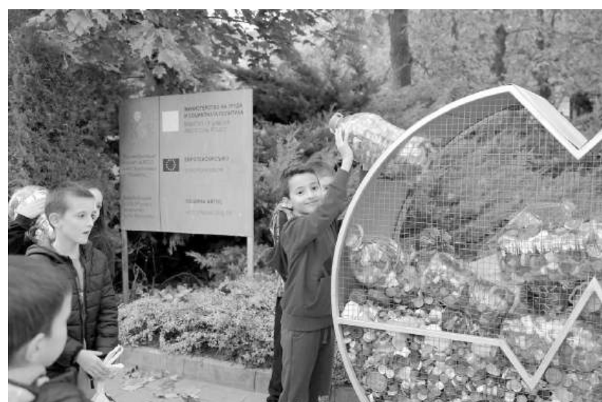
Фуркан: Продължаваме да събираме капачки за бъдеще

опазване на околната среда и за недоносените бебета на България „Капачки за бъдеще“ е една от най-популярните благотворителни кампании в България – събиране на