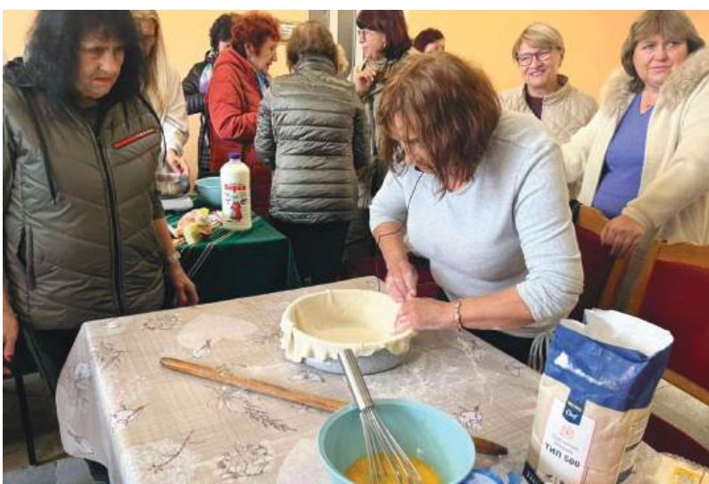
Местните жени запретнаха ръкави