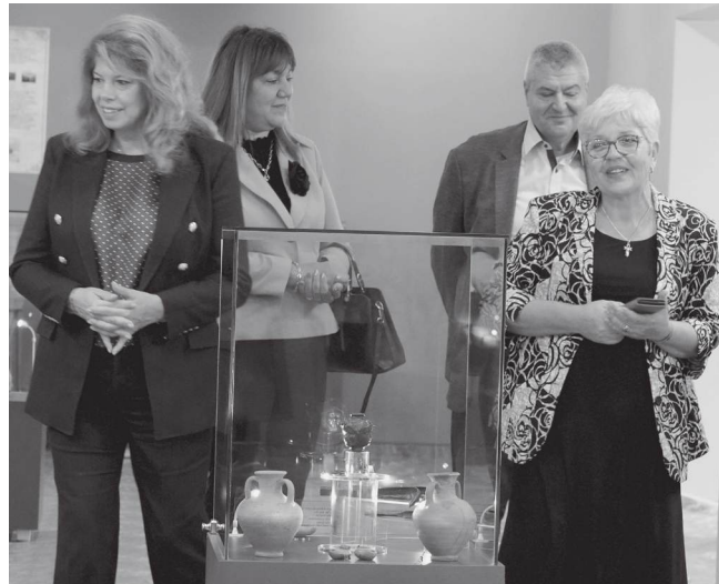
Вицепрезидентът Илияна Йотова разглежда музея в Националния археологически резерват „Деултум“. Специален гид в музея бе Красимира Костова, която разказа историята на колонията и показа на Илияна Йотова ценните експонати, които са погредени във витрината на музея. Сред тях е и реплика на един от печатите на княз Борис Михаил, открит на територията на римската колония

„Нека да си помислим върху каква земя стоим с вас в момента. Всеки сантиметър, всяка крачка, всяка педя тук е история“, каза вицепрезидентът Илияна Йотова в словото си пред