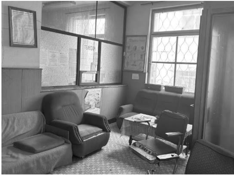
Така изглежда помещението на Пощата в Зидгарово, където би следвало да се обменя валутата до 1000 лева на ден за човек

Кметове алармират. Няма условия за превалутуирането и настояват за спешни мерки