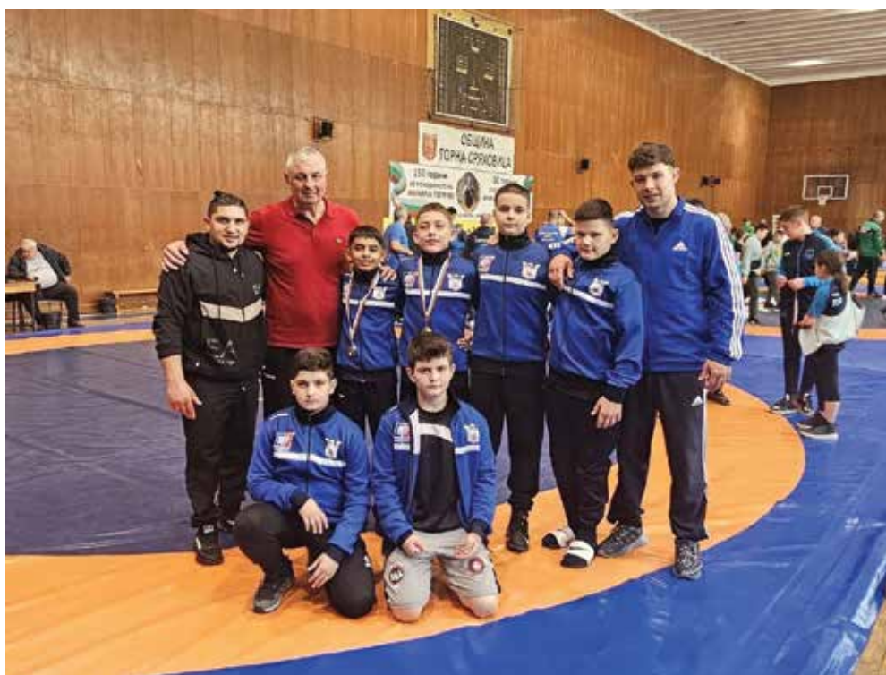
Състезателите от група II – деца