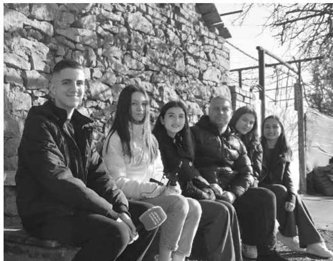
Учениците от СУ „Христо Ботев“ в Айтос и техните ръководители посветиха един ден от своите проучвателни експедиции, за да разговарят с местните хора в Пещерско и да проучат района