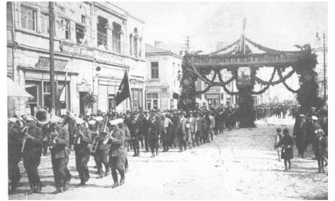
Манифестация на участниците в XVI конгрес на ловците в Бургас