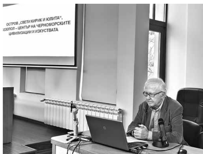
Пластове хилядолетна история стои на острова