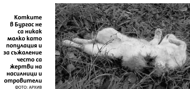
Котките в Бургас не са никак малко като популация и за съжаление често са жертви на насилници и отровители

„Отворени сме към всеки един сигнал, който постъпва при нас. НПО-тата са изключително активни. Сега последно направихме среща с