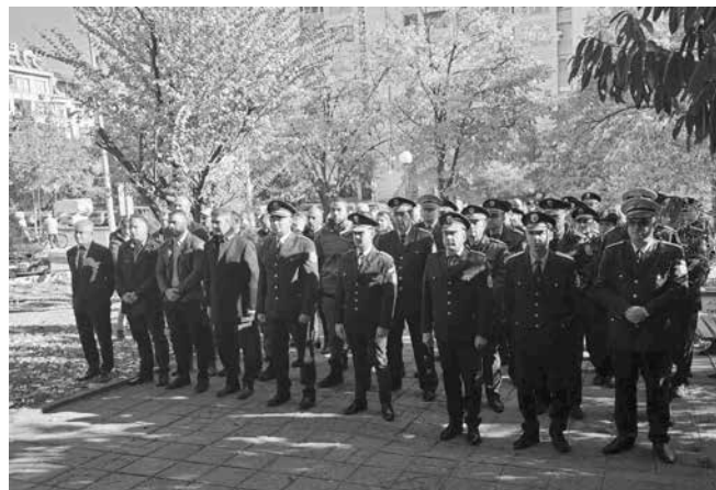
Отделно звено „Зоополития“ все още не съществува към МВР, макар природозащитници да настояват за създаването му