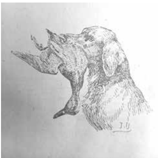
Реклама на ловно куче

„противонародна“. Свикан е набързо XIX конгрес, на който е изменен уставът, избрано ново ръководство, отстранени старите ръководни кадри, назначени нови, зачеркнато всичко градено предишните години и организацията тръгва по „нов път“.