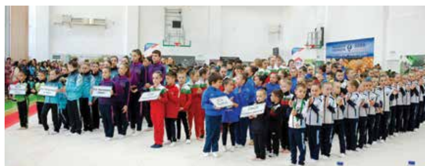
Отборите на клубовете участници