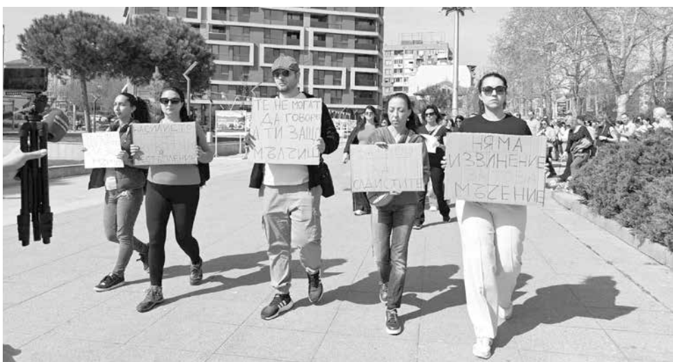
Бургазлии за пореден път излязоха на протест преди дни, за да изискват по-строги наказания срещу насилниците