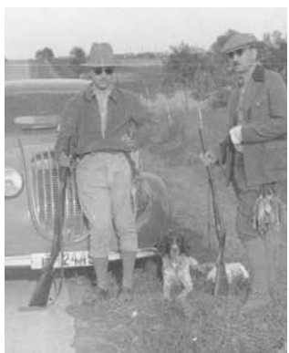
Лов и с автомобил

членуващите се давал отчет, освобождавало се старото настоятелство и се избирало ново. Предлагали се за гласуване по две листи кандидати, а също така се избирали делегати за поредния ловен конгрес, който се провеждал в различни градове.