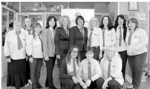
Екипът на СУ „Никола Йонков Вапцаров“