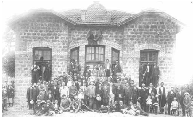
16-хижа построена през 1926 г. с дроволен труд и дарения

селата Маринка, Твърдица и Надежда. Дружеството е организирано ударен отряд от стрелци, които са действали по молба на населението и в други места в землищата на селата Ново Паничарево, Равна гора, Ясна поляна и др.