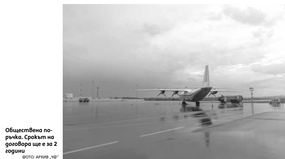
Обществена поръчка. Срокът на договора ще е за 2 години