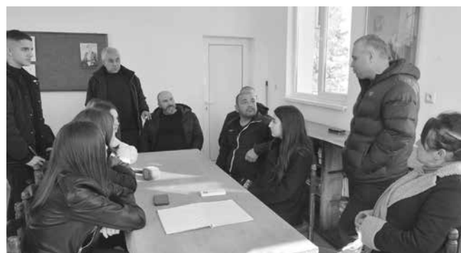
Младите изследователи бяха посрещнати в залата на местното читалище „Кирил и Методий - 1929“, където представиха своя проект пред жителите на селото