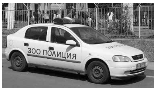
В автомобилния фонд на ОДМВР-Бургас имаше и такива автомобили