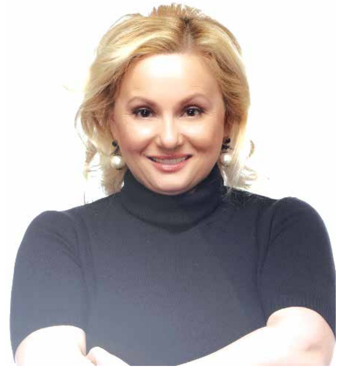
Чарът на истинската Тони не може да бъде постигнат от машина

Модифицирани с изкуствен интелект глас и визия на популярната и обичана певица обяснява в скалъпеното видео как са започнали проблемите с очите ѝ, та стигнали чак до там, че тя не може да излезе от дома си без помощ. И тогава се появява вълшебният цяр на доктора, чийто образ и глас със сигурност