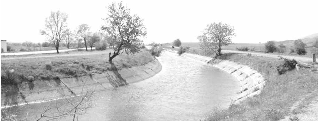
Настоява се за въвеждане на уведомителен режим при издаване на разрешителни за водовземане от повърхностни водоизточници

Срок. До края на седмицата да се проведе среща с всички заинтересовани страни