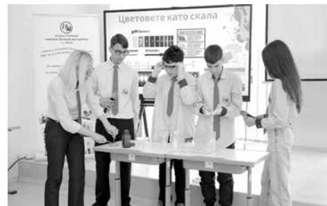
Цветовете като скала“