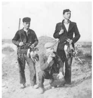
На лов за патици