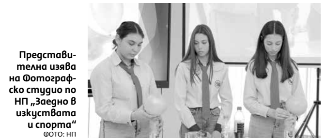
Представителна изява на Фотографско студио по НП „Заедно в изкуствата и спорта“