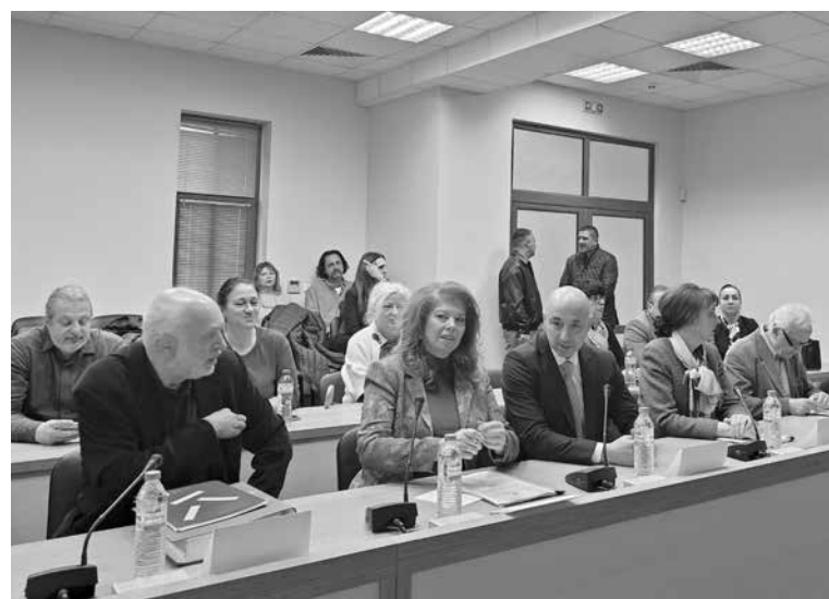
Срещата на комитета