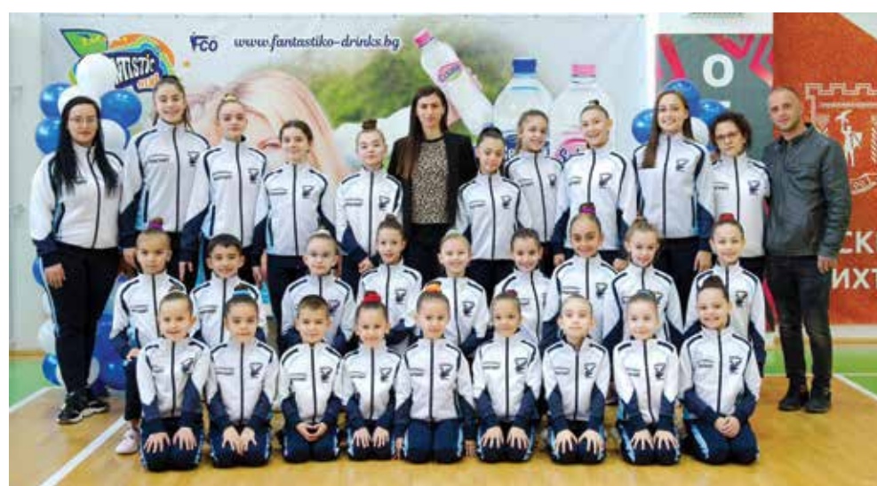
Отборът на КСА „Орел“ – Айтос