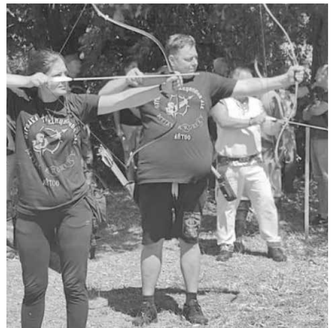
Турнирът край с. Пирне е традиционен

Наблюдавайте винаги, заставайки зад или успоредно на стрелящите, спазвайки дистанция от поне 2 метра!