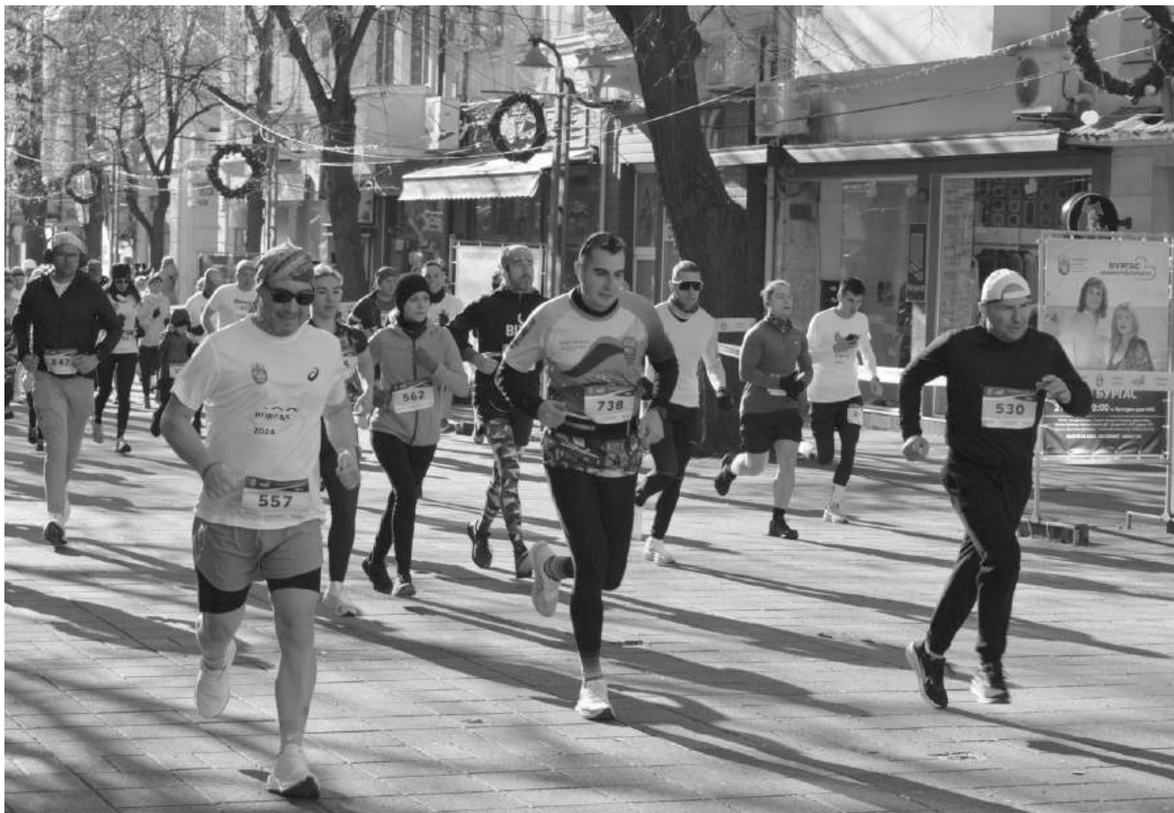
Доброволците могат да изберат между различни роли

Всеки желаещ може да се регистрира чрез платформата ihelp.bg/events/91/view и да стане част от отбора, който стои зад финалната линия на Маратон Бургас 2025.