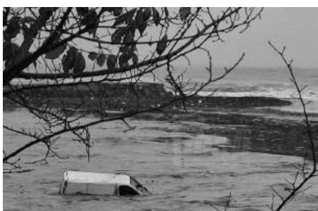
Една от много пътинали коли в морето