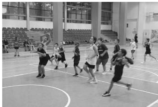
И баскетбол с подкрепата на БК „Вихър“

На фокус е и Дискусията за правата на детето, с активното съдействие на Дирекцията „Социално подпомагане“ – отдел „Закрила на детето“