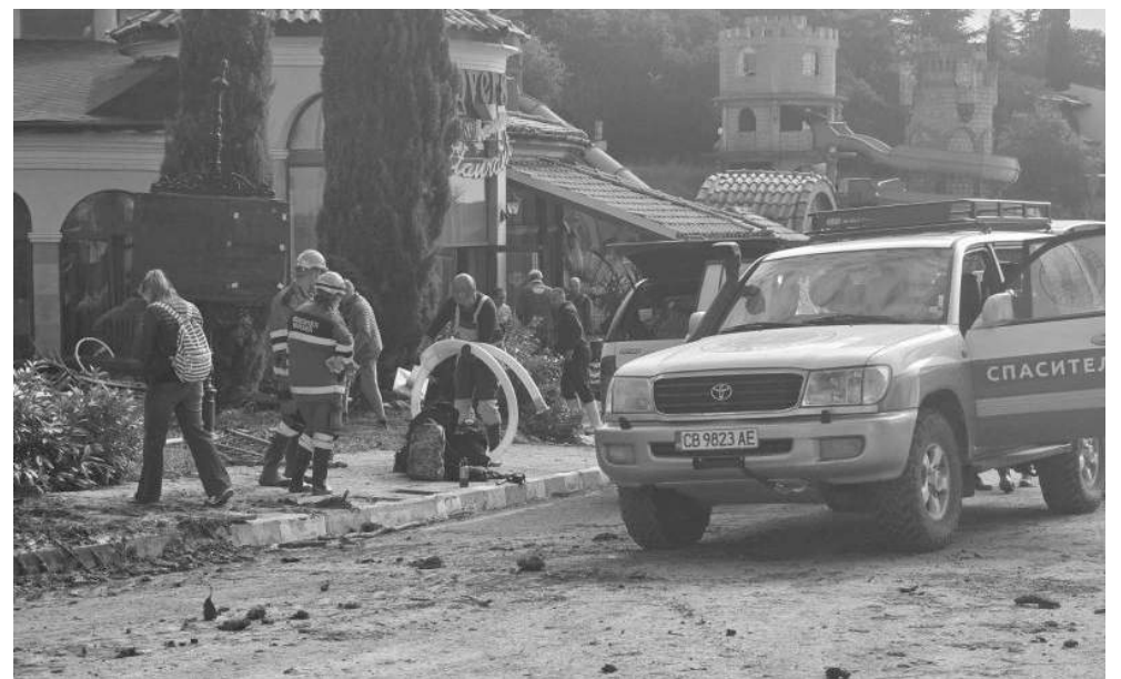
Пожарници, полиция и общински власти разчистваха пораженията