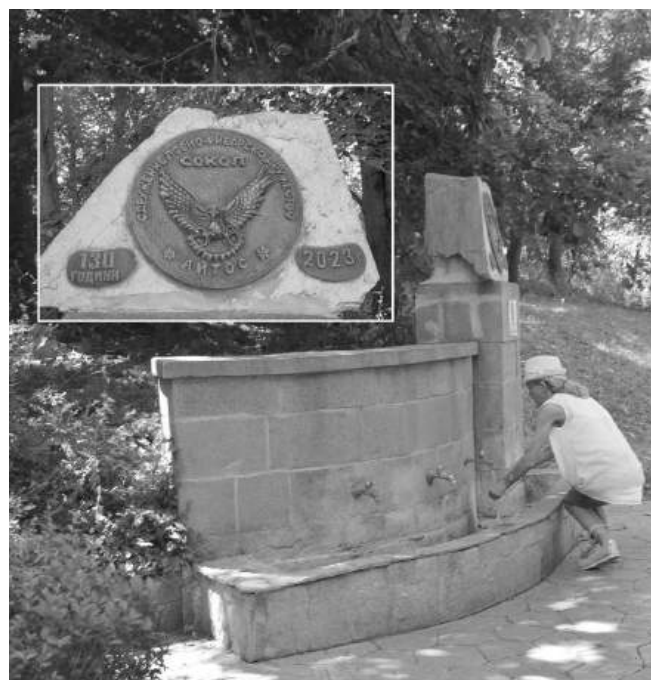
Чешма, изградена в чест на 130 – тата годишнина от създаването на Ловно – рибарско дружество „Сокол“ в града

тослии, които са искали да оставят следа и да помогнат на другите. Като ученичка, аз виждам в тези чешми нещо повече – те са урок по история и човечност. Те ни напомнят, че грижата за другите и уважението към природата са ценности, които трябва да пазим и предаваме. Мечтая си един ден да участвам в обновяването на някоя от айтоските чешми, да я почиствам и да я направим отново място, където хората могат да се съберат и да се чувстват свързани с корените си. Защото когато отпиеш от водата на стара чешма, отпиваш и от духа на града си. А той е безценен.