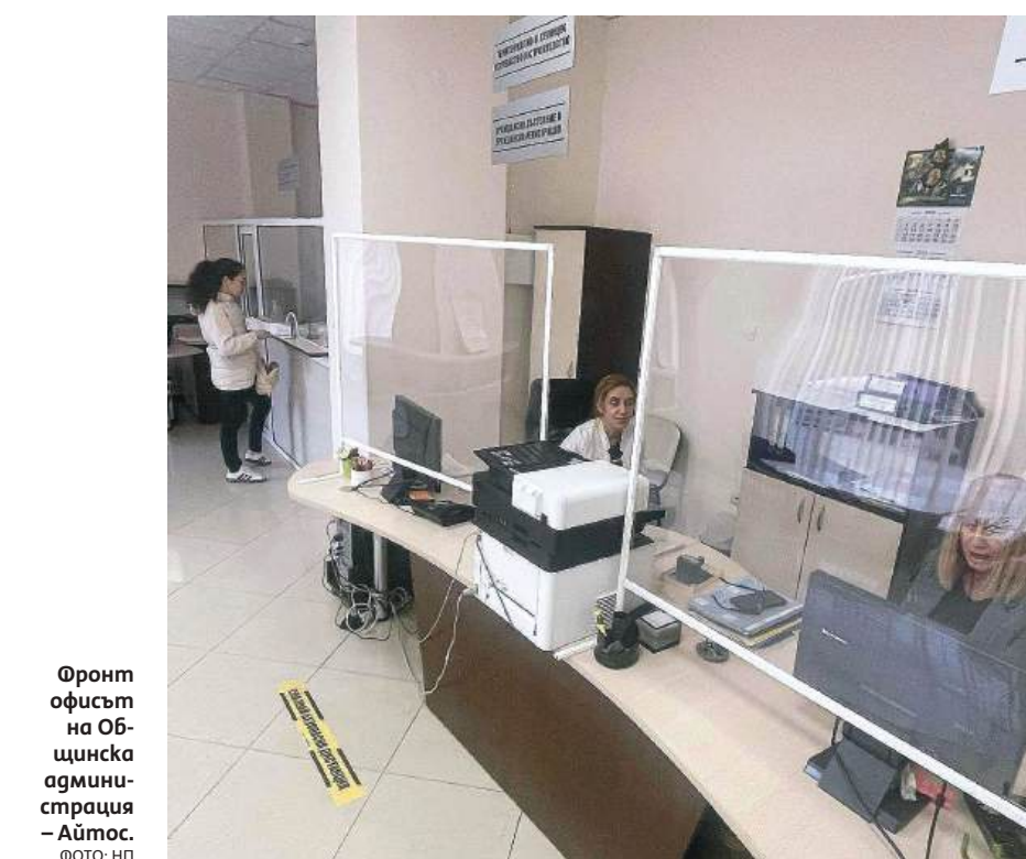
Фронт офисът на Об- щинска админи- страция – Айтос.

101 са издадените актове за бракосъчетания за шестте ме-