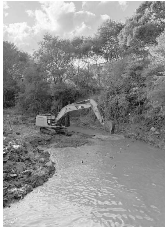
От общината извършваха почистване на дерета и реку

Видео на морско търнаго, заснето край бреговете на Царево, предизвика вълна от реакции в социалните мрежи. Кардрите, публикувани във Фейсбук група от очеви-