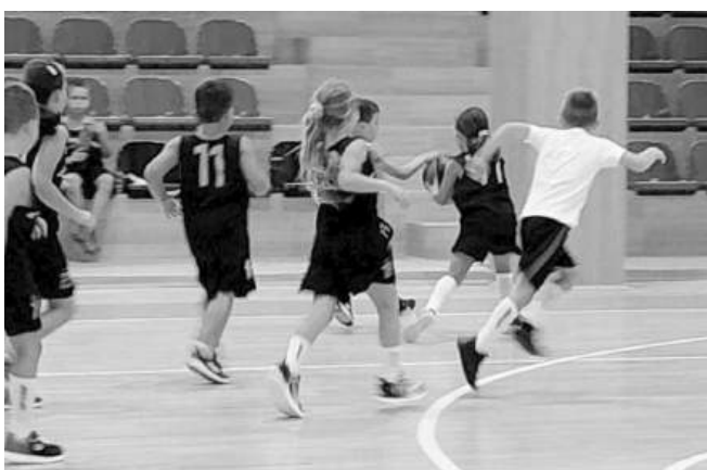
Айтос има най-добрата зала за баскетбол