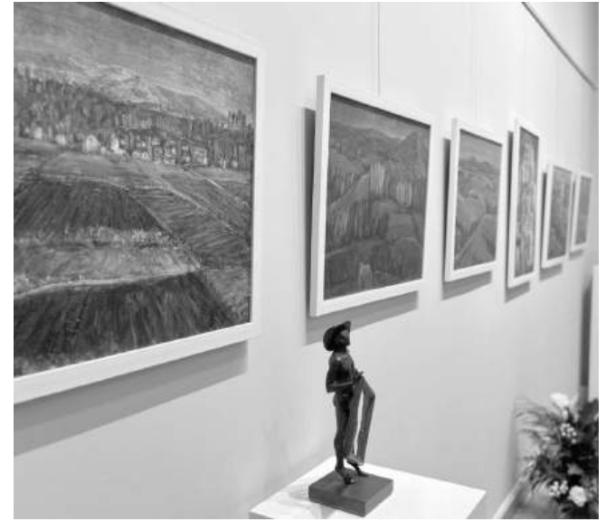
Изложбата ще остане отворена за посетители до 23 октомври

Експозицията в галерия „Неси“ ще остане отворена за посетители до 23 октомври.