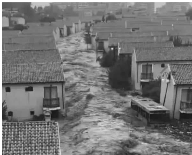
Района на „Вила Романа“ изглеждаше така по време на потоп