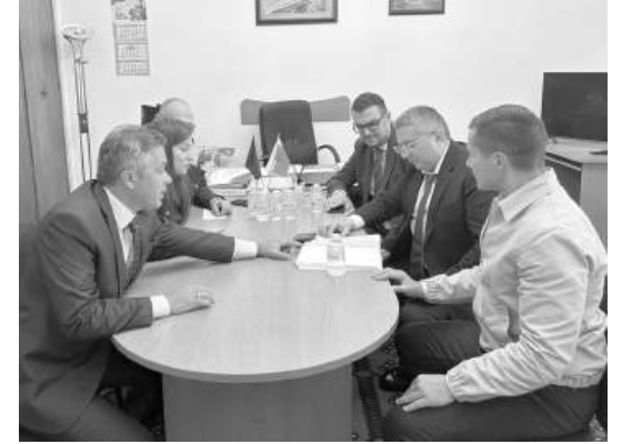
По време на работната среща