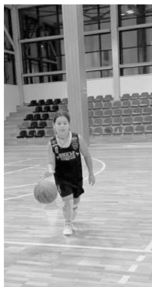
Баскетболната школа на Айтос е национално известна. ФОТО: НП

„Фокусът беше към възможността да бъдат обхванати най-голям брой ученици, от 7 до 18-годишна възраст. Водещата цел беше децата да бъдат насърчавани към здравословен начин на живот, физическа активност и занимания със спорт. Принос за успешното изпълнение на проекта имат квалификациите спортните специалисти на БК „Вихър“, коментира на финала на проекта, треньорът Дечо Коешинов.