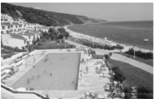
Много зеленина и свободни пространства