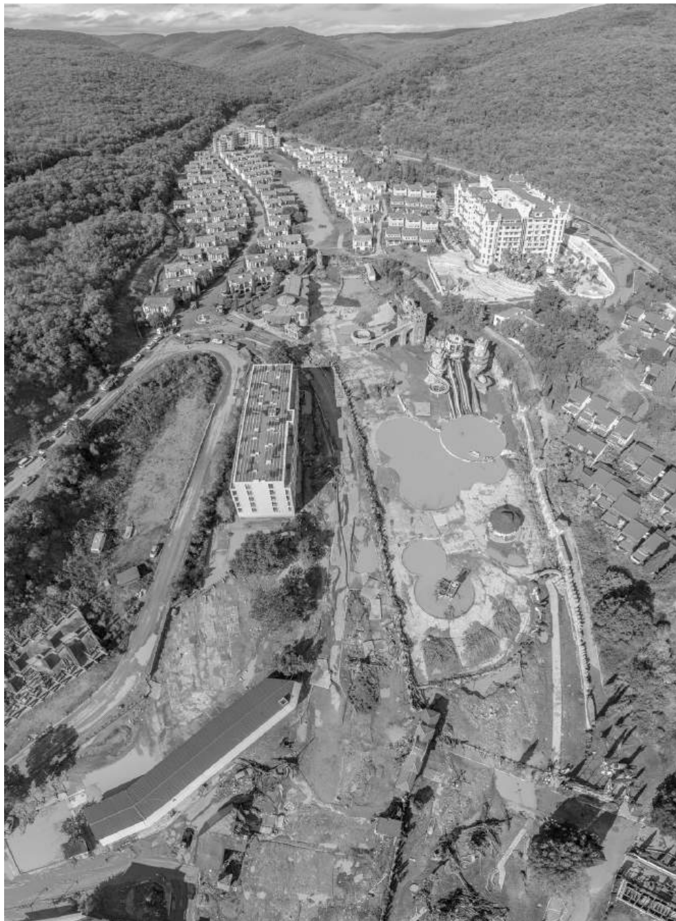
Снимка от високо показва цялата картина на ситуацията, строителство в река и пътят на водата

Министърът на регионалното развитие информира още, че е възложил на АГКК и ДНСК да изискат информация от Басейнова дирекция „Черноморски район“ за наличието на други речни