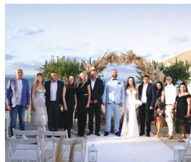
Една от ВИП сватбите на лятото

От партията благодарят за уважението да бъдат част от най-близкия кръг в този специален ден и пожелават на новото семейство дълъг и щастлив живот, много радост и единство по пътя им напред.