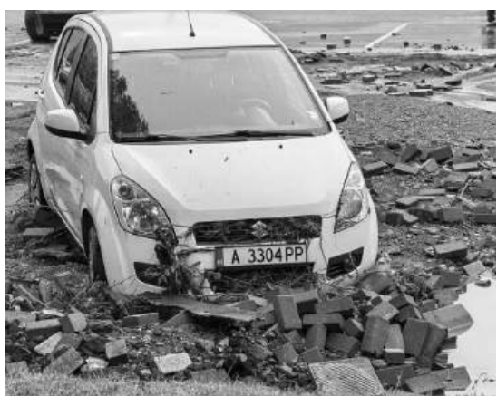
Бедствието нанесе сериозни материални щети