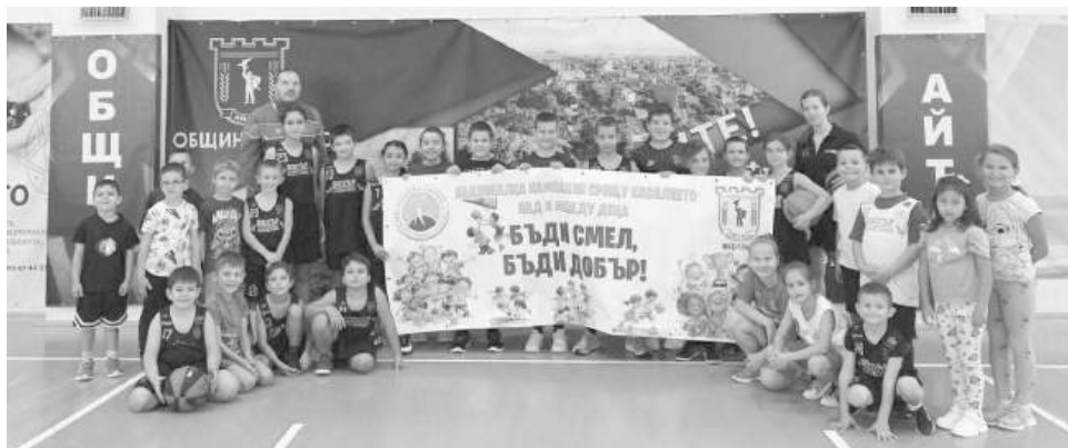
В динамична „Седмица на спортните дейности“

Тази година Местната комисия за борба срещу противообществените прояви на малолетни и непълнолетни - Айтос организира, съвместно с екипа на Младежки център – Айтос, една много динамична „Седмица на спортните дейности“. Подкрепя за инициативите през Седмицата, МКБППМН – Айтос получи и от Баскетболния клуб „Вихър“.