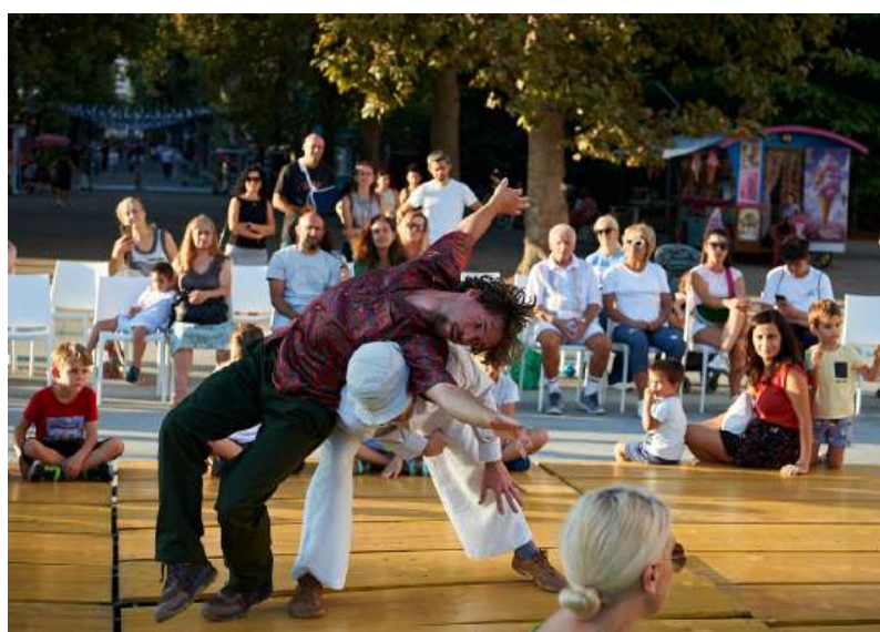
Основната програма ще се разгърне между 12 и 14 октомври

На 13 октомври Театър на селищата – София ще