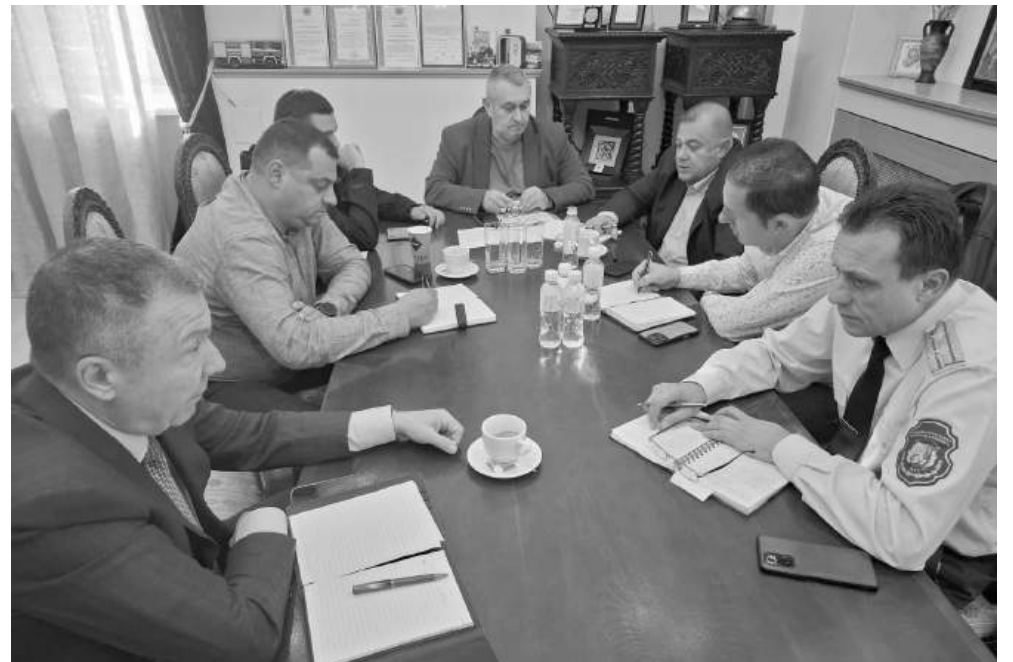
Областният кризисен щаб

При съгласуване на Подробен устройствен план (ПУП) за спортно-рекреационен парк в поземлен имот в землището на град Свети Влас от БДЧР е изразено становище, че през поземлените имоти, които са общинска собственост, „преминава дере с обособен водосбор и постоянен отток. По смисъла на Закона за водите това е воден обект и е необходимо, съгл. чл. 155, ал. 1, т. 23 от ЗВ и ал. 2, т. 1, б. „б“ от същия закон, да се издаде становище за допустимост на ИН за съответствие с ПУРБ и ПУРН ...В