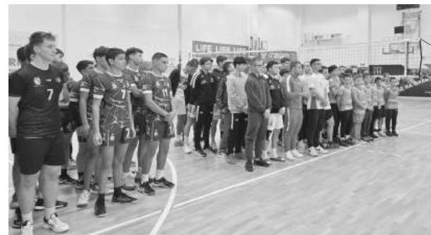
В Зала „Аетос“

В паралелния турнир участваха 4 отбора на възраст под 18 г. и 3 отбора на възраст под 14 години. Играха се общо 9 мача в памет на волейболния меценат.