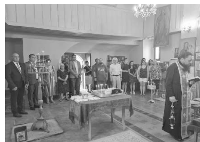
Храмовия празник е на 22 юни

С течение на времето въпреки стабилно построената сграда през периода 2003-2007 г. при кметския мандат на Събка Равалиева започва подготовка за ремонт на църквата. Събират се материали. Поръчват се врати в Люляково, подменена е дървената конструкция с нова, купени са нови кере-