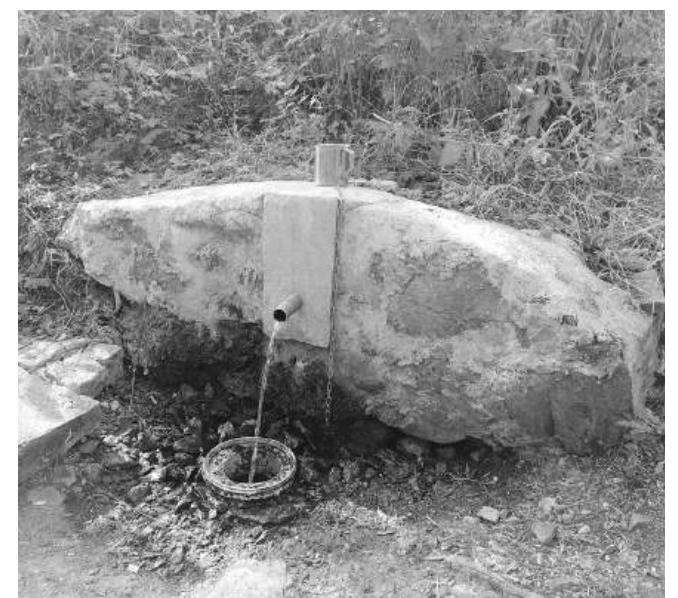
Една от чешмите в парк „Славеева река“, известни с това, че не пресъхват дори и в най-безводните периоди