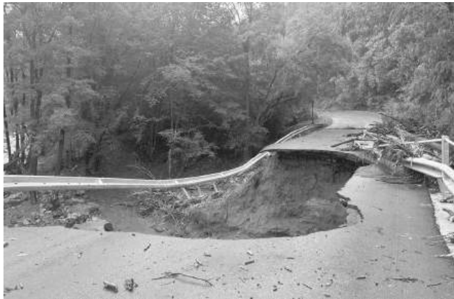
Мостът по републиканския път след село Изгрев

Трепка за злато. Метална каса с пари бе отнесена, местни жители тръгнаха на лов за банкноти