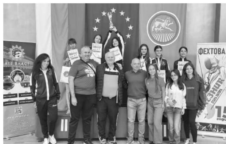
Общо пет медала завюваха фехтовчиците на „Корсар“