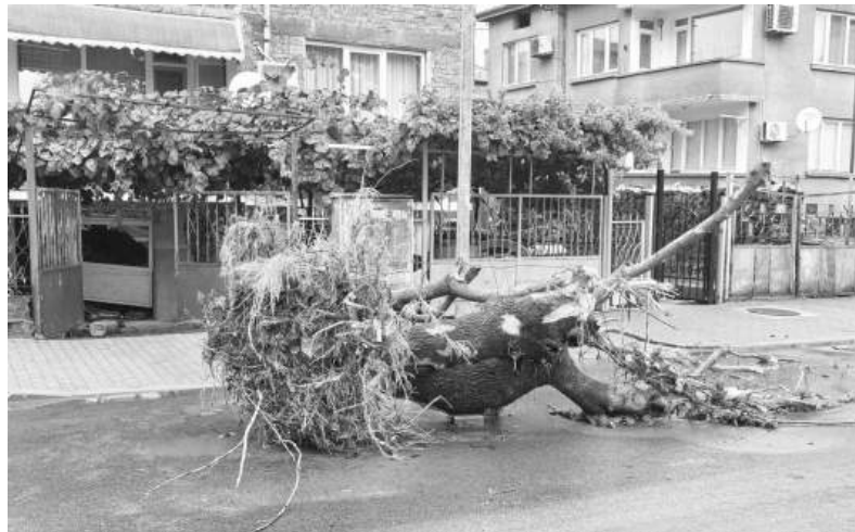
Дейности по разчистване и възстановяване се извършват във всички засегнати населени места

Народните представители са изразили пълна подкрепа за преодоляване на последиците от бедствието на 3.10.2025 г. и за мерките за превенция като проекти за сериозна корекция на речни корита и дерета, с които ще кандидатстват пред Междуправителната комисия по бедствия и аварии.