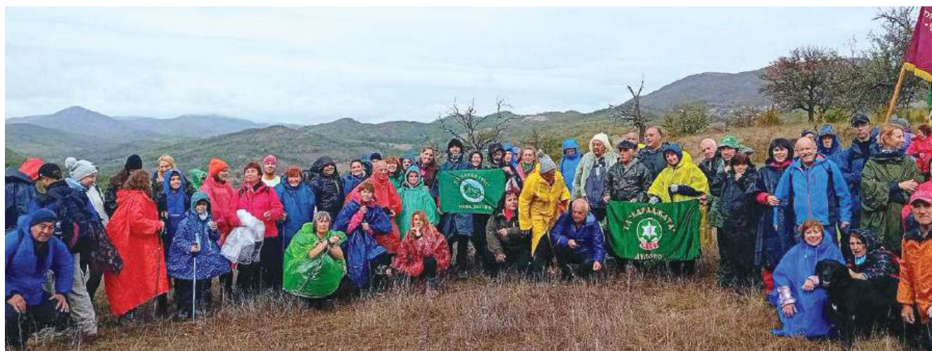
Участниците в похода