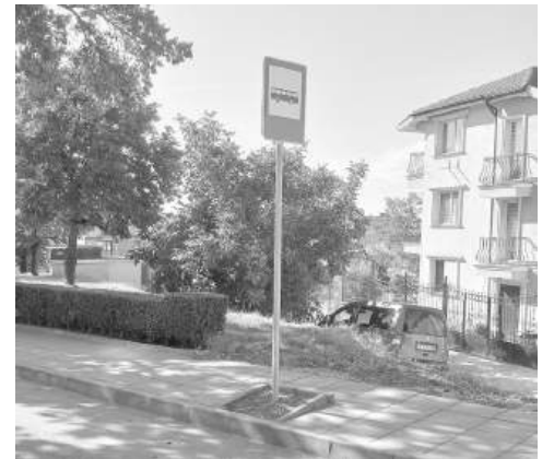
Монтирани са голяма част от знаците, указващи спирките

плащане понеже в социалните мрежи се заговори по какъв начин ще се случва плащането? Някой заговори, че може да бъде чрез мобилно приложение, чрез sms или чрез физически начин?