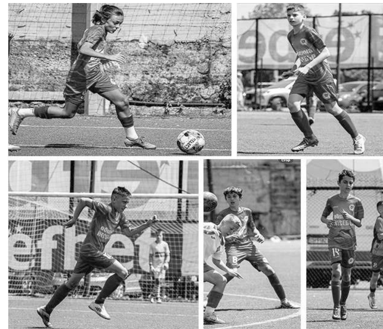
Петима седмокласници може да се окажат бъдещи национали

В детско-юношеската школа на клуба тренират над 150 деца на възраст от 9 до 18 години, разделени в пет възрастови групи. Младите футболисти се подготвят в отлични условия – материално-техническата база, с която разполага клубът, е част от съвременната спортна инфраструктурна мрежа на Община Несебър.