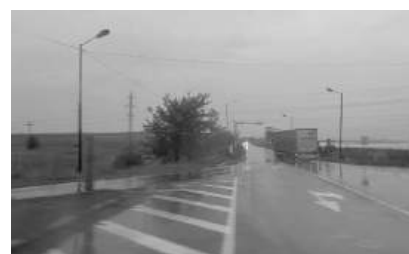
Отбивката за Шумен при Карнобат