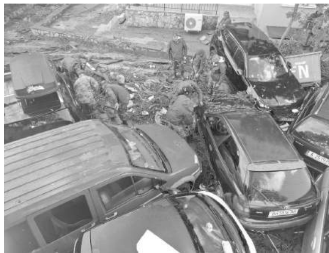
Повечето от колите бяха пометени от стихията

попада в Район със значителен потенциален риск от наводнения, за който са предвидени редица мерки на национално ниво и на ниво район за басейново управление.