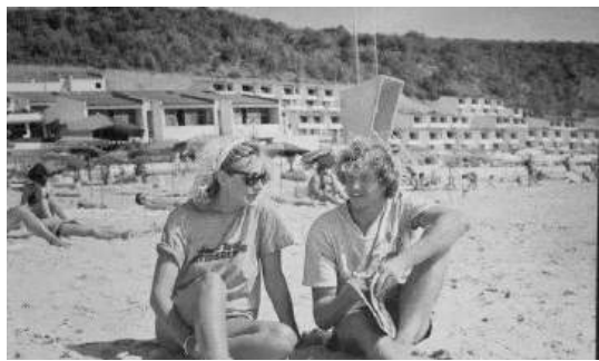
„Елените“ е бил изграден за изцяло чуждестранни гости