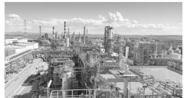
От руската компания започнаха да търсят купувач преди повече от 2 години. Офертата на "Сокар" се е оказала най-приемлива за "Лукойл"