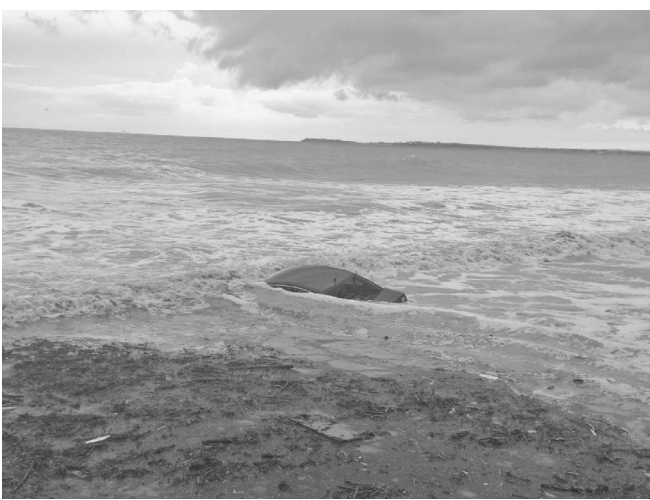
Загиналият и още двама са обикаляли 30-40 минути с лодката в бурното море край „Елените“

„Този човек е голям професионалист. Толкова добре е запознат с материята, че е обучавал дори собствениците на капитани. А лодката по принцип може да влиза и в по-бурни води. И досега никога не може да каже защо тя се е обърнала. Съществен въпрос е какво е наложило да се предприеме тази операция и по чие разпореждане“, посочват служители на МВР.