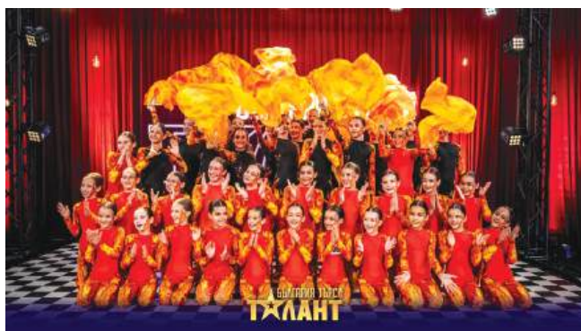
Танцова школа „Естрела“