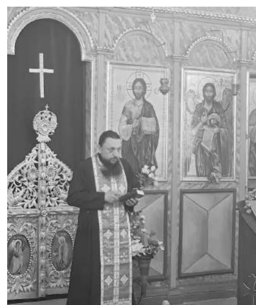
Църквата има интересна история, камбаната е от Русия

Радваме се, че имаме този храм в селото. Събираме се на празници, дава ни повод да се замислим и да бъдем смирени и по-добри.