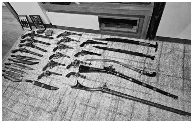
Част от колекцията на бургазлията

дрехи от казармата преди 20 – 30 години – така наречените „въшкарници“, които всички служещи от този период знаят с това име“, с усмивка обяснява бургазлията.