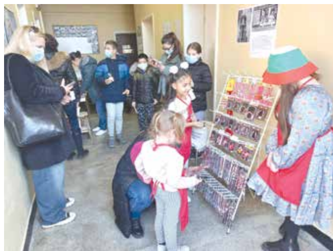
Айтозлии с интерес към инициативата във ВО

Инициативата събра не само средства, събра много усмивки и внимание към децата, които се нуждаят от подкрепа.