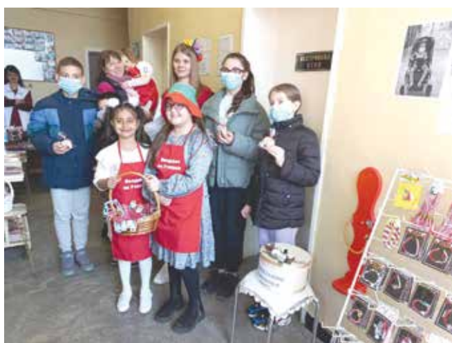
НП Заедно за децата в нужда