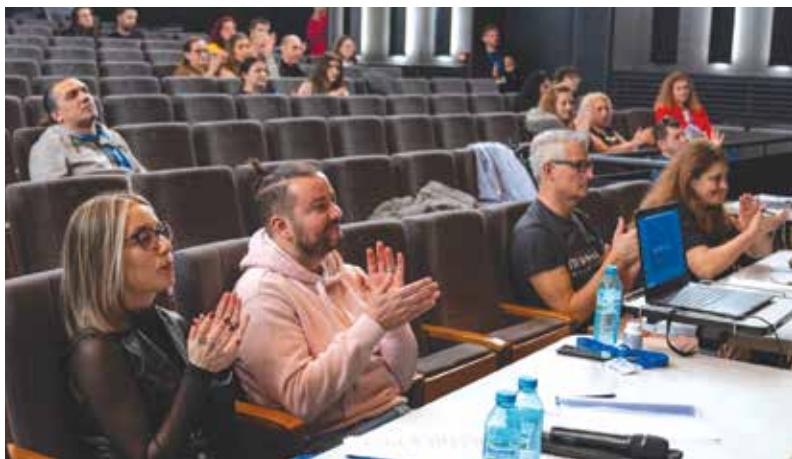
Кастингът бе в Културен дом на НХК