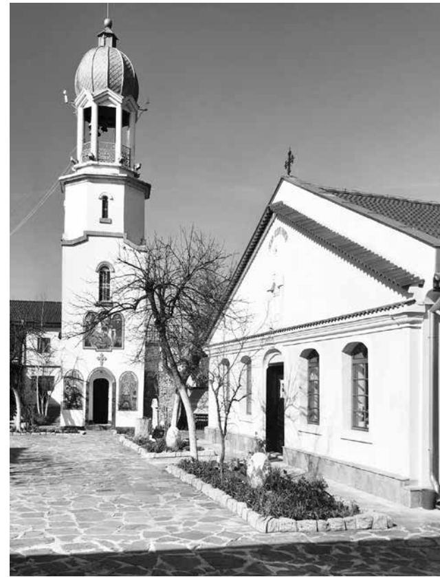
Поморийски манастир „Св. Вмч Георги Побегоноец“

Последва касиране на избора и промяна в правилата на БПЦ. Клирици и миряни от цялата страна откриха онлайн-петиции и организират подписки срещу решението на Св. Синод за касиране на изборите в Сливенска епархия и срещу скандалната наредба, приета от част от митрополитите в пропийоречие с Устава на БПЦ. Исканията на петициите и подписките са за отмяна на приетите