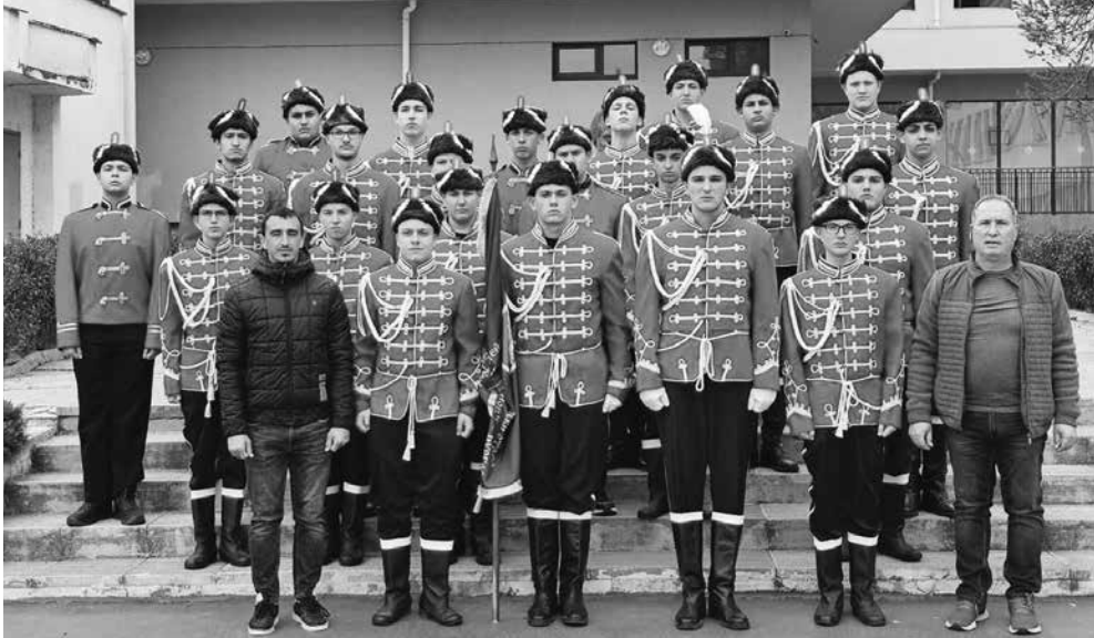
Момчетата показват страхотна дисциплина

Ритуали и принципи. Момчетата вярват, че са част от отряд-символ на българската държава