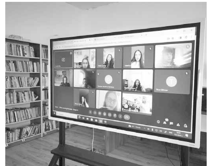
Младши посланиците се надяват на среща на живо с приятелите от Мачин