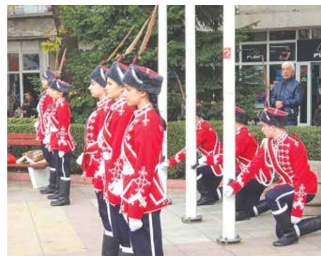
Гвардейци от VI Ученически гвардейски отряд, СУ „Христо Ботев“ ще участват в тържествения ритуал за празника