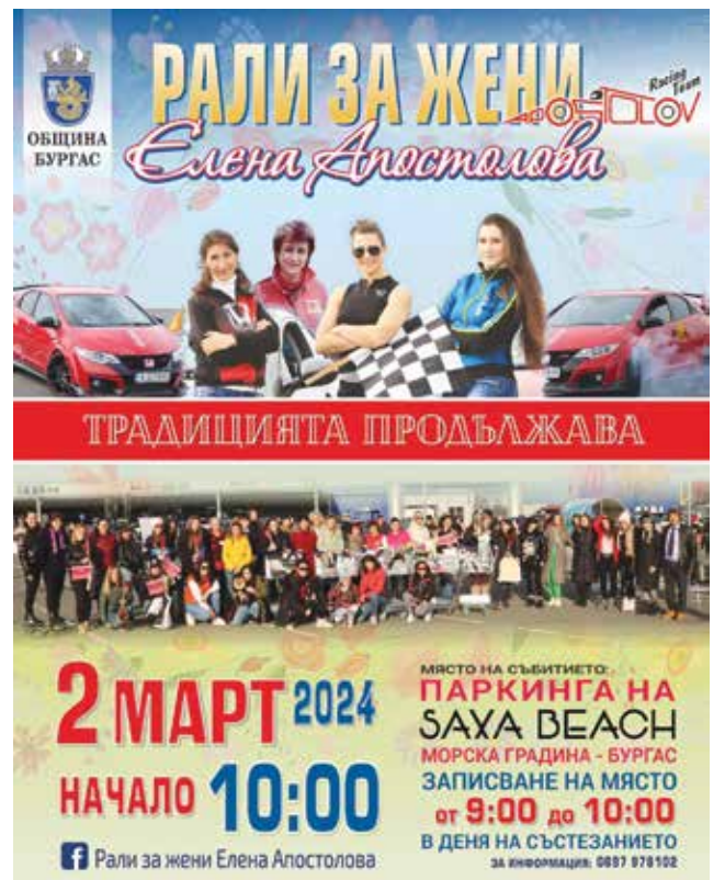
Надпреварата се е превърнала в годините в една от традиционните атракции на Бургас в навечерието на Осми март