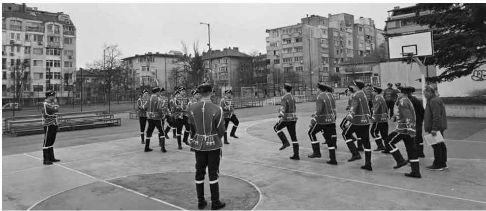
Гвардейците на Електро поддържат форма с чести марширувания в двора на училището