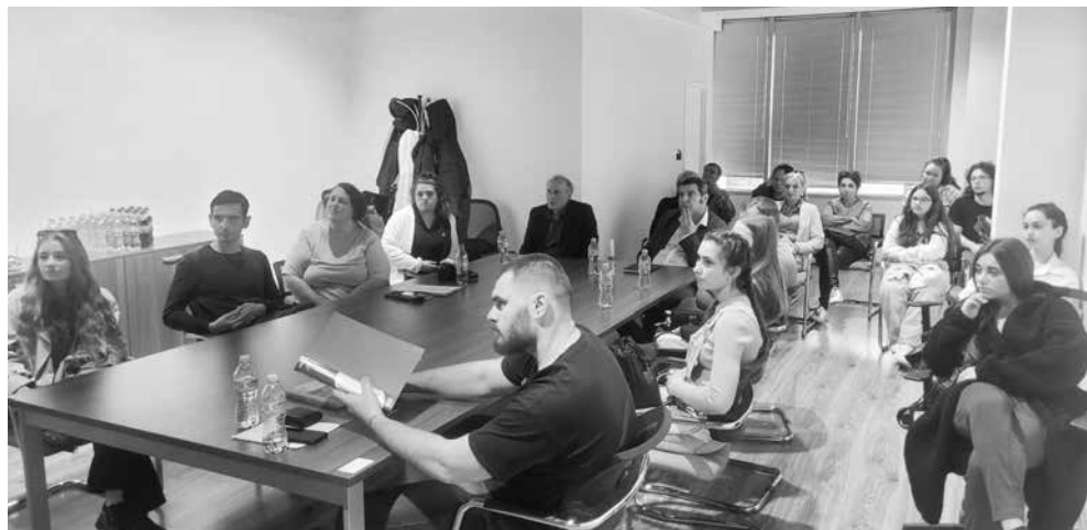
Момент от студентския живот