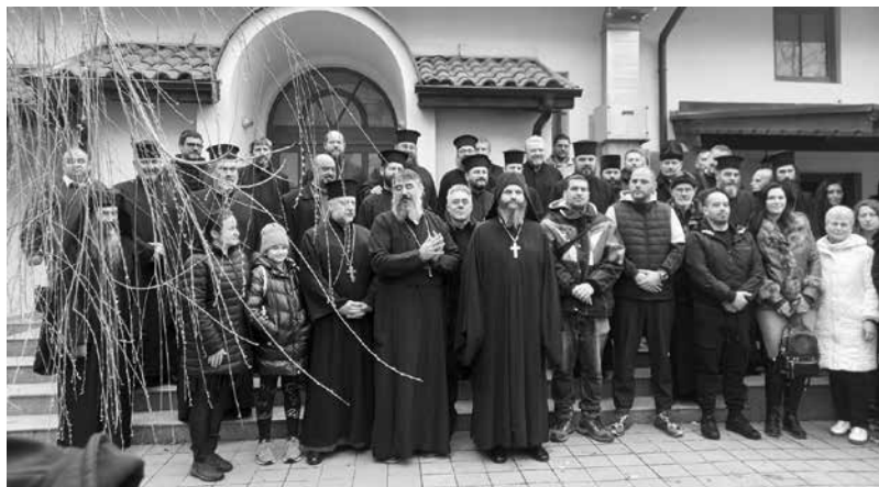
Ако се посочат двама, къде е демокрацията, е мотивът на миряни и духовници

Свещениците отговориха на нападките: Не сме разколници