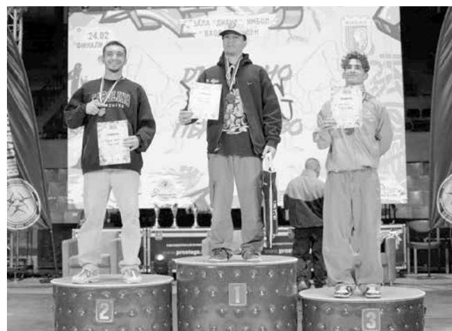
Бургаският клуб „Бляк Стайл Скуад“ спечели общо 4 златни медала, 2 сребърни, един бронзов и две купи от отборно представяне