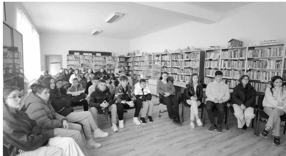
Онлайн срещите на младши посланиците на ЕП продължават