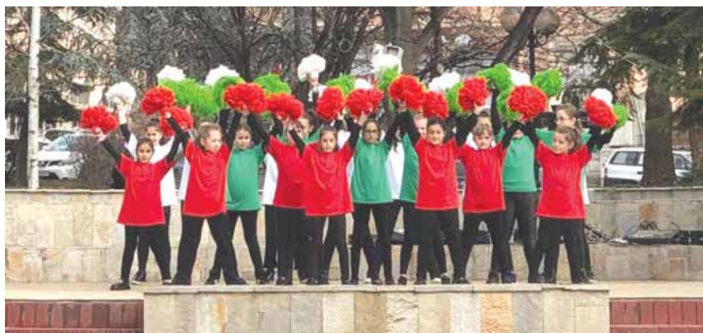
Танцът „Бяло, зелено, червено“, емблематичен за НЧ „Васил Левски 1869“ – Айтос

На 01.03.2024 год. (ПЕТЪК) от 17.30 часа в салона на читалището.