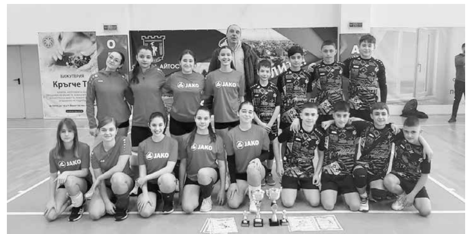
Следващият етап за ботевци са Областните игри в Бургас