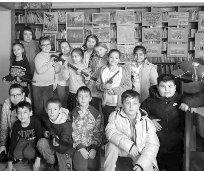
На „Урок по родолюбие“ в библиотеката

спираща дѣха беседа, с изложба на снимки и картини, които досега не са виждали,