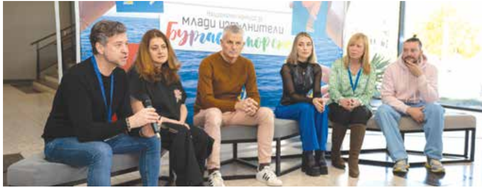
Журито разяснява идеята на новия конкурс, който допълва традиционния.