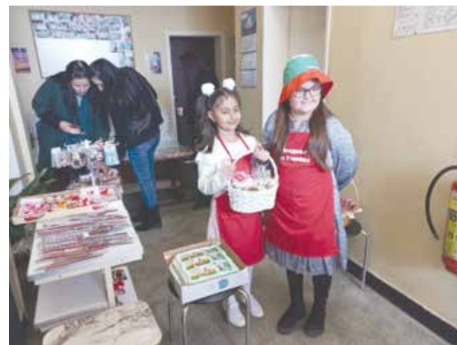
„Продавачи на усмивки“