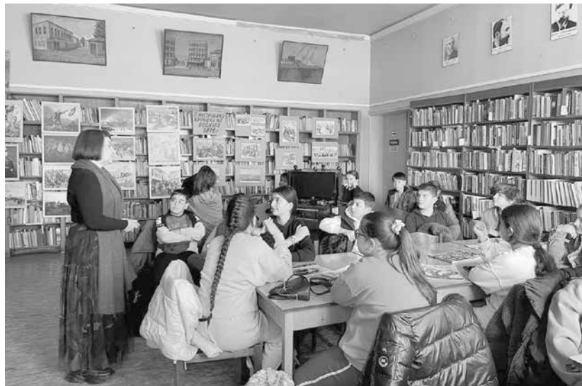
Всеки „урок“ е интересен за децата, заради нетрадиционния начин на „преподаване“

И тази година традиционната читалищна инициатива има за цел да пробуди интереса на децата към местната и българската история, към знакови за Айтос и България личности, към исторически събития, свързани революционните