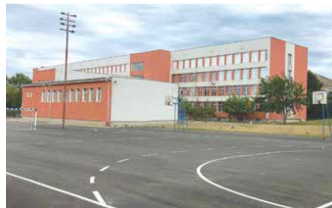
И в двора на СУ „Никола Вапцаров“ ще има ново, модерно спортно съоръжение