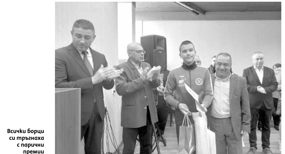
Всички борци си тръгнаха с парични премии