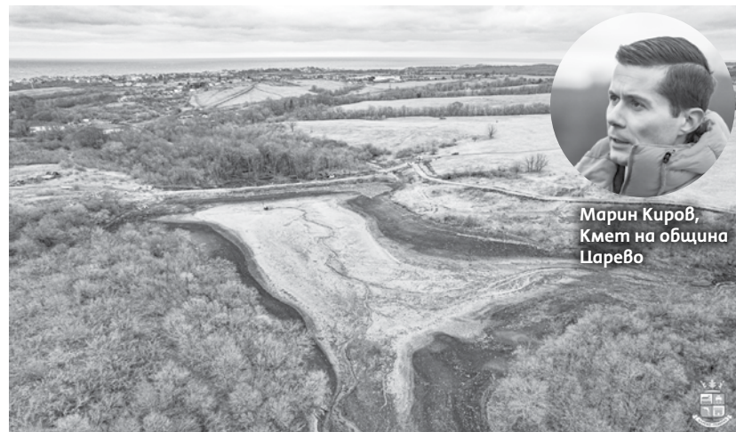
Марин Киров, Кмет на община Царево

По време на наводнението през септември м.г. бяха разрушени стени на двата язовира в община Царево