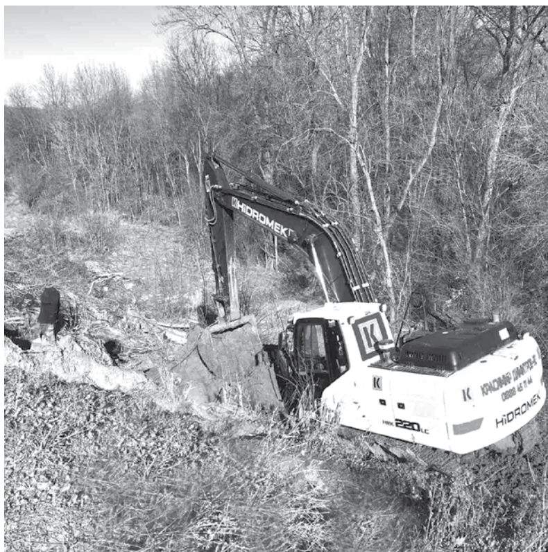
Работи се по почистване и работа на терен при язовир „Потурнашки“