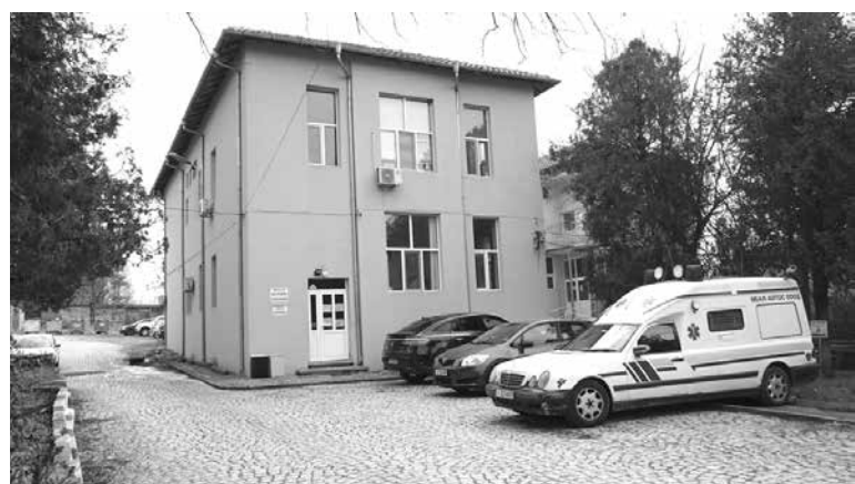
Вътрешно отделение на МБАЛ – Айтос