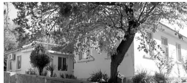
За напълно обновено и оборудвано през 2023 г. Инфекционно отделение на МБАЛ Айтос, бюджетът е предвидил средства за нов покрив

– ППР – проект основен ремонт на улица №3 в с. Тополица