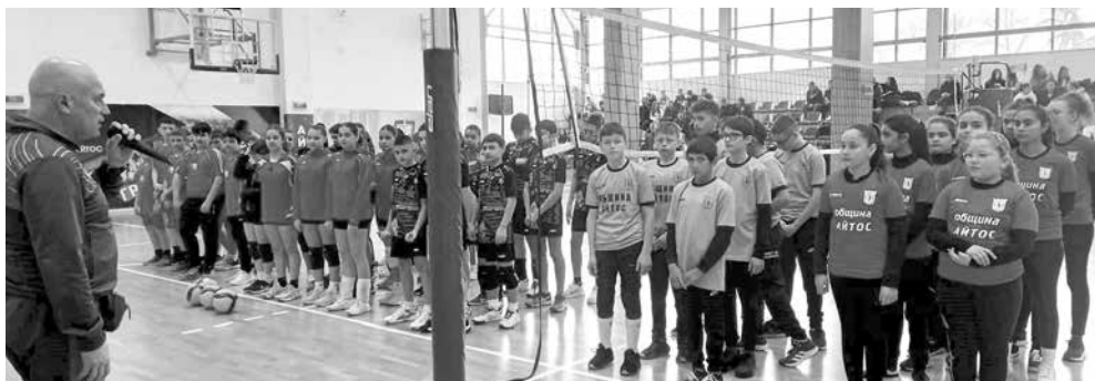
В зала „Аетос“ – началото

Във възрастовата група V-VII клас момичетата, победа извоюва отборът на СУ „Хрис-