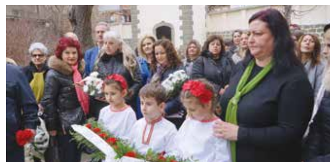
Приемственост. Традиция за Айтос е детските градини да подготвят програмата за честването на 19 февруари