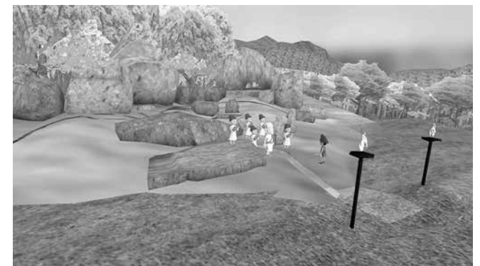
Героят посещава тракийско светилище