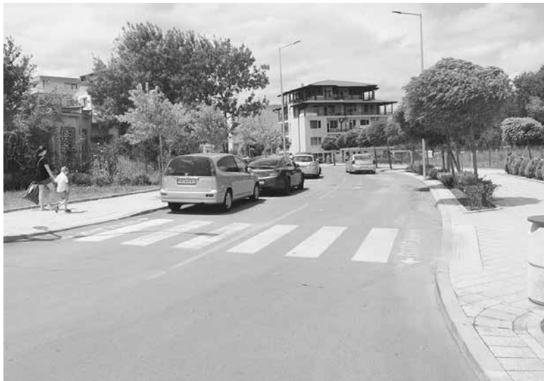
Община Приморско ще търси повече възможности за паркиране с въвеждането на синя зона

от своя страна ще даде възможност, когато някой влезе на територията на Приморско или Китен и иска да се разходи, да разгледа града, да може да си паркира колата, като междуременно си пусне СМС. Смятаме да сложим и паркомати, чрез които чужденците да могат да ползват услугата. Идеята е да дадем възможност за интелигентно паркиране в централната част на двата града“, обясни градоначалникът.