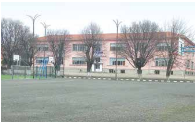
Оказа се, че в двора на СУ „Христо Ботев“ ще изградят не една, а три спортни площадки