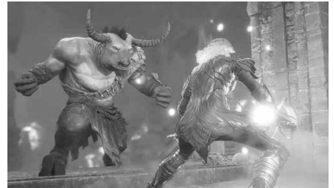
Ролевата игра получи много високи отзиви от фенове, които по принцип не играят такъв тип игри

ти герой) и още няколко похитени успявате да се измъкнете. След това оцелелите сформирате група, чиято основна цел става намирането на лек за премаване на паразита, който сега удобно се е загнездил в мозъците ви и всеки момент ще ви превърне в чудовище.