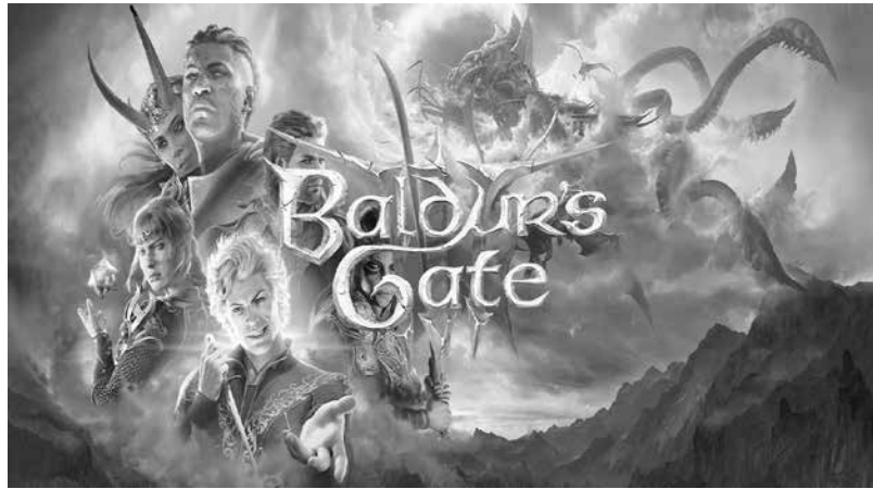
Корицата на играта, на която са изразени част от героите, с които можеш видиш историята