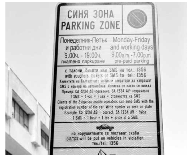
На табелите ще бъде поставен кодът, който ще се сканира

Отново чрез мобилно приложение ще може да се плащат и глобите за скоби.