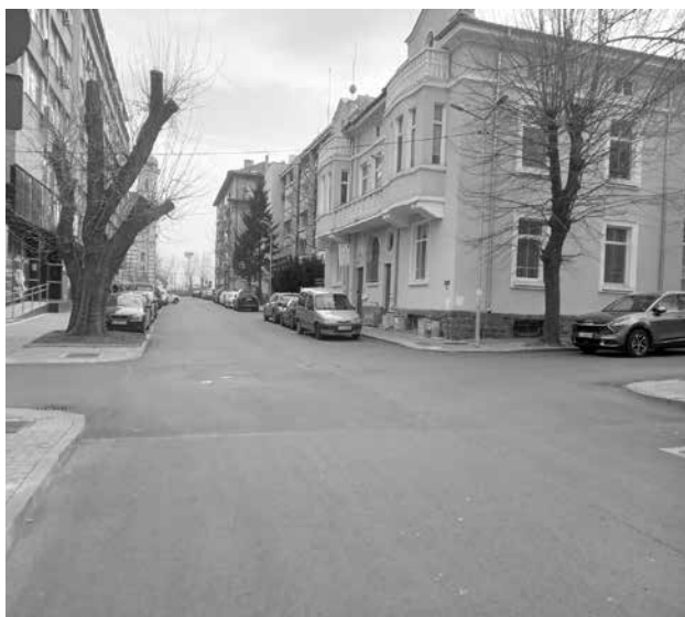
Нерегулираното кръстовище изправя на нокти бургазлии и гости. Тук всеки си мисли, че е с предимство

По предложение на съветниците от ПП – ДБ предстои да се поставят съответните пътни знаци за регулиране на движението, така че движещите се пътни превозни средства по ул. „Цар Иван Шишман“ да бъдат задължени да пропускат движещите се ППС по ул. „Шейново“, взеха решение на последната сесия общинските съветници.