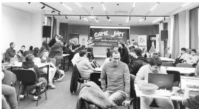
Участниците разполагаха с 48 часа, за да догат живот на игрите си

Както всички андроид игри, и тази има пълна версия, в която са включени всички нива и е без реклами, прекъсващи забавлението. Пълната ѝ версия обаче е платена – 2.99 лева.