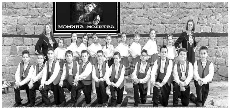
Клуб „Млади възрожденци“ от IVБ клас при СУ „Никола Й. Вапцаров“

Спектакълът е посветен на националния празник Трети март и 146 години от Освобождението на България.