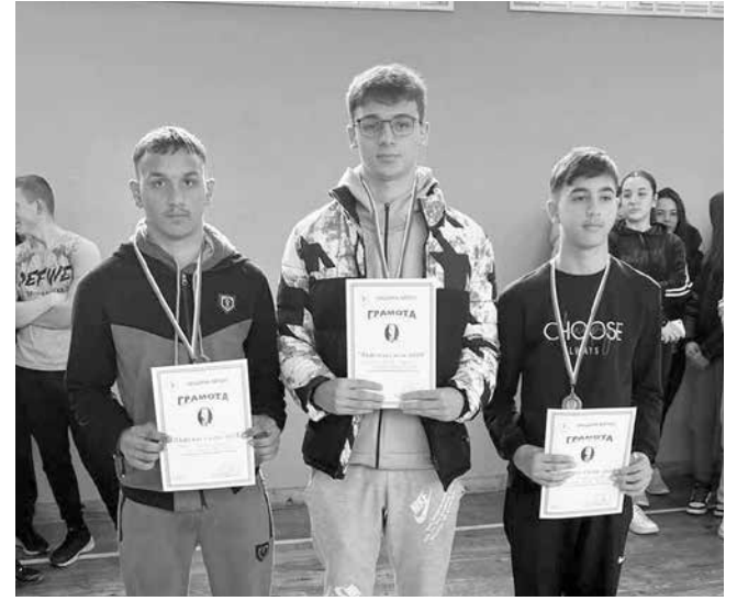
Традиционно скоковете се провеждат в База 2 на СУ „Христо Ботев“