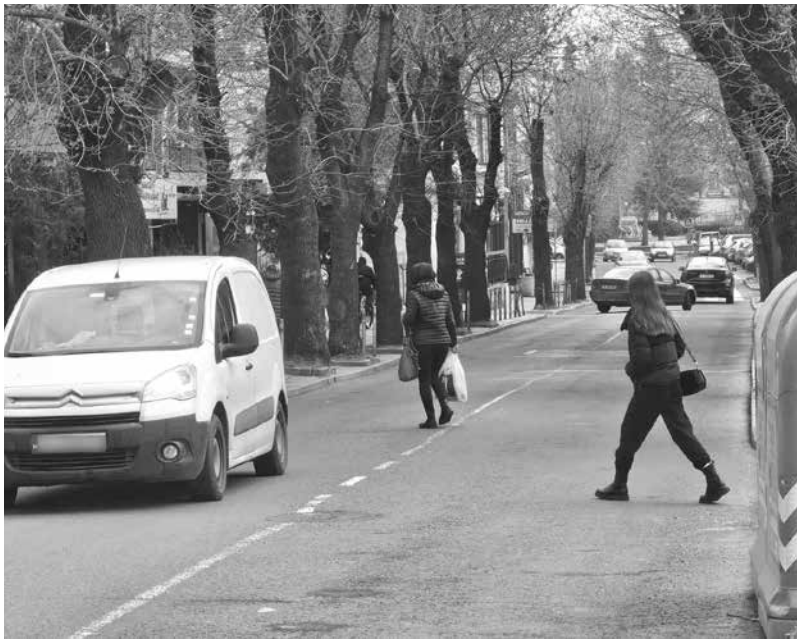
В бъдеще „Васил Левски“ може да стане пешеходна зона

„Увеличавайки периода, в който са валидни като зелената, която ще работи целогодишно, по никакъв начин няма да реши проблема, просто ще се взимат повече пари от гражданите“, сметна тя.