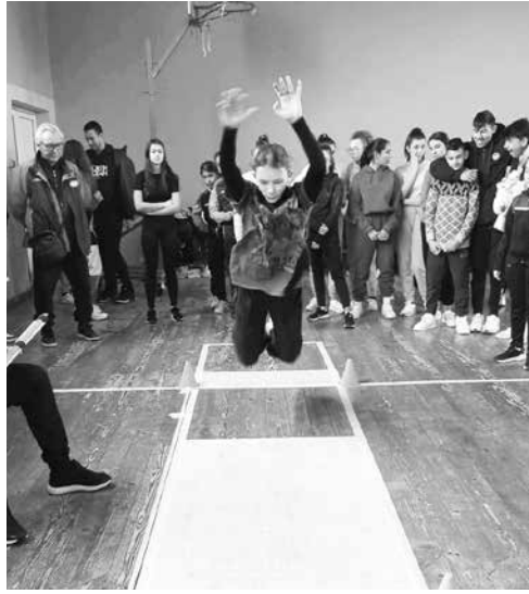
В годините интересът към състезанието расте