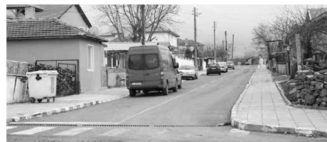
Не се е случвало до сега - бюджетът отделя средства за проект на улично осветление в населените места в община Айтос. На снимката: Поредна улица с асфалт ще има с. Пещерско – за основен ремонт са планирани 70 000 лева