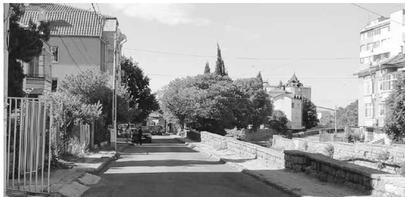
За реконструкция на ул. „Димитър Благоев“ – 380 155 лева