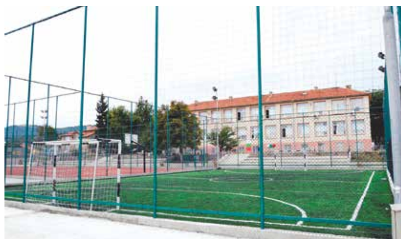
ОУ „Св. св. Кирил и Методий“, с. Карагеоргиево има най-доброто спортно съоръжение – многофункционален спортен комплекс