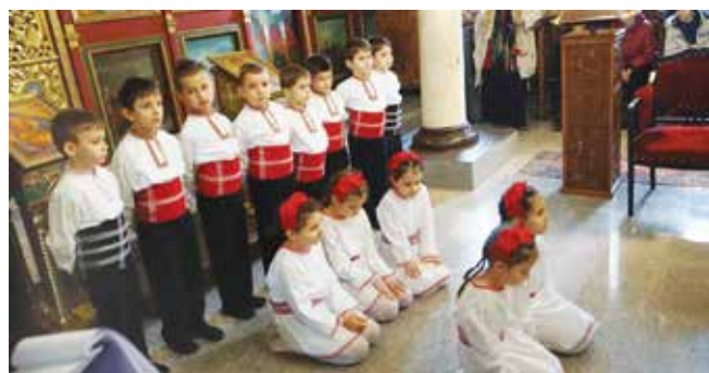
Деца от IV А група на детска градина „Радост“