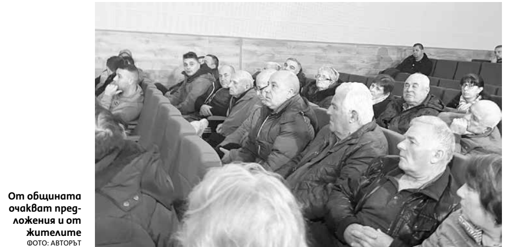
От общината очакват предложенията и от жителите

Джобове за контейнерите – проектът предвижда пред всяка коопера-