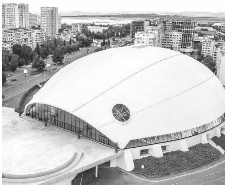
Турнирът ще се проведе в зала „Арена Бургас“ между 15 и 17 март

„Черноморец“ ще е домакин на турнира за Ефбет Купа на България през сезон 2023/2024. Нагребарата ще се проведе в зала „Арена Бургас“, като бе прието решение това да стане в периода 15-17 март. Новината бе съобщена официално в сайта на Българска федерация по баскетбол.