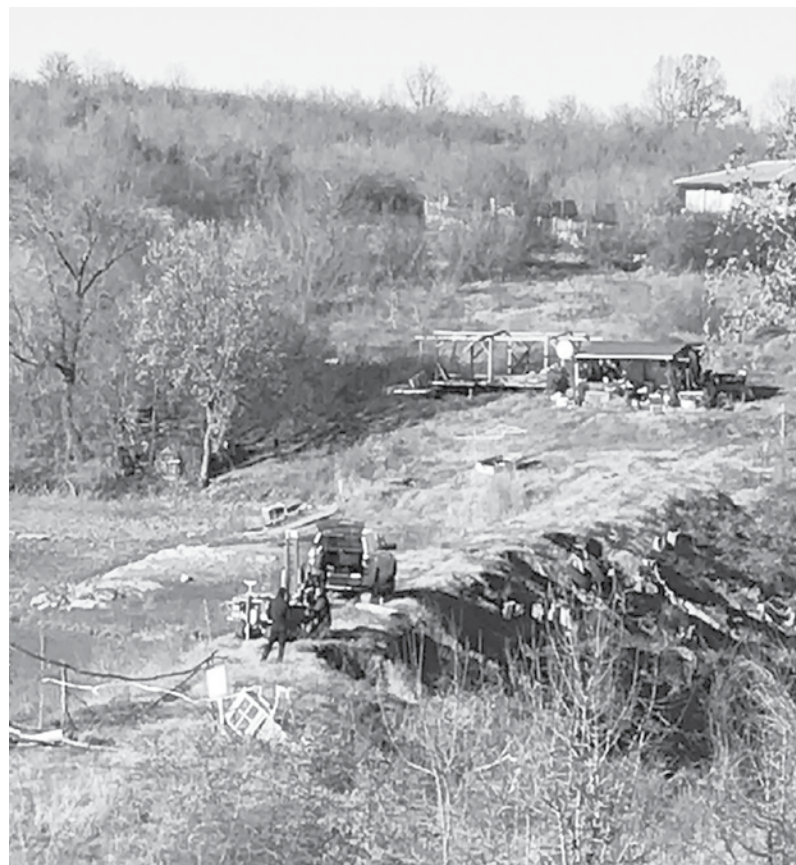
Обследването на язовирите

При проверките се съставят констативни протоколи, с които на собствениците се дават задължителни предписания по техническата документация и осъществяването на безопасна техническа експлоатация на съответната язовирна стена и съоръженията към нея, с указани срокове за изпълнението им, поясняват още от Агенцията.