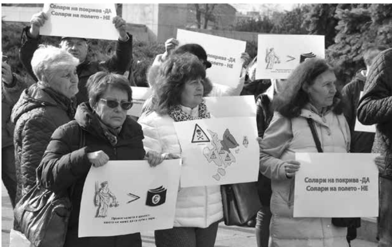
Жители на община Средец пристигнаха с плакати и кошери, не желаят индустриализация на района

Протест. „Не желаем да се погребва поминъкът ни за 50 години напред“, заявиха те