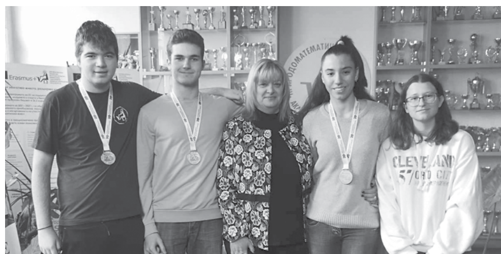
Перспективите пред всеки един от тези млади хора са големи

Имам една неосъществена мечта – да преподавам математика на немски език