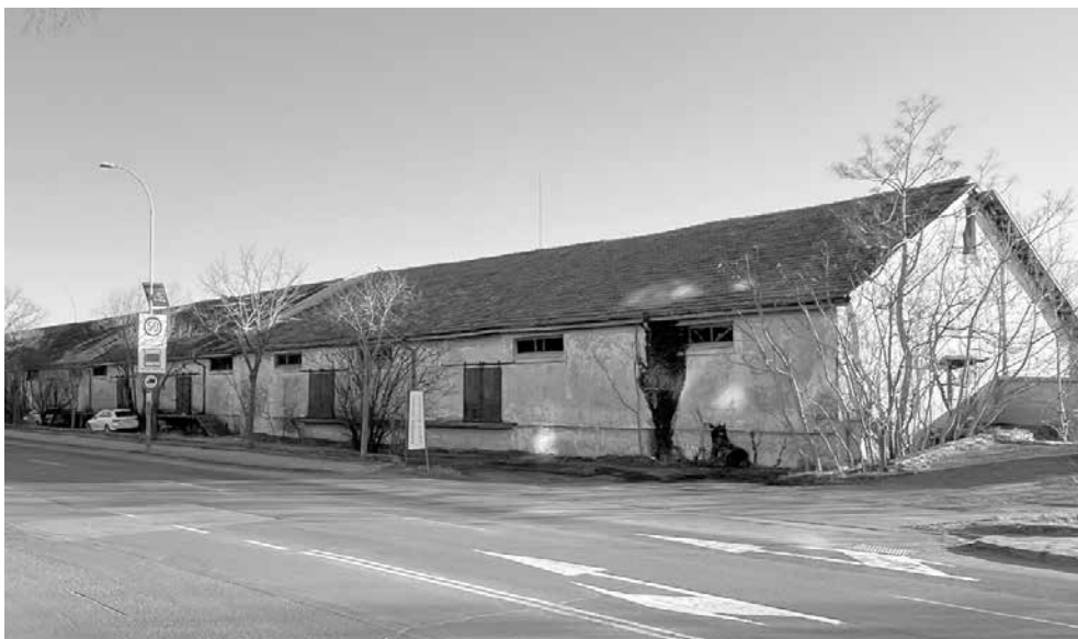
Жълтият склад, под който се намират 3,6 дка общинска земя