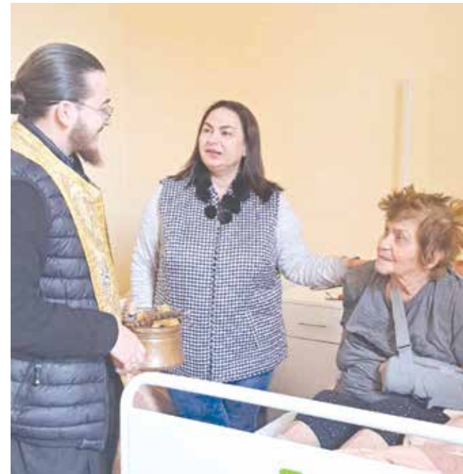
Отец Ромил в разговор с пациенти на отделението