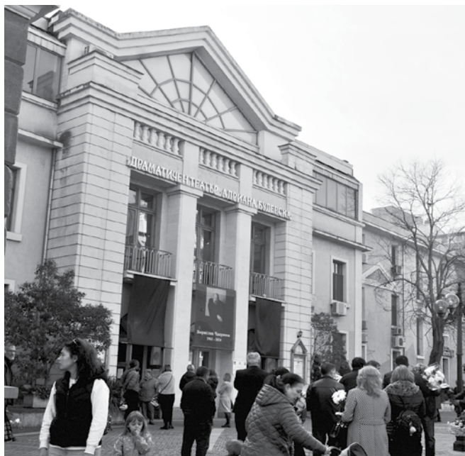
Целият театрален елит пристигна да се сбогува с режисьора и директора на Театъра в Бургас