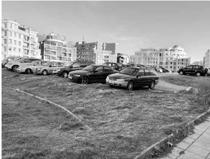
Капката в Поморие – едно от местата, коментирани за строежа на бъдещата малка спортна зала в града, се оказва неподходящо