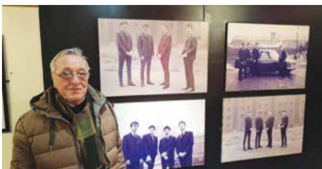
В музея „Историята на Бийтълс“ може да разгледат специални изложби, автентични сувенири и ексклузивни снимки

богатството. Репликите на улица „Матю“, студията „Ейби Роуд“ и „Кавърн“ пресъздават автентично началото на 60-те години, като позволяват всеки лично да се докосне до мекетата, които са помогнали на „Бийтълс“ да се превърнат в най-великата група в света. Посещавайки музея „Историята на Бийтълс“ в Ливърпул, феновете може да разгледат специални изложби, автентични сувенири и ексклузивни снимки, както и още много други неща, които има в този най-награждаван музей на „Бийтълс“ в Ливърпул.