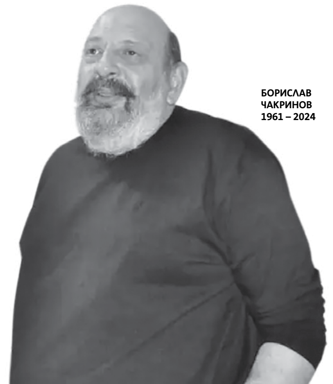
БОРИСЛАВ ЧАКРИНОВ 1961 – 2024

„Той правеше всичко за бургаския театър, постави го на национална и международна