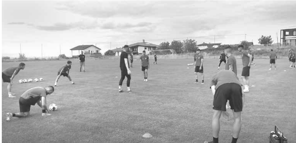
С това допълнително финансиране издръжката на клуба от страна на Общината става почти половин милион лева