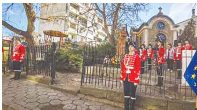
Гвардейците на СУ „Христо Ботев“ с тържествен ритуал отдават почит на освободителите