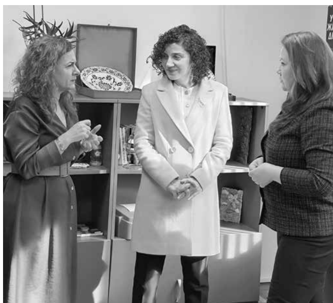
Конструктивният диалог предполага нови срещи и задълбочаване на контактите