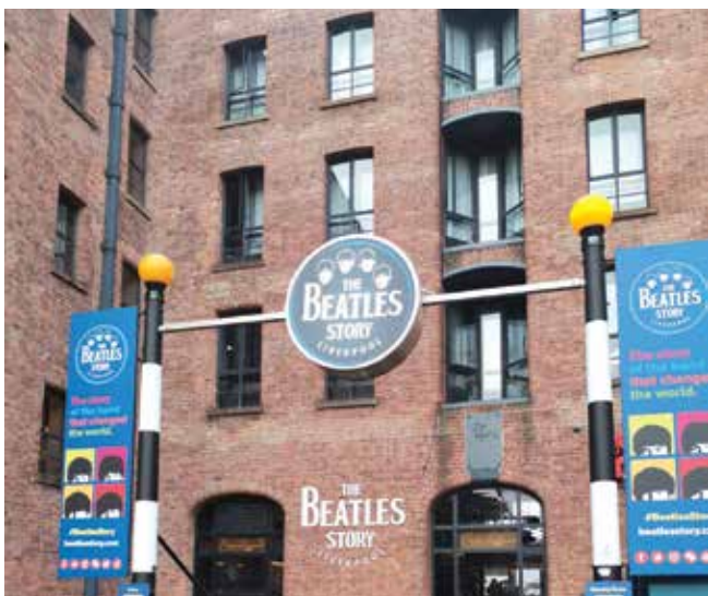
В града на Бийтълс задължително трябва да се посети музея на великата музикална четворка