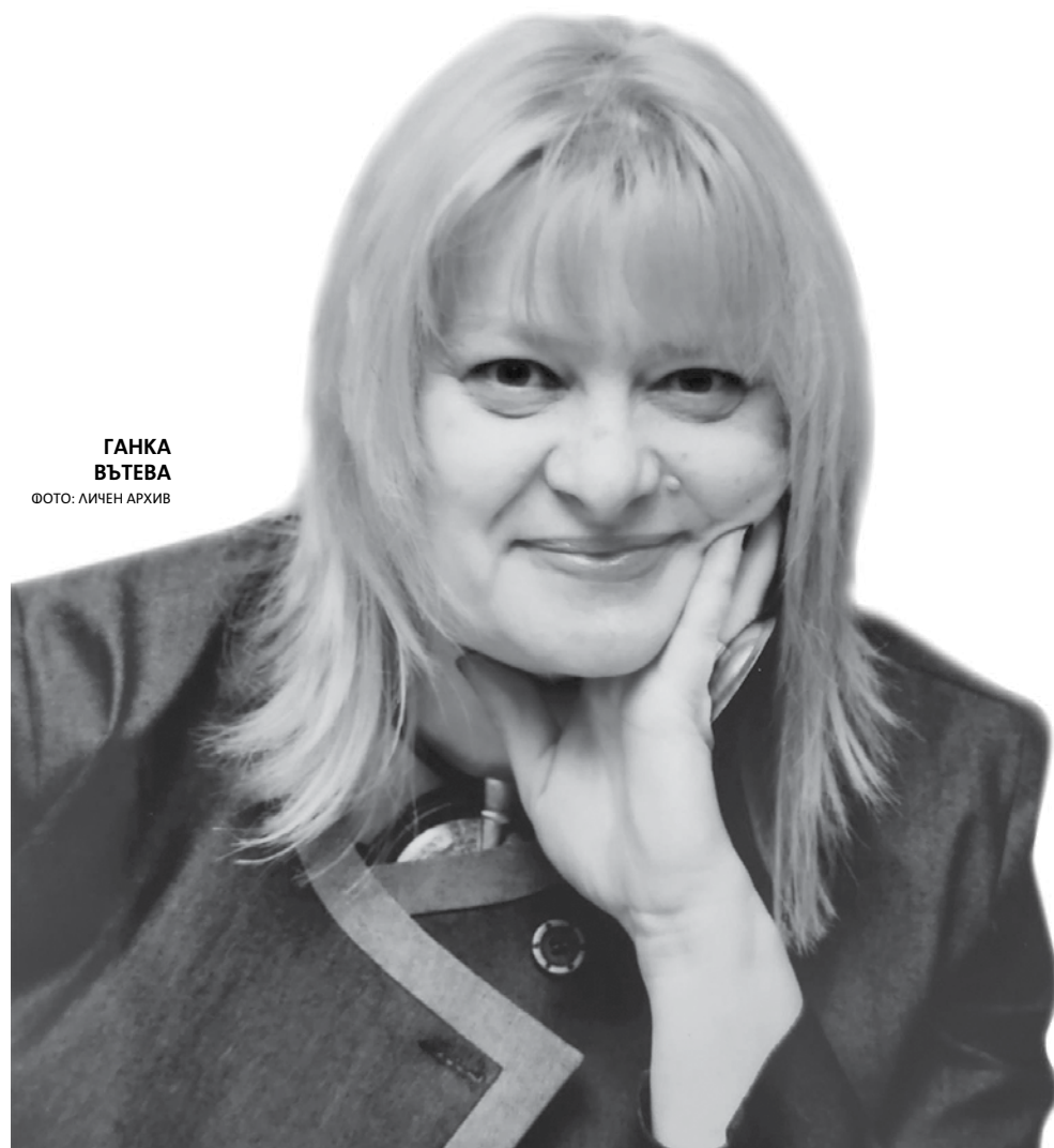
ГАНКА ВЪТЕВА