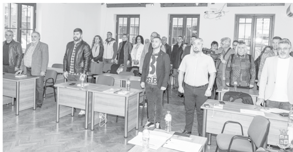
С пълно единодушие от присъстващите общински съветници бе приет бюджетът на община Царево за 2024 г.