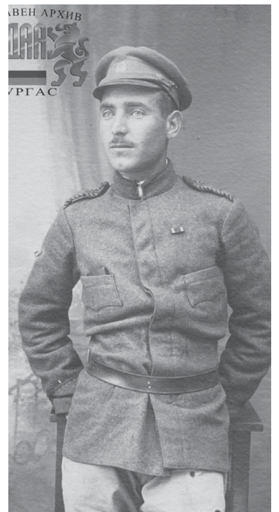
Участник в Първата световна война 1917 год.