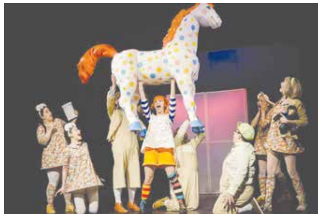
Сцена от представлението