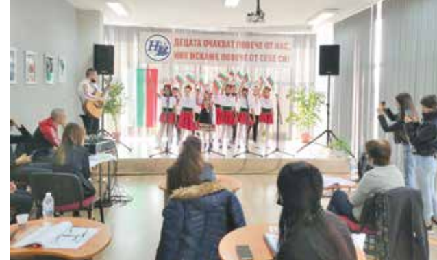
Традиционен общински конкурс за поезия „Моята България“

16.02.2024 г. – Отбелязване 151 години от зибелта на Васил Левски. Място и час: ОУ „Христо Ботев“ с. Пирне; 13.30 ч.