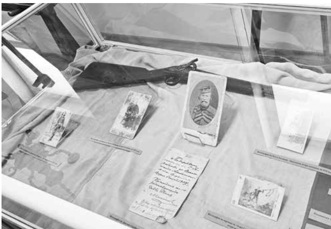
Арсеналът на родните четници

и утвърждаването на националната идентичност.