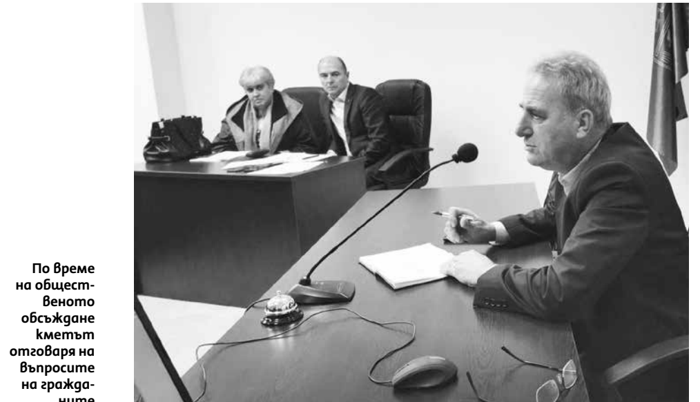
По време на обществено обсъждане кметът отговаря на въпросите на гражданите

– Става дума за т.н. кооперативен пазар, който е разположен непосредствено до реката. Съвсем скоро ремонтираме закритите помещения, които се ползват от производителите и търговците. Но те са крайно недостатъчни. Откритите маси не са мястото, на което да се осъществява търговска дейност навън при зимни