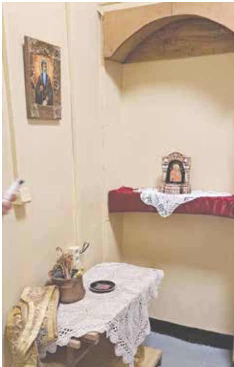
Всички се радват на скромното кътче за духовна подкрепа

От отделението уточняват, че мястото за молитва е на първия етаж, непосредствено до новоизградения външен асансьор. НП