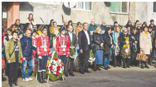
Много айтозлии дойдоха пред параклиса-костница, за да се поклонят и сложат цветя пред символа на айтоското Освобождение