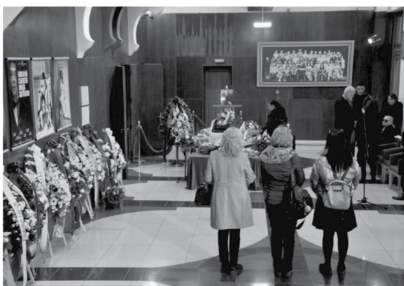
Да си кажат сбогом дойдоха и колежите му от театрите в Сливен и Ловеч

„Питър Пан на българския театър няма да излезне“, каза Димитрина Тенева.