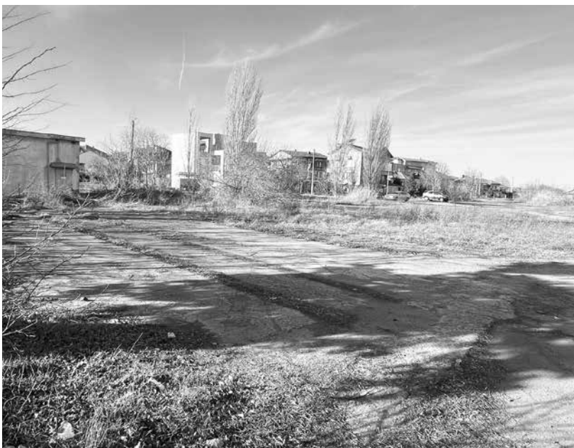
Теренът, частна собственост на „Черноморско злато“ АД, е едно от местата, върху които може да бъде изградено спорт халето – приемник на ханбалната школа в града