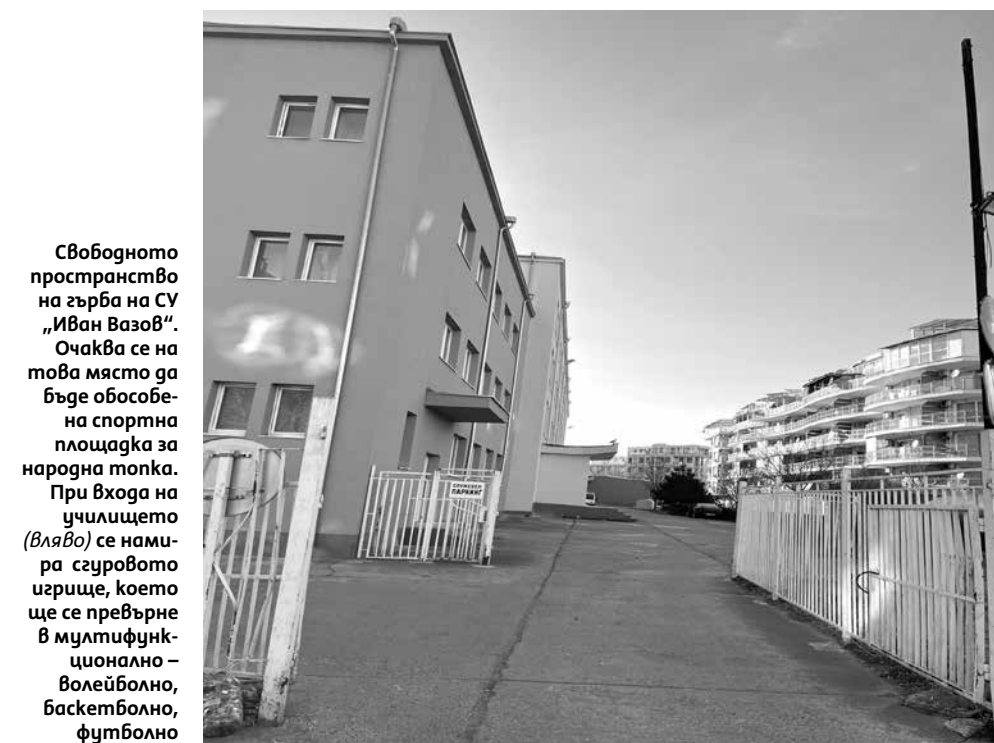
Свободното пространство на гърба на СУ „Иван Вазов“. Очаква се на това място да бъде обособена спортна площадка за народна топка. При входа на училището (вляво) се намират сгуровото игрище, което ще се превърне в мултифункционално – волейболно, баскетболно, футболно

Хандбалът в Поморие е бездомен. Спортът, който има своята именитата история и традиция в града заслужава подобаваща зала. „Знаете ли, че нашите момчета – шампиони – бяха домакини на турнир в зала „Никола Станчев“ в