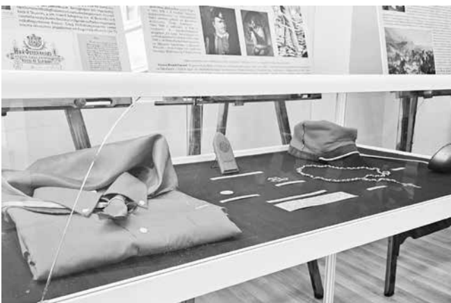
Оригинални униформи, носени от българските гарибалдийци са част от изложбата

Лидери като Гарибалди и Васил Левски представляват идеалите на свободата и независимостта, вдъхновявайки милиони хора да се борят за освобождението на своите нации. Техните усилия и жертви отразяват волята на народа за самоопределение и противопоставяне на тиранцията, като поставят основите за формирането на модерни нации