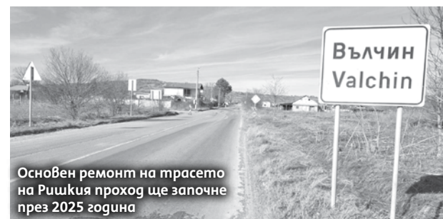
Основен ремонт на трасето на Ришкия проход ще започне през 2025 година