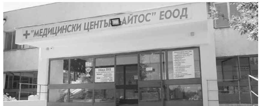
„Медицински център I“ ЕООД – Айтос