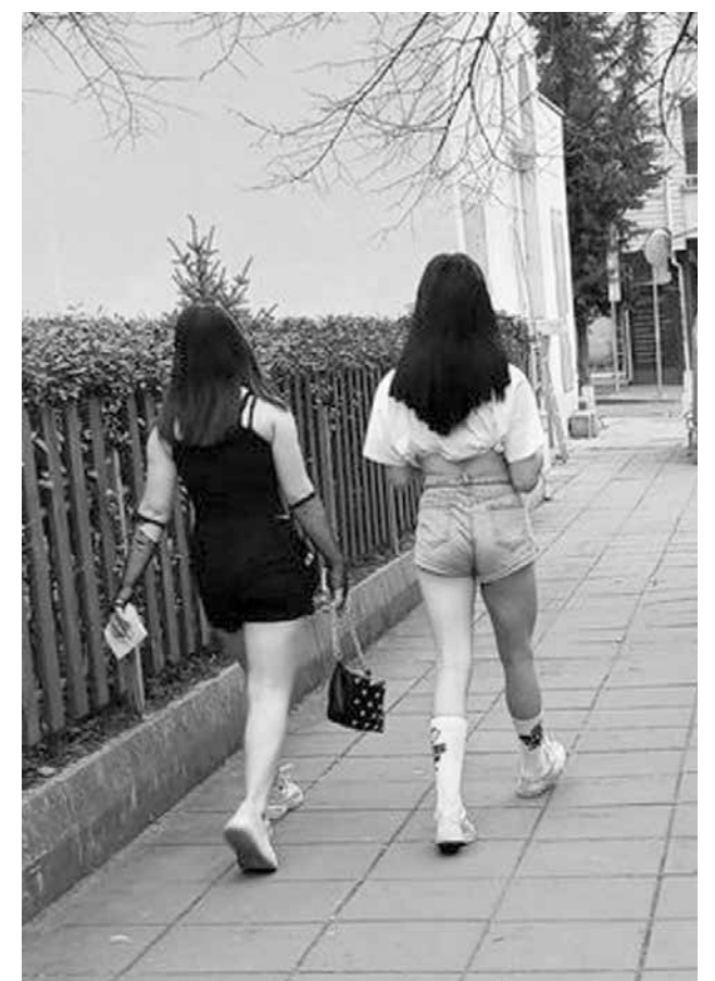
Младите хора се разсъблякоха през февруари

Гостите са впечатлени от проекта на ПГМЕЕ, който е изложен в сградата на управлението. Той е дело на ученици от паралелка, в която се изучава заваряване и недвусмислено показва, че чрез заварки може да се твори изкуство.