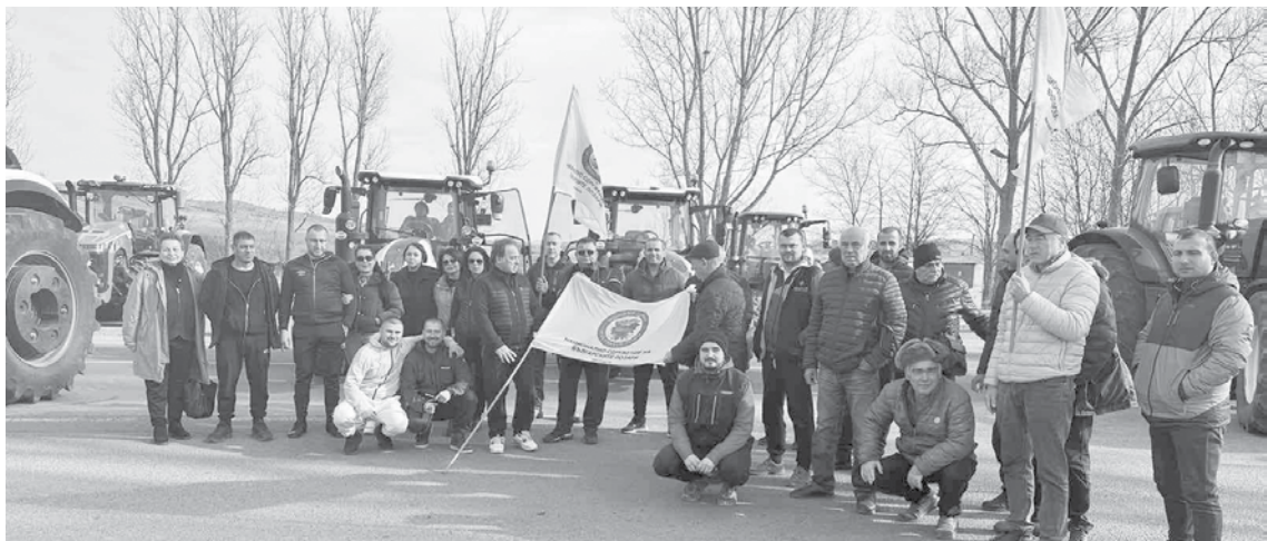
Фермерите настояват за адекватни закони и норми

Въпроси. Защо трябва да ядем ябълки от Нова Зеландия за 6 лева