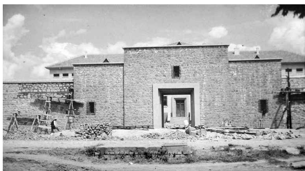
Бургас, порталът на Окръжния затвор в строеж, 1935-38 г.