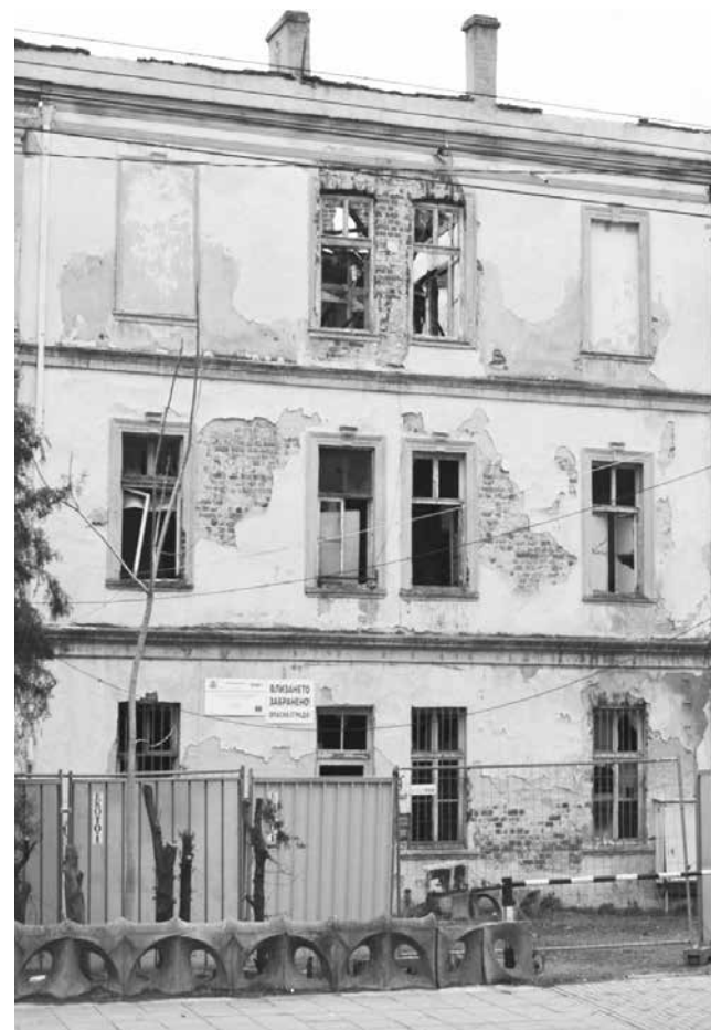
Според запознати в тази сграда ще влезе част от администрацията на службата

Веднага след встъпването в длъжност като областен управител преди няколко месеца той се заема с решаването на проблема с рушащата се сграда. Провежда срещи с няколко министерства, на една от които става ясно, че МВР в Бургас се нуждае от допълнителна постройка за нуждите на пожарната. Процедурата е към своя финал, а Министерството със сигурност ще вдъхне нов живот на този имот и ще бъде решен дългогодишен проблем на Бургас.