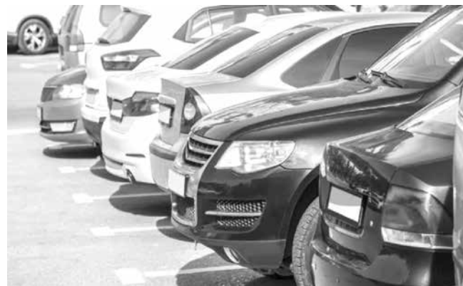
Държавата търси единствено по-нови автомобили за собствено ползване