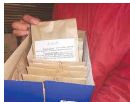
Местонахождението и начинът на използването на всяка билка са грижливо изписани върху пакетите