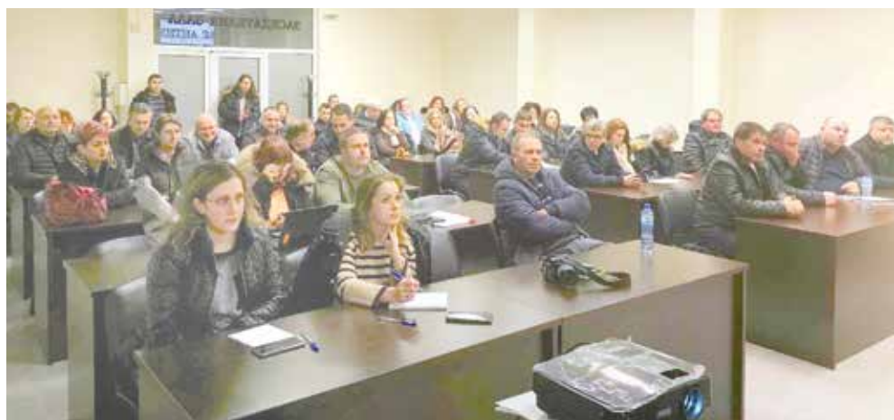
Общественото обсъждане в Заседателната зала на Община Айтос

мрежа са заделени най-много средства. За окончателното завършване на основния ремонт на ул. „Богорци“ са предвидени 162 569 лв. 671 хил. лв. са за 2024 г. средствата за изграждане и рехабилитация на улици, паркинги и тротоари в Емировския квартал. Това са заложените средства, с които благоустрояването на квартала ще бъде окончателно завършено през тази година.