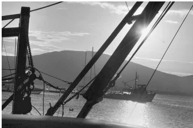
Рибарите са основните, които ще бъдат потърпевши