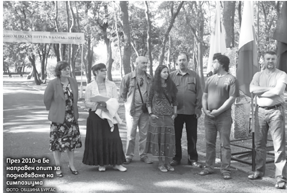
През 2010-а бе направен опит за подновяване на симпозиума