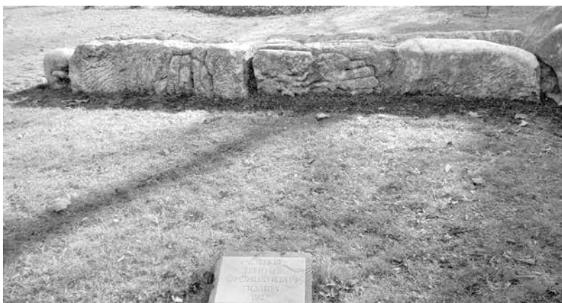
„Човекът“ на поляка Збигнев Фронциевич е в перманентно полежало състояние