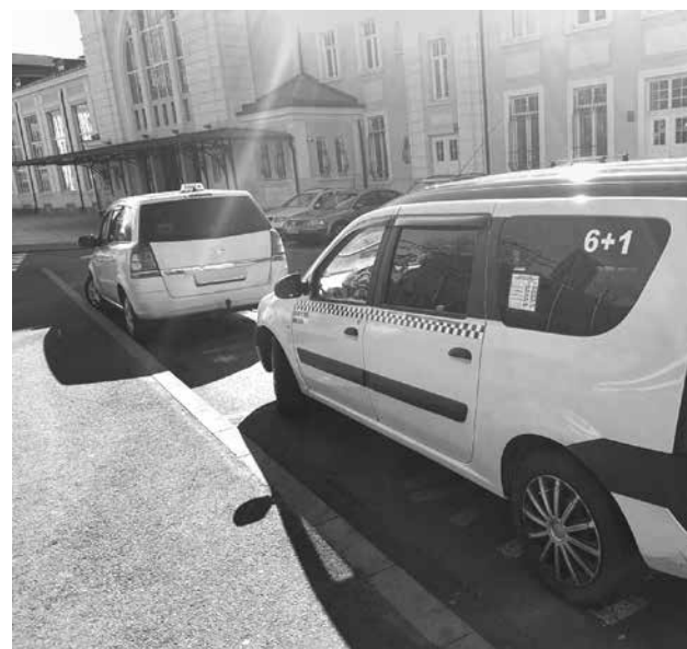
Шофьорите се оправдаха с инфлацията за по-високите тарифи