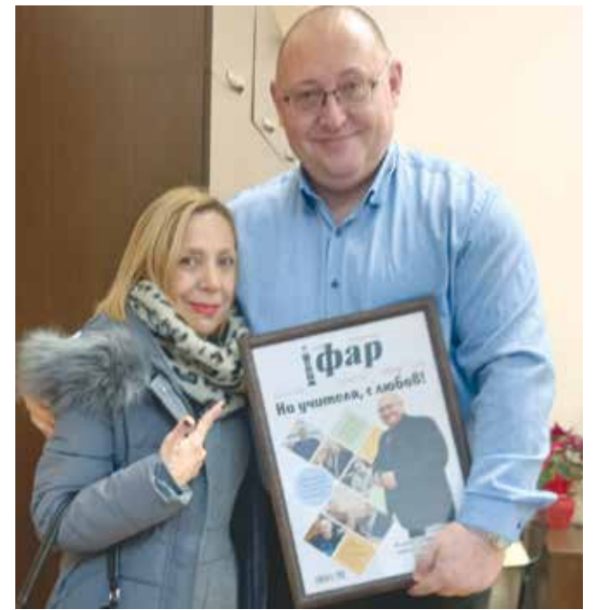
„Черноморски фар“ му подари специален брой от вестника

Последното заседание премина в толерантен и конструктивен тон, а това е най-голямото признание за качествата на председателя. В приятелските среди той е известен с прозвището Учителя, както и с това, че обикновено се изразява с притчи.