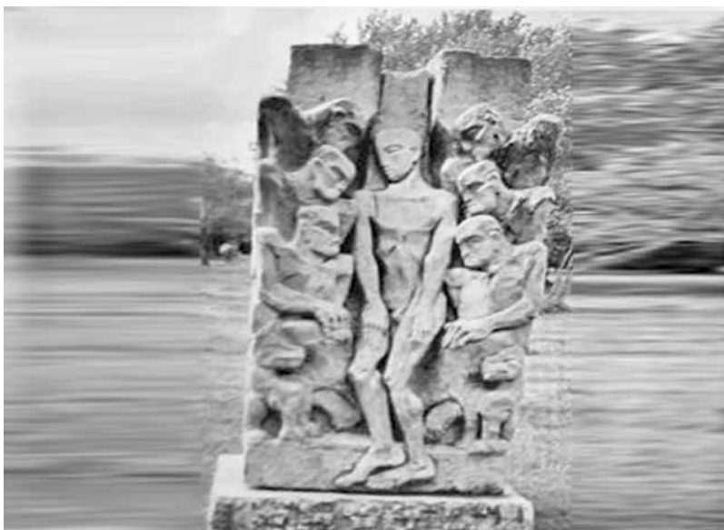
Друга спешна за реставрация скулптура от неизвестен автор