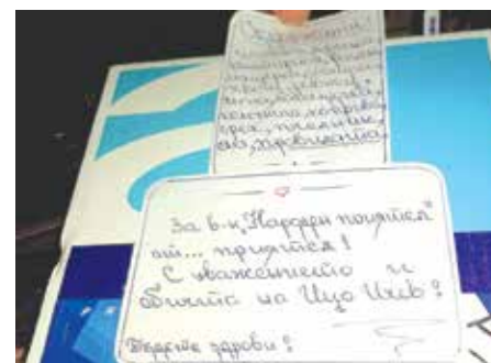
Специален подарък за „Народен приятел“ от приятел