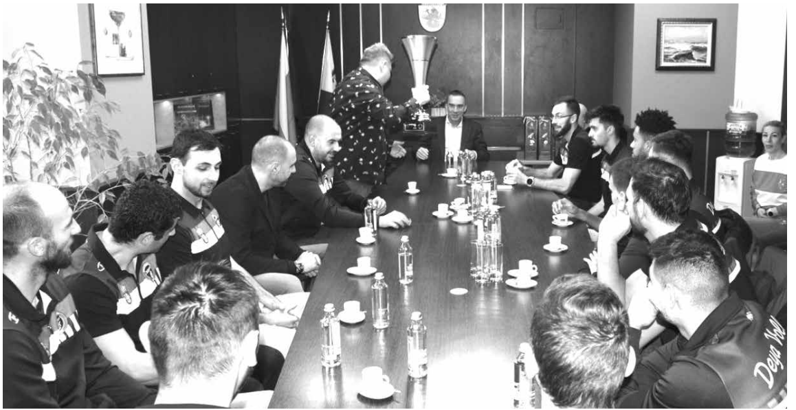
Феновете ще могат да се докоснат до Купата в събота, в зала „Младост“