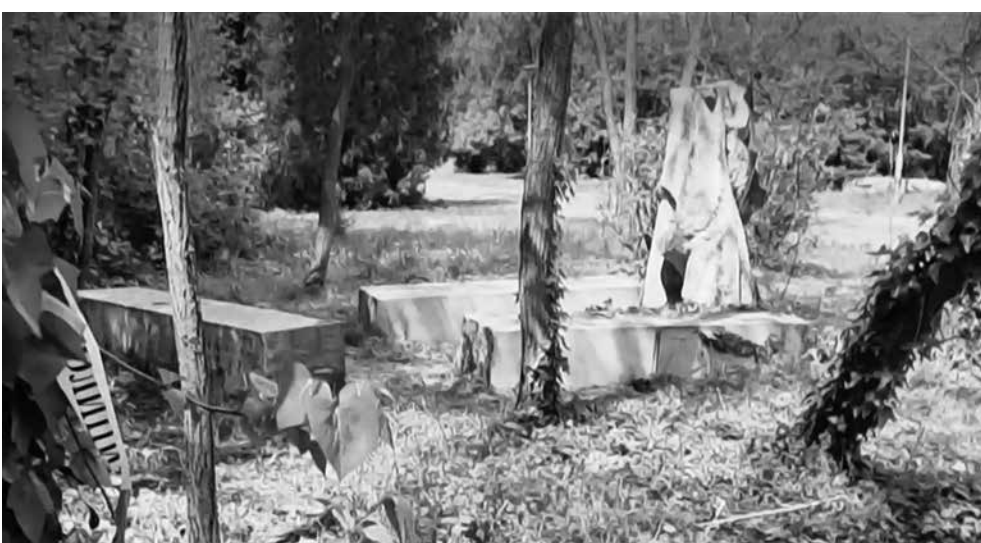
Под тази скулптура загина 31-годишен мъж в опит да си направи селфи