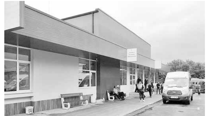
Автогара Айтос. Родителите трябва да занаят, че децата до 14 години пътуват безплатно с само с градския транспорт, но не и по междуселищния

– До този момент, за 12 години, „Айтос автотранспорт“ ЕООД е инвестирало почти 1 000 000 лв. в нови транспортни средства. Това е резултат от нашата дейност, организация и не на последно място – от труда на всички служители в дружеството. Истината е, че от ден на ден става все по-трудно. Фонд работна заплата с осигуровките през 2012 г. за фирмата беше около 14 хил. лв. на месец. За м. януари 2024 г. е 72 хил. лв. В заплати са инвестирани почти 1 млн. лв. за тези години. От 1 януари е в сила новата минимална заплата. В изпълнение на това, от 1 януари т.г. са увеличени заплатите на всички работещи в дружеството, което само за 2024 г., води до 95 хил. лв. допълнителен разход.