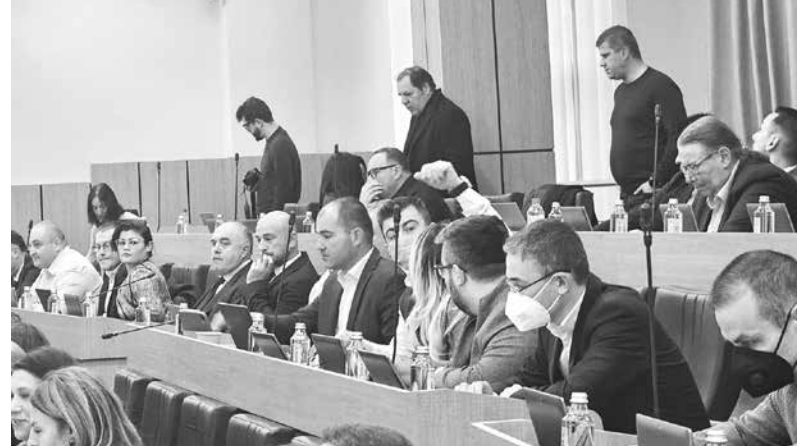
Общински съвет – Бургас вече работи по нов правилник

Заплатите на местните политици остават същите.