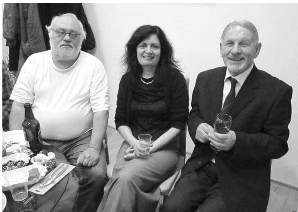
С колеги от писателското гдружество

Такъв човек беше – личен, „на очи“, както казват на село“.