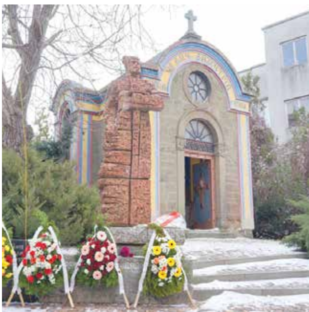
От 26 години Айтоос чества освобождението си в двора на параклиса-костница „Св. Димитър“

Организатори: Община Айтоос и СУ „Христо Ботев“, Айтоос.