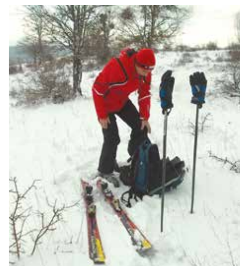
Карането на ски в Странджа – нещо позабранено в годините

Да, Малко Търново не е Банско, но удоволствие (за по-малко пари) може да се изпита и в Странджа при съприкосновение със зимните спортове и красивата планина.