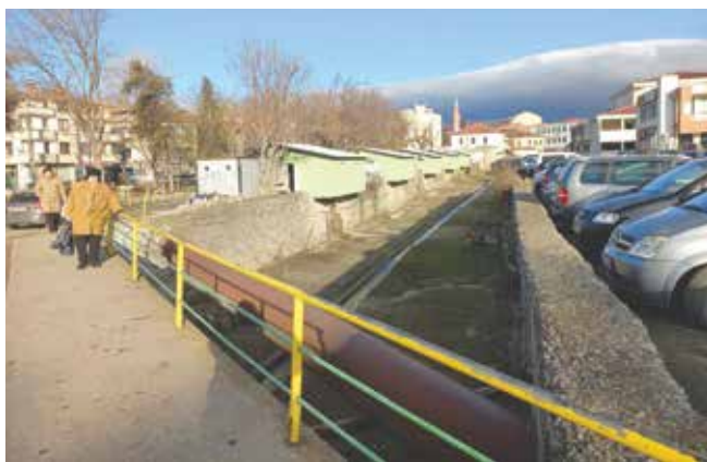
Поглед към реката от моста (до бившата градска баня)