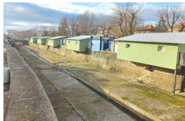
От моста до джамията