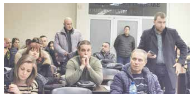
Имаше много въпроси, предложения и мнения по цифрите в проекта

За изграждане на паркинга между ул. „Н. Рилски“ и ДГ „Слънце“ – 206 хил. лв. Предвидени са средства за изграждането на четири детски площадки и за проектиране на една детска площадка – в квартал 5А – 201 хил. лв., в 8А – 158 хил. лв., в кв. 3А – 57 624 лв. и в кв. 191 в Айтос – над 57 257 лв. Предвидено е проектиране