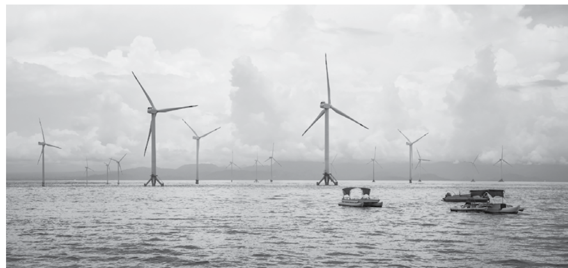
Перките оказват влияние върху морските бозайници, твърдят еколози

В момента има закон за възобновяемите енергийни източници, който не забранява поставянето на перки в морска среда, но явно има някакви интереси, за да бъде внесен специален закон за такива в морски пространства. Според него се предвижда 160 лева на киловатчас преференциална цена, сигурна сума, която производителите получават. Това пряко е в конфликт на интереси с вече инсталираните мощности. На тези, които са построили, държавата няма ангажимент да им се изкупува енергията, а тези в морето задължително ще бъдат с преференции. Има много въпроси, които създават усещане за прокарване на определени интереси на сила.