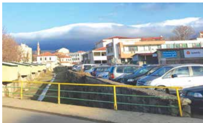
На брега (откъм Бизнес центъра) има терен, на който може да бъде ситуиран паркинз