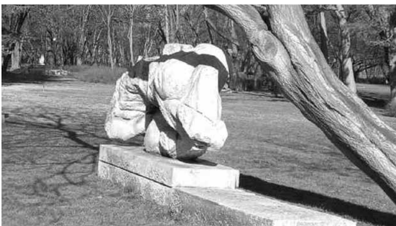
„Жертви на хунтата“ от Иван Славов е една от многото паднали през годините