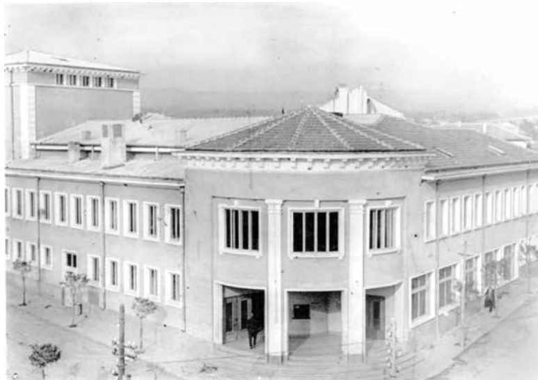
Читалище „Васил Левски“ в град Айтос, 1959 г., (снимката е от архива на читалището) ФОТО: ИМ