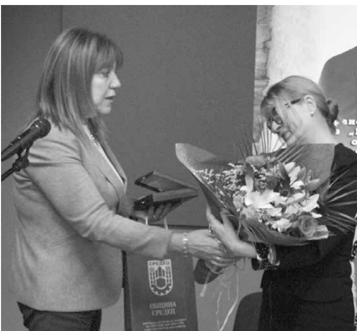
Представители на Община Бургас и Община Средец (вляво) връчват почетните плакети