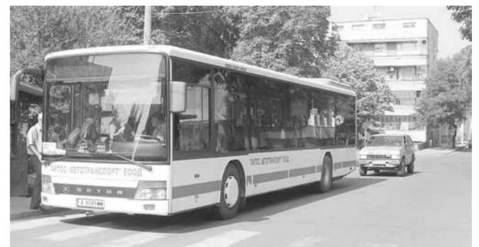
Недостигът на квалифицирани водачи на автобуси е сред основните проблеми на дружеството