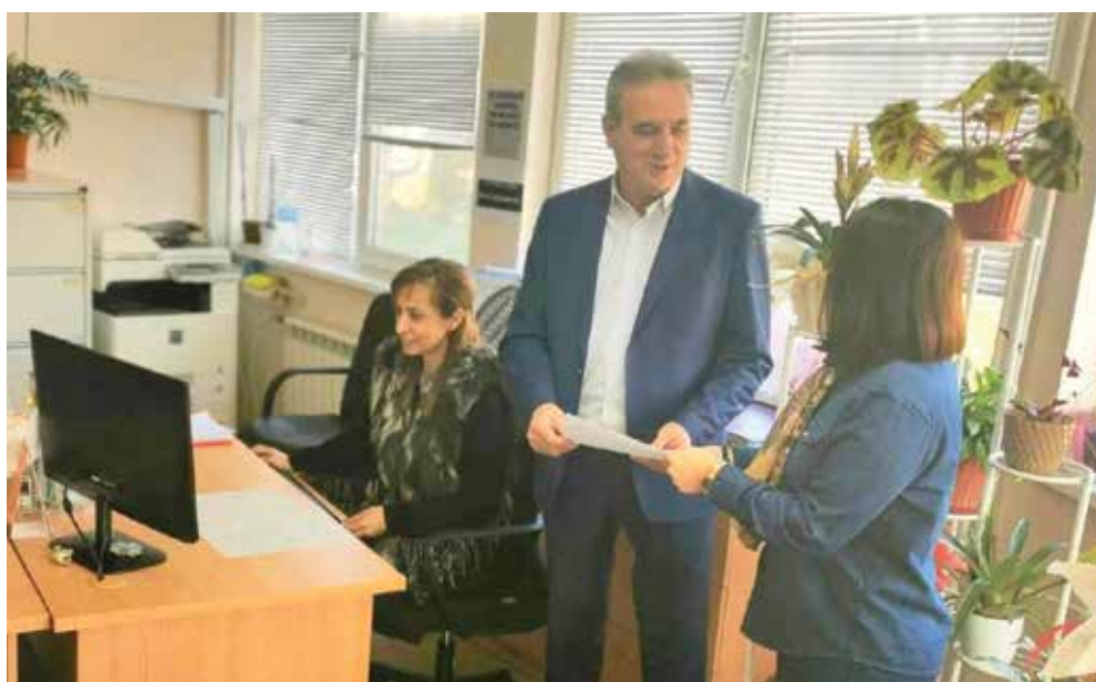
Хаджер получи от кмета документа с точен адрес