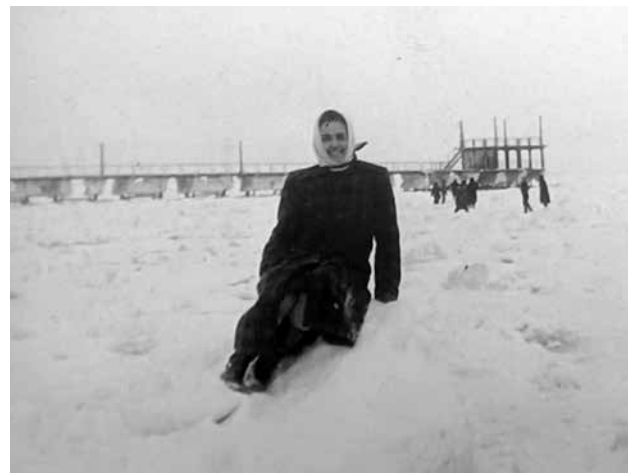
Замръзналото море привличало много хора и мнозина любители на силни изживявания са се разхождали навътре по заледената повърхност

„През 1954 година ледените блокове, идващи по река Дунав, навлизайки в морето, стават гъста сладководна каша,