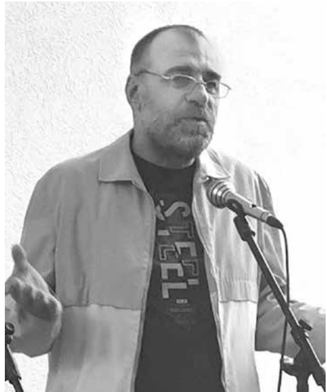
От дълги години Росен работеше като редактор на списание „Море“, издание на Бургаска писателска общност

„Преди петнайсетина години, през една истински мразовита зима, ме връхлетя желанието да отида на