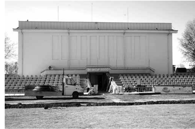
Спортната зала след генералния ремонт

През февруари, кметът получи от Съвета одобрение за нов проект – строителство на нов Дом за стари хора в Айтос. Стана ясно, че старата сграда не може да се приспособи към новите стандарти. С консенсус приключиха и консултациите, насрочени от кмета за определяне на съставите на СИК за изборите за НС на 2 април. Беше отворен и приемът на документи за записване на деца в новопостроената детска градина в центъра на Айтос. Покрай обновената хижа „Здравец“ и текущия ремонт на пътя в местността Къркатлъка, наг с. Тополица отвори врати и ново заведение – „Дивата пчела“.