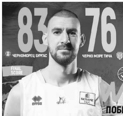
Бургаски остават на върха в класиранието

След победата над „Черноморец“, „Черноморец“ остава на върха на класиранието с актив от 15 победи и 2 загуби. В следващия кръг баскетболистите на Евтимов ще имат нелеката задача с гостуване на „Балкан“ в Ботевград.