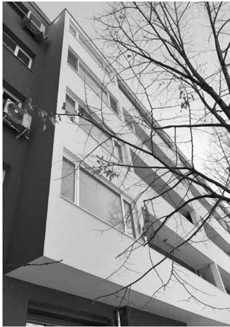
Айтос беше сред водещите общини по програмата за саниране през 2016 г.

Ще припомним, че на 22.12.2023г. беше публикуван списъкът с одобрени проекти за саниране със средства по процедура „Подкрепа за устойчиво енергийно обновяване на жилищния сграден фонд – Етап I“, в рамките на Националния план за възстановяване и устойчивост, който се финансира от Европейския съюз. На същата дата е публикуван и списъкът с резервните проекти по същата проце-