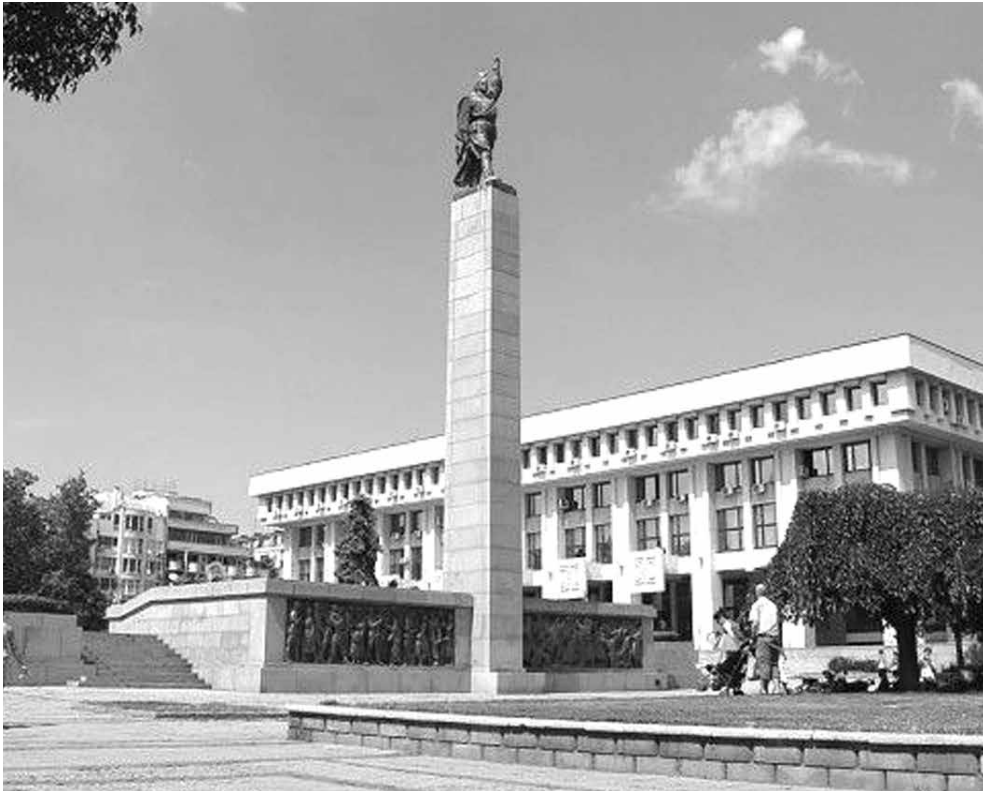
Според архитекти премахването му е практически невъзможно, защото единственият шанс да бъде изринат от площада е да се взриви, а това със сигурност ще нанесе щети и на съседните сгради

Градски страсти. Темата е изключително деликатна и е повод за многогодишни спорове между русофили и русофоби