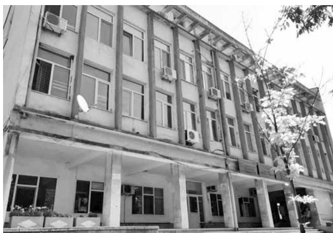
През януари в ОЦСЗУ започна приемът на документи на кандидат-потребители по общинския проект „Грижа в дома“