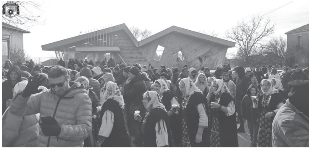
Празникът се организира и провежда с подкрепата на Община Несебър