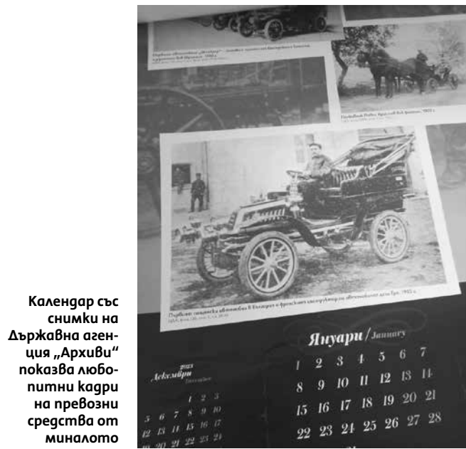
Календар със снимки на Държавна агенция „Архиви“ показва любопитни кадри на превозни средства от миналото

От фонда на Централния държавен архив се показва снимка на първия военен камион, доставен в България