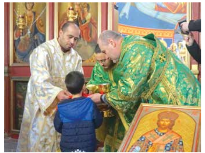
По време на празничната служба