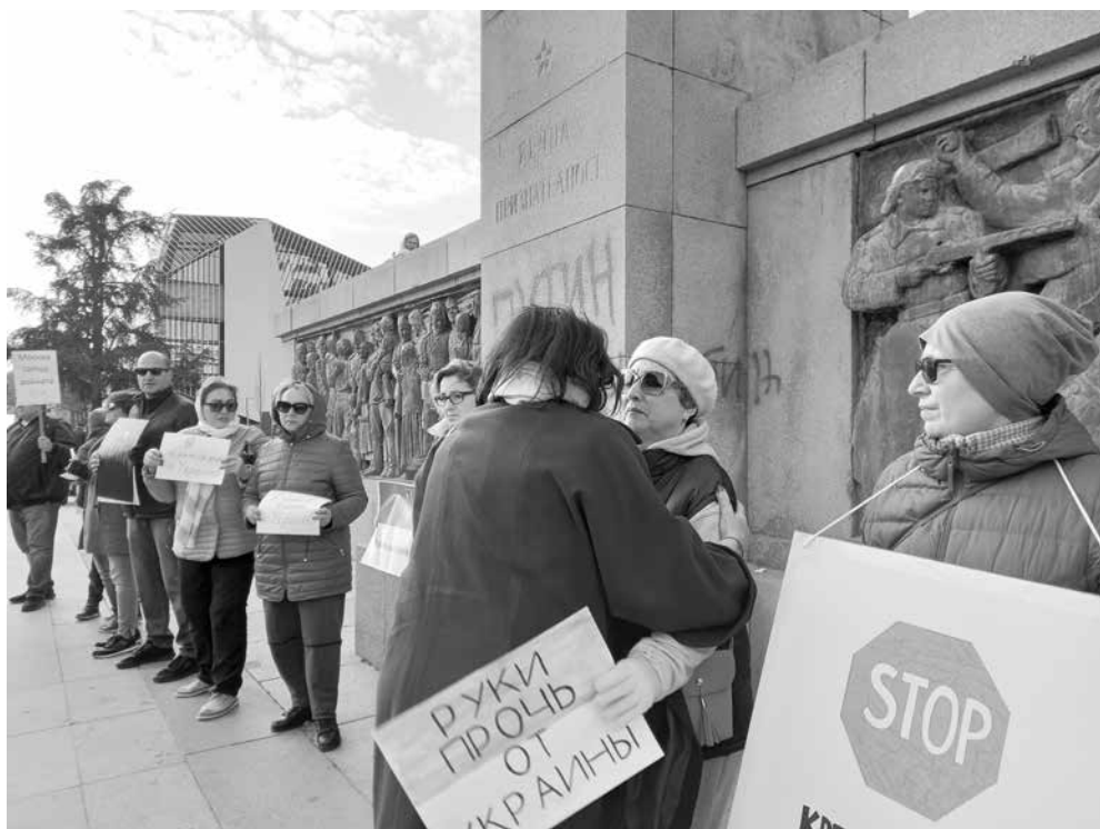
Преди година протестите на украинците в Бургас срещу войната обикновено се организират точно пред паметника