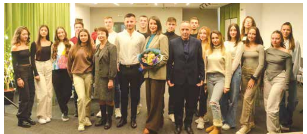
Айтоските гвардейци ще участват в международен младежки проект