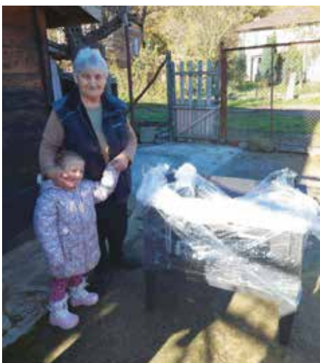
В Кости посрещнаха даровете с благодарност и сърдечни пожелания

Със събраните средства от инициативата училището закупи домакински електроуреди и печки на твърдо гориво, които бяха предадени на нуждаещите се. Администрирането на кампанията се провежда от Училищното настоятелство.