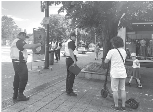
ОДМВР-Бургас периодично извършва проверки за нарушения в пешеходните зони