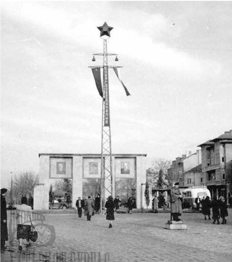
Площад „Тройката“ в периода на култа към личността – началото на 50-те. „Альошата“ все още не е издигнат, но там са портретите на Георги Димитров, Йосиф Висарионович Сталин и Владимир Илич Ленин