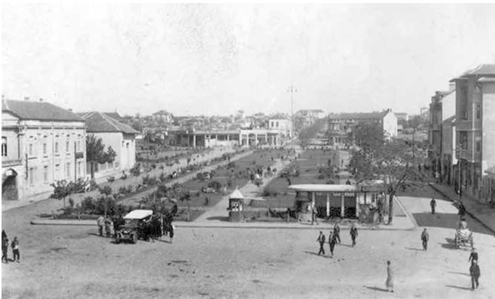
Така е изглеждал площадът през 50-те години, преди да започне строителството на „Альошата“