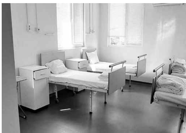
Инфекциозно отделение на МБАЛ – Айтос беше основно ремонтирано и обзаведено по проект. В отделението се лекуват пациенти от четири общини