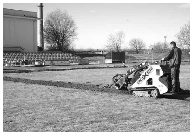
Изграждането на първата в историята на Айтос автоматична напоятелна система на градския стадион