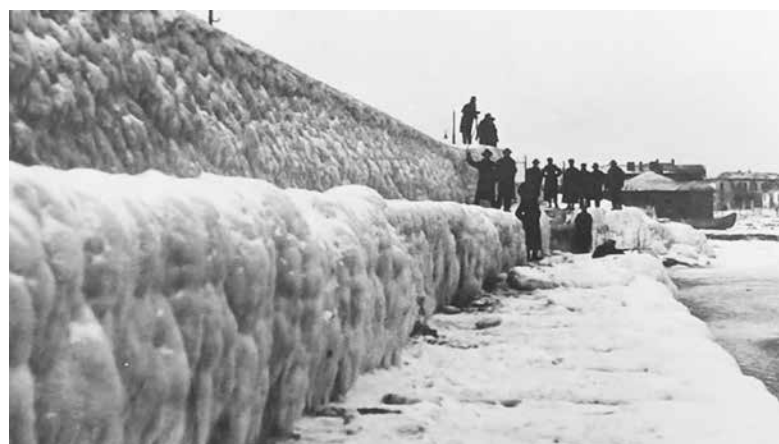
Замръзналият кей на пристанище Бургас, началото на XX век

На друга от снимките пък е показано как в края на зимата ледовете се пропукват и морето отново оживява.