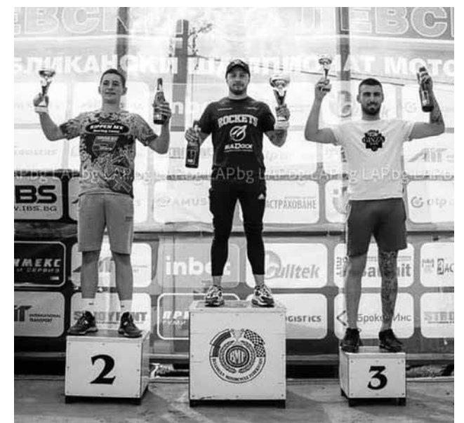
На почетната стълбичка

Областната победа огнеборците посветиха на 40-годишния юбилей на училището