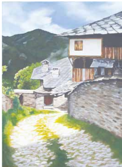
Село в Rogozhite