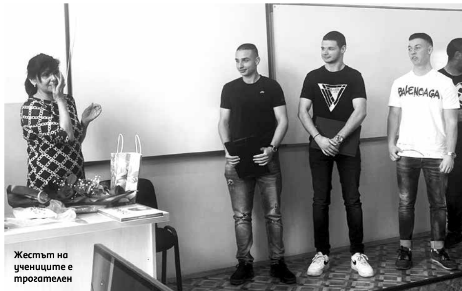
Жестът на учениците е трогателен

най-предпочитаният автор от читателите е Даниел Стийл, който само за периода от 1 октомври 2023 до края на февруари 2024 има 537 заемания. В ранглистата следват Джон Гришам с 252 заемания и Джефри Арчър със 199. От българските съвременни автори най-четен е Георги Господинов, а от класиците Иван Вазов, показва справката.