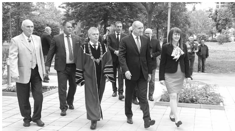
Ръководството на учебното заведение посрещна президента Румен Радев за тържеството