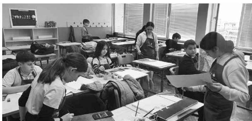
В час и в действие, учениците се трудят

„Аз благодаря на колежите си, защото заслугите не са само мои. Те са на екипа, с който работя. Разбрах съм, че сам човек не може да постигне нищо, ако няма до себе си другар и приятел. Имам изключителната гордост да представя нашето училище на този висок форум“, казва тя.