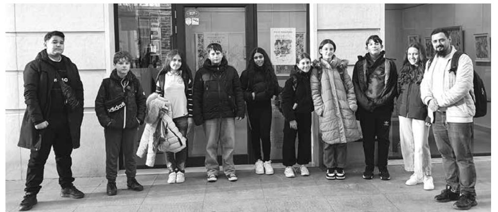
Децата от СУ „Петко Росен“ показват таланти в изкуството

С децата работи по няколко проекта през последните години. Миналата година са гравирани върху стъкло, където са изобразили възрожденци, писатели, дейци на културата в България.