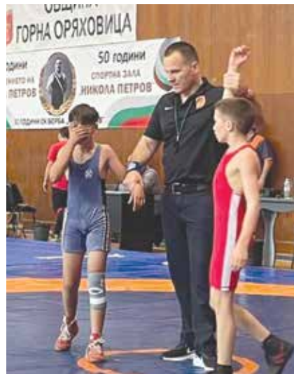
Айтоските борци успяха да преборят добре подготвени противници от спортните училища