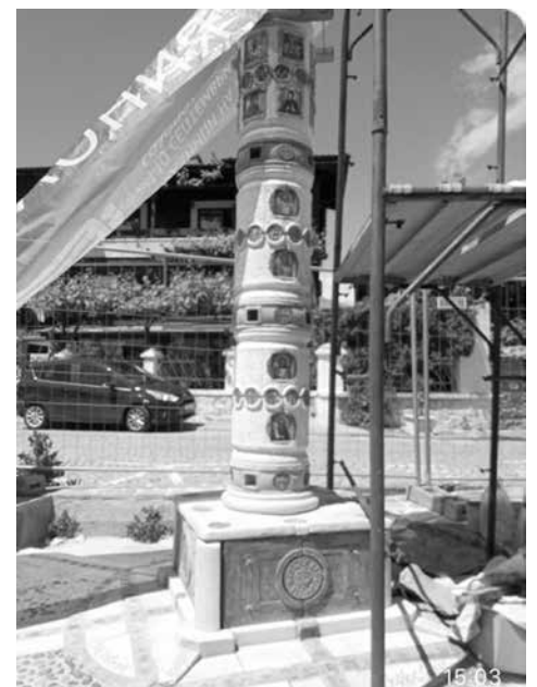
Последната публична творба на художника – слънчев часовник до Художествената галерия