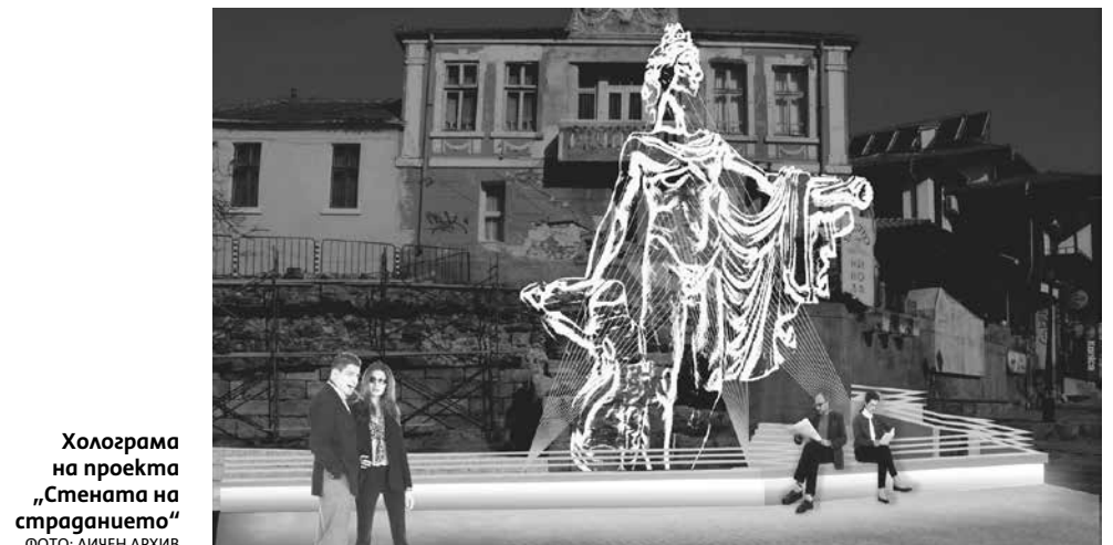
Холограма на проекта „Стената на страданието“

На фона на този величествен градеж ще се издига мащабен фундамент, излят от антично стъкло, със стъпалата на Аполон върху него. От скулптурните му глезени ще блика деннонощно вода, а през тъмната част на нощта, над площада ще се появява видението на Аполон, като прозрачна, светееща холограма, която, с настъпването на изгрева ще си тръгва. За да ни напомня, че градът, поклянал се в тъмните си,