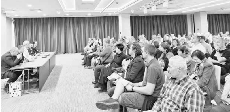
Препълнената зала със симпатизанти

та на кампания в момента. ГЕРБ и ДПС имат изгода, защото разчитат основно на купени и контролирани гласове, добави той и посочи, че ИПДБ се разпадат буквално пред очите ни и нямат нужда от висока активност. „Именно това пък е нашата цел, подчерта Костадин Костадинов, защото ако повече избиратели отидат до урните, това ще намали ефекта от контролирания вот. В следващите няколко сег-