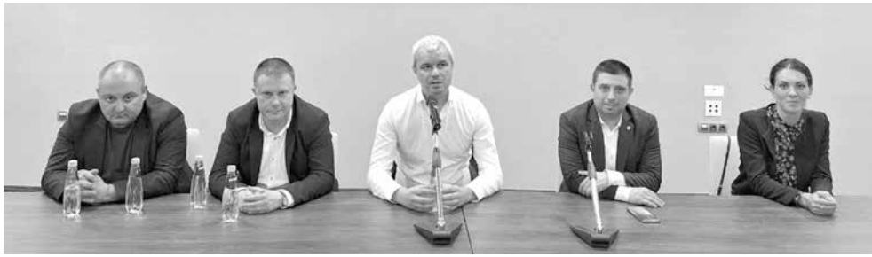
„Който не иска да гласува, не иска да е свободен“, заяви лидерът Костадин Костадинов (в средата)

Всички останали партии се борят за ниска изборителна активност – така Костадинов обясни липса-