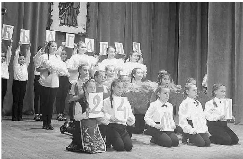
Силно начало на празничния концерт в Айтос