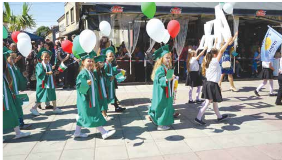
Празничното шествие по ул. „Цар Освободител“ е традиция за Айтос на 24 май

часа с представяне на отличниците на випуск 2024, ритуал за издигане на знамената и поздрав от кмета към айтозлии. Община Айтос ще угостои