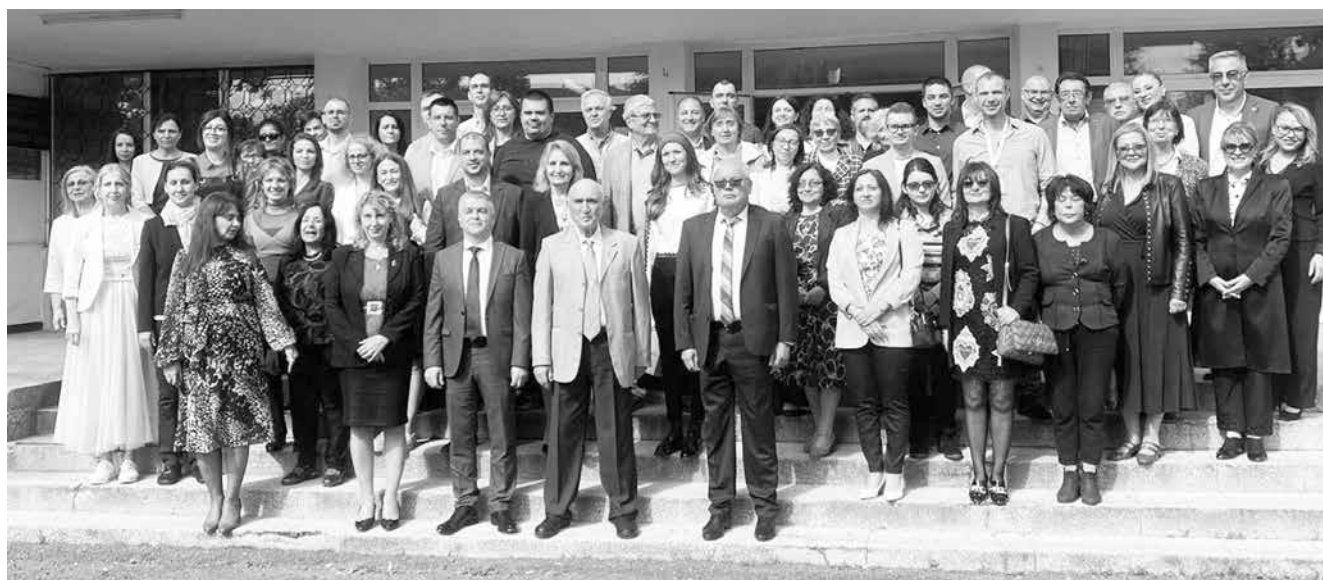
Обща снимка на ръководството на университета с учените от лабораторията