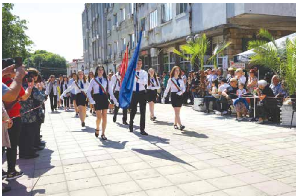
Шествието тази година ще води СУ „Никола Вапцаров“, което празнува 40 години