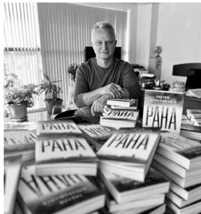
Романа „Рана“ вече го има и в електронен вариант, събщи самият автор

Както се вижда от класацията, предпочитани от българите са родните автори – 7 от 10 доминират в нея. Повсяка вероятност и настоящата 2024-а отново ще е силна за творците ни, тъй като от „Сиела“ дават заявка за силни заглавия, които ще се появят в следващите месеци.