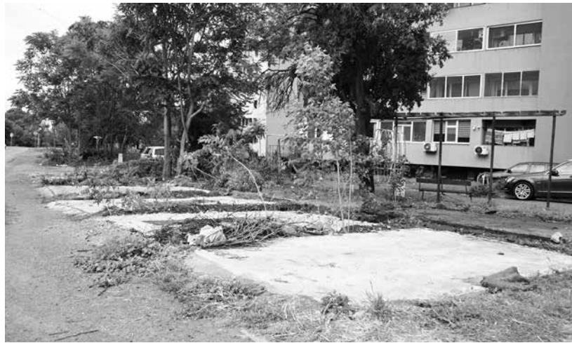
Всички гаражи са премахнати доброволно от собствениците

Това се случи и в Емировския квартал преди да стартира проектът за благоустройство на градската среда, който е вече финализиран. Наред с кв. 49 (военните блоко-