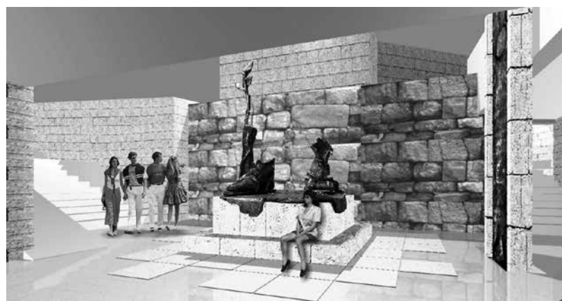
Визуализация на проекта „Стената на страданието“, който би извел Созопол в нови културно-туристически орбити

езически времена на един измислен бог, се е превърнал в град на спасението и светлината.