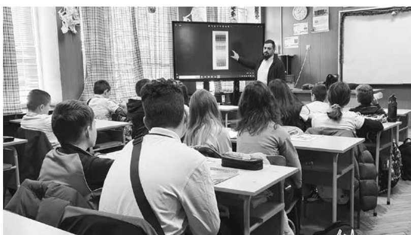
В училището изучават „Интериорен дизайн“