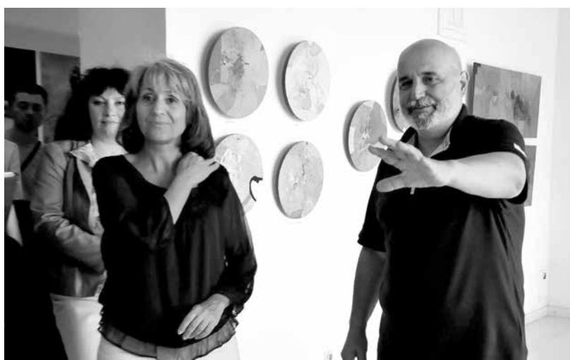
С вицепрезидента Маргарита Попова по време на посещението ѝ в Галерията на Созопол