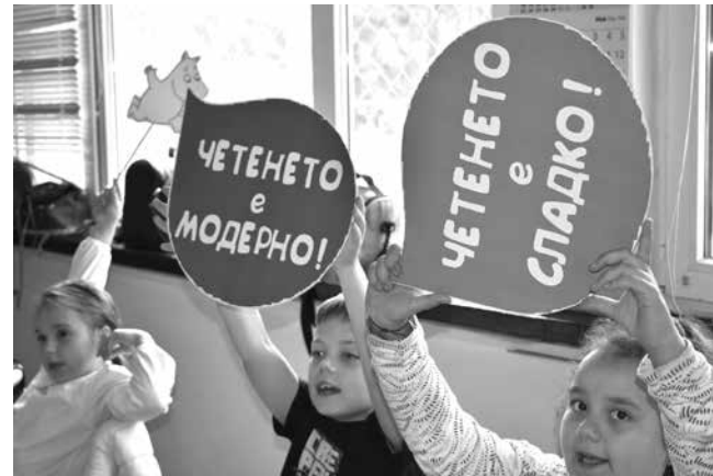
В началните класове децата са мотивирани да четат, защото знаят, че „Четенето е сладко“...

Търсени в колекциите на библиотеката бяха „1984“ на Джордж Оруел, „Сто години самота“ и „Любов по време на холера“ на Габриел Гарсия Маркес, „На изток от рая“ от Джон Стайнбек, „Братя