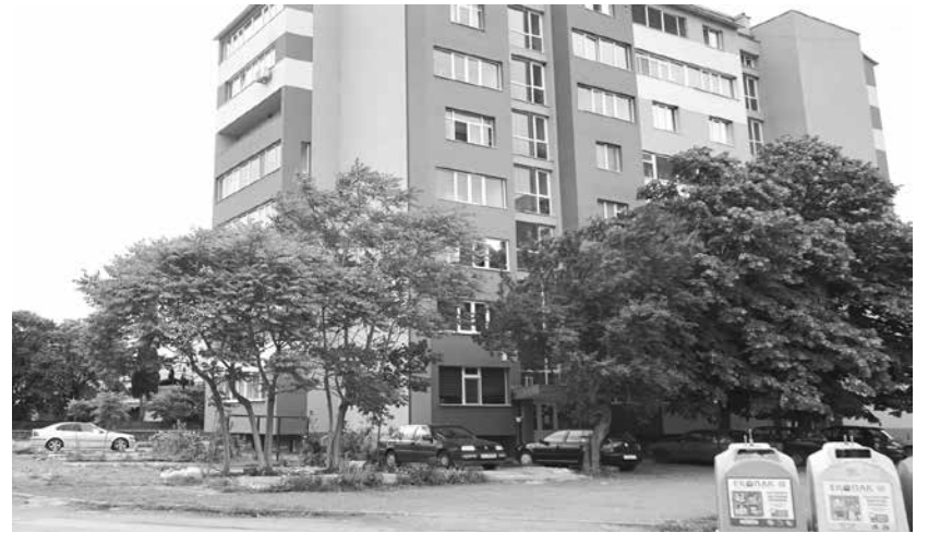
Над 2 млн. лв. ще бъдат инвестирани за благоустройването на квартала

ве до Колелото), за който е осигурено финансиране в размер на 1 597 000,00 лв. Повече от 30 години