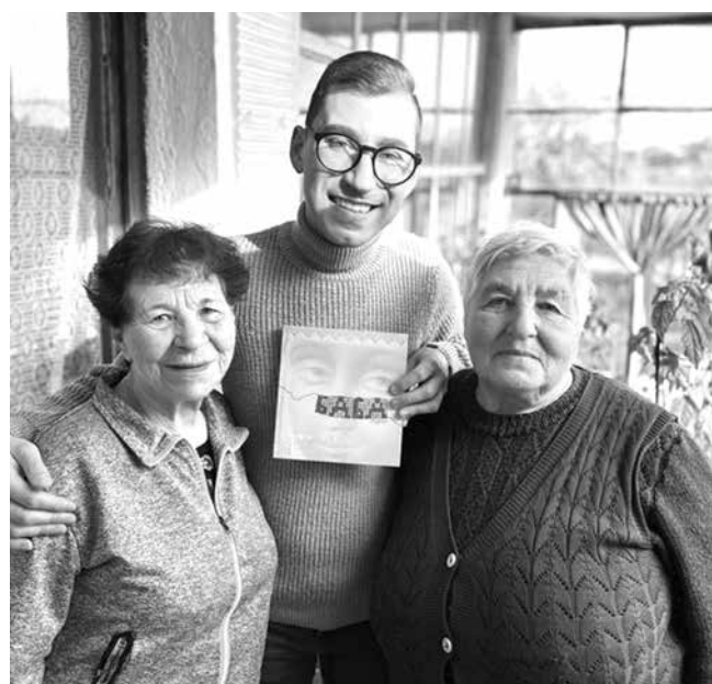
„Аз имам две баби – в града и на село. Благодарен съм, че са живи и (доколкото е възможно) здрави. Радвам се, че днес успях да прекарам време и с двете. Не пропуснах да им подаря сборника с разкази „Баба“, малко закъснял подарък за Осми март.“ Това написа младият автор под тази снимка, публикувана в социалната мрежа, малко след женския празник