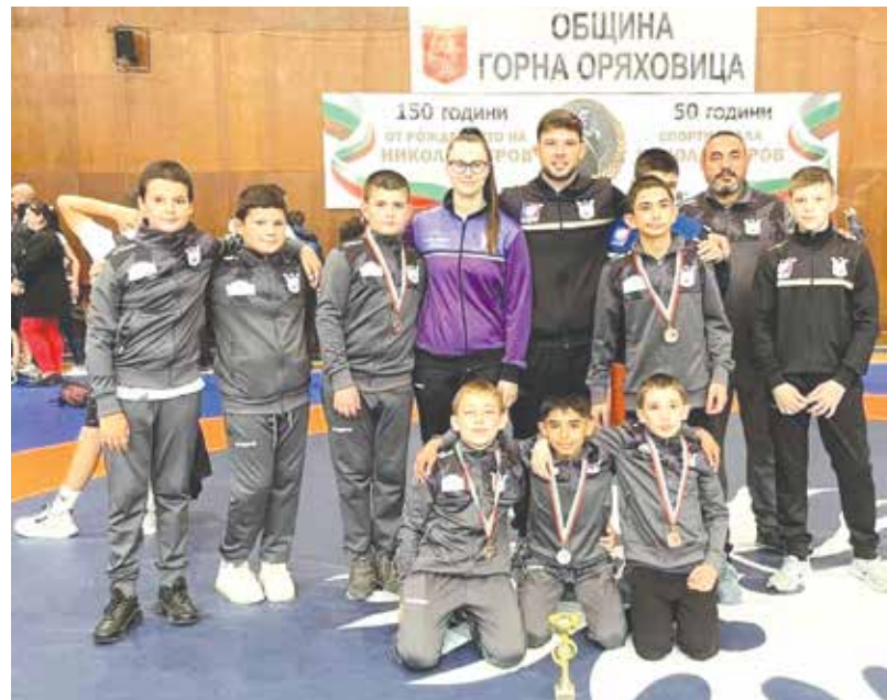
Отборът на вицешампионите

бодна борба за ДЕЦА – II група се проведе на 18 и 19 май. Айтоските момчета