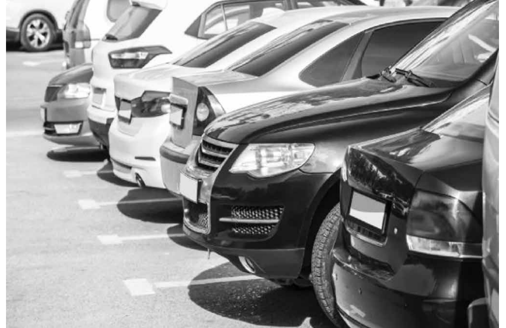
Иззетите возила се съхраняват на няколко паркинга в Бургас и към наказателни паркинзи по общините в областта

В първия, когато водачът е собственик на управляваното от него превозно средство, то се иззема от органите на реда и се транспортира до охраняем паркинг, където остава до приключване на наказателното преследване срещу пияния или дрогирания