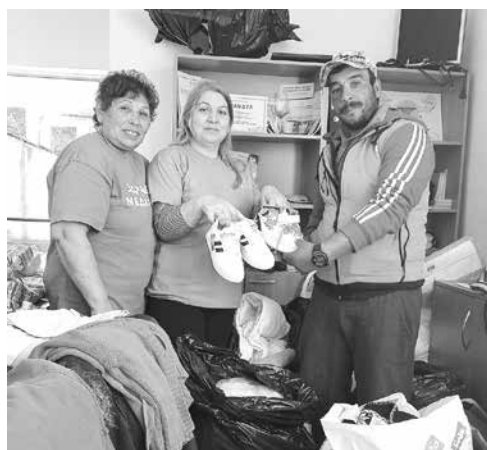
Медиаторите се радват на новите грехи и обувки за малчуганите

На Йордановден храните и грехите, получени в кабинета, медиаторите предадоха на главата на пострадалото семейство, Човекът през съзвиза благодарни и благослови всеки един от дарителите. „Грижата ни е най-вече за децата в семейството. Бяха дарени грехи и раници за тях. Щастливи сме, че можем да