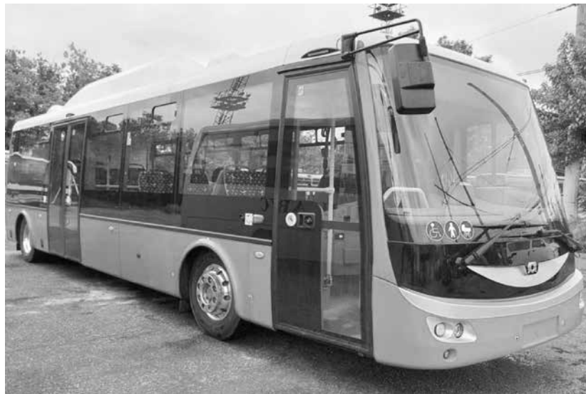
Електрически автобуси ще возят айтослии

закупени и доставени нулевоемисионни превозни средства – два електрически автобуса, ще бъдат изградени и две зарядни станции за превозните средства, които ще бъдат предоставени на общинската транспортна фирма „Айтос Авто транспорт“ ЕООД. Въвеждането на новите електробуси и зарядни станции ще доведе до намаляване на вредните емисии във