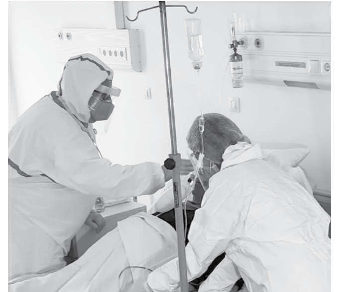
В момента има и много случаи на ковид

ковида също е по различен протокол, посочва д-р Кънчева. При грипа се включва тамифлу, още в първите дни на поставянето на диагнозата. При ковид лечението е според състоянието на конкретния пациент. Наблюденията на лекарите в Инфекциозно отделение показват, че възрастните хора почти спряха да се ваксинират срещу ковид. Към противогрипните ваксини интересът е по-голям, но моментът на поставянето им вече премина – това трябва да се случва в месеците септември – октомври, за да има време организмът да изработи нужния имунитет.