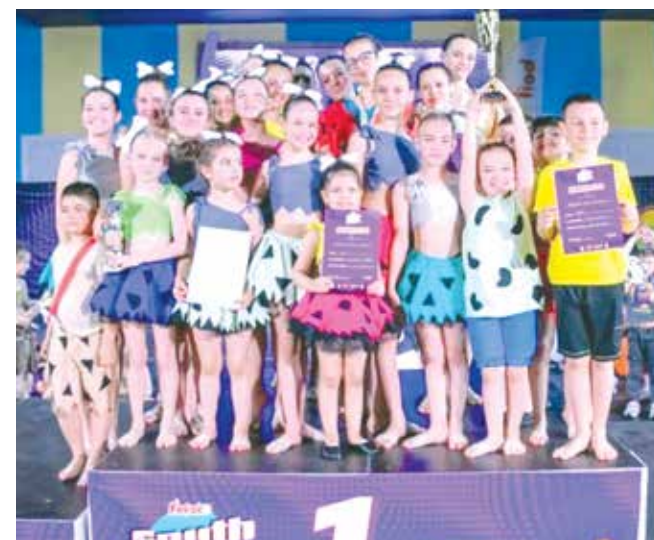
Висока оценка! Първо място за спектакъла „Семейство Олинтстоун“, 2023 г.

обединяват и всеки дава най-доброто, на което е способен в името на добра кауза, тогава резултатите са много по-качествени. Успехите на „Тиара“ от изминалата година нямаше да бъдат възможни без отдадената работа на моята