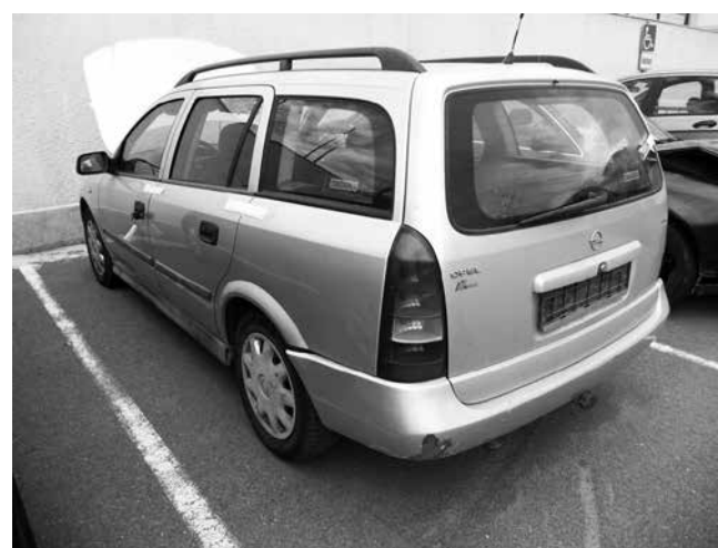
Този „Опел Астра“ е иззет в Созопол и се продава за 1200 лева