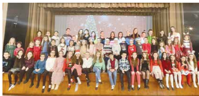
Част от голямото семейство на ТШ „Тиара“ на сцената на Военен клуб – Айтос