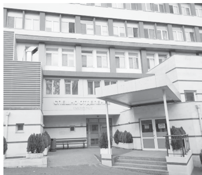
Сградата, където се провеждат прегледите

Предсърдното мъждене е състояние на аритмична сърдечна дейност, много често съпроводено от висока сърдечна честота. Пациентите споделят за чувство за треперене зад гръдната кост, замайване и нестабилност или просто общо неразположение. Тези неспецифични оплаквания могат да доведат до ненавременното поставяне на диагноза и забавяне в започване на правилно