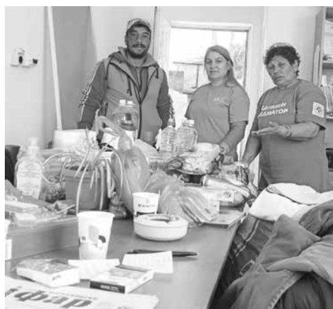
И хранителни продукти за пострадалата фамилия