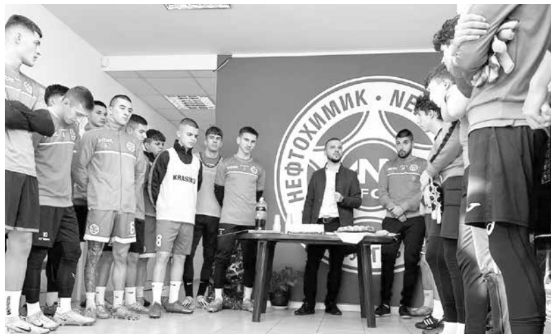
„Зелените“ са уговорили 4 контролни срещи в зимната пауза