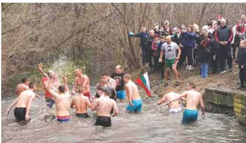
Двойно повече бяха смелчаците тази година