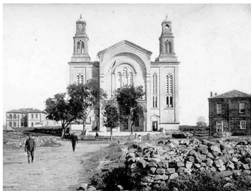
Изгорелият катедрален храм „Успение Богородица“

Пожарът от 15 март 1857 г. е известен като „пожара на Тсереси“, по името на собственика на къщата, от която е започнал. При него из-