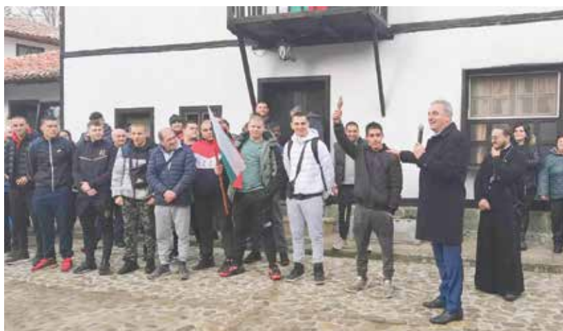
Празникът продължи в Архитектурно-етнографския комплекс „Генгер“