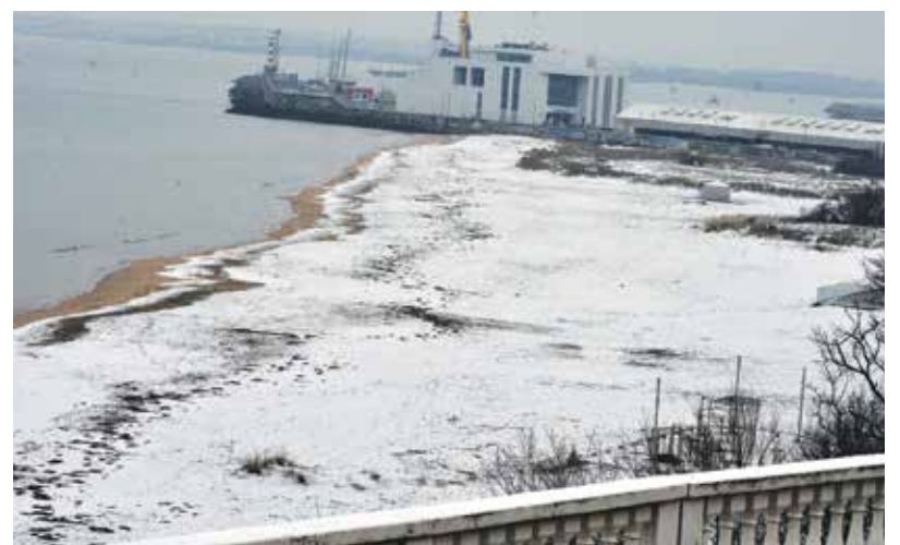
Централната плажна ивица побеля