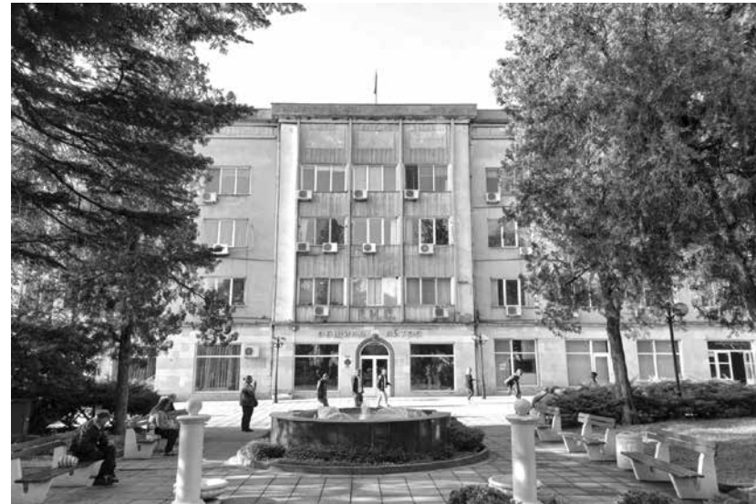
Община Айтос печели първи за 2024 г. проект на стойност над 2 млн. лв.