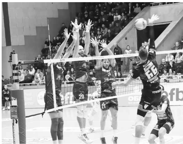
„Нефтохимик“ играе с ЦСКА, а „Дея спорт“ – с „Пирин“ (Разлог)

Полуфиналът от нашата страна на схемата е от 16:00. Финалът по програма трябва да се играе на 21 януари от 19:00 в залата на „Левски“.