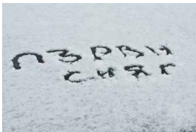
Радостта бе изписана и на плажа

Нещо необичайно зарадва бургаските деца, а и техните родители – малко сняг заваля, побеляха покриви и улици. Шегаджиите изписваха по стъклата на колите разни сентенции. Най-радостни бяха децата, като в първата вечер почти всички бяха навън. Цяла седмица ниски температури в средата на януари е напълно извън стандартите за бургаска зима.