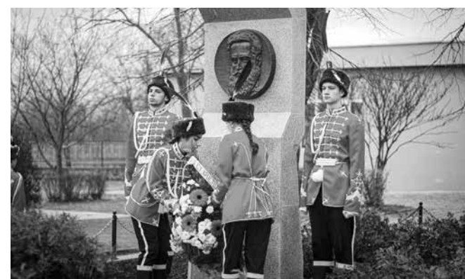
Венци на признателност

Ученическият гвардейски отряд победи в тържествени редици шествие до паметника на Ботев в Градската градина, където бяха положени венци и цветя на признателност. С цветя ученици и учители окичиха и паметника на патрона в двора на училището.