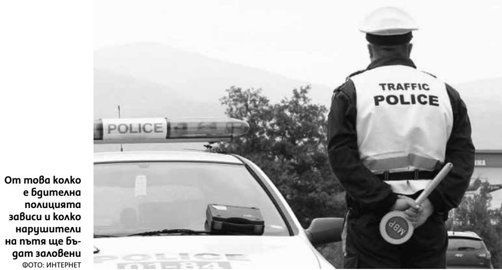
От това колко е бдителна полицията зависи и колко нарушители на пътя ще бъдат заловени

„Имате задължение да платите глоба от 2000 лева, но не го правите в двумесечен срок от влизане на присъдата в сила. Тези 2000 лева в съотношение към дневната ставка на минималната работна заплата, която в момента е 40 лева, се изпълняват като наказание лишаване от свобода. Т.е. за всеки 40 лева от глобата се присъжда един ден затвор. Можем