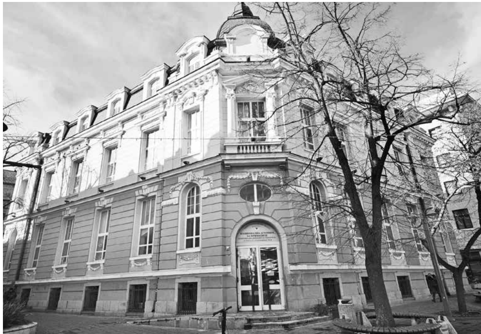
НАП-Бургас продава на търг само автомобили, за които съдят се и произнесъл, че се отнемат в полза на държавата

„Всеки би предпочел да потърси начин да плати глобата си, ако знае, че ще влезе в затвора. По този начин ще я усети като наказание, но ще може да продължи да упражнява труда си, за да може да си възстанови разходите и да се грижи за семейството. Говорим, разбира се, за престъпления с по-ниска степен на обществена опасност, за хипотези, в които би било по-добре човекът да бъде общественополезен, отколкото да го вкарваме в затвор или да му дадем една гола условна присъда, от която да не усети нищо – нито той, нито обществото. Основното наказание, предвидено от закона по чл.343 б, ал.1 е лишаване от свобода от 1 до 3 години и глоба от 200 до 1000 лева. Обикновено при липса на предходни осъждания съдебната практика показва, че се налагат условни присъди. Когато това се комбинира и с невъзможност за поемане на финансовите санкции, каквато в тези дела е заплащане себестойността на автомобила, то усещането за безнаказаност е пълно“, каза председателят на Районен съд – Бургас.