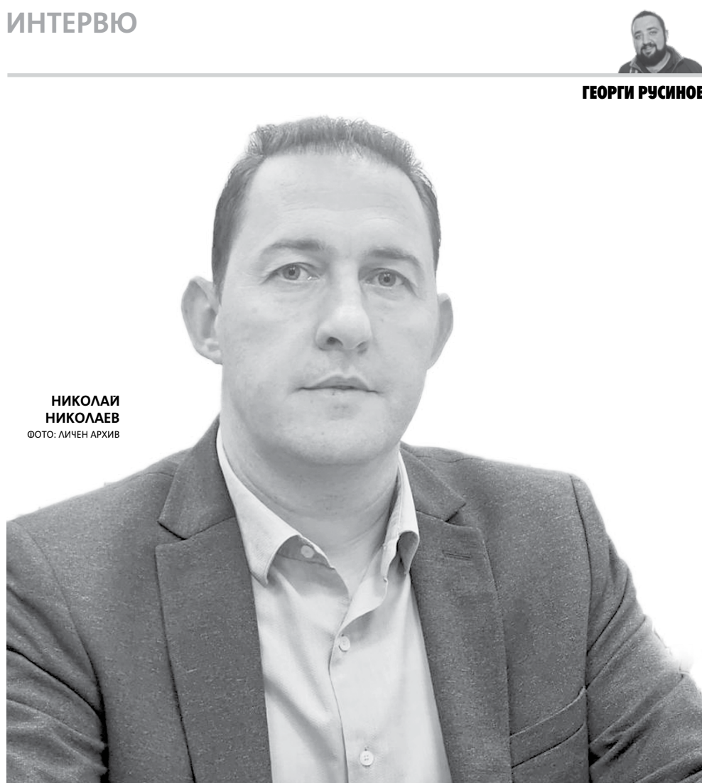
НИКОЛАЙ НИКОЛАЕВ

сочат, че някои от произшествията възникват край пътя, което говори за небрежност при боравене с открит огън. Това са: изхвърляне на незагасени цигари от автомобили, паркиране с много нагорещени двигатели извън асфалта и пътното платно. На територията на община Средец имахме информация и сме на мнение, че пожарите са възникнали от бежанци. Именно покрай бедственото положение там бяха хванати бежанци в района.