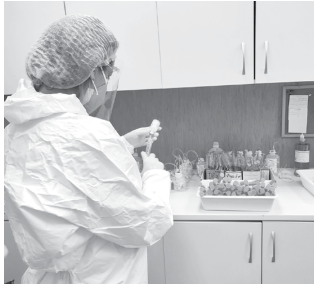
Обичайно в Бургас грипната вълна върхлита в средата на януари

Най-сигурният „домашен“ начин, по който родителите могат да разграничат грип от ковид както за децата, така и за себе си,