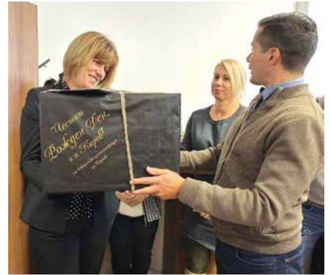
Рожденикът почерпи, а администрацията го изненада с подарък

Киров е астрален близък с певицата Тони Димитрова. Двамата празнуват на един ден – 10 януари.