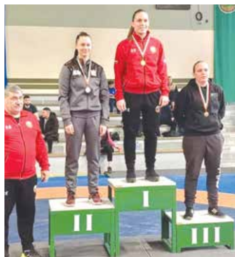
Сийка е първата дама от Айтос, заслужила медал в мъжкия спорт

Първата квалификация за Игрите в Париж 2024 е европейска и ще се проведе в Баку (4 – 7 април), а от нея единствено финалистите ще заслужат квоти за френската столица. През май пък Истанбул ще приеме световна квалификация (9 – 12 май), на която трима души във всяка олимпийска категория ще получат визи за Игрите, а освен това ще се преобладава и допълнително