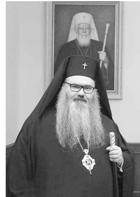
Варненският митрополит Иоан ще ръководи Сливенска епархия три месеца

ческият богословски факултет в гр. Берн, Швейцария. От края на м. декември 1971 г. повторно е протосингел на Сливенската митрополия, която длъжност заема до м. април 1975 г. Като такъв на 20.04.1975 г. в Патриаршеската катедрала „Св. Александър Невски“ е хиротонисан в епископски сан с титлата „Велички“ и е назначен за викарий на Сливенския митрополит Никодим, който пост заема до края на м. януари 1980 г. На 23.03.1980 г. е избран, а на 13.04. с. г. е и канонически утвърден за Сливенски митрополит.