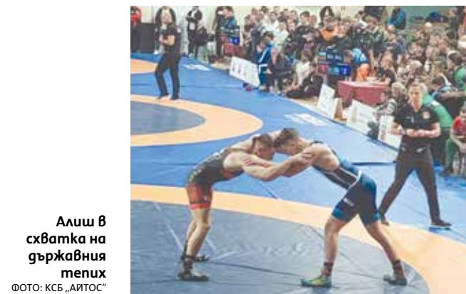
Алиш в схватка на държавния тепих