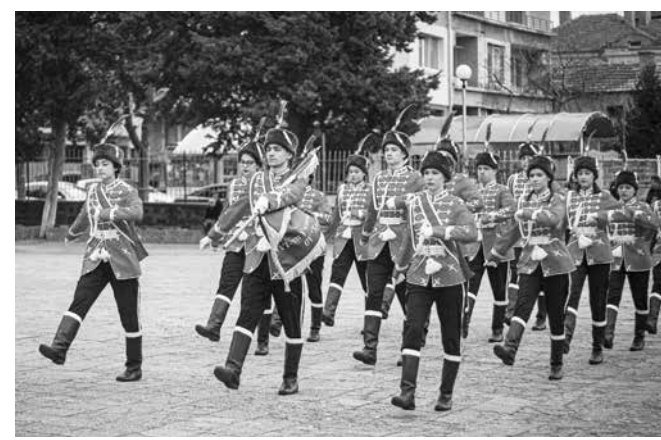
Строят на гвардейците открива празника в СУ „Христо Ботев“