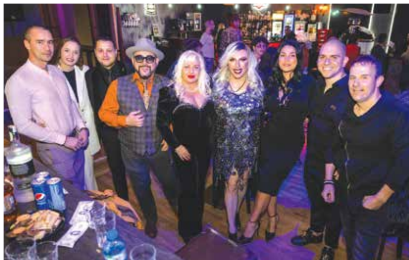
Подслон на шоуто в Бургас даде „Клуб Модерен Театър“, където се събраха близки, приятели, колеги и фенове на най-тачената драг кралица в България