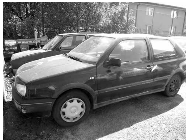
„Фолксваген Голф“ в Руен за 1000 лева е една от колите, които приходната агенция обявя на търг

Защо обаче след толкова много иззети автомобили НАП пуска на търг едва два? Специалисти отговарят пред изданието ни, че със сигурност става въпрос за първите