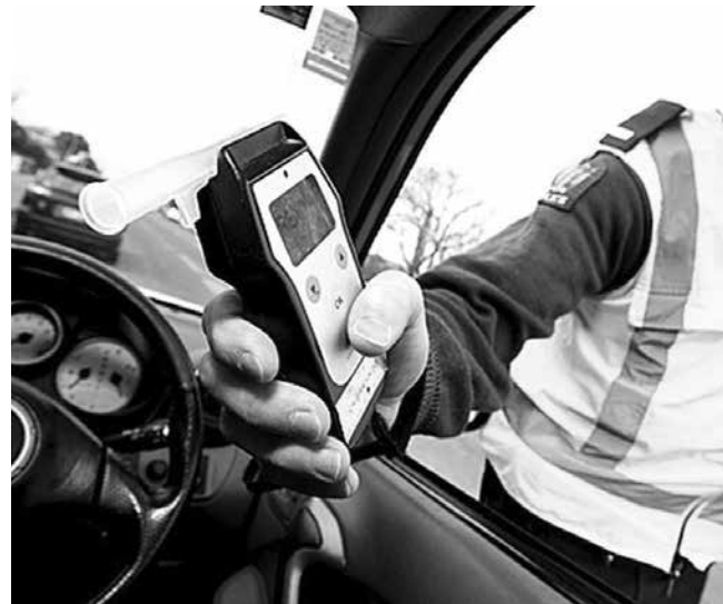
117 са заловените след употреба на алкохол от началото на мерките

Двамата шофьори са задържани за срок до 24 часа, а автомобилите са иззети от полицейските органи.