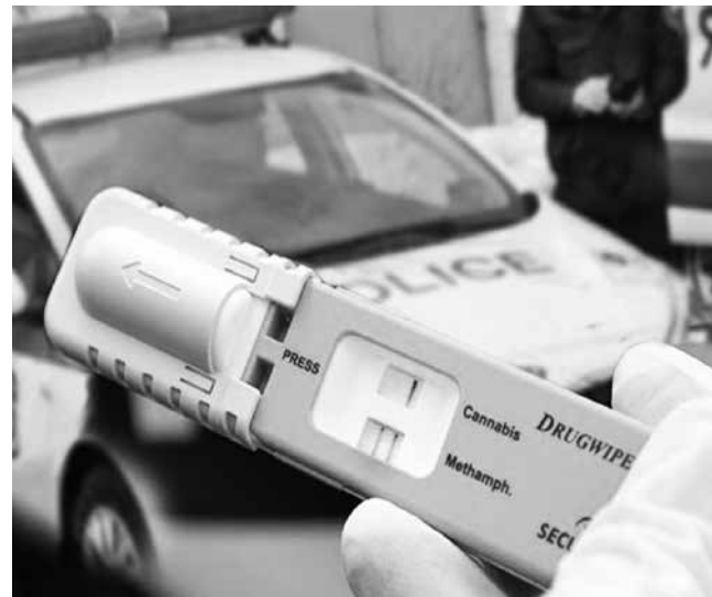
За 125 водачи дръг-тестовите са положителни