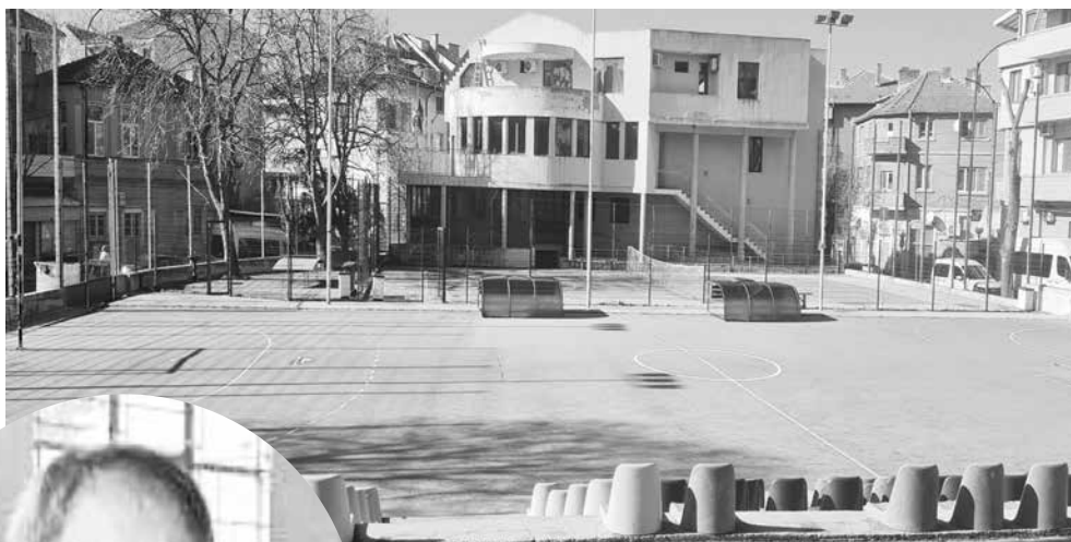
Хандбалното игрище в Поморие, намиращо се в ШГЧ

ЧФ припомня – през 1897 г. в Поморие бил издигнат нов катедрален храм „Успение на Пресвета Богороди-