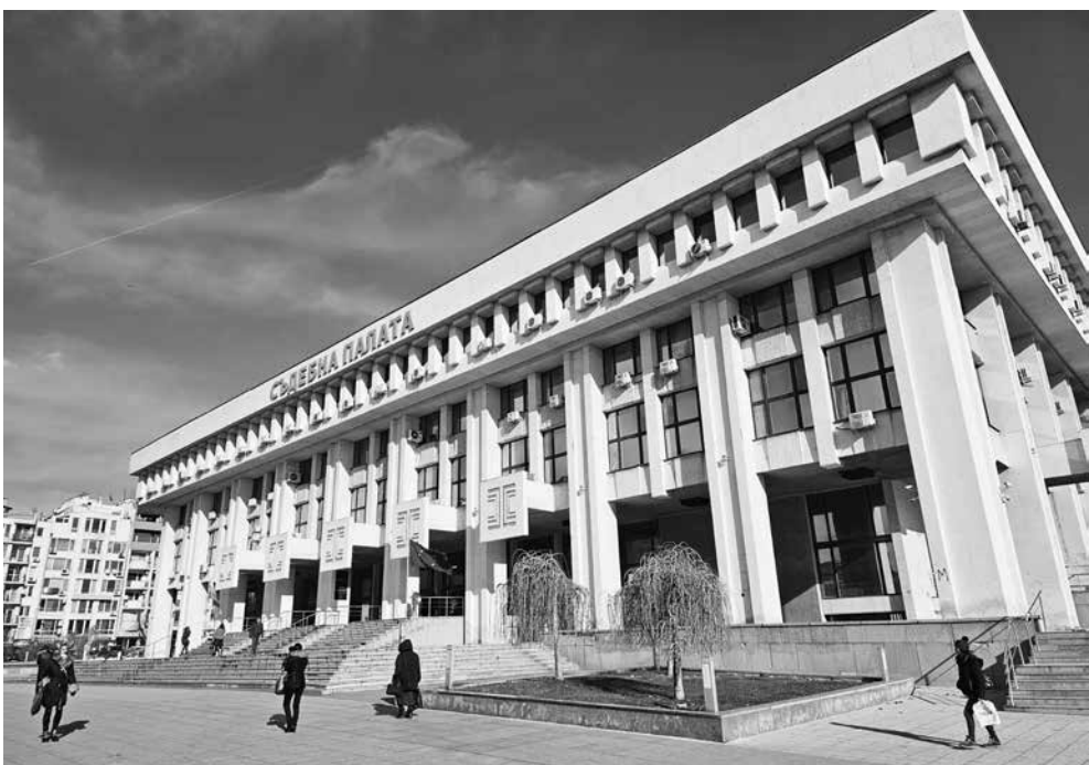
71 са приключилите производства в Районен съд – Бургас по дела на пияни и дрогирани водачи