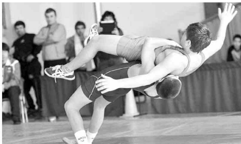
Да се разграничат отборните от индивидуалните спортове ще е едно от новите неща