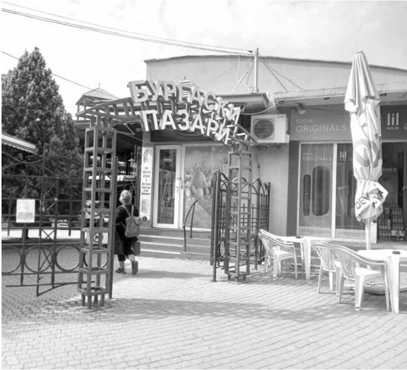
Бургас е единственият град, в който общинският му пазар няма собствен паркинг, а желаещите да го посетят обикалят с автомобили района, докато намерят място

Смела идея. Вариант има и за надземен – над тържището