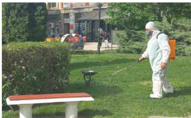
Във връзка с очаквано увеличение на кърлежовите популации, на 15, 16 и 17 април Община Айтос извърши пръскане срещу кърлежи в зелените площи в града. Обработката на тревните площи беше с препарата „БИОТЕК C/S“, разрешен за използване, събщица от администрацията.