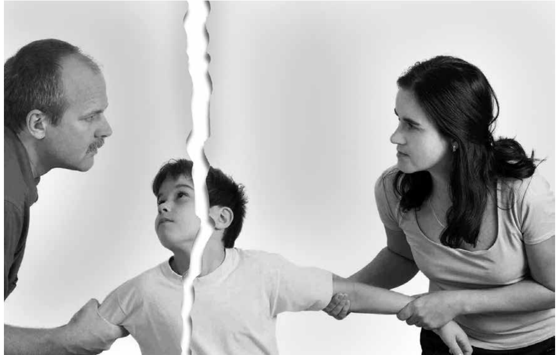
Децата – най-големите потърпевши при разпри