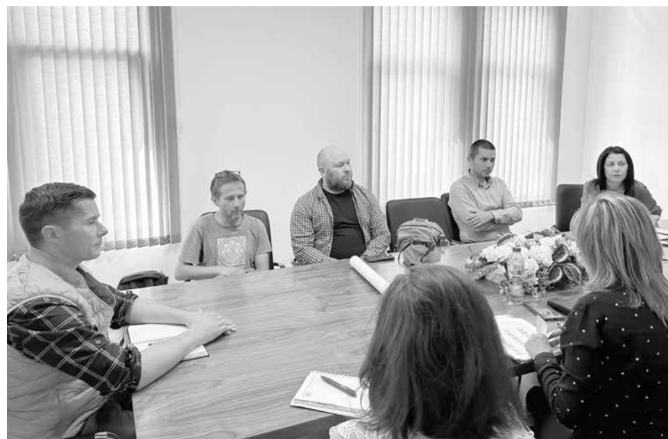
В община Царево се проведе среща с проектантския екип на ОУП-а

„Наясно сме с рестрикциите на всички защитени зони и местообитания. Нашата цел е баланс, имаме нужда от зони около населените места освен за икономическо развитие, но и за гробищни паркове, пречиствателни съоръжения и др.“