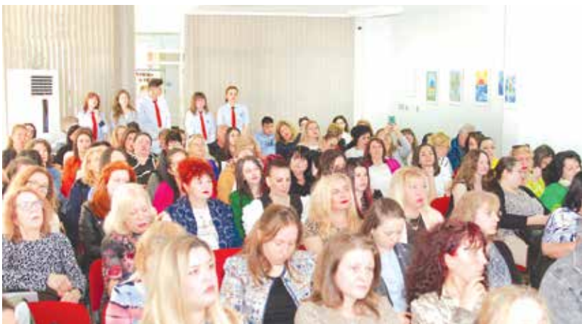
Препълнена зала в трите дни на форума