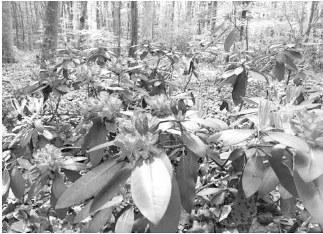
Фестивалът на зеленката ще привлече и тази година множество ценители на природата, за да се насладят на редкия храст и да се забавляват до насита

Традиция. За 20 път те ще се докоснат до магията на Странджа