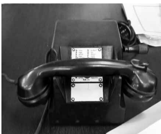
Телефонен апарат от 1942 г.

Историята на радиоапаратите ТУЛАН, съхранена в Държавен архив – Бургас бе експонирана в табла. Изложението се организира от Народно читалище „Ереван 2022“ и Инициативен комитет за опазване на военносторическата памет – Бургас, с помощта на Община Бургас