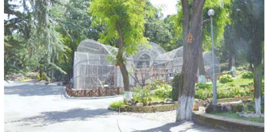
Зоопарк – Айтос

Дейностите по проекта за техническа помощ са свързани с разработването на четири стратегически документа – планове: за развитието на зоопарка, за колекция и размножаване, за консервационни дейности. Ще бъде