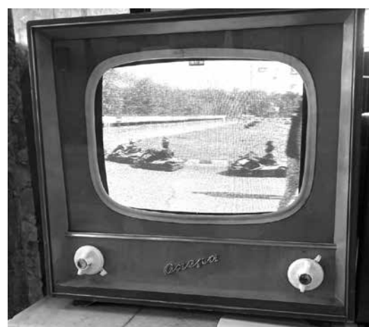
Българският телевизор „Опера“

„Трудолюбие и упоритостта лансират активност и напредък“.