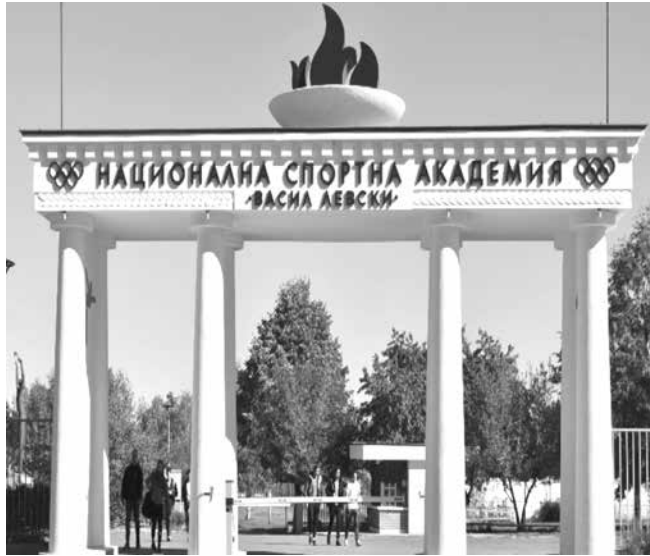
Експертите от НСА ще сключат граждански договори за услуга с тях

На заседанието стана ясно, че едната е почти готова – тази за спортния