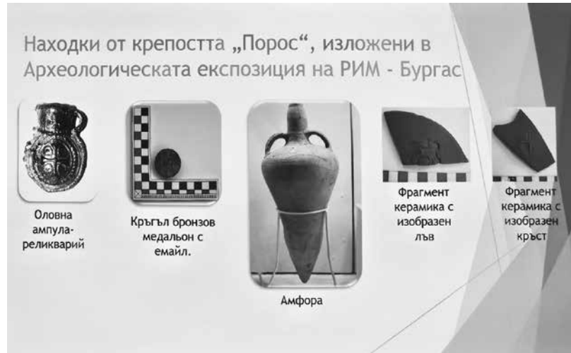
Някои от най-ценните находки са изложени в РИМ-Бургас

„В нея се отразява дарителския акт на един от членовете на