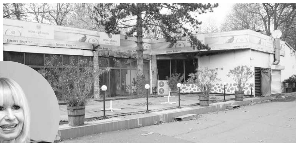
Примата на българската естрада иска да вземе дългосрочно бившето заведение „Бургаски вечери“ и да го превърне в културен център

Фондация „Лили Иванова“ ЕИК 207438131 е юридическо лице с нестопанска цел, регистрирано в обществена полза с цел популяризиране постиженията на българската музика и култура в страната и чужбина и повишаване на тяхното ниво, както и запазване и предаване на поколенията на творчеството на Лили Иванова. Организацията възнамерява да реализира своето инвестиционно намерение като изгради