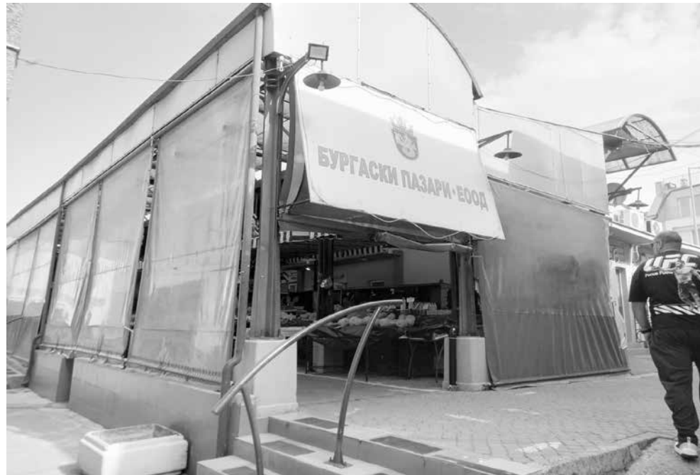
Обикновено пазарният ден се превърща в ад за живеещи, търговци и клиенти

Димитров отказа да коментира постъпило писмо от гражданин, който настоява в платените зони за паркиране право да имат само бургазлии с адресни регистрации там и живеещи дълго време в града. Директорът на ОП „Транспорт“ добави единствено, че идеята не е добра.