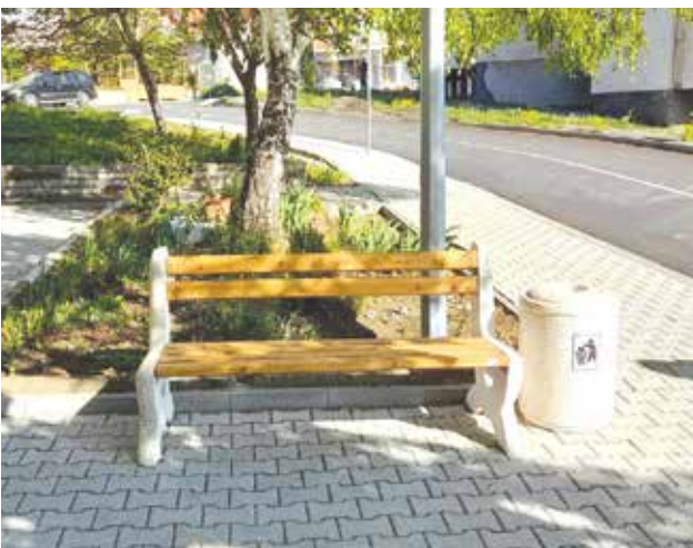
Общината реши да попълни с пейки и кошчета тотално променената визия на квартала

Със средства, заложи в капиталовата програма 2024 са закупени и трактори за косене, които да гарантират перфектната поддръжка на зелените площи в града.