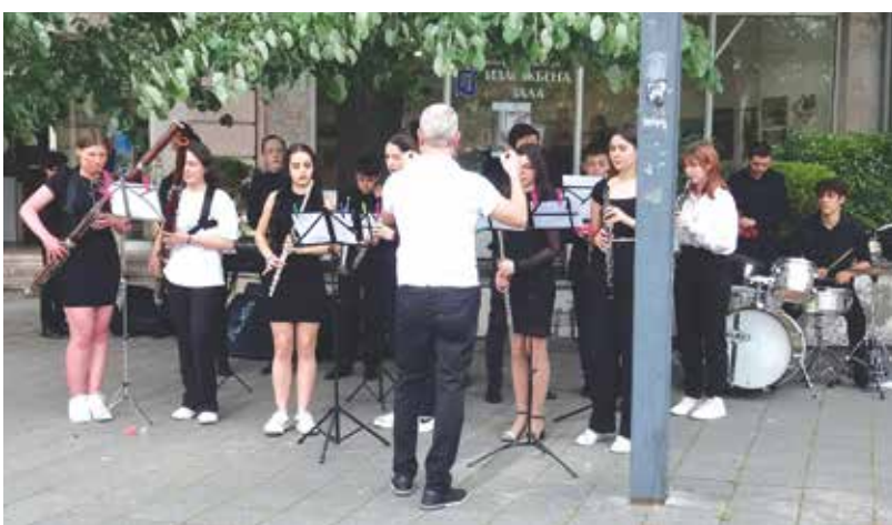
Духовият оркестър на Музикалното училище посрещаше гостите за изложбата