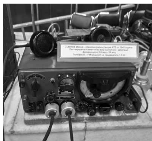
Свързочна техника от ВМС