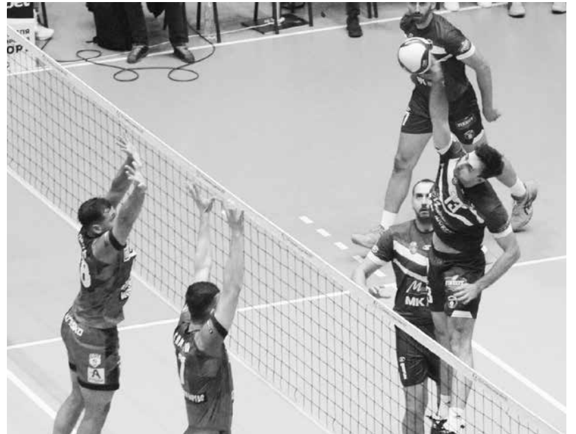
Клубовете настояват за конкретни критерии за представителни отбори, каквито досега са волейболните