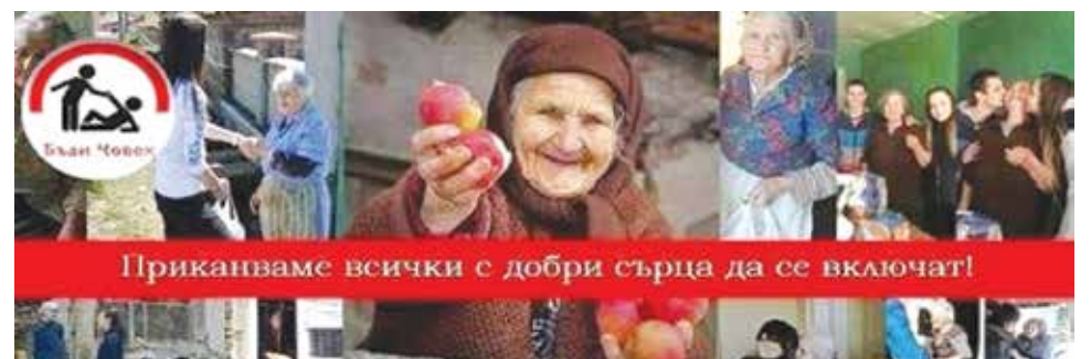
За поредна година – младите на Айтос с грижа за самотни възрастни хора