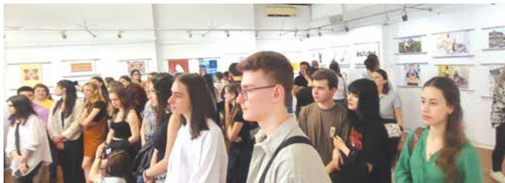
Залата на дружеството на художниците бе препълнена от млади хора