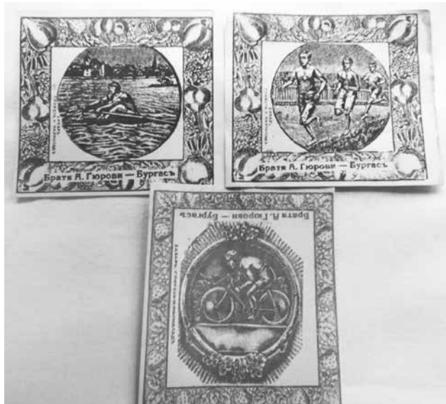
Бонбонени опаковки серия „Спорт“

Не секвал керванът от каруци, идващи от селата, за да вземат поръчките си. Други докарвали чували със