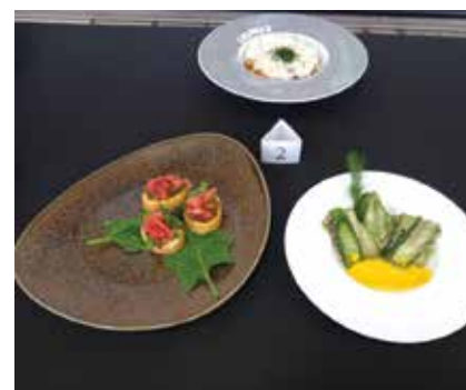
Ястията на отбор 2