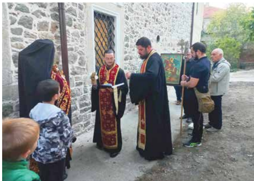
До каменния зид, граден преди 180 години