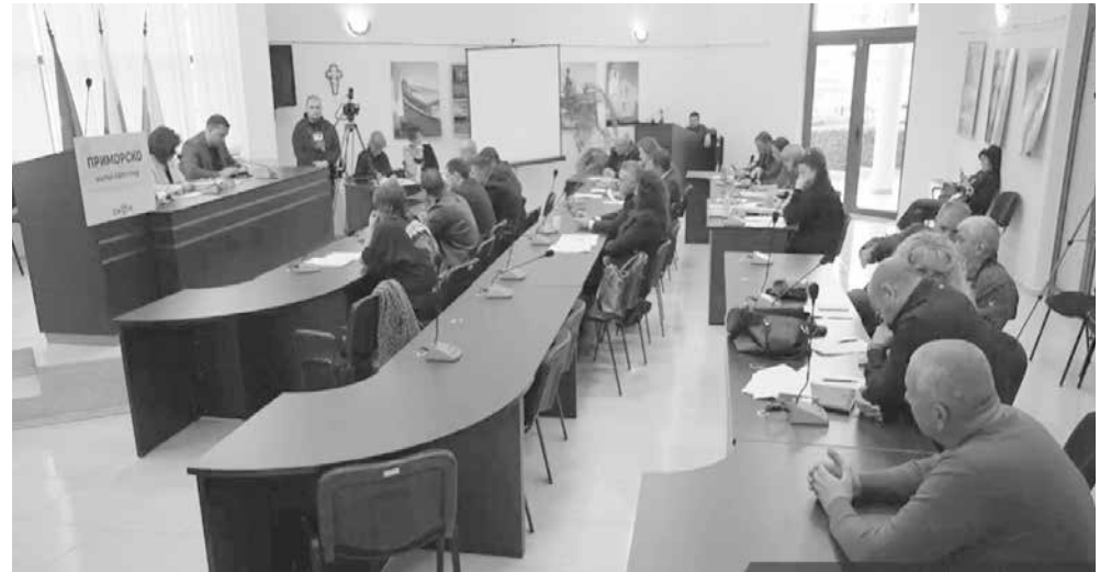
По време на сесията на Общински съвет - Приморско стана ясно, че подготовката за летния сезон тече с пълна сила