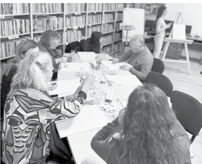
Учителите с желание приемат предизвикателството

Според младежите творческите работилници за учители ще бъдат традиционни за училището.