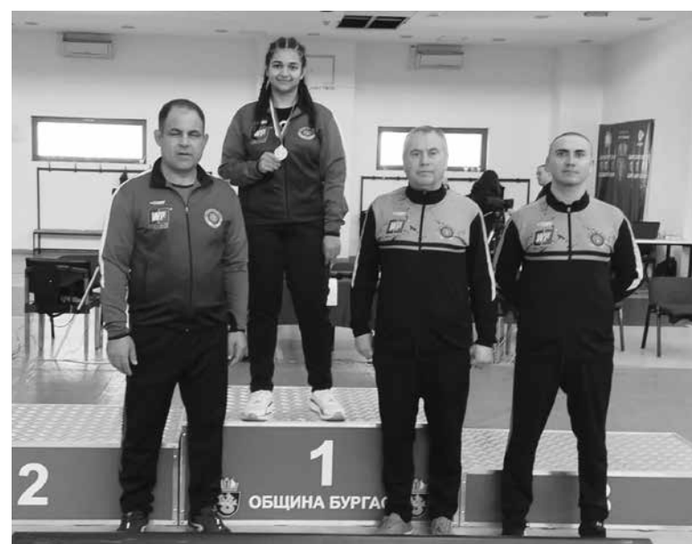
Еганур Ахмед грабна титлата

ч. в зала № 2, ет.2 в сградата на община Средец. Цената на тръжната документация е в размер на 24,00 лв. с ДДС, внесена до 16:00 ч. на 12.04.2024 г. Документи за участие в търговете се подават в деловодството на община Средец до 16:00 ч. на 12.04.2024 г. Определеният депозит за участие се внася в касата на Общината или по банкова сметка на община Средец BG53BPM179373347649603 BIC: BPM1BGSF – БПБ Средец до 16:00 ч. на 12.04.2024 г. При невявяване на поне двама кандидати за участие, повторни търгове ще се проведат на 23.04.2024 г. при същите условия. Пълна информация за търга: www.sredets.bg , информационното табло на Общината и тел: 05551/7690.