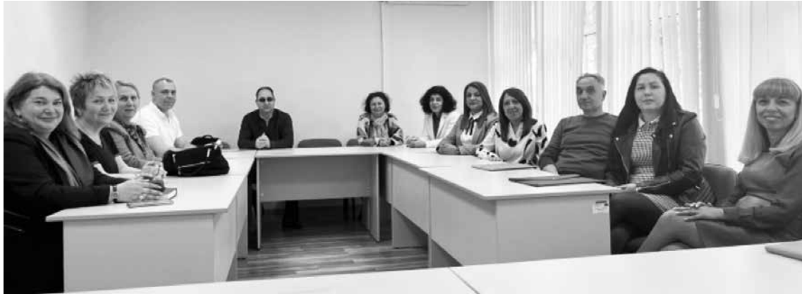
Първото съвещание на новоизбраните директори в Регионалното управление на образованието

Пак в зоната на фолклора се говори, че заместник-директорът на СУ „Н. Й. Вапцаров“, Айтос е тръгнал за конкурса, но по една или друга причина се озвал вр.и.