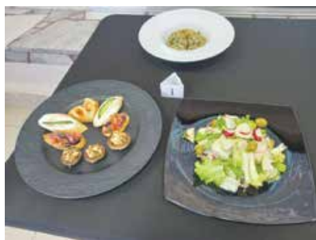
Ястията на отбор 1