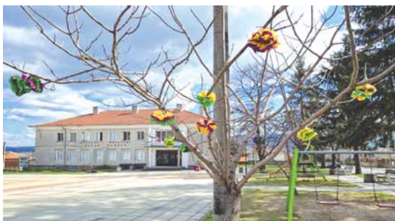
Пролетното настроение се усеща от площада пред читалището