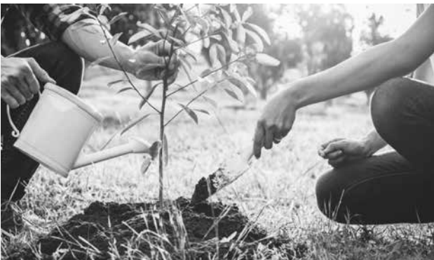
Подобна акция ще има и в Айтос

В Бургас това ще се случи в понеделник от 9.30. Горски служители пред Часовника ще раздават 3500 фиданки от явор,