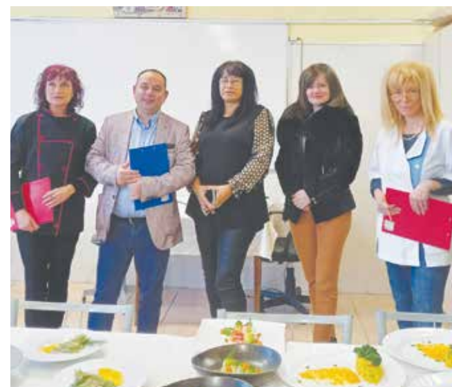
Хората, които обучават кадри за туризма бяха доволни от това, което представиха ученици и хоби готвачи