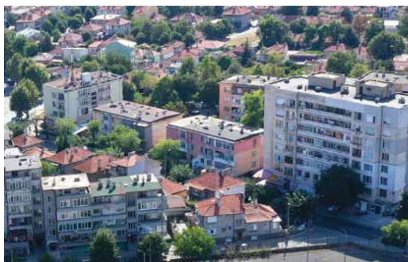
Проектът за благоустройство на кв. 49 е за района на т.н. „Военните блокове“, до Колелото, между улиците „Х. Димитър“ и „Славянска“