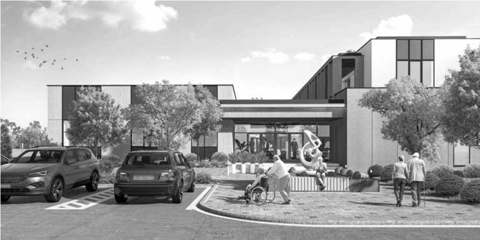
Така трябва да изглежда новата сграда на Дома за Възрастни хора „Цвета и Анка Върбанови“

Изпитание. Някои напуснаха временно залата обидени, други се ядосаха по време на дебата