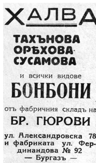
Реклама за производство