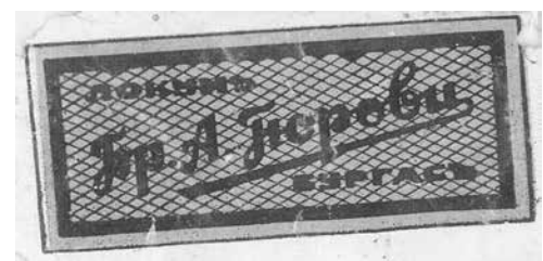
Локумът „Гюрови“ бил известен