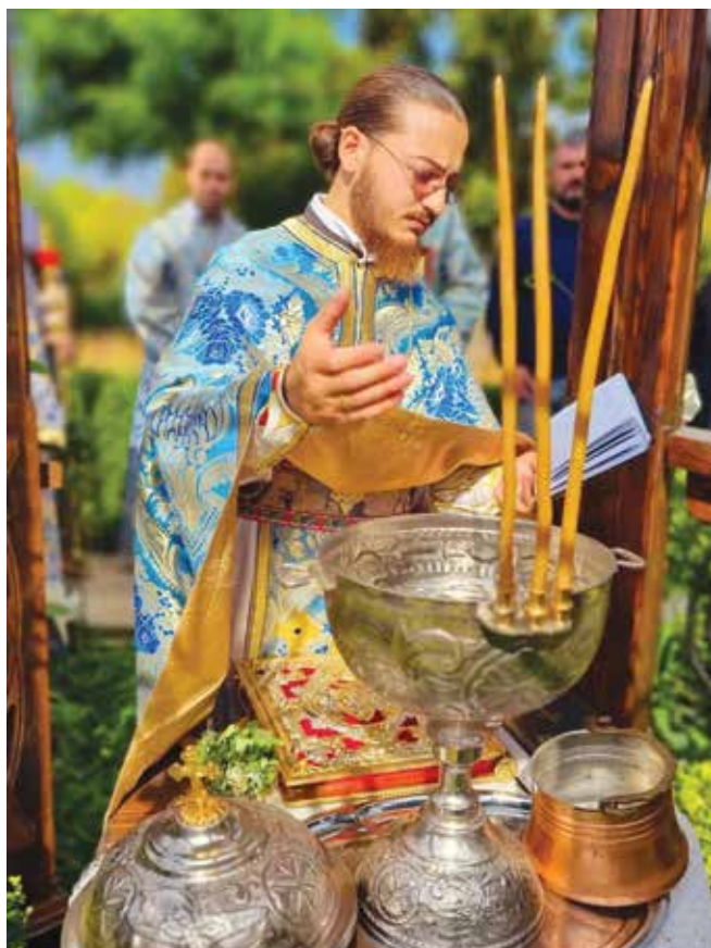
Вярата те учи на надежда, а надеждата – на любов