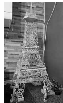
Айфеловата кула на Дамла

уврежданията на брахиалния плексус, Дамла направи над 300 сини лентички и мотивира съучениците си да се включат, съобщават от ръководството на училището. Талантливата ученичка е благодарна на учителите