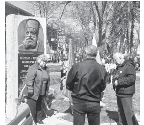
Тракия е наша съдба!