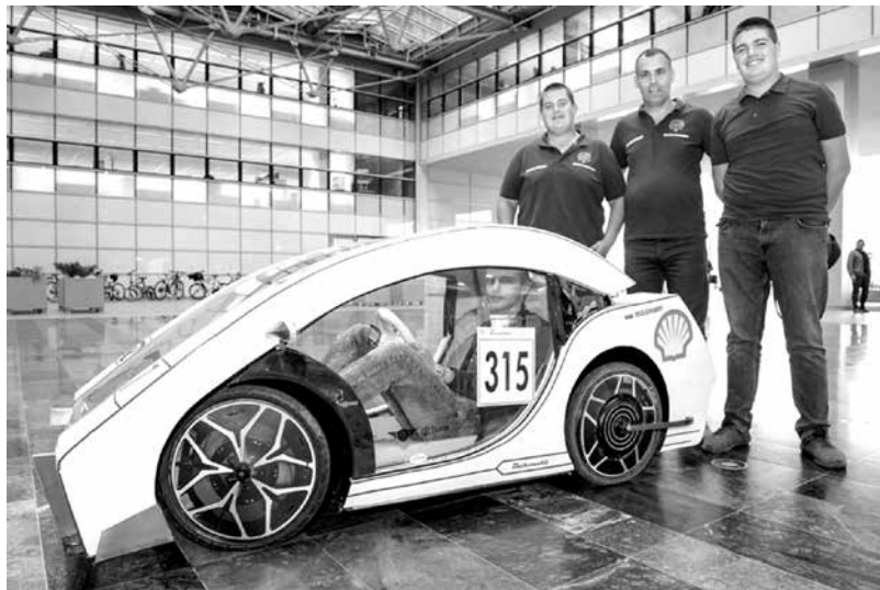
Бургаският баткомобил донесе слава на отбора и ръководителя му преди години

В национален мащаб 200 училища вече имат избрани директори след конкурсите. Анализът на МОН показва, че 7 души са с 90 и повече точки. Кандидатите с най-високи резултати са от 7 области в страната – Бургас, Добрич, Кърджали, Кюстендил, Русе, София-град и София-област.