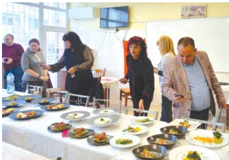
Журието оценява

В началото на състезанието и трите отбора получиха по една кошница с продукти, които са осигурени специално за