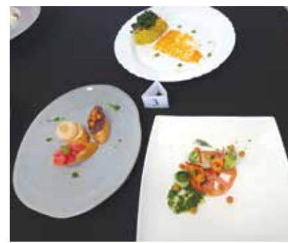
Ястията на отбор 3