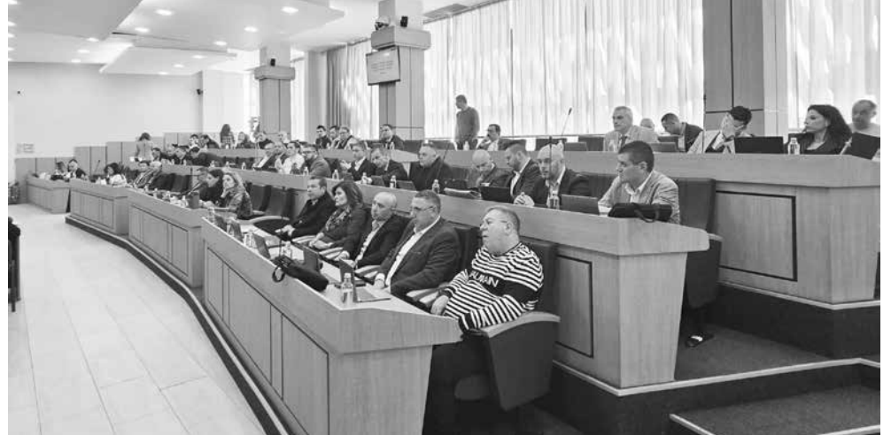
Повече от час общинските съветници спориха за стойността на проекта