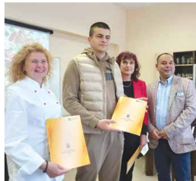
Заслужена оценка за труда и амбицията

„Нашата цел е да поддържаме непрекъснато контакт с Гимназията по туризъм и всички тези млади таланти да продължат, да нагледат своето обучение, да придобият по-високата степен и така да бъдат успешно реализирани на пазара на труда.“ Според нея целта на колежа е не да учи в кулинарни умения учениците, а да ги стимулира да стават управляващи бизнес, и то компетентно.