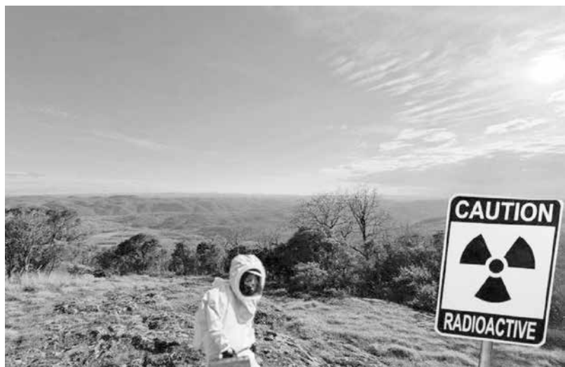
Тепърва предстои да се разисква по темата за локацията на хранилище за ядрени отпадъци

Подземно хранилище за ядрени отпадъци със сигурност ще бъде изградено. Въпрос на време е, но при избора на локация трябва задължително да се получи одобрението на местната общност чрез местен референдум, както и да се предложат адекватни икономически стимули за общността, за да се съгласят това да се случи „в техния двор“. Това мнение изрази в рубриката „Европа в разви-