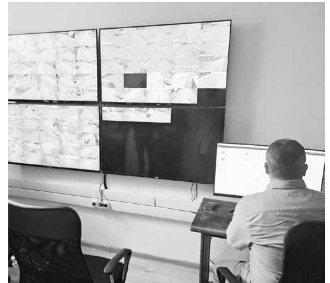
Демонстрирана бе възможността за лицево проследяване. 91 камери ще следят 24/7 трафика от Обзор до Равда

„Сървърът е много интелигентен. Работната станция е много важна. Камерите, които наблюдават предават в реално време, но анализът, който се прави е от най-мощната система, която в България не е инсталирана никога. Сега за пръв път се прави тук – с анализ на лица, с метадан-