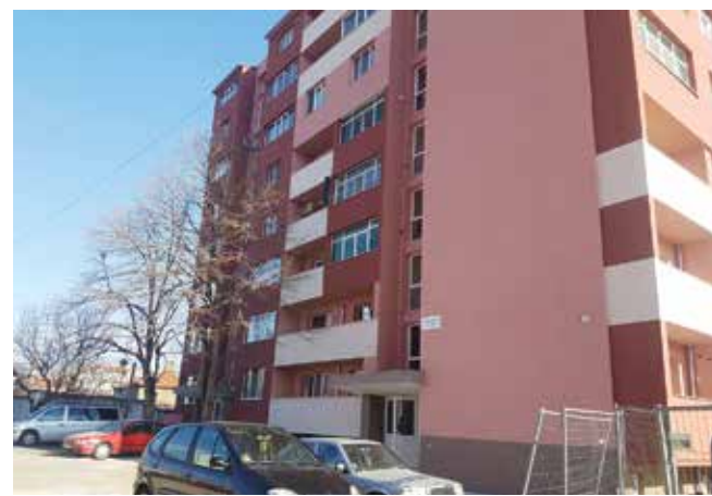
Проектът за благоустройство на кв. 154 е за района около улица „Васил Априлов“