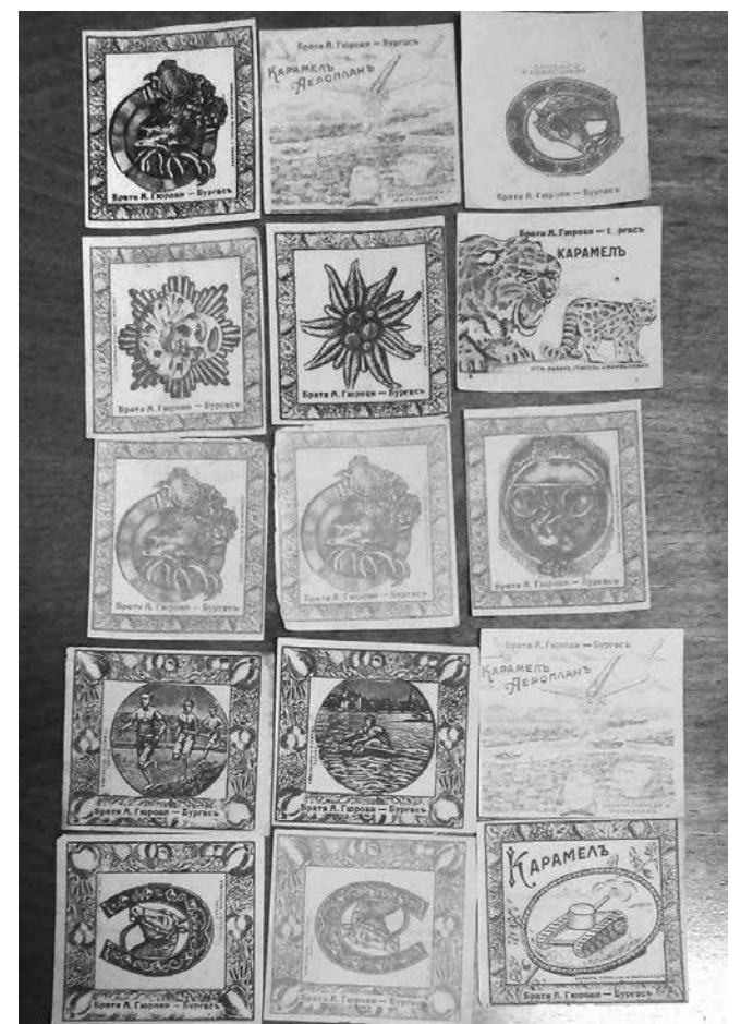
„Гюровките“ за детска колекция