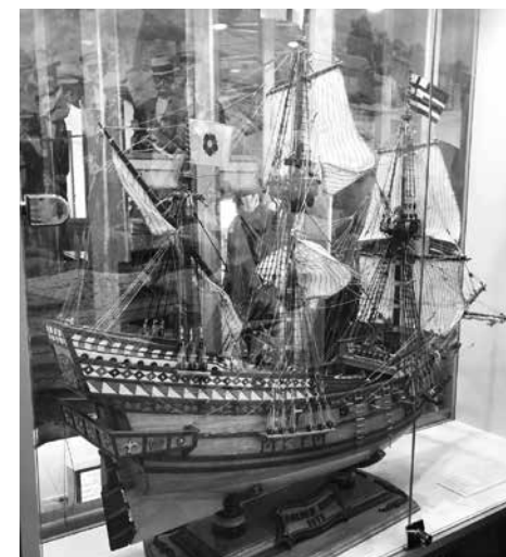
С този английски галеон е извършено околосветско пътешествие през 16 век

На следващото ниво – второ, посетителите ще бъдат изненадани с 360-градусова разходка, която представя Поморие през 30-те и 40-те години на 20 век. Дава възможност за