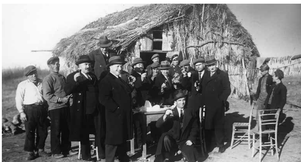
Поморийски рибари празнуват Никулден