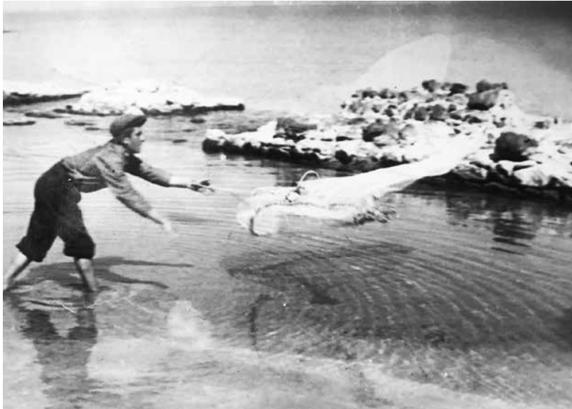
Рибар, хвърлящ мрежа в морето

Славно минало. 1962 – 1964 – най-добрите години за риболова в града