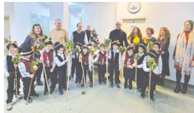
Коледари наричаха за здраве в Община Созопол, 2022 г.

Очакват ни още детска дискотека, благотворителен кулинарен базар, посрещане на коледари и Дядо Коледа. През декември ще се проведе и едно от най-значимите спортни събития в общината – „Спортист на годината“, а кулминацията ще бъде новогодишния концерт, когато заедно ще посрещнем 2024 година.