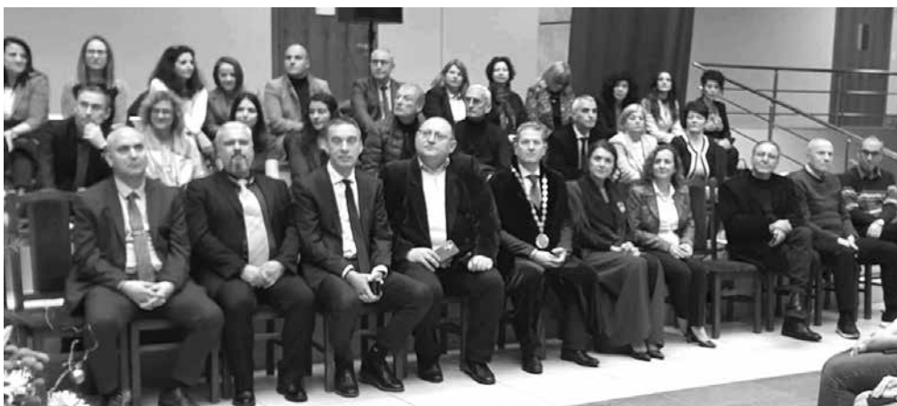
Гостите станаха съпричастни на радостта и удовлетворението на младите хора

По време на церемонията звучаха стихове на най-бургаския поет Христо Фотев – откъс от спектакъла „Жив съм“ и изпълнение на бургаския глас Стефан Илчев.