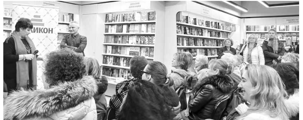
Премиерите на Захари Карабашлиев са дълго чакани от публиката и обикновено се превръщат в истинско литературно събитие за града

Той побърза да успокои присъстващите, че „книгата не е тежка, има хумор в нея и се чете лесно, но има и неща, за които не се е говорило много досега в художествената литература или се е говорило, но само в исторически трак-