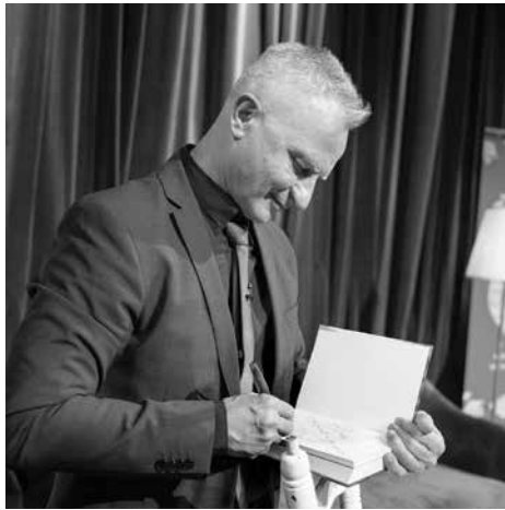
Писателят разговарява повече от час автографи

Карабашлиев от своя страна обясни, че обикновено започва да пише след-