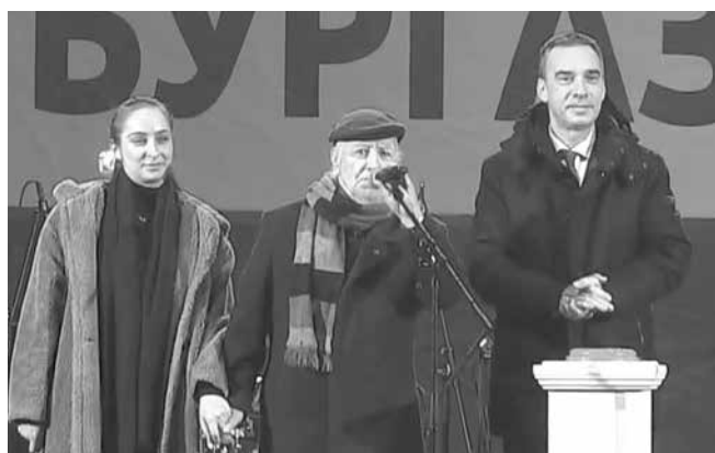
Кметът Димитър Николов, заедно с олимпийската шампионка и Маестро честитиха празника на бургазлии

последва и най-очакваният момент – запалването на светлините на коледната елха. Честта имаха олимпийската шампионка Стефани Кирякова и емблематичният композитор маестро Стефан Диомов.