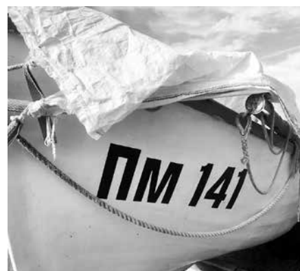
Шестметрова поморийска хубавица