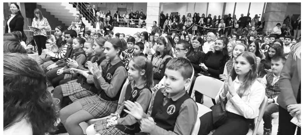
Залата на атриума едга побра всички ученици които трябваха да получат награди