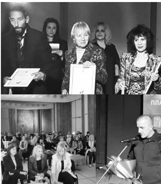
Наградените с призове. Те бяха връчени на стилна церемония в Операта