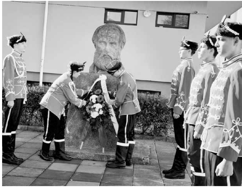
Със специален ритуал бе поднесен венец на бюста на Константин Фотинов

Както традицията по-велява учители и ученици се посветиха на литературното творчество и силата на словото и както Константин Фотинов го е казал „Както вода и хляб засищат тялото, така учението, четенето засища