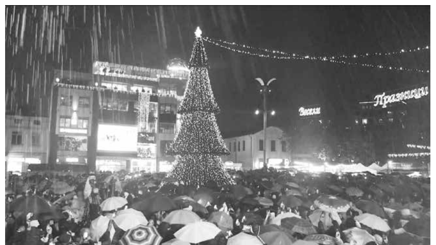
Бургаската елха е сред най-уникалните в България