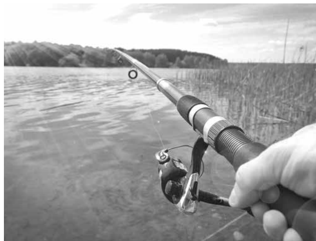
Любителският риболов никога нищо не е получавал като подкрепа

От думите му става ясно, че съществува един вътрешен негласен конфликт между двата вида