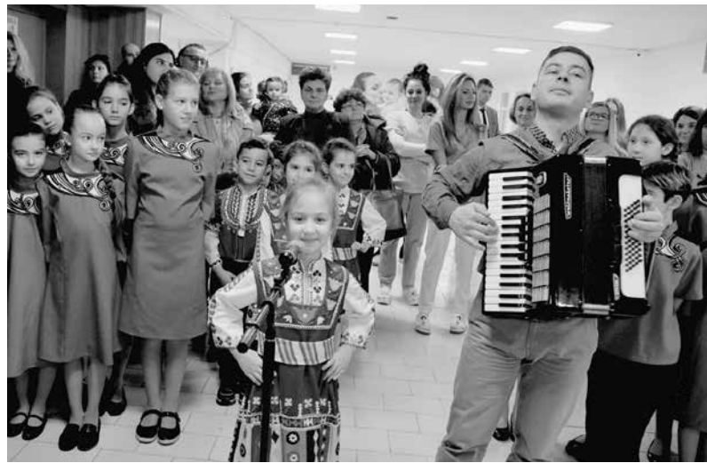
Децата от детска градина „Изгрев“