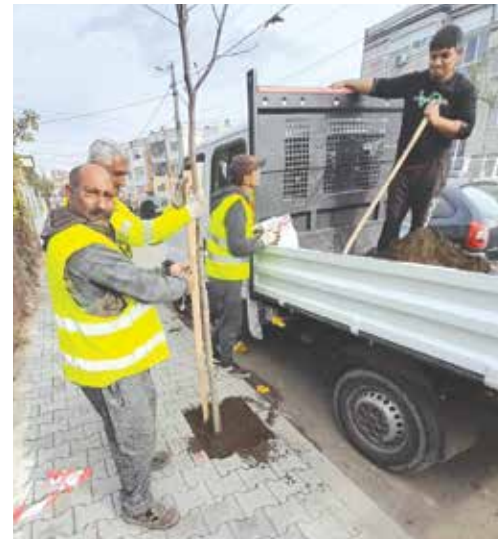
На улица „Чудни скали“