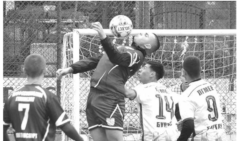
Зрелищни двубои се получиха между младежите

класиралите се на първите три места, както и подаръци за всеки участник в състезанието.