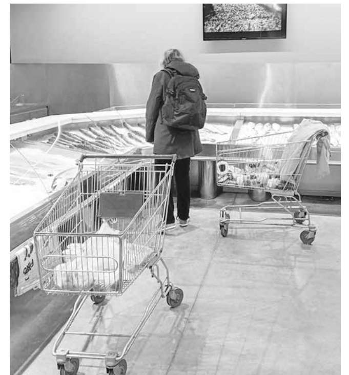
Инспектори на ИАРА започнаха проверки по търговските обекти преди празника

35 аквакултурни стопанства са регистрирани в област Бургас за развъждане и отглеждане на риба, които се грижат за снабдяването на търговската мрежа и населението със сладководна риба. В тях се отглеждат основно шаран, сом, толстолоб и бяла риба.