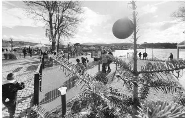
И през зимата е интересно на „Ченгене скеле“

Отново на 2 декември празничен базар ще бъде открит в КТК „Ченгене скеле“. В него ще вземат участие с щандове Пчеларска ферма „Стоянови“, органични вина „Тракийски