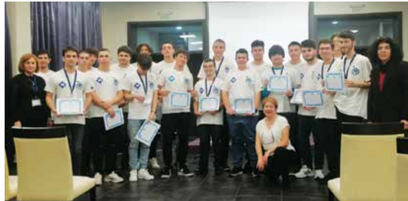
За втори проект гимназията си партнира с Унгария