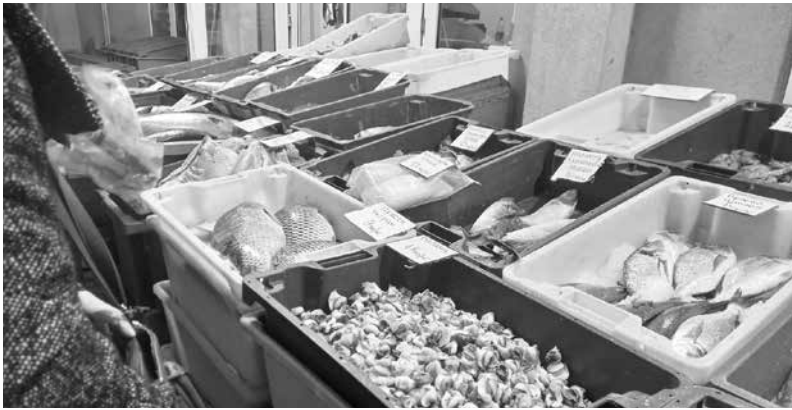
От 8 до 10 лева за килограм върви по пазарите рибата

Свободен пазар. По малките магазини твърдят, че предлагат само българска риба