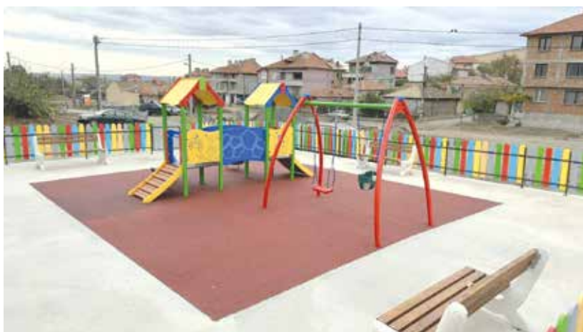
Детската площадка на ул. „Христо Кърджолов“

„Целта е не само обновяване на територията