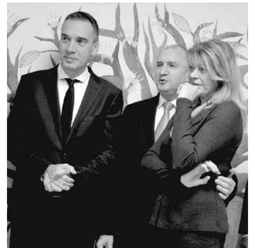
Президентът (в средата) и съпругата му изслушаха песните и танците