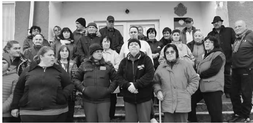
Жителите са категорични, че ще присъстват и на сесията другия петък