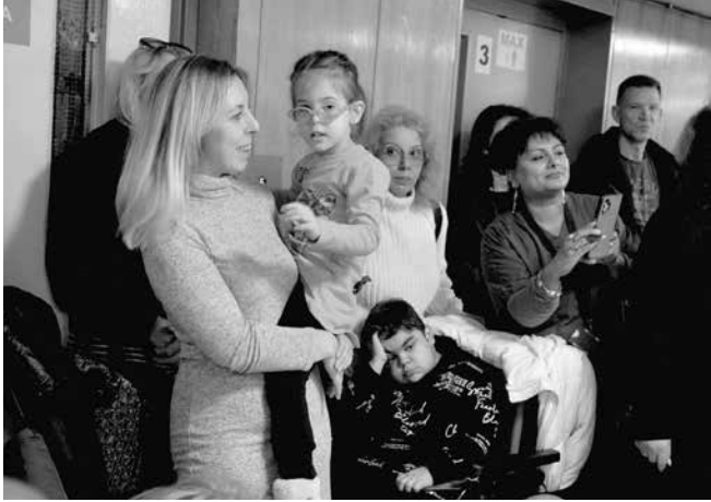
На тържеството бяха и родители с деца, които са лекувани с апаратура, дарена от кампанията

в хиляди български семейства“, каза президентът Радев.