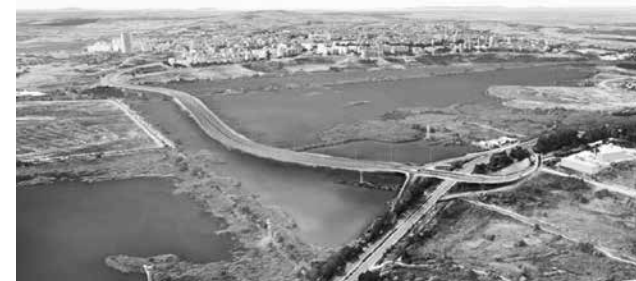
Обходът трябва да премине през езерото. От месеци там върви засипване в едната му част

Към края на проектирането е и проектът за локал в индустриалната зона, който ще се свързва с улица „Георги Попаянов“. Той е част от проекта за двете кръгови кръстовища, които ще се изградят на булевард „Захари Стоянов“.