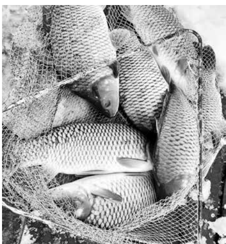
Две години са нужни на шарана да стигне до нашата трапеза

Като голям производител на риба той изнася и за съседна Румъния, където открай време си има клиенти.