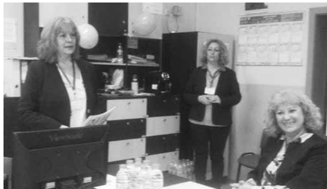
Бившата и настояща директорки на училището

Гостите – техни колеги от училището и детската градина в квартал „Сарафово“ и официалните лица от Общината бяха посрещнати по стара българска традиция с хляб и сол, а децата от ДТА „Звездичка“ с ръководител