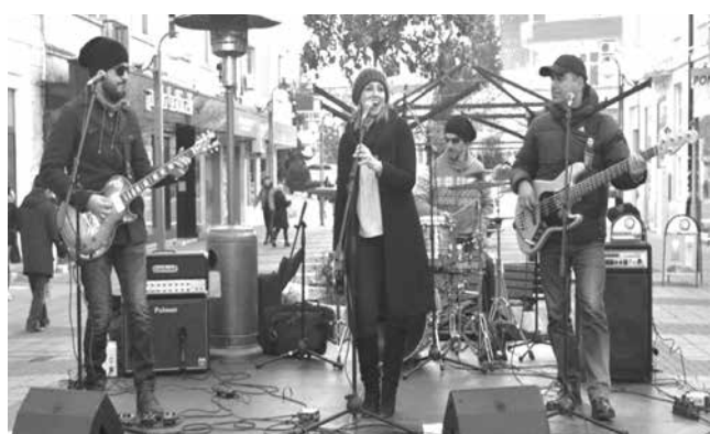
На Никулден десетки изпълнители ще пеят на открити сцени

На Никулден десетки изпълнители ще пеят за вас на открити сцени, които Общината ще постави на различни места в града. Те ще имат важен принос за празничното настроение. Ето кого и къде можете да чуете: