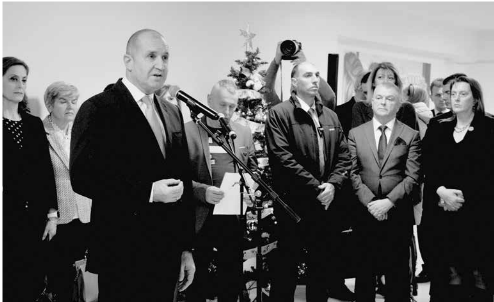
Стартът на кампанията бе даден в детското отделение на УМБАЛ – Бургас

УМБАЛ – Бургас, е сред 26-те болници в страната, подпомогнати през настоящата година с високотехнологична апаратура на