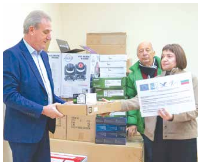
Най-голям брой технически средства по проекта получи НЧ „Васил Левски 1869“ - гр. Айтос