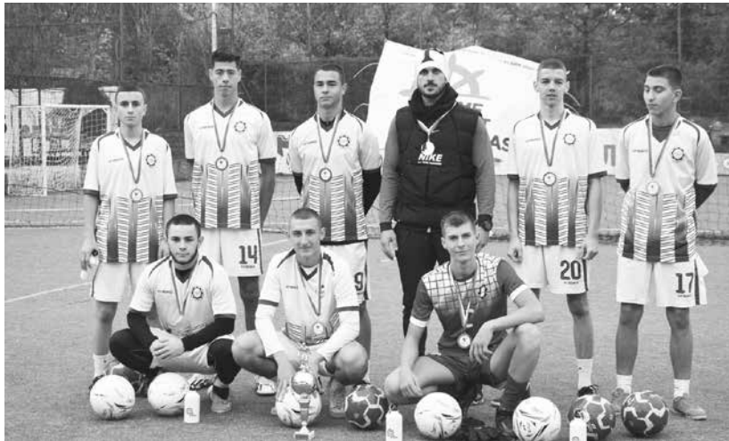
Победителите в турнира

След оспорвана битка чрез дузни отборът на Професионална гимназия по механоелектротехника и електроника спечели турнира по футбол на малки вратички за купата на БМФ Порт Бургас 2023. Младите спортисти надиграха отбора на Професионалната гимназия по транспорт и заслужено извоюваха правото си да бъдат на трибуните на стадиона в Разград, за да подкрепят футболистите на „Лудогорец“ в срещата им с „Нордселанг“, който ще се играе на 14 декември в Разград. Билетите, транспортът от Бургас до Разград и обратно, както и ноцувките за победителите са осигурени от „БМФ Порт Бургас“ АД. Среброто бе завоювано от Професионалната гимназия по транспорт, а бронза взеха младежите от сборния отбор „СНУС 6“. За всички участници турнирът бе абсолютно безплатен. Освен голямата награда, организаторите бяха подготвили купи, медали и индивидуални предметни награди за