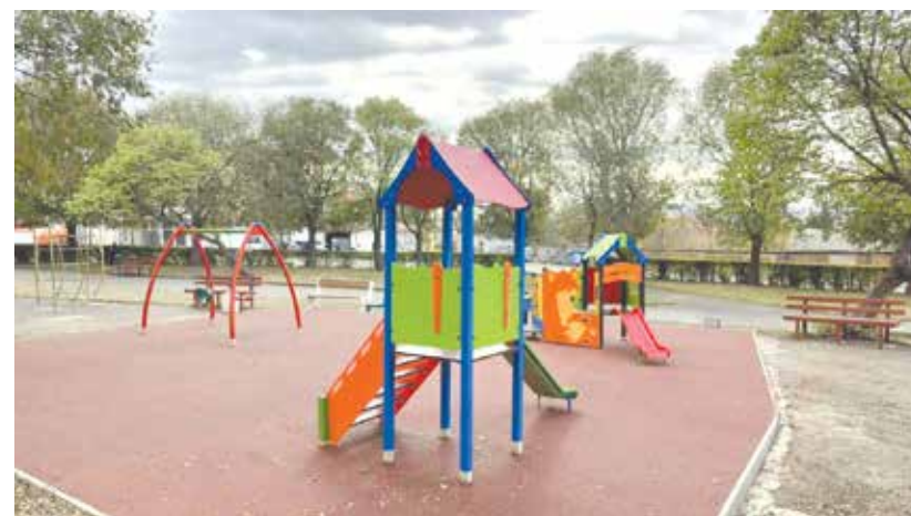
Площадката в градинката до МБАЛ – Айтос