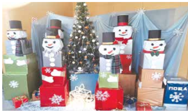
Пощенската кутия във фойето на читалището