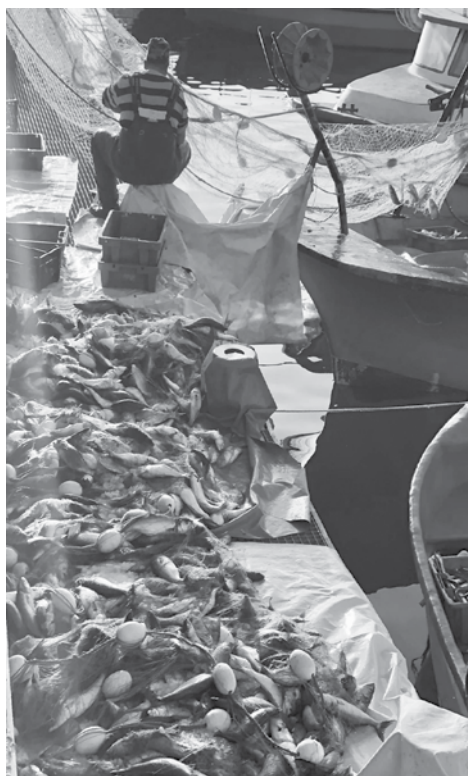
Леферът на юг в момента се движи на по пасажи от 3 – 4 тона, споделят местни рибари