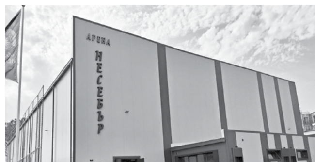
Спортна зала до градския стадион