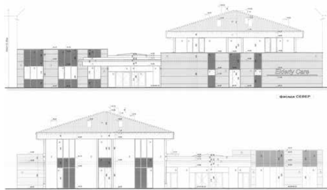
Фасада – дом за стари хора

Стойност на проекта: 9 001 747.99 лв. с ДДС