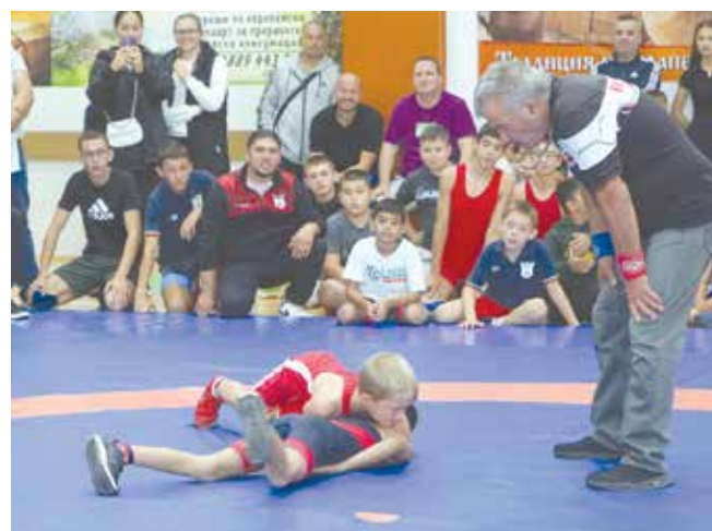
Поредна схватка на един от двата тепиха в спортна зала „Аетос“ – Айтос