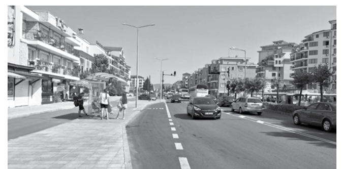
Улица „Първа“ също претърпя частично обновление