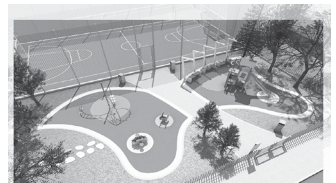
Реконструкция на съществуващи спортни площадки срещу бивш магазин „Хелиос“