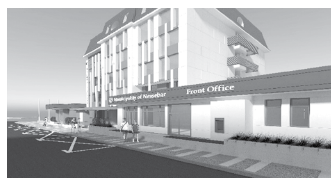
Сградата на община Несебър ще бъде санирана и обновена

Деяностите на общината са свързани с непрекъснатия процес на инфраструктурно обновление и цялата промяна във визията на Новия Несебър, който ще стане пример за елегантност в архитектурния стил на общинските сгради и за привлекателна и функционална градска среда.