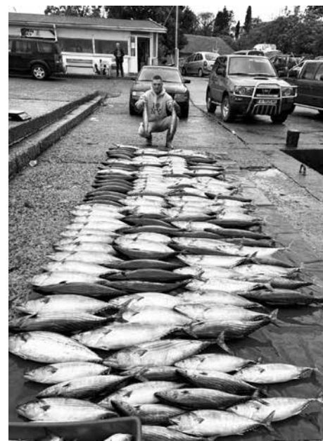
Турук в Царево

Рибари споделят притеснението си във връзка с изграждането на развъд-