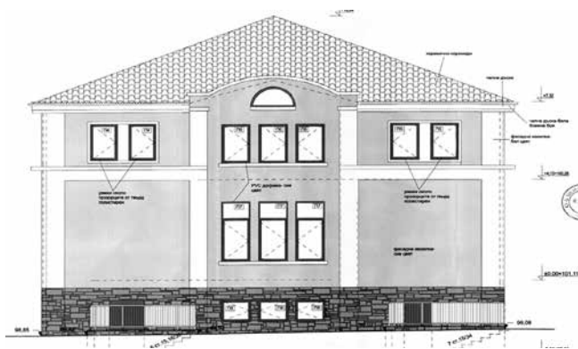
Фасада, Младежки център – гр. Айтос

Стойността на проекта е 1 799 994.62 лв. с ДДС