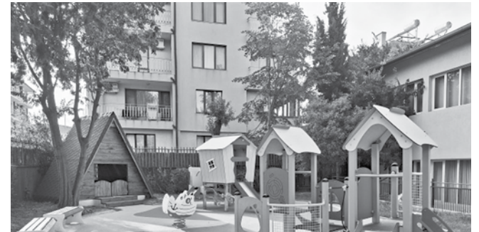
Благоустрояване на дворното пространство ДГ „Яна Лъскова“

Друга улица, претърпяла цялостен ремонт, е „Дюни“. След предприета от ВиК подмяна на водопровод, бе извършено цялостно преасфалтиране и бяха поставени нова тротоарна настилка и бордюри. По ул. „Струма“ бяха монтирани подземни съдове за смет-