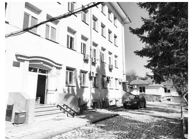
Общината със специална грижа за Детско отделение – първо беше преместено в подходяща и обзаведена нова сграда, а през 2022 г. беше изцяло обновено и оборудвано по проект „Светулка“

Сключено е партньорско споразумение между 18 общини от Югоизточния регион, като община Бургас е водещ партньор.