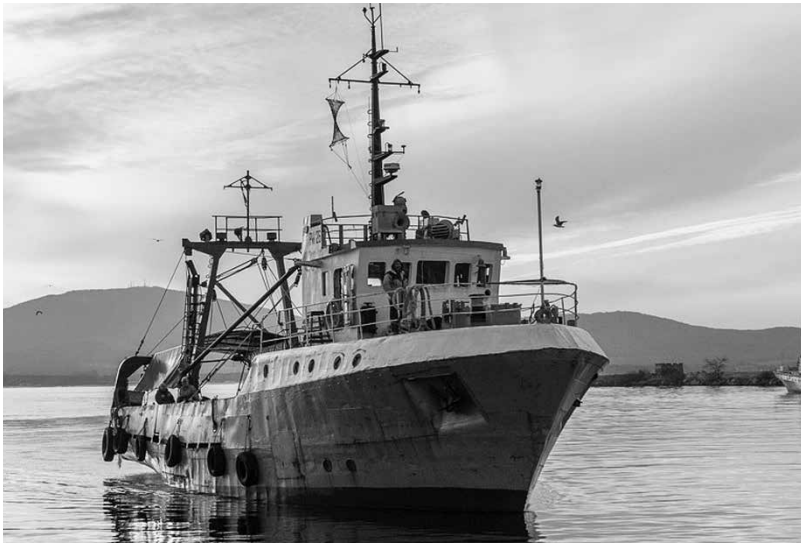
Българските и румънските рибари не са се възползвали от европейско финансиране за подновяване на флота, за разлика от колегите си, които са от държави-партньори на Съюза

Бизнес. Голяма част от РК-тата са безумно амортизирани, а няма финансово подпомагане за нови – рибари закриват дейността си