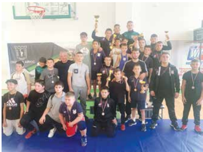
Отборът на КСБ „Айтос“