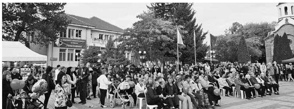
Жителите на площада се радваха на концерта

доверие с бюлетина номер 7, ние ще успеем да я осъществим“ категорична е 2-жа Василева.