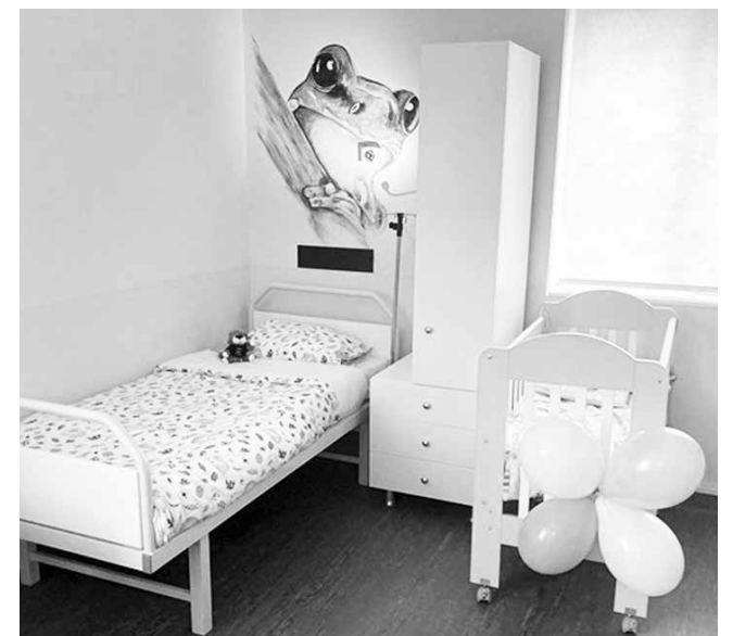
Община Айтос с нов проект, който ще нагряжда добрата болнична среда в Детско отделение на МБАЛ – Айтос.