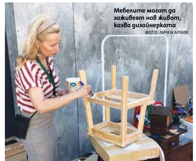
Мебелите могат да заживеят нов живот, казва дизайнерката

Конкурсът е индивидуален и творбите НЕ се връщат!