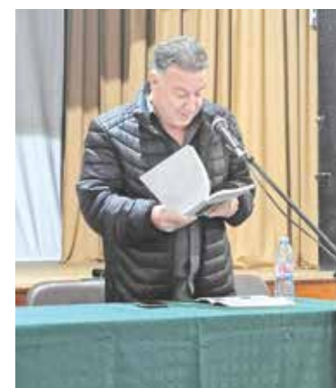
Поетът Васко Попов представи най-новите си стихове на първата си среща с айтозлии