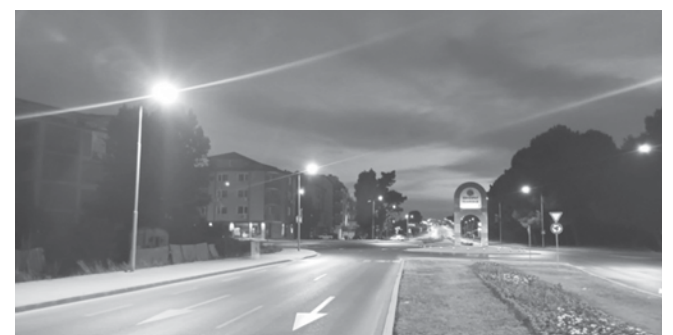
Подмяна на осветителни тела с лег такива по ул. „Иван Вазов“

Изцяло реконструирана, разширена и с нови уреди е детската площадка на същата улица.