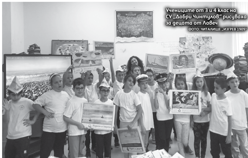
Учениците от 3 и 4 клас на СУ „Добри Чинтулов“ рисуваха за децата от Ловеч

„Големият паламуд е по-рядък. Иначе пак се среща на големи групи от по 100 – 200 риби. Аз специално по 3 – 4 такива големи виждам редовно. Иначе колеги рибари хващат“, споделя Георги.