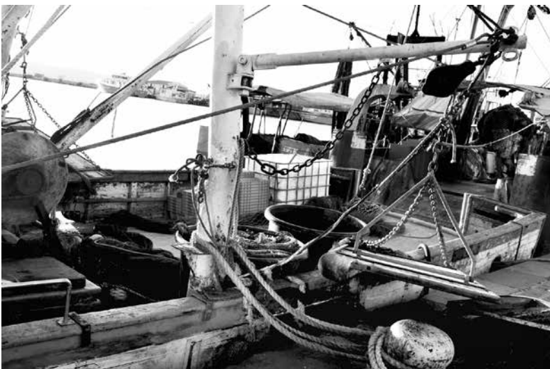
Ръждясали стари корита са голяма част от риболовните кораби на България