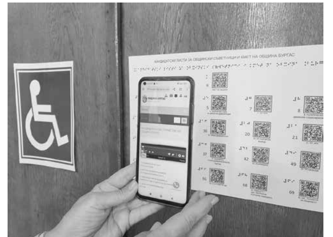
До всички 35 секции ще има поставено и табло за незрящите и слабо виждаци хора с брайлов текст и QR-кодове

До всички 35 секции ще има поставено и табло за незрящите и слабо виждаци хора с брайлов текст