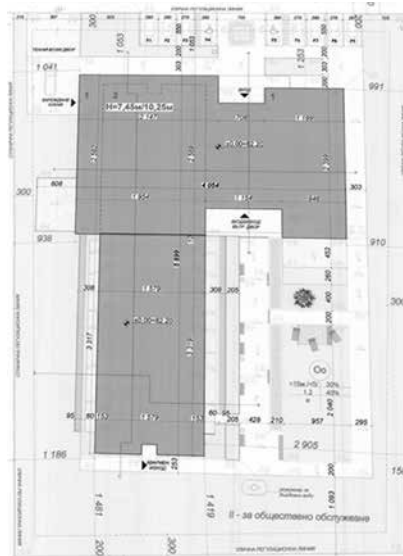
Дом за стари хора – чертеж