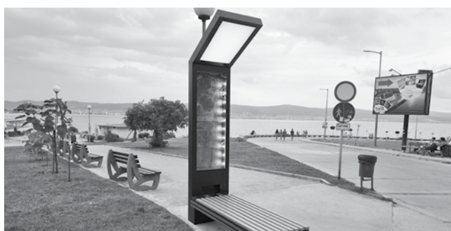
Ремонт на подхода към Северния плаж и Кладенците

Предстоящи в района на северния бряг са дейностите по изграждане на скейтпарк. Планира се цялостно оформяне на зоната под северния скат в интегриран комплекс с културни, спортни и рекреационни функции.