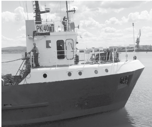
На един риболовен кораб обичайно работят 5-7 души