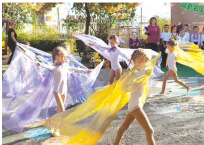
Красиви танци и много знания за родния град

„Има едно градче разперило криле, като орел, политнал към Балкана, едно градче, но с истинско сърце пулсиращо във сради и квартали. Накичено е цялото с цветя, но бвят над него трима братя великани, узваяни от древната скала.“ Специални гости на