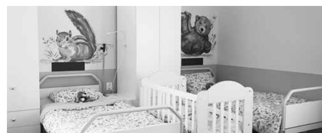
Изцяло реновирани и обзаведени са две болнични отделения в МБАЛ Аймос – Инфекциозно и Детско отделение

– Проект „Извършване на основен ремонт на спортна площадка в СУ „Никола Вапцаров“, гр. Аймос“, одобрен за финансиране по Модул 2 „Основен ремонт на спортни площадки“ по Програма за изграждане и основен ремонт на спортни площадки в държавните и общинските училища към МОН. – 85 211 лв.