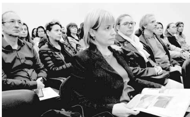
Жители се интересуваха от инфраструктурни проблеми, проблема с бъдещето на СВ. Кирик и автогарата