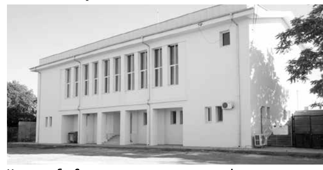
Напълно обновена е спортната зала на градския стадион, която не беше основно ремонтирана от изграждането ѝ през 70-те години на ХХ в.

– Проект „Закупуване на оборудване и обзавеждане на помещения на Защитено жилище за лица с умствена изостаналост“, финансиран от фонд „Социална закрила“ 2023 г. към МТСП. Стойност на проекта: 34 500 лв.