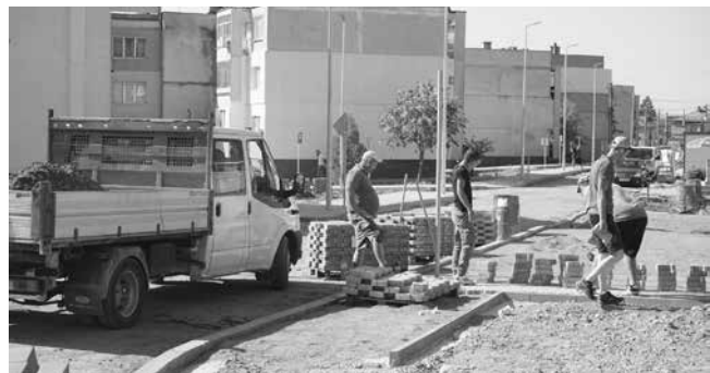
С инвестиция от над 3 млн. лв. Общината цели напълно нова визия на Емировския квартал

– Проект „Реконструкция на улица „Арга“ от О.Т. 24 до О.Т. 7 и улица „Христо Кържиков“ в гр. Аймос“, подаден за финансиране по мярка 7.2 по Стратегията за водено от общностите местно развитие на СНЦ „МИГ-Аймос“ от ПРСР 2014 – 2020 г. – 408 882.84 лв.