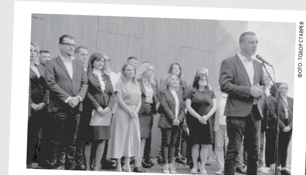
В ГЕРБ този път имат силно юридическо и лекарско присъствие с познати имена от Бургас