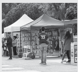
Кандидатите издигнаха шатри в града, в които ежедневно провеждат инфокампани

За третото място ситуацията е малко спорна, тъй като представителите на няколко професии, които моят да се обединят в една графа, задминават с две бройки инженерите. Условно обаче слагаме пред-