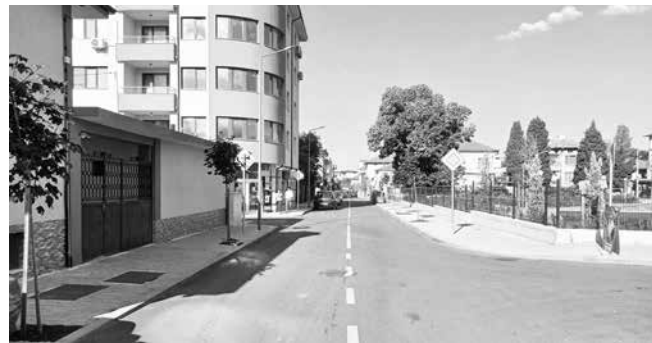
Нови улични и тротоарни настилки в Аймос

– Проект „Благоустройство на Градска градина в кв. 63, гр. Аймос, изграждане на спортна площадка и кът за фитнес“. Стойността на проекта е 1 310 321 лв. Финансирането е осигурено с ПМС. Градската градина е един от символите на град Аймос. Създадена е в началото на ХХ век с доброволния труд на айтозлии и е с площ от 29 543 кв. м.