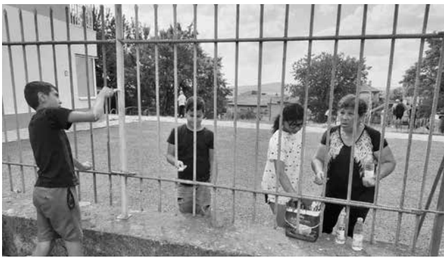
Пример за подражание