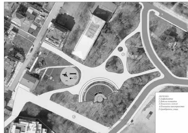
Китен заслужава модерни подходи към плажовете. Предвиждаме амфитеатърът да е разположен в най-ниската точка, където ще има най-добра видимост към сцената. Съществуващото богато озеленяване е естествен декор към него. Пеизажно оформени алеи за разходки, с кътове за сядане, разположени на подходящи места. Предвидена е съвременна детска площадка в откритата част на парка. Осигуряване на необходимите пешеходни връзки с околните улици и обширен подход към църковната сграда.

Освен на гр. Приморско и гр. Китен, подобаващо внимание ще бъде обърнато и на селата в общината. Ще се води активна политика пред държавните институции да започнат незабавни основни ремонти на път II клас Бургаз – Царево и пътица III клас Веселие – Ясна поляна и Ново Паничарево – Ясна поляна, както и за почистване на коритата на реките Дяволска от с. Ясна поляна до гр. Приморско и р. Ропотамо от с. Ново Паничарево до резерват „Ропотамо“. Ще бъдат доизградени ВиК мрежите на селата в общината, както и