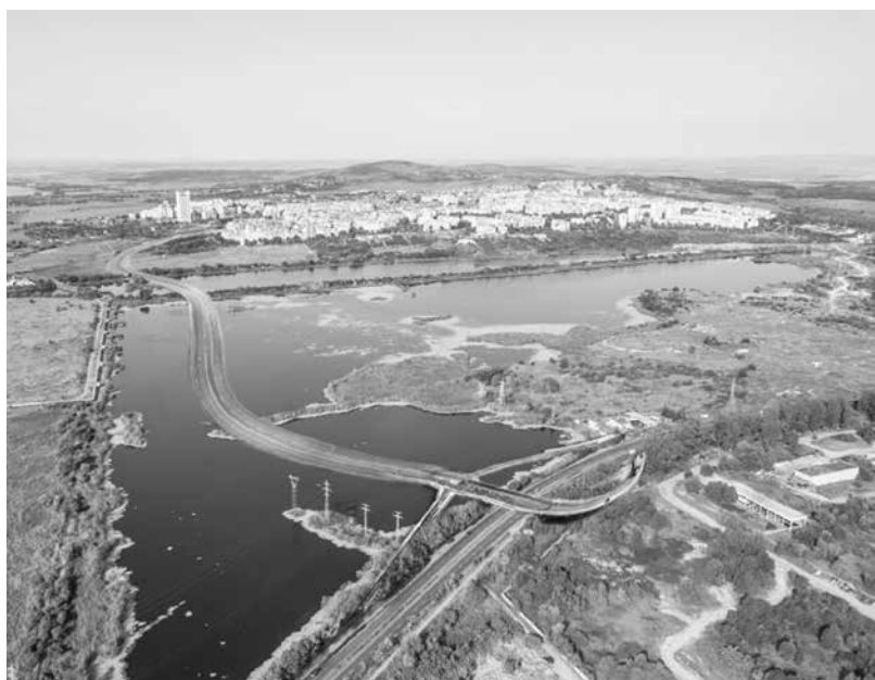
Проект за нов обход на „Меден рудник“

Придобивка. Ще има модерен полигон и картинг писта по пътя за Лъка