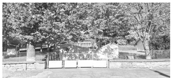
Поддръжката на общинската инфраструктура се извършва регулярно

личаване на населението, ще правим проучване на възможностите за свързване на нови източници на вода към водопровода на селото. Вече ни бяха предложени варианти, които ще проучим. След реконструкцията и въвеждането на пътя през Дюлинския проход в експлоатация се очаква значително нарастване на пътникопотока и нови възможности за икономическа инициатива. Тези дни започваме и рехабилитация на