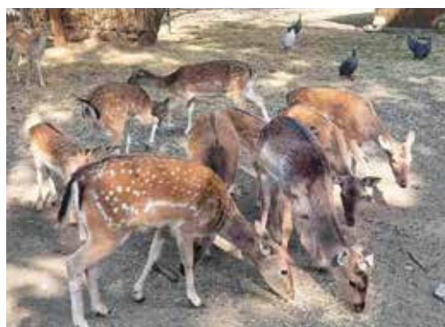
Четири елена лопатари от колекцията на зоопарка бяха предоставени на сдружение ФОНД ЗА ДИВАТА ФЛОРА И ФАУНА

Новата роля на модерните зоопаркове по света е да развъждат ценни, редки и застрашени видове животни, като приплодите се изпращат контролирано в естествена среда, на места, на