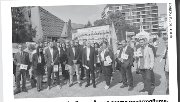
В листата „Български възход“ има доста представители на частния бизнес

и здравеопазването. Тук спектърът от професии е най-широк – лекари, хирурзи, месестри, стоматолози, зъботехници, ветеринарни лекари, фелдшери, здравна администрация и студент по медицина са сред кандидатите.