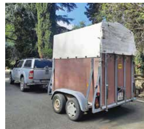
На път за Котел