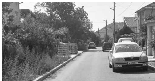
Реновирани улици в с. Поляново

– Проект „Подобряване на уличните настилки на населените места в Община Аймос“ /Улица № 3 с. Поляново и улици №6 и №7 с. Маака поляна – 334 957.38 лева.