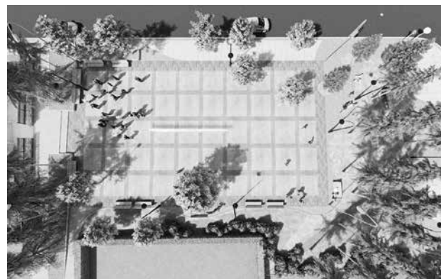
Площад пред храм „Св. св. Кирил и Методий“ и читалището в гр. Приморско. Обектът предвижда изграждане на площадно пространство, което да възстанови общата духовна връзка между църковния храм и читалището. Съществуващите дървета ще бъдат запазени и допълнени с богата декоративна растителност, осветление, кътове за сядане и отмора.

предвиждат на пречиствателни станции там, процесът ще бъде завършен с поетапно обновяване на улици (вкл. ремонтни дейности на подземната инфраструктура). В с. Ясна поляна и с. Веселие е необходим ремонт на покривите и обезопасяване на училищата. Ще се обследват и приведат съгласно нормативните изисквания всички детски площадки в селата.