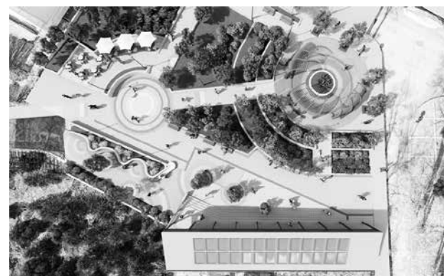
Проектът предвижда благоустройство на територията, богато озеленяване, повече места за отдих, безпрепятствено движение към плажа и ситуиране на търговски обекти, така че да не доминират в пространственото оформление. За улицата „Черно море“ през летния сезон се предвижда превръщането ѝ в пешеходна, с контролиран достъп на автомобили, чрез пътека в настилката Болару. Предвижда се подмяна на водопровода и изграждане на дъждовна канализация и ново енергоспестяващо улично осветление.