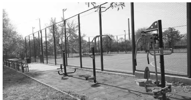
Спортна площадка №4

– Проект „Спортна площадка № 4 в УПИ I – за спортен терен, кв. 50, по плана на гр. Аймос“, по Програмата за развитие на селските райони за периода 2014 – 2020 г. – 84 804.36 лв.