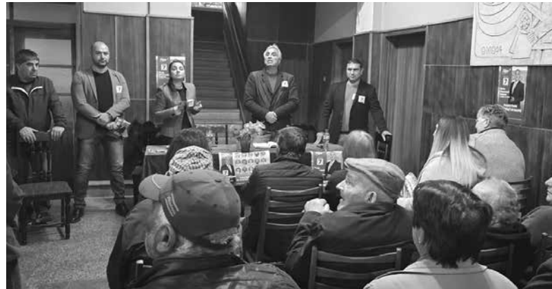
Срещите преминават при голям интерес от хората

„Житейската логика е такава, че когато един човек достигне своя апогей в бизнеса, иска да остави нещо значимо след себе си. За съжаление в Сунгурларе не се случва нищо. Онзи ден в село Костен си говорихме, че такава нямане не се среща никъде дру-