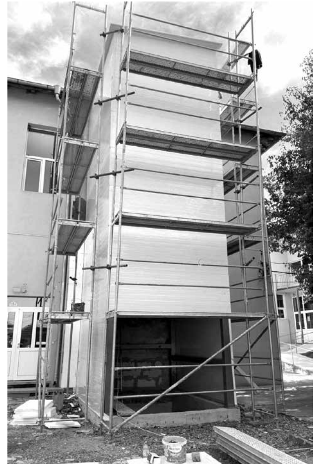
За удобство на медиците и за по-добро обслужване на пациентите на Вътрешно отделение на „МБАЛ – Айтос“ ЕООД, Общината изгражда външен болничен асансьор