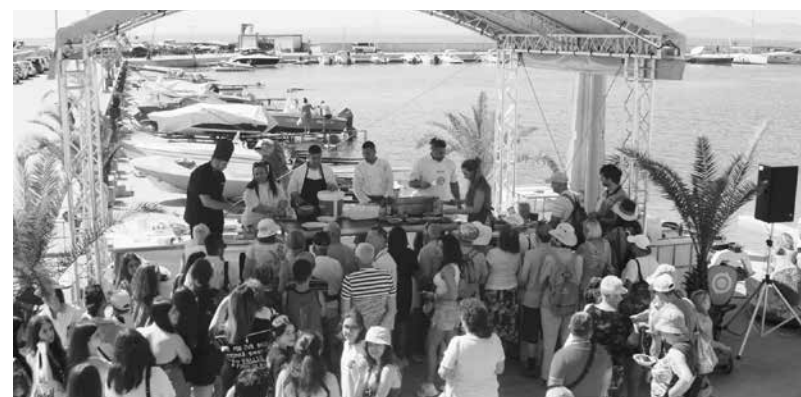
Повече от 600 апетитни блюда опитаха поморийци и гости

на Рибарско пристанище – Поморие бяха раздадени повече от 600 апетитни рибни блюда, а шеф Виктор Зайкова от Hell's Kitchen и шеф Махмуд ал Байруми от MasterChef приготвиха неустоими хапки за всички присъстващи.