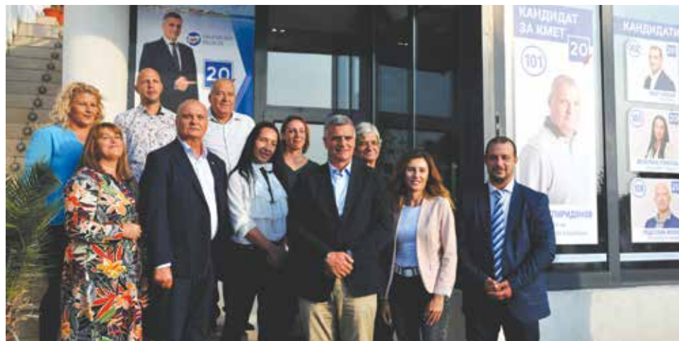
Прег офиса на партията цялата листа, кандидатът за кмет и лидерът Стефан Янев

„Искрено вярвам, че на много места „Български възход“ ще поднесе много приятна изненада. Тя няма да е за нас, защото ние се познаваме и знаем, че можем“, уточни той.