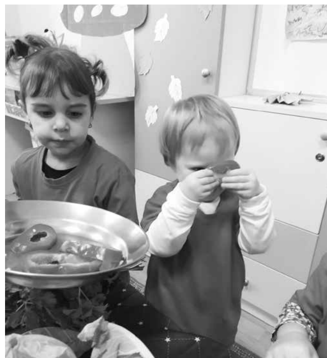
„Есенни плодове“, „Есенни зеленчуци“, „Тиквата – Вкусна, ароматна и полезна“, „Етикет и култура на храненето“, „Здравословна кухня от мистична Странджа планина“ – това бяха темите миналата година на дните на здравословното хранене

Още от детската градина например не обичат риба и зелено. Имам коментари от директори на детски градини, които споделят изказване на деца: „Днес е петък, има риба – не искам на градина“, обясни