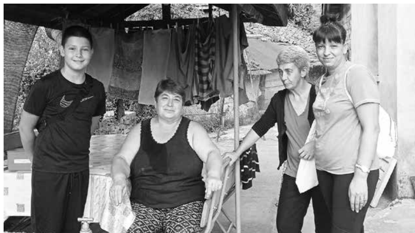
Жорка от Кости, чиято къща е в близост и до дола, и до реката

Кауза. 3177 лв. са събраните средства, разделени между 14 от най-пострадалите къщи в селото