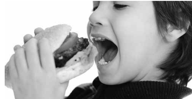
„Свърхпереработените“ храни са лесни за приготвяне (и вкусни!), но твърде голямата им консумация може да бъде вредна за здравето – увеличава затлъстяването

По мое мнение на една част от децата ястията