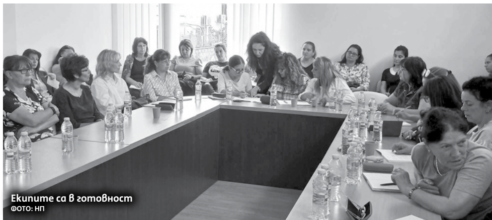
Екипите са в готовност ФОТО: НП