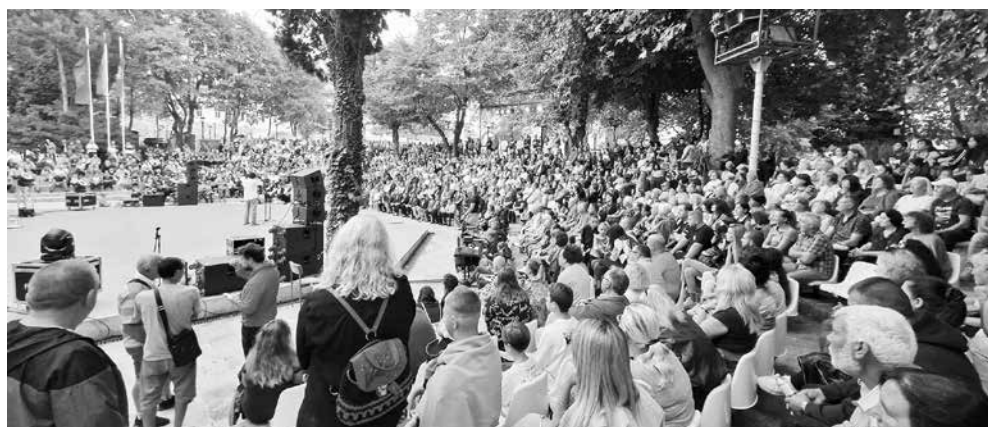
Амфитеатърът бе изпълнен до краен предел