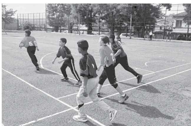
Забавление чрез физическа активност

организирали игри за възпитаниците от начален и прогимназиален етап. Спортният празник премина с много движение и положителни емоции за всички.