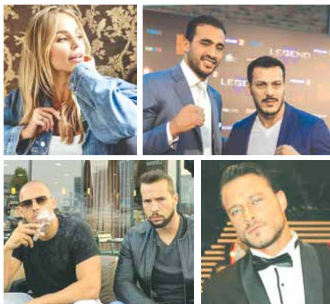
Част от звездите, които ще посетят „Арена Бургас“ утре вечер за турнира по кикбокс от Веригата Glory