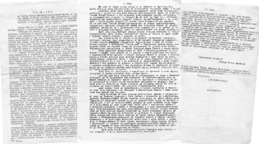
Факсимиле от спомените на Петър Ошавков, описващи събитията от 1913-а

В памет на Димитър Атанасов Ошавков, дългогодишен председател на Тракийското дружество в Айтос.