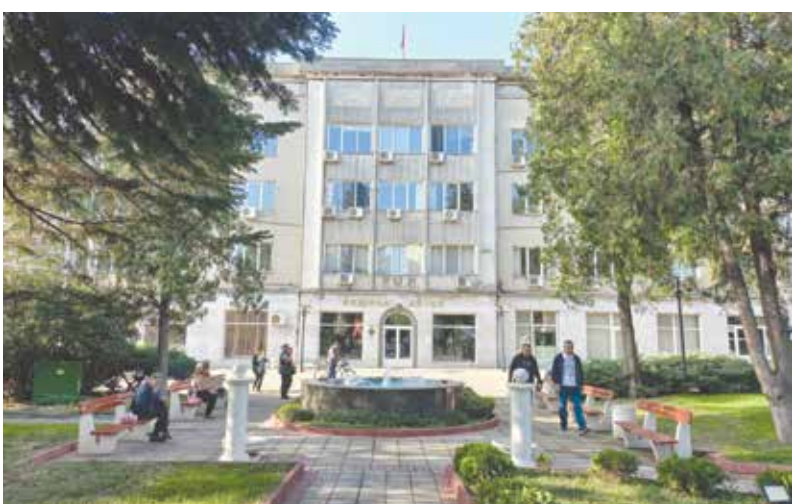
Преди местния вот в Айтос е спокойно, напрежението е във Фейсбук

153-ма ще претендират за 29 места в местния парламент