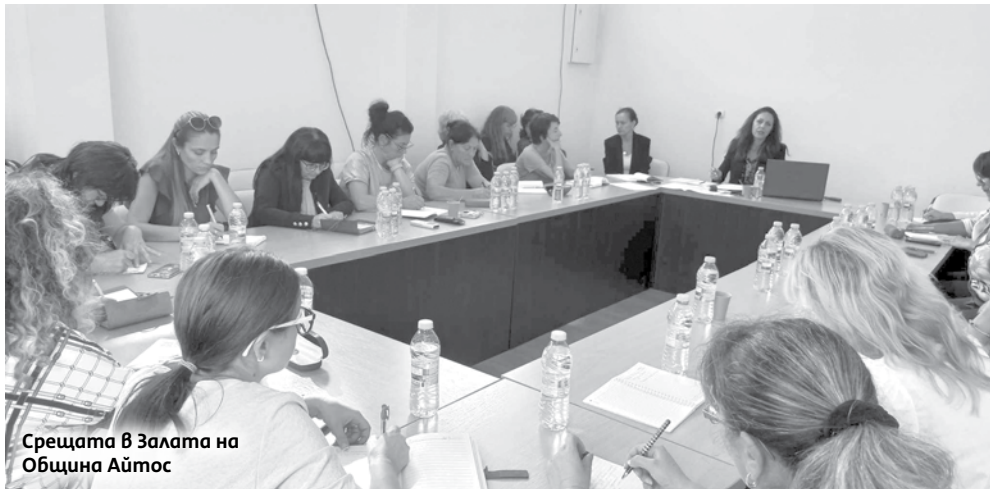
Срещата в Залата на Община Айто̀с