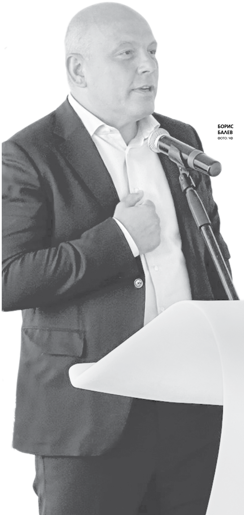
БОРИС БАЛЕV

■ Владее английски, испански и италиански език.