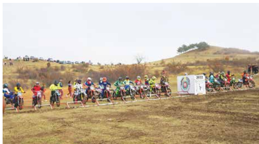
Заради местния вот, Мотокрос 2023 ще се проведе не както досега през октомври, а на 11 ноември