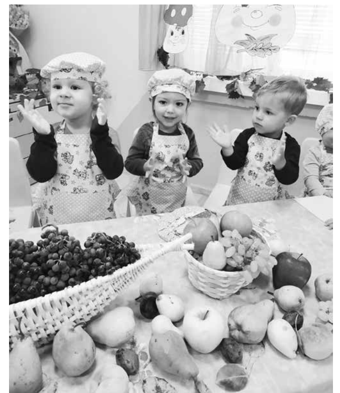
Едва 1/3 от децата консумират всеки ден плодове и зеленчуци