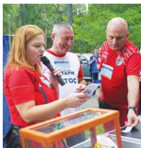
Ротари – Айтос с томбола изненада