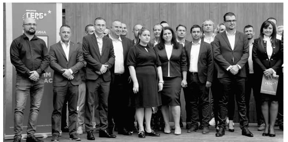
Листата с кандидат-съветници по време на представянето