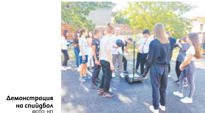
Демонстрация на спийдбол

Много бяха спортните събития в СУ „Никола И. Вапцаров“. Сред най-емоционал-