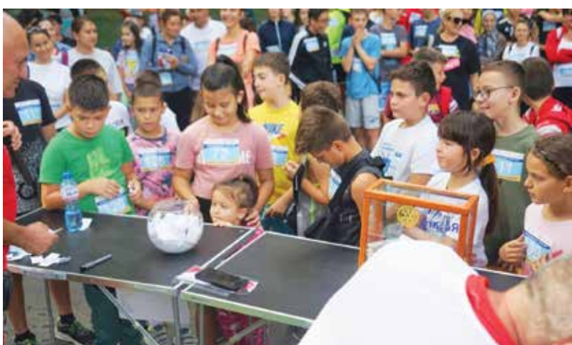
4-годишна беше най-малката участничка в кроса