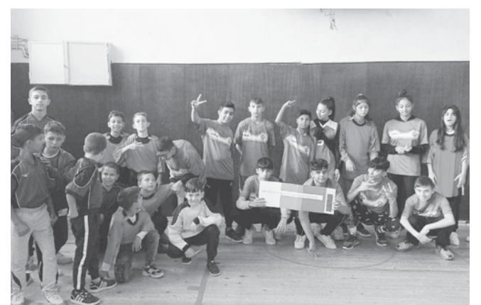
Много желаещи да научат азбуката на баскетбола