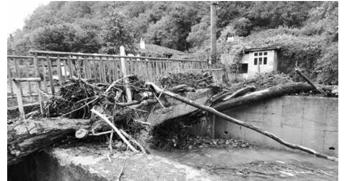
Водният аг в началото на септември 2023 г.

зая ни на три пъти. Друг път не се е случвало таква нещца. Всичко остана под вода до втория етаж. Имаме помпа за точене на водата, защото реката не се почиства от години и знаем, че в такива случаи трябва да се справяме сами. Преди време бяха тръгнали да разбиват Кукулчето, докараха подходяща машина. Спряха ги зелените организации. Ако това нещца се разбие, реката вече няма да има тази сила и