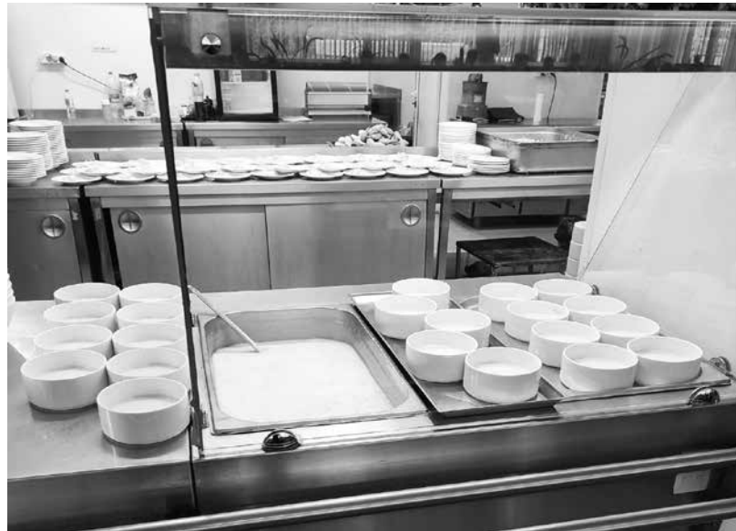
Супата не е сред любимите ястия на учениците

„Майка дойде при мен да правим меню на дете с тежки алергии и аз питам, кажете с какво го храните вкъщи, за да се опитам да доближа менюто му до това, което яде вкъщи. Отговорът на майката бе – ами обича кренвирши и