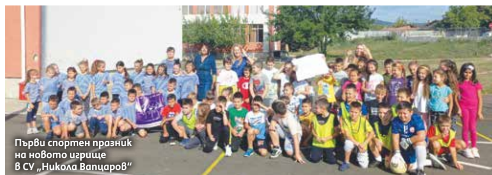
Първи спортен празник на новото игрище в СУ „Никола Вапцаров“