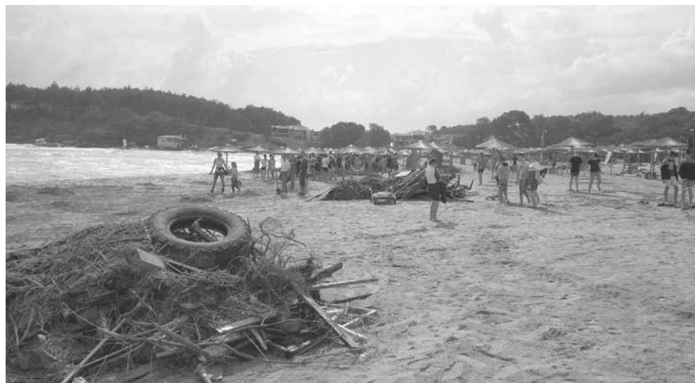
„Арапя“ след бурята