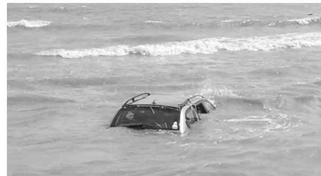
Автомобили в плитчините на плажовете са обичайна гледка