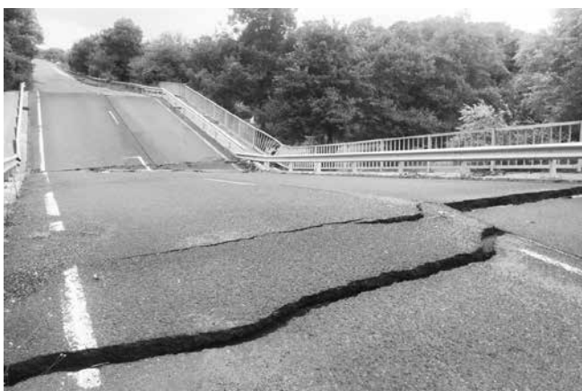
Разрушеният мост на пътя Царево – Ахтопол. Сглобяват временен мост, а АПИ обяви поръчка за нов

„Всичко гоиде от реката. Като се вдигна вълната, повлече всичко по пътя си. Колите се въртяха като палачинки, водата ги поне-