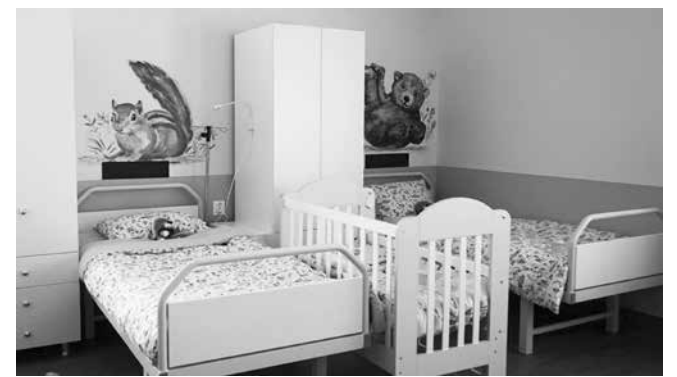
Децата са приоритет – осигурени са възможно най-добрите условия в Детско отделение на МБАЛ – Айтос

наградихме тази социална услуга с втори проект „Патронажна грижа +“ на стойност 114 266,88 лв. В момента се изпълняват проект „Грижа в дома“ в града и селата, на стойност 636 476 лв., и проект за укрепване на капацитета на община Айтос за предоставяне на социални услуги, на стойност 88 811 лв. По този проект целта е да бъде открит нов офис за гражданите, нуждаещи се от социална подкрепа.