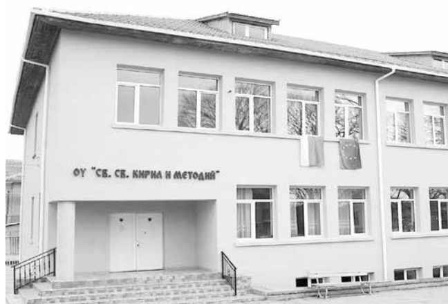
По ахтополското училище няма поражения от дъждовете

По време на водния ад, сковал града, директорката е била в сградата на началното училище. Там водата е била с височина петдесет сантиметра, а в парното водният стълб е бил повече от метър, защото то се намира под земята.