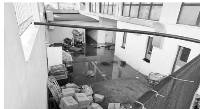
Водата заля мазета, приземни, че дори и първи етажи в някои хотели