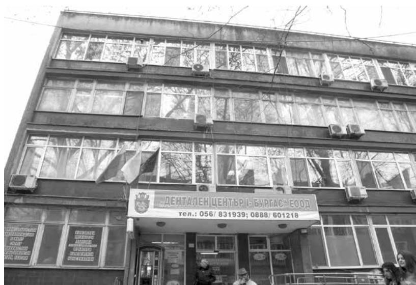
Ще се търсят начини за финансиране на спешния кабинет

„Приемете тази докладна, ще се търсят варианти за финансови източници“, заяви той като припомни, че Регионална библиотека „П. Яворов“ работи от ля-