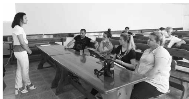
Срещата в с. Тополица