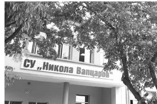
Първият учебен ден в СУ „Н. И. Вапцаров“, Царево ще започне нормално