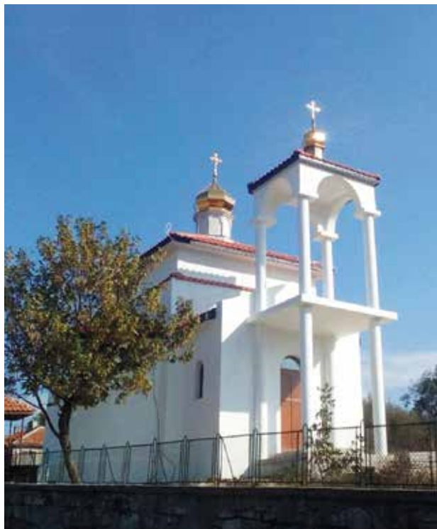
Храм „Св. Рождество Богородично“, с. Дрянковец