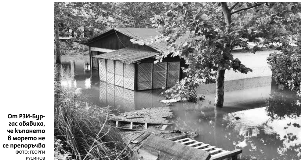
От РЗИ-Бургас обявиха, че къпането в морето не се препоръчва

Съпричастност. Техника и доброволци участват във възстановителните дейности