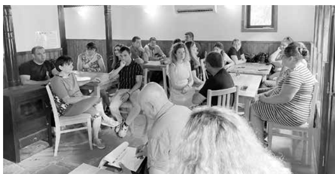
В Посетителски център „Генгер“ в Айто̀с

п.к. 8500 град Айто̀с, община Айто̀с, област Бургас, ул. „Васил Левски“ № 2 www.mig-aytos.com; моб. тел. +359 886 881 212; e-mail: mig_aytos@abv.bg