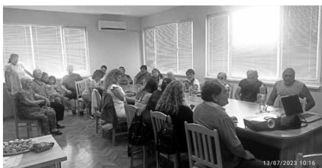
Интерес към новата Стратегия в с. Пирне