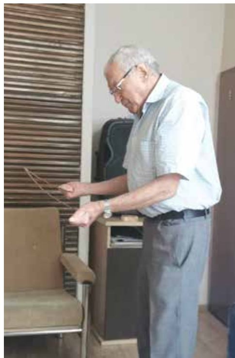
Време за демонстрация