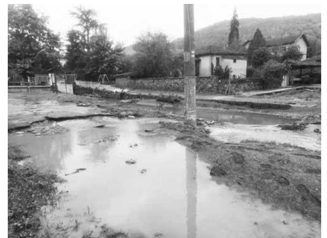
Водата се отдръпва и личат пораженията по улиците

дата няма как да я обвиняваме. Този път водната стихия дойде от дерето, а не от реката, както беше през 2006 година. Тогава дъждовете бяха в Турция и