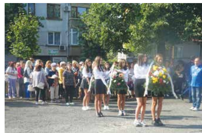
Ритуал за поднасяне на венци и цветя пред паметната плоча на Съединението