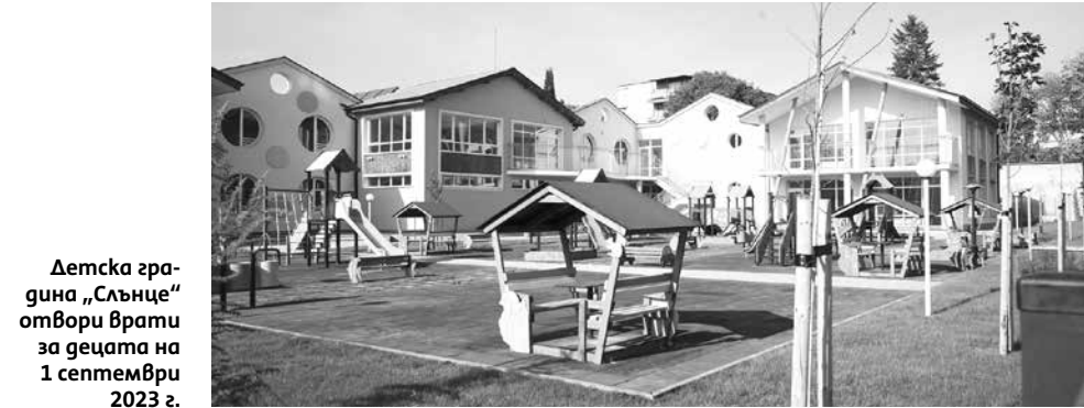
Детска градина „Слънце“ отвори врати за децата на 1 септември 2023 г.

Много важен за добре поддържаната зелена инфраструктура е вторият проект за подобряване опазването на околната среда, който изпълнихме успешно с администрацията на Одрин, РТ, по Програмата за Трансгранично сътрудничество. Общата стойност на двата огледални проекта е 346 831.65 евро. По двата проекта успяхме да закупим техника и оборудване за поддръжката на зелената инфраструктура, и не изхарчихме нито лев от бюджета за тази цел. Другият „международен“ проект беше за ремонта на централна сграда на