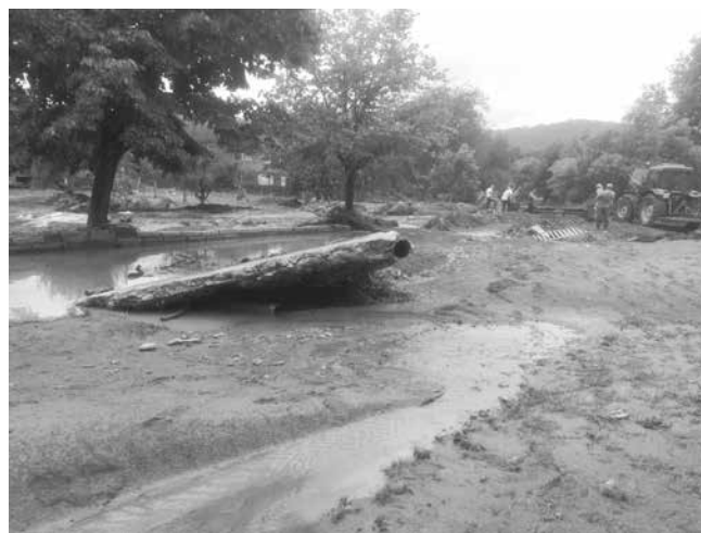
Дерето е изцяло разрушено от водата

чистено, то бе иззидано, въпреки, че през далечната 1974–75 година е правено, но си бе добре направено. Просто количеството вода беше огромно. Приро-