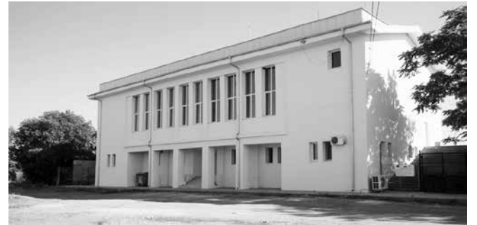
Спортната зала на стадион „Крум Делчев“

По отношение на социалната политика – факт е, че все повече хора се нуждаят от социална закрила. Затова работим по проекти за повече и по-качествени социални услуги. Изпълнихме проект „Патронажна грижа“ за 114 266 лв. и