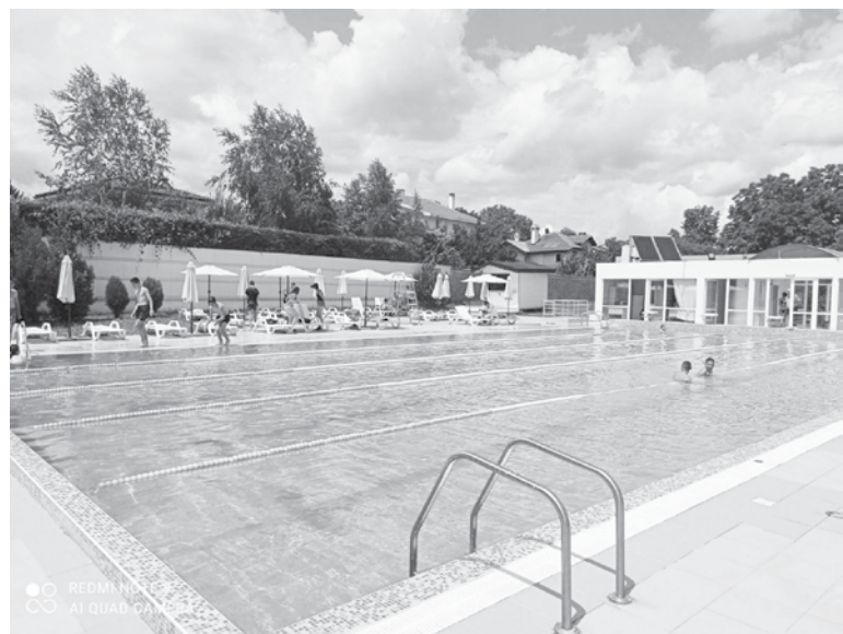
Откритите плувни басейни при Експозитър „Флора“ и в квартал „Ветрен“ ще бъдат затворени на 10 септември

Басейнът в комплекс „Парк Арена ОЗК“ е с работно време от 07:00 до 21:00 часа.