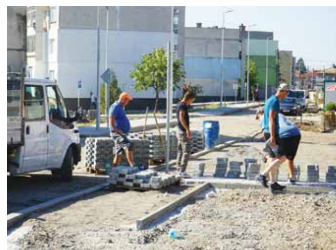
Продължава работата по проекта за благоустрояване на Емировския квартал

– Градската градина е създадена с доброволния труд на айтозлии, над стогодишна е,