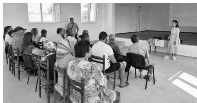
В обновеното читалище на с. Пещерско