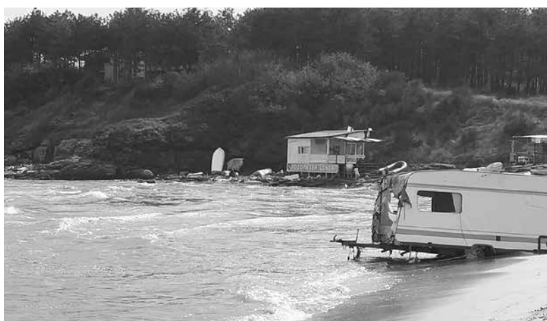
Водата започна да се оттегля и да се оценяват щетите