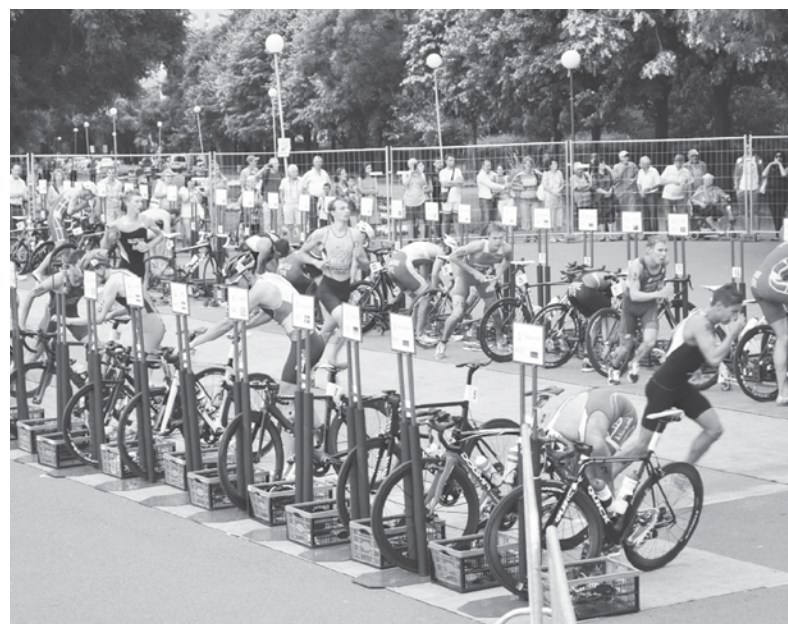
Стартът на събитията е от 07:00 часа в събота

Пешеходци и велосипедисти ще бъдат пропускани от доброволци на събитието, когато на терен няма състезатели. Стартът на събитията е от 07:00 часа в събота. Състезанието ще продължи през двата почивни дни. Достъпът до търговските обекти ще бъде затруднен.