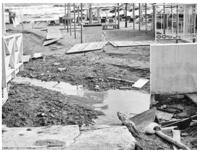
Плажът на „Нестинарка“ е буквално „изоран“ наполовина