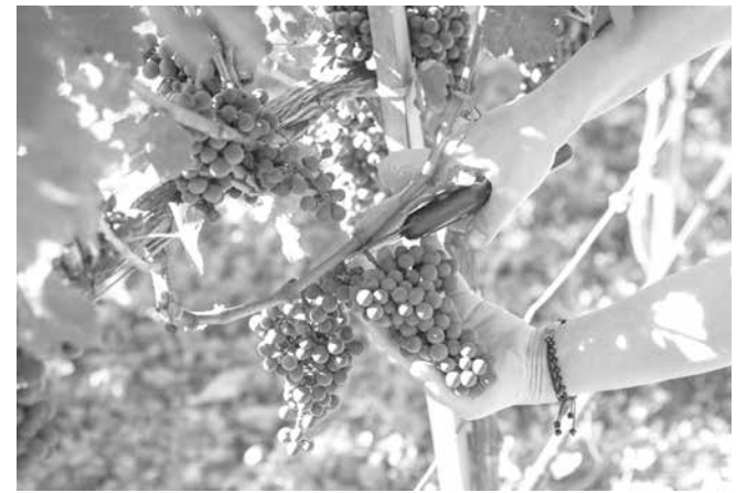
По време на гроздобера лозарите се молят да не вали