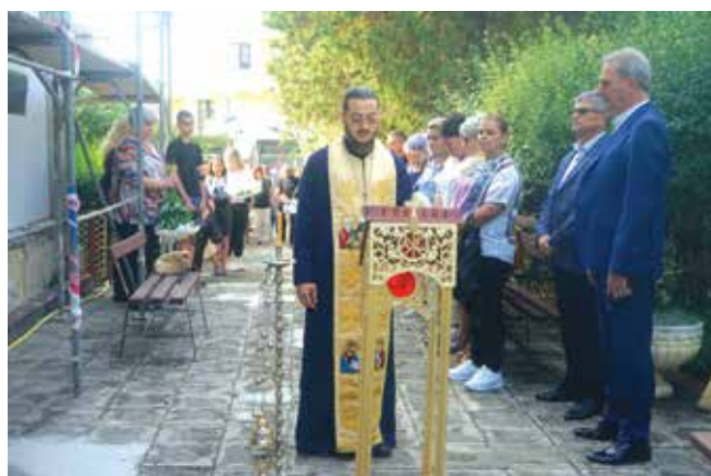
Молитва за здраве и спасение на бедствачите в община Царево

Паметният знак за обединението на всички българи в една държава е поставен от айтоското гражданство през 1985 г. на една от стените на училището, в което е квартирувал щабът на 11-а Айтоска дружина, участвала в историческите събития, свързани със Съединението.