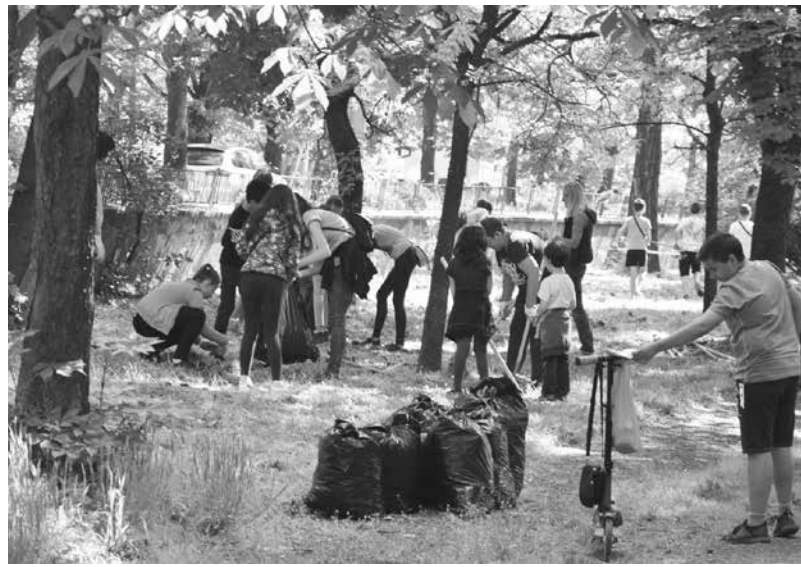
Община Айто̀с не е пропуснала нито едно издание на инициативата „Да почистим България заедно“

Искате да живеете на чисто?! Включете се!