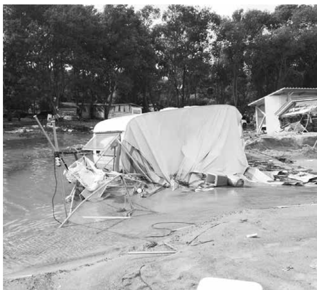
Множество каравани са отнесени от водите и са с поражения

Едно е сигурно. Дълго време животът на хората в Царево и засегнатите населени места няма да е същият. Шокът бе силен и ще отминава дълго време. Нелипсваха и такива, които опитаха да правят политически изказвания с трагедията, но опитите им не бяха добре посрещнати точно в такъв момент. Остават и въпросите, разбира се – има ли други причини за бедствието освен обилното количество дъжд, което се изсипа. Въпроси, на които ще опитаме да търсим отговори.