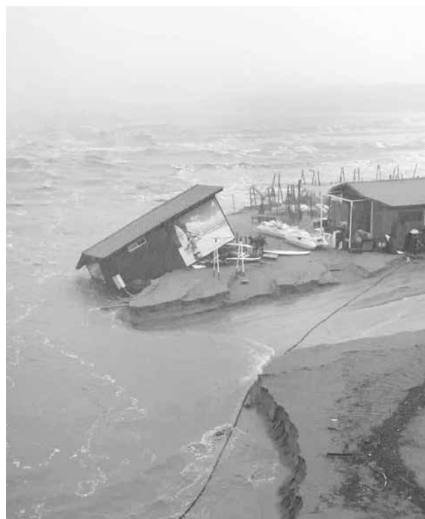
Така изглеждаше сръф училището на „Нестинарка“ след бурята, то бе завлечено в морето

Ако сте изричали нещо такова, или сте били част от подобен сюжет, няма смисъл да мрънкаме. Вие сте сред многото виновни, за това, което се случва днес.