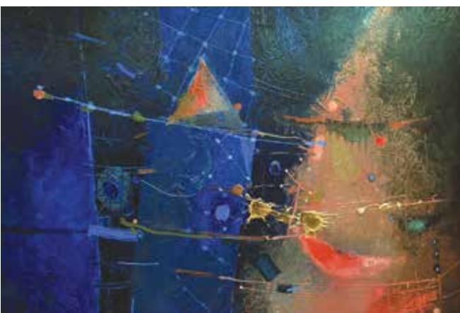
Цветните картини, които те отправят в друг свят