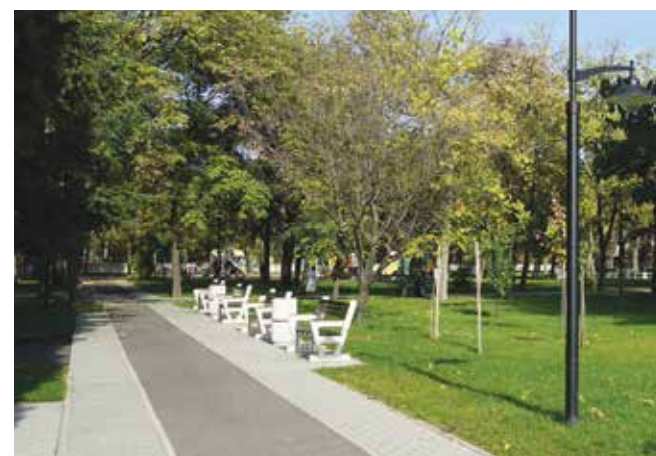
Градската градина на Айтос

а благоустрояването ѝ е отлагано в годините. Радвам се, че успяхме да осигурим финансиране и да благоустроим тези близо 30 000 кв. м зелени площи и съоръженията там.