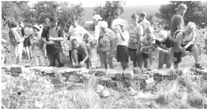
Спасителният център в село Баня се радва и на редовни посетители

„Свѣдѣт изглежда, поне според консултациите, които проведох, си е прав. След като по този начин е поставен въпросът, отговорът е този. Аз не съм наследникна починалия си съпруг, с който бяхме на семейни начала, което също утежнява нещата. Децата наследяват фондацията, която е в частна полза. Има си клауза в устава, която казва, че всъщност наследници са децата. Тази промяна беше направена през 2020-а. Тук има една малка подробност, че администрацията открай време се занимава аз и всъщност аз сложих тази клауза, която сега е препъник един вид. Реално търся някакъв начин, по който казусът да бъде представен така, че да се разгледа от друг ъгъл. Сигурна съм, че ще се намери решение. Ако има задължения една организация, трябва да си ги покрива. Тези малолетни деца не биха