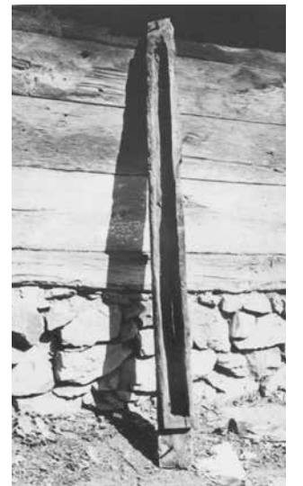
Стълбът-скривалище на знамето на Стоиловския революционен участък в къщата на Петър Горев, участник в Илинденско-Преображенското въстание, в с. Заберново, сниман откъм вдлъбнатата му страна, 1959 г.