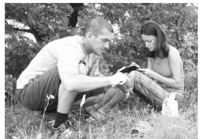
Отново един до друг, воейки си запущки