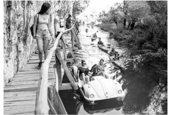
Голяма част от посетителите във вътрешността на страната, като например Златна Панега, са водени от нелицензирани фирми