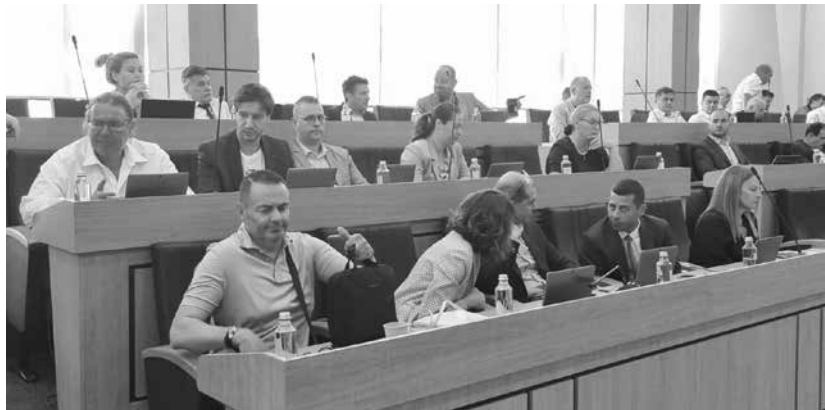
Групата на ГЕРБ