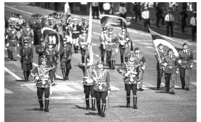
ЦЕНТРАЛНО ВОЕННО ОКРЪЖИЕ ВОЕННО ОКРЪЖИЕ II СТЕПЕН - БУРГАС гр. Бургас, 8000, ул. „Цар Асен“ №4, тел. 02/922 3876

Място на изложбата: Галерия „Арт Сол“, ул. „Крайбрежна“ 1, гр. Созопол Творци на фокус: Стефан Ферачи, Даниела Тодорова Медийни контакти: 0878 439 541