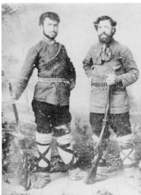
Лефтер Мечев със Стоян Москов по време на Илинденско-Преображенското въстание, 1903 г.