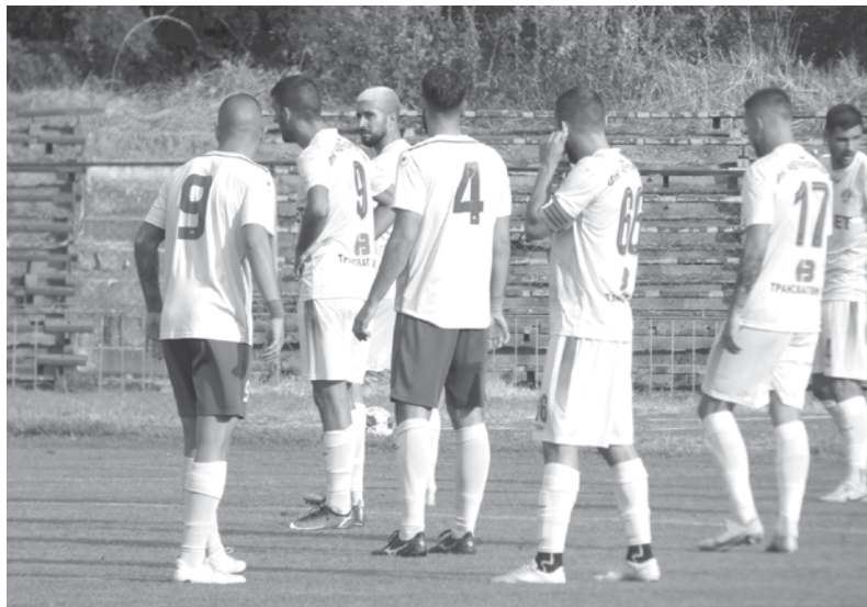
Бургазлии и пловдивчани си спретнаха шестголов трилър

Последва мигновена реакция от пловдивчани, което откряха резултата в 4-ата