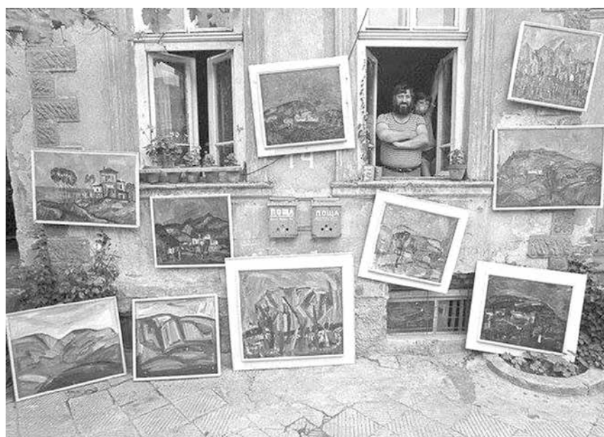
Част от творчеството му