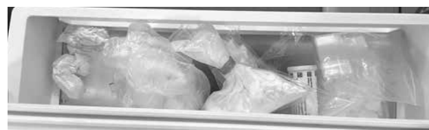
Хладилникът на софиянеца е пълен със забранени вещества