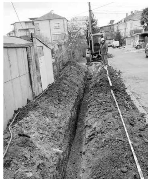
През февруари „Електроразпределение Юг“ стартира първия етап от дейности по подобряване на хранването за кв. „Сарафово“. Той включва полагане на нова подземна кабелна линия в квартала. Новият кабел е с дължина 500 метра и свързва два трафопоста

ват все по-малко хората с технически специалности, въпреки това дружеството осигурява стажове и на икономисти, юристи и др.