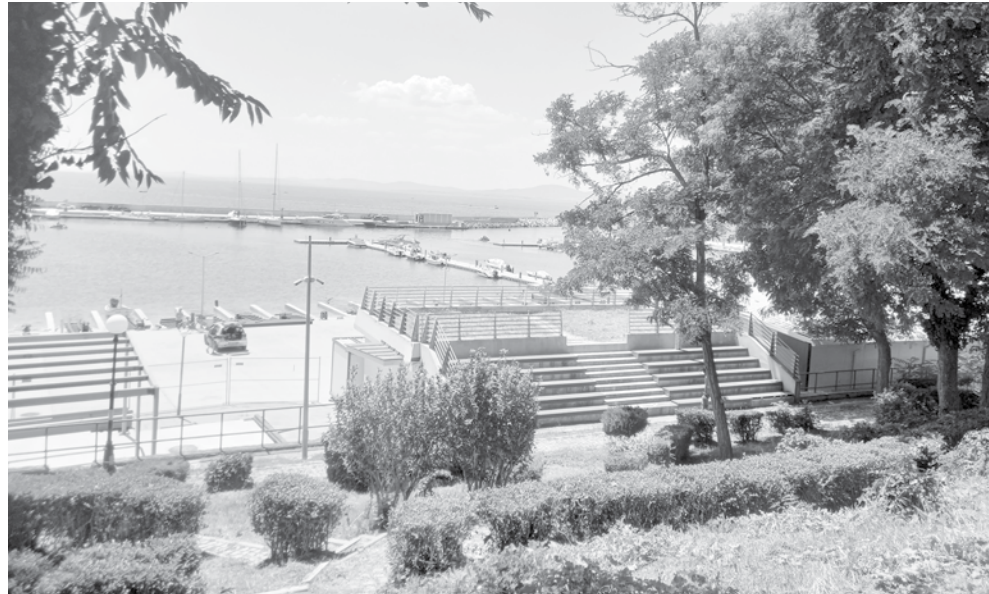
За този скат се каза, че остава общински и ще служи за озеленяване и паркинг, но няма да е включен в юлската докладна

Новоучреденият ПУП ще се намира в най-апетитната част на града – старата, в района между интерхотел „Поморие“ – някогашна соцемблема