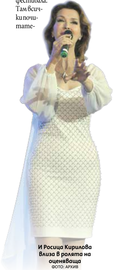
И Росица Кирилова влиза в ролята на оценяваща

Песните в конкурсната част на форума вече могат да бъдат чути в сайта на фестивала. Там всички посетители