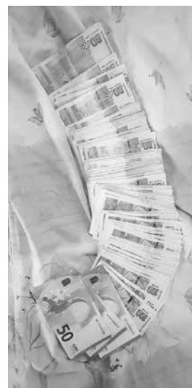
В квартирата са намерени близо 9 хиляди лева

Открита и иззета е сумата от 8750 лв. в банкноти с различен номинал. Софиянецът е задържан за срок до 24 часа.