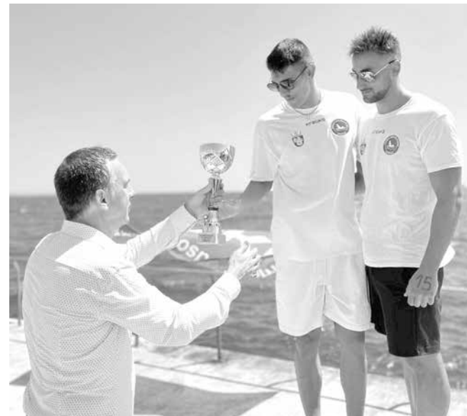
Победителите на почетната стълбичка

Призьорите бяха наградени от кмета Дими-