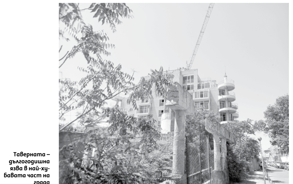
Таверната – дългогодишна язва в най-хубавата част на града

ЗАПОВЕД № РД-09-521/20.07.2023 г гр. Камено