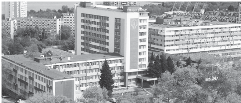
В Бургаската университетска болница се обучават в момента над 50 специализанти

В момента в болницата се обучават над 50 специализанти. Свободните места се обявяват минимум два пъти годишно, като интерес към тях проявяват лекари от цялата страна.