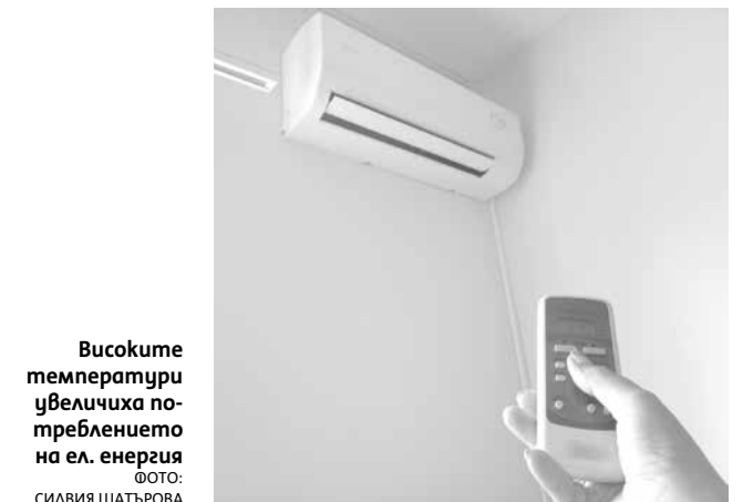
Високите температури увеличиха потреблението на ел. енергия

В стажантската програма, която се поддържа, се включ-