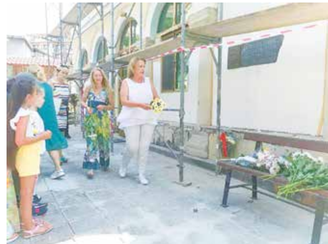
Цветя за Апостола