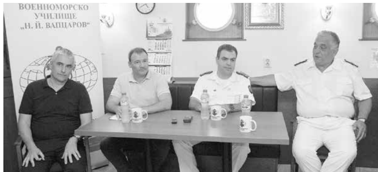
Флотилен адмирал Медникаров (първият вдясно) подчерта, че поне две министерства следят за чистотата на Черно море. До него е капитан II ранг Николай Данаилов, който разказа за мисията на кораба до Антарктида

Корабът „Св. св. Кирил и Методий“ извършва тази седмица комплексно плаване, като една от задачите му е пробонабиране. До момента са взети проби за изследване от 13 точки. В четвъртък това се случи и от още четири точки от южната част на Черноморието – Созопол, Приморско, Царево