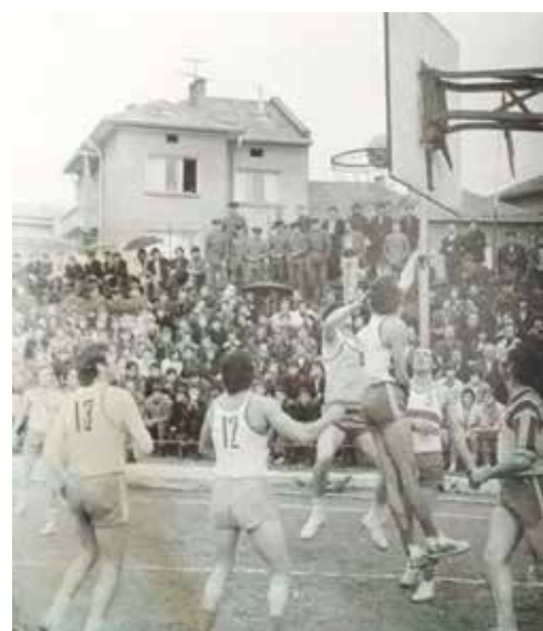
Спомен от славните години на баскетбола в Айтос