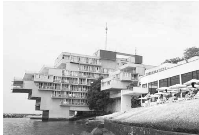
Хотелът гордост на соцархитектурата в туризма

ЧФ ще следи темата и ще информира своите читатели за развитието на мезапроектa.