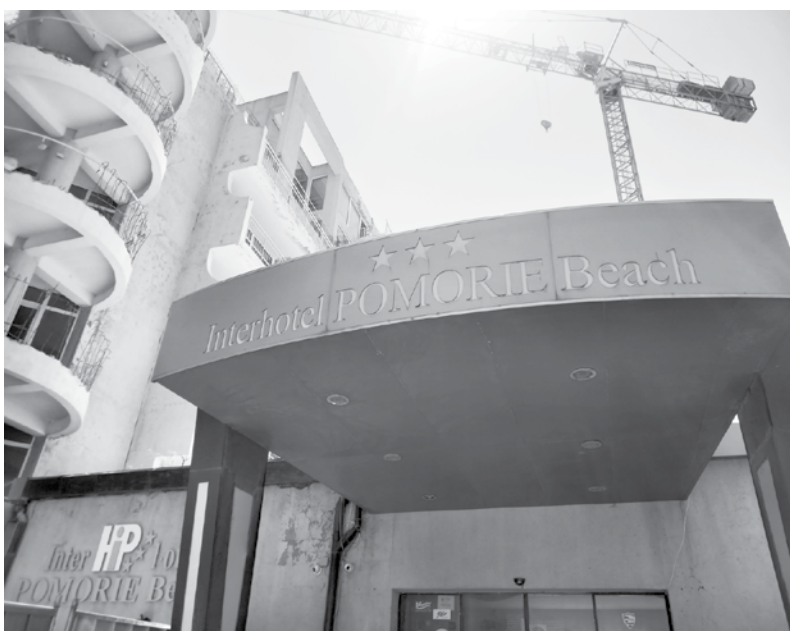
Ремонтни дейности в новото тяло на интерхотел „Поморие“