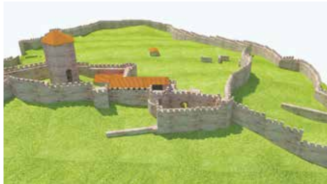
Освен бойни демонстрации на крепостта край Русокастро, всеки посетител ще може да участва активно в пресъздаването на обичаи и занаяти

Силата на българския мъж не се е променила във вековете и това ще бъде ясно видно време на фестивала „Русокастро – крепост на славата“. Здравите момчета ще направят уникални демонстрации на своите сили. Шоуто започва в събота, точно в 18.30 часа в Зоната на отдих под крепостта. Демонстрациите включват сдвръпане на бус 3.5 тона, логлифт, фермерска, мъртва тяга, камък