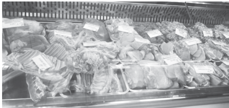
Месото е сред опасните храни през лятото

Проучване на европейски потребителски организации показва, че най-опасните храни през лятото са: месото, майонезата, морските дарове и някои плодове и зеленчуци. Тъй като при тях размножаването на бактериите при високи градуси става с най-бърза скорост.