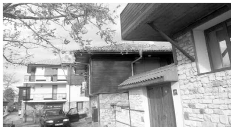
Базата се намира в стария град на изключително добра локация

тръжната документация е 50 (петдесет) лева, без ДДС (невъзстановими). Размерът на депозита е определен в правилата за провеждане на търга. Време и начин за оглед на обекта – след предварително уточнение, всеки работен ден от 10.00 до 16.00 часа в рамките на срока, предвиден за подаване на заявленията.