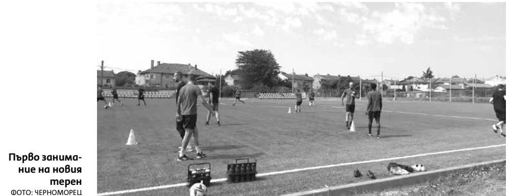
Първо занимание на новия терен

„За мен е голяма чест и отговорност. Трябва да