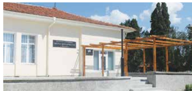
Обзавеждането и оборудването по проекта е своеобразен подарък за 95-ата годишнина на НЧ „Петър Житаров 1928“, с. Караново