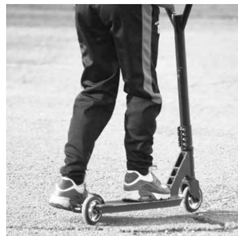
Видимо по централните улици електрическите тротинетки намаляха

Фишовете са написани по Закона за движение по пътищата и са в размер на 30 лева за велосипедисти и 50 лева за водачи на електрически тротинетки.