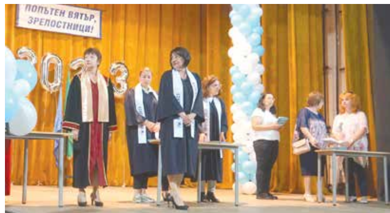
Директорите и класните ръководители връчват дипломите

айтоско поколение се случи в салона на читалището. Дипломантите в този, щастлив и притеснени едновременно, един след друг получиха свидетелствата си за зрелост.