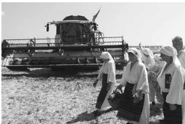
Среща на миналото със сегашното