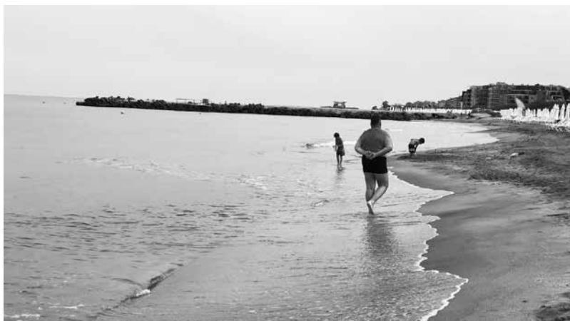
Няма данни за замърсяване на морската вода по Българското крайбрежие. Тя е дори по-чиста от минали години

„Черноморски фар“ акцентира, че концесионерите сами решават цените на плажните принадлежности. В техните договори са посочени максималните такива на шезлонги и чадъри, които не могат да се превишават. Цените обаче неизбежно се отразяват на притока на туристи, твърдят хотелиери и туроператори.