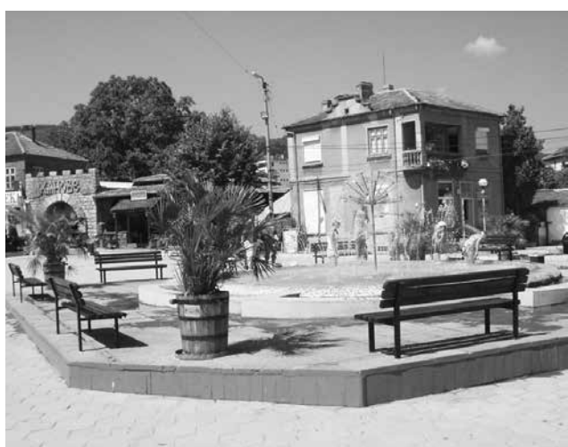
Обзор е любимо място за отдих на българи и чужденци

В Обзор се надяват, че тази година лятото ще е по-добро от последното преди ковид-кризата. Убедени са, че за това ще спомогне доброто обслужване и богатата културна програма, която предлага разнообразни развлечения.