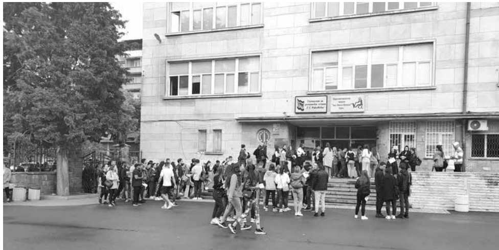
Възпитаниците на бургаската математическа гимназия показват високи резултати при всички оценявания

с най-добър успех от външното оценяване по български език в Бургаско повежда ППМГ „Акад. Никола Обрешков“, следва ОУ „Александър Георгиев-Коджакафалията“, на трето място е Първо частно основно училище, следва ОУ „Васил Априлов“. На пето място е ЧОУ „Д-р Мария Монтесори“. При математиката отново повежда ППМГ „Акад. Никола Обрешков“, на второ място е Първо