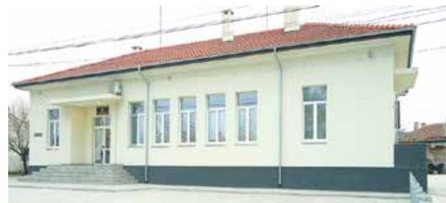
С финансиране по проект Община Айтос преобрази сградата на 94-годишното читалище в с. Мъглен, изцяло обновена е и сградата на читалището на съседното с. Пещерско

Проектът е финансиран от Програма за развитие на селските райони, съфинансирана от Европейския съюз чрез Европейския земеделски фонд за развитие на селските райони. В ход е процедурата за избор на изпълнител.