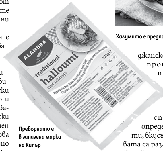
Превърнато е в запазена марка на Кипър

джанско дядо“ да се произвежда и предлага на пазара от други региони – дори и при спазване на определени рецепти, вкусът и качествата са различни.