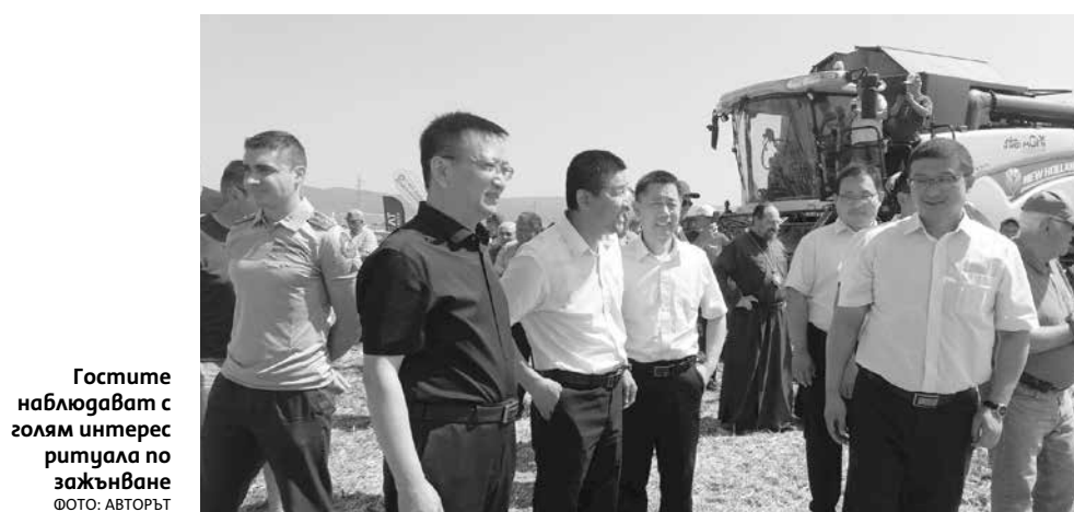
Гостите наблюдават с голям интерес ритуала по жътване