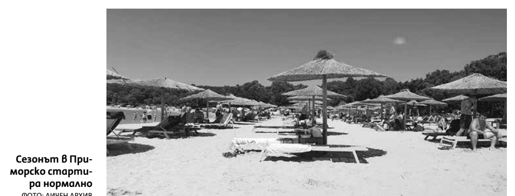
Сезонът в Приморско стартира нормално

„Чуваме се редовно с наши гости и им представяме реалната картина при нас – че няма от какво да се притесняват. Освен това от медиите разбрах, че институциите правят ежедневен мониторинг. Така че няма полза от притеснения. Това, че някой има полза да го прави, то е всяка година така. Заради някакви пари и износа на туризъм, който някои хора правят, удрят по нашия туризъм. Тези но-