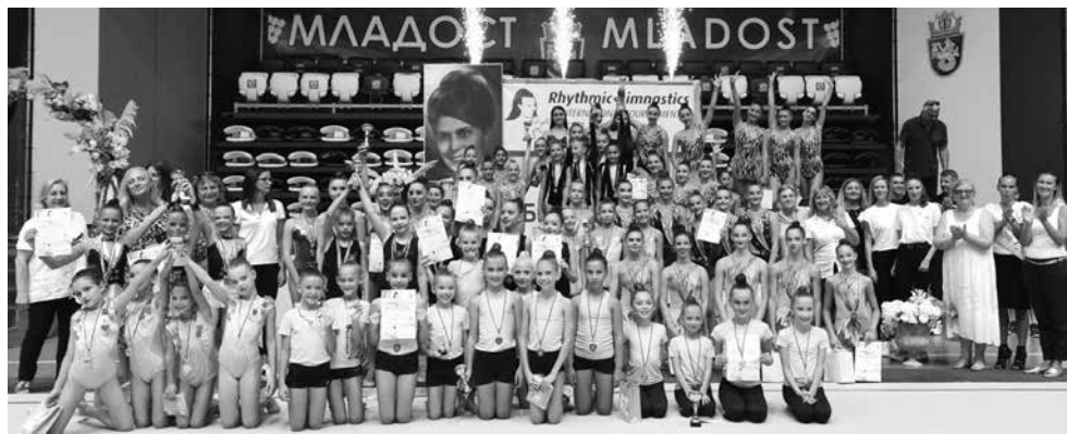
Официалното откриване е в събота от 13:30 часа

Организатор е СКХГ „Черноморец“, с подкрепата на Българската федерация по