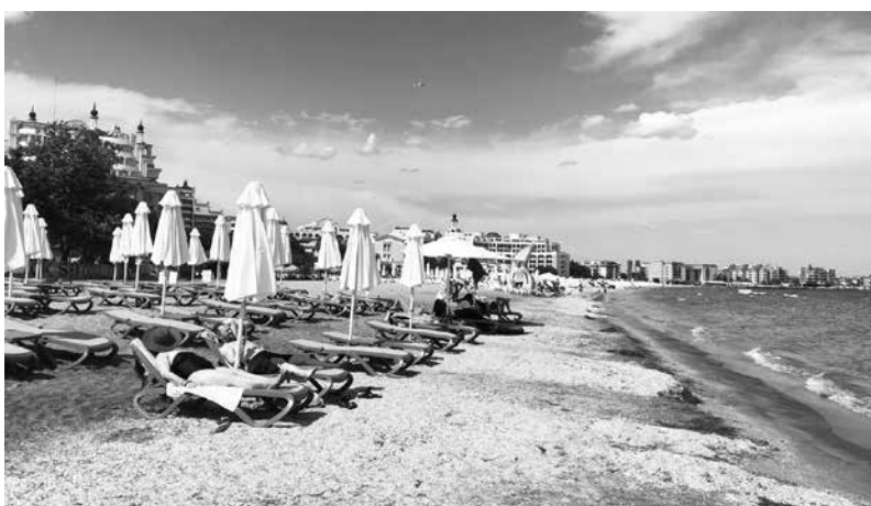
От туристическия бранш се надяват на успешни юли и август

Ще припомним и че през Лято 2022 цената на чадър на плажа се движеше от 3