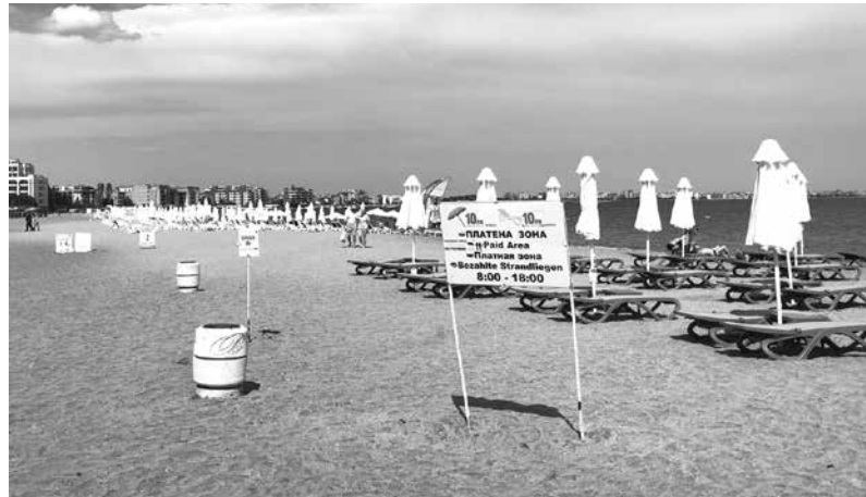
На Южния плаж в Поморие, намиращ се в новата част на града, цените на плажните принадлежности – чадър и шезлонг, са по 10 лв.

Стартиралото кратковременно паркиране пък накарало голяма част от жителите на Поморие да недоволстват срещу решението на общинската