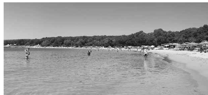
Водата по плажовете в курортния град е кристално чиста

вини с „Нова Каховка“ сега дюзеш им дойдоха. Но никой ли не осъзнава, че това удря икономическата страна? Туризмът представлява близо 12% от БВП и включва множество сектори“, коментира тя.