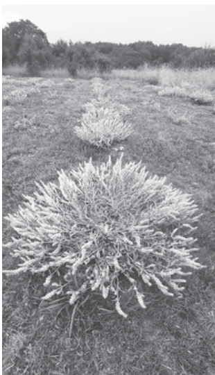
Странджанският билков чай е в процедура по обявяване на защитено наименование и произход

Нямах намерение да споделям впечатления от петдневния си престой в островната държава. Там, където често срещаме работещи българи и на всеки правят впечатление прекрасно изградената енергийна и пътна инфраструктура – магистрала, шосета и зигзагообразни черни пътища по всеки втори от застроените хълмове-чукари. Оголени каменисти възвишения с рядка растителност, но чудесно цвирещи разноцветни олеандри