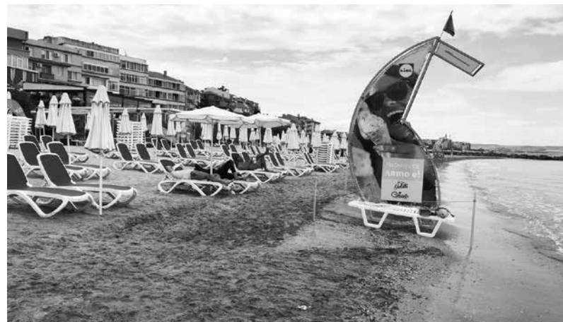
Засега прогължава тенденцията за уикенд туризма заради променливия юни

до 10 лв. Още толкова струваше и шезлонгът. За този сезон цените се движат от 7 лв. до 10 лв. за чадър или шезлонг, като най-скъпият плаж за момента се очертава „Перла“ в Приморско.