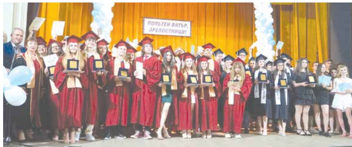
Последната обща снимка на айтоския Випуск 2023