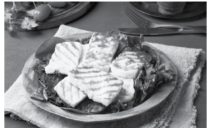
Халумито е предпочитано от гурманите

България вече има продукт със ЗНП и това е Странджанският манов мед. В процедура на ого-