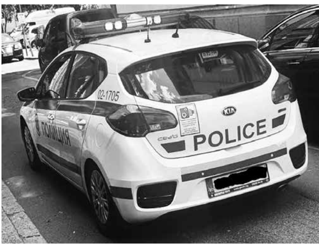
Патрули по централните улици биха били решение за разгонването на просещите