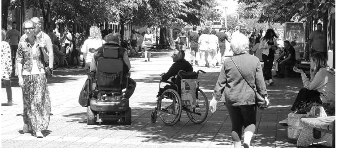
Двама от редовните просещи на улица „Александровска“ на раздумка

Голям проблем лятото в Бургас е, че освен местните просяци, стотици други от вътрешността на страната също прииждат. И там започва една игра на котка и мишка, за която писахме преди ня-