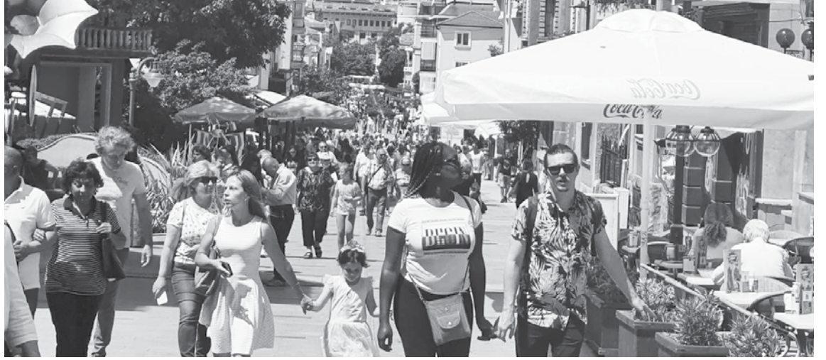
„Богориги“ е другата натоварена с туристи улица през лятото, по която просията върви

колко години. Униформените ги установяват, за сметка на данъкоплатеца ги качват по влакове към родните им места, а те след някой-друг ден отново са в Бургас. И така цяло лято.