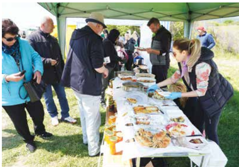
Част от храните, които бяха показани по време на Фестивала на зеленката със сигурност ще бъдат представени и по време на „Вкус(на) Странджа“

Вълнуващият ген, изпълнен с много емоции и храна, ще приключи с дегустация и концерт на ансамблите Царево и Велинград. Той е наречен „Нощ на южните ансамбли“ и ще започне в 19.00 часа.