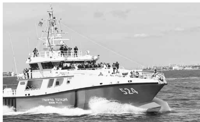
След церемонията по придобиването на име официалните гости се повозиха на новия патрулен кораб

След официалната церемония гостите се качиха на борда на новото бижу на „Гранична полиция“, а журналисти и граждани ги последваха с друг от патрулните кораби – „Обзор“.