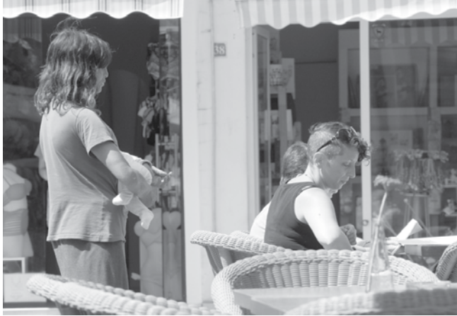
Клиентите на заведенията са друга любима мишена