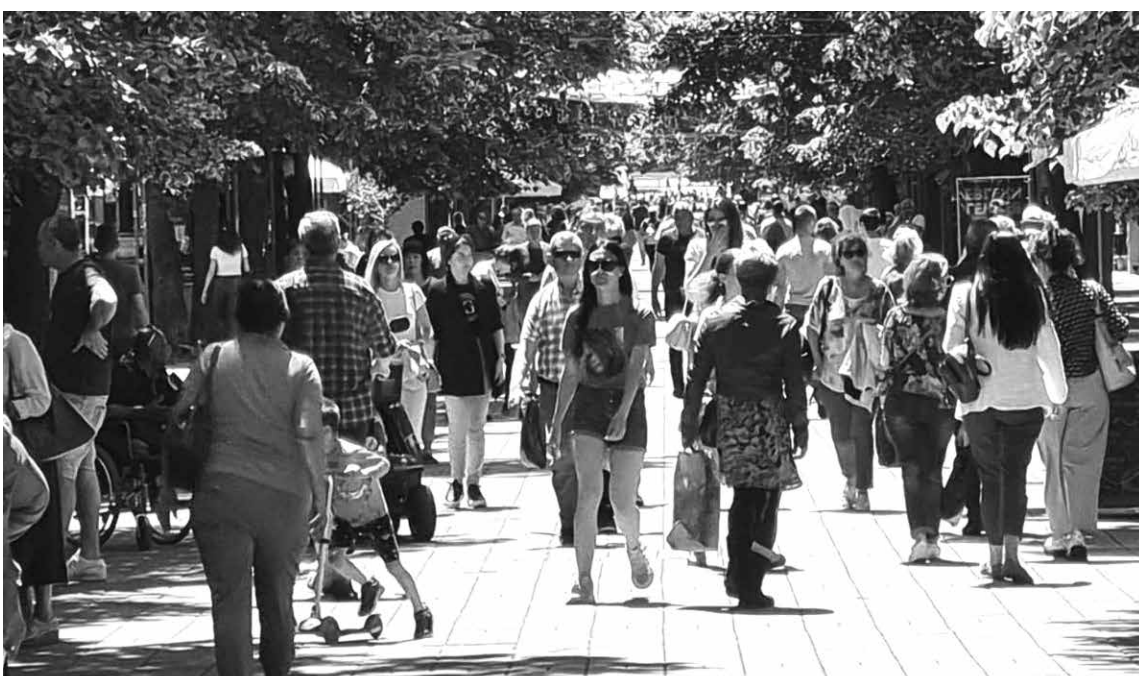
Улица „Александровска“ през лятото