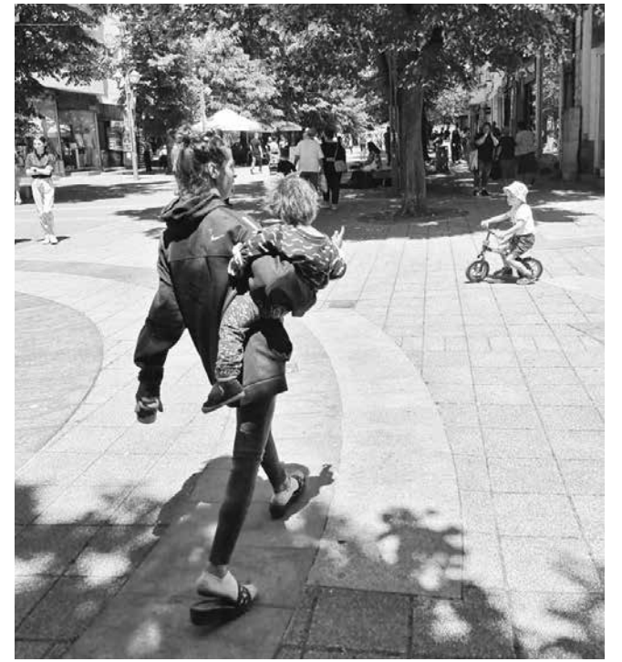
Майки с деца, искащи пари, са другата честа гледка в центъра

„Това означава, че три пъти в годината трябва да бъдат хванати в просия. Проблемът е, че те обикновено вървят с родителите си, които не са с тях в момента на извършване на просията, а ги наблюдават от разстояние и ако полицейски служители се намесят и хванат детето, извършващо просия, автоматично родителят отива и казва, че не е непридружено и че е с него. Оправдават се, че са били в магазин, до тоалетна или нещо друго и настояват детето да бъде освободено. Въпреки това имаме деца, които са настанени с полицейска закрила в Дома за временно настаняване за малолетни и непълнолетни в „Изгрев“. Упражнен е от страна на държавата все пак някакъв контрол. Насочени са към дневния център за работа с деца на