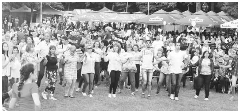
Празници на българския дух и народност