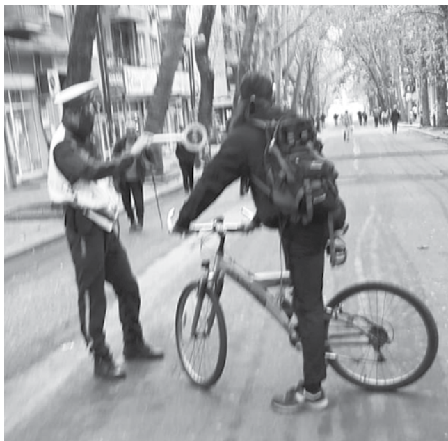
Преди време успешно се провеждаха акции срещу велосипедисти, такива срещу просяци липсват

Затова председателят на Комисията по общест-