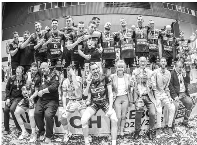
Община Бургас се отблагодари за шампионската титла на „Нефтохимик“ с парични премии за играчите.