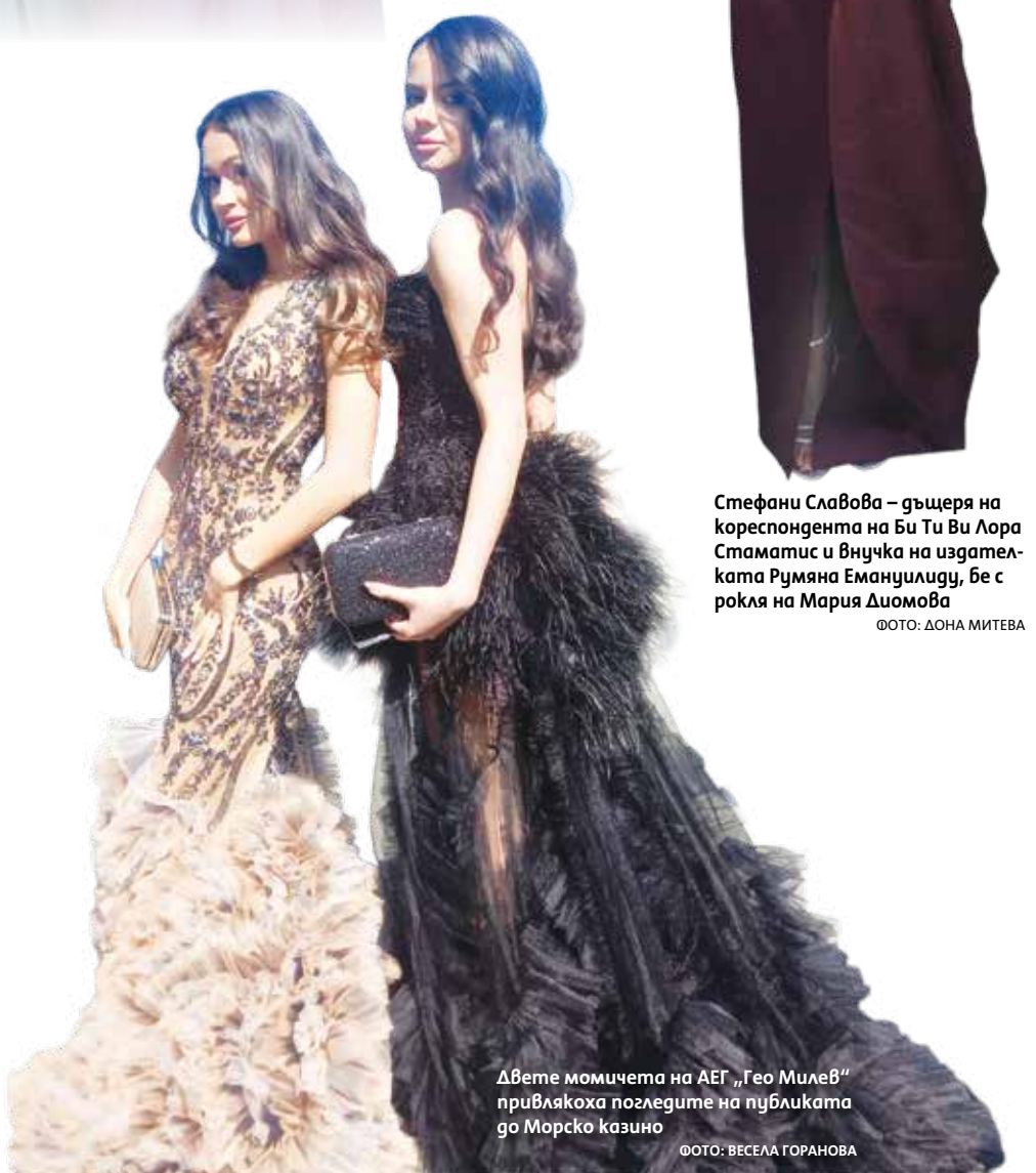
Двете момичета на АЕГ „Гео Милев“ привлякоха погледите на публиката до Морско казино