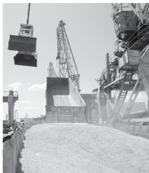
Хиляди тоннове зърно са разтоварени на корабните места