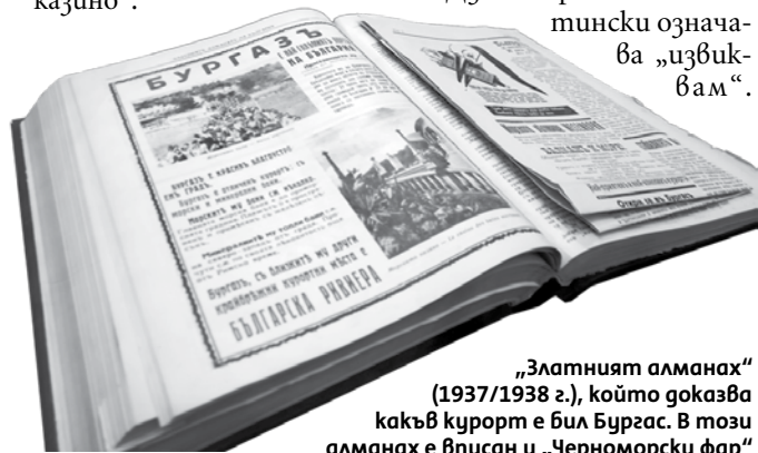
„Златният алманах“ (1937/1938 г.), който доказва какъв курорт е бил Бургас. В този алманах е вписан и „Черноморски фар“