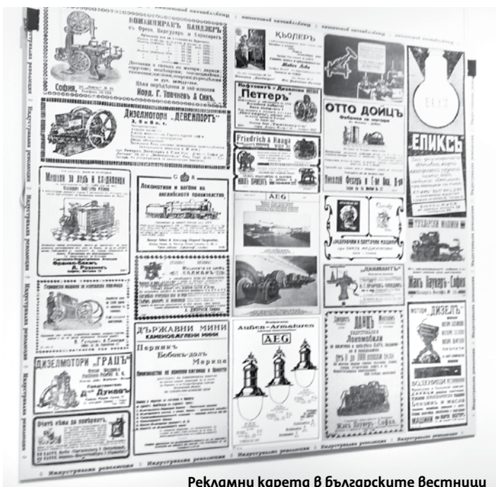
Рекламни карета в българските вестници