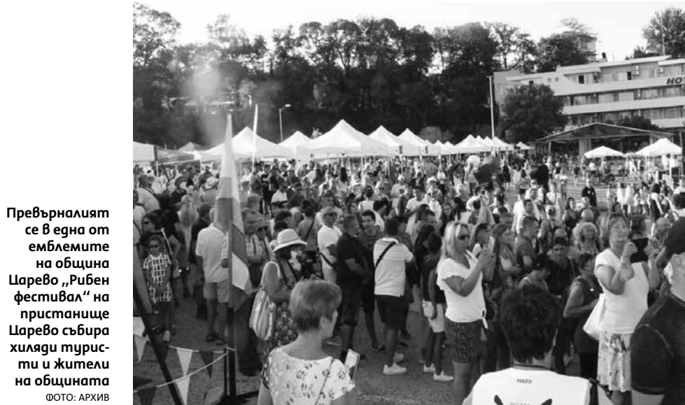
Превърналият се в една от емблемите на община Царево „Рибен фестивал“ на пристанище Царево събира хиляди туристи и жители на общината