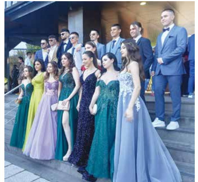
Момичетата и момчетата на ПМГ „Акад. Никола Обрешков“ на стълбите на Културен дом НХК

Сатенът и тюлът също бяха сред предпочитаните материали.