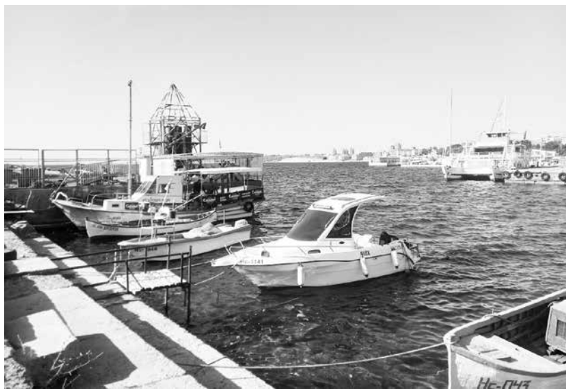
Освен прекрасната природа Черноморието се нуждае и от добре обучени кадри, които да предлагат туристическия продукт

сиране на работодатели, като по тяхна заявка биде организирано обучение по български език за чужденци. До момента няма работодатели в региона на ДРСЗ Бургас, които да са се възползвали