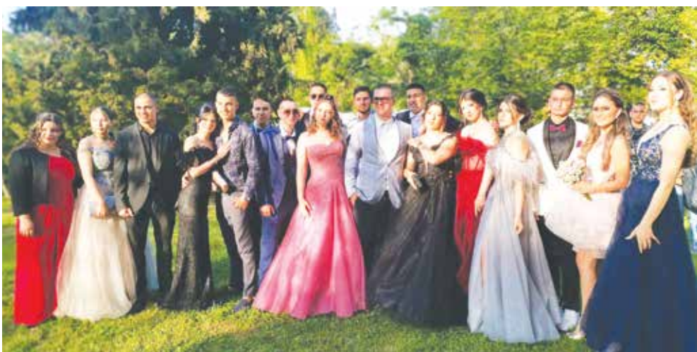
Част от зрелостниците от НЕГ „Гьоте“ заедно за снимка