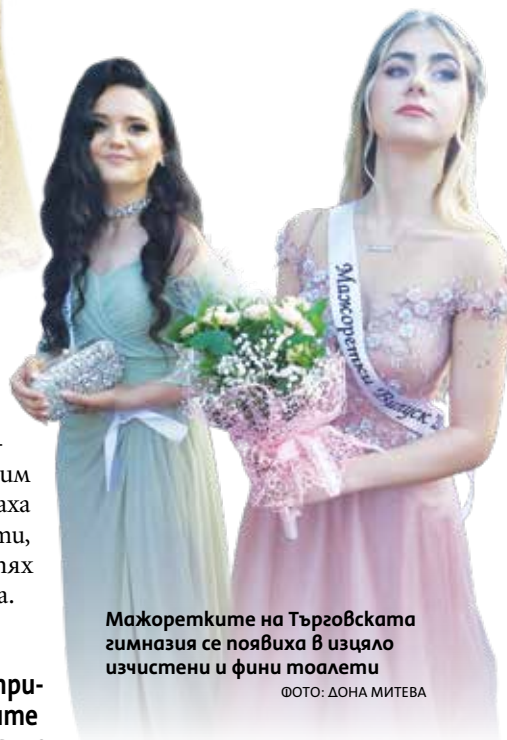
Мажоретките на Търговската гимназия се появиха в изцяло изчистени и фини тоалети

Сред предпочитаните от девойките цветове бяха по-неутралните и кораловите.