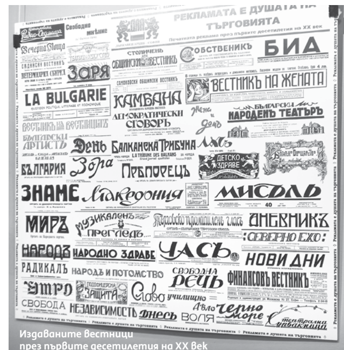
Издаваните вестници през първите десетилетия на ХХ Век