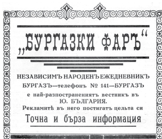
Реклама на вестник „Бургазки фар“ (1928 г.)