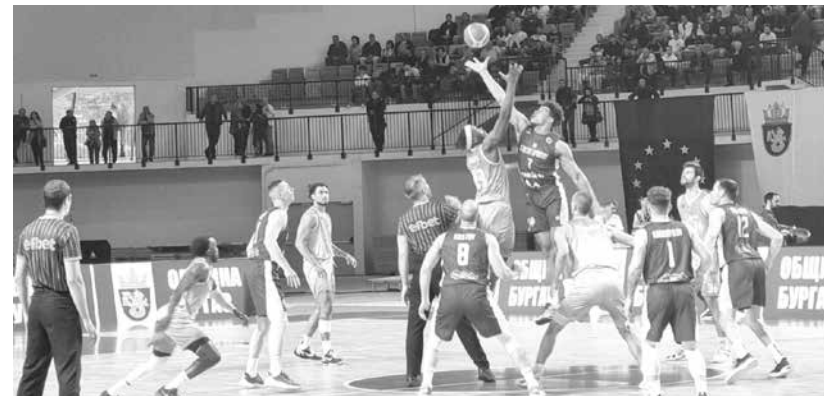
Бургазлии побежда „Рилски спортист“ с 95:90 в четвъртия мач от полуфинала

Серията за бронза започва днес, на 26-и и продължава на 28 май. „Рилски спортист“ ще е домакин в първия мач, а вторият ще е за ЦСКА в София. Ако се стигне до трети мач, той отново ще е на „Арена Самоков“.