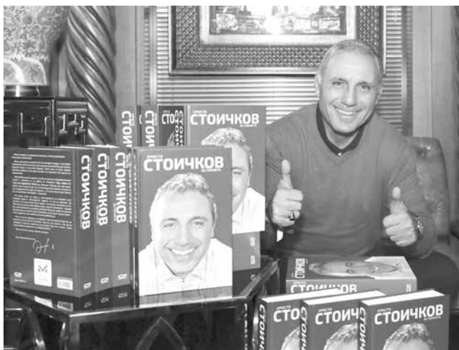
Камата ще даде старт на детски футболен турнир и ще представи книгата си

По време на събитието Камата ще отдели време и внимание на всички, дошли да се срещнат с него като част от турнето за представяне на книгата му „Христо Стоичков. Историята“. Първите 500 от феновете ще имат възможност да получат книгата като подарък от самия Христо Стоичков, осигурен