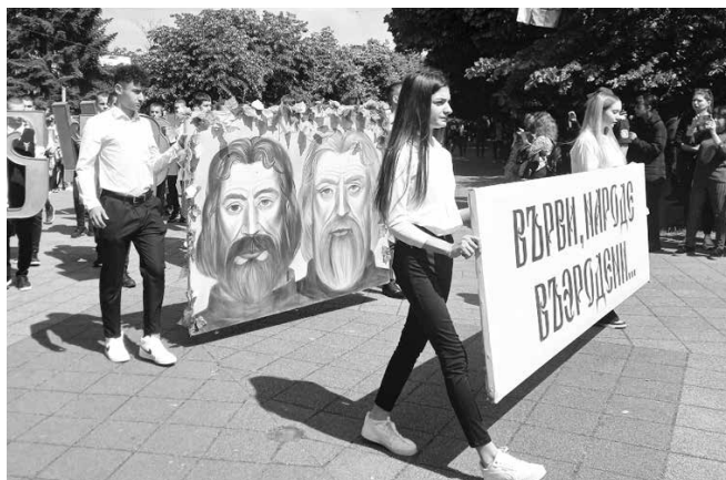
10 000 излязоха по улиците на града