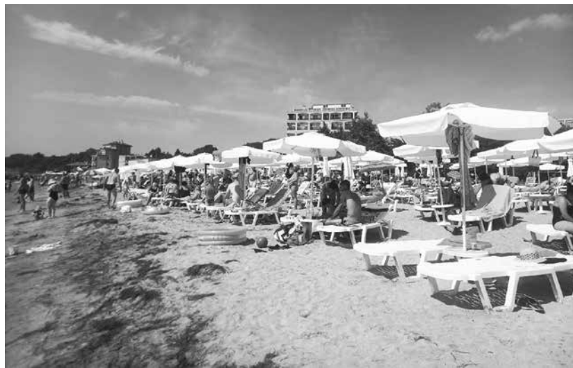
През последните няколко години профилът на туриста се промени драстично

лица със статут на временна закрила, който им дава директно право на работа и освен това най-голямата част от тях пребиваваха в местата за настаняване по Южното Черноморие. „Впоследствие те се включиха и в проект