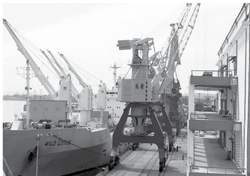
Десетки кораби са обработени и товарите им са се вляли в икономиката на страната