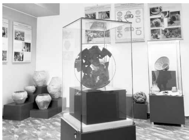
Експозицията, която е подготвена в Националния археологически резерват

В региона на НАР „Деултум“, при обходи за изготвяне на Археологическата карта на БГ, са констатирани множество материали от праисторически времена, но тези епохи не са проучени. Местонаходението на „Козарева могила“, от физико-географска гледна точка е в района на Тракия, но и района на Черноморието, където, още