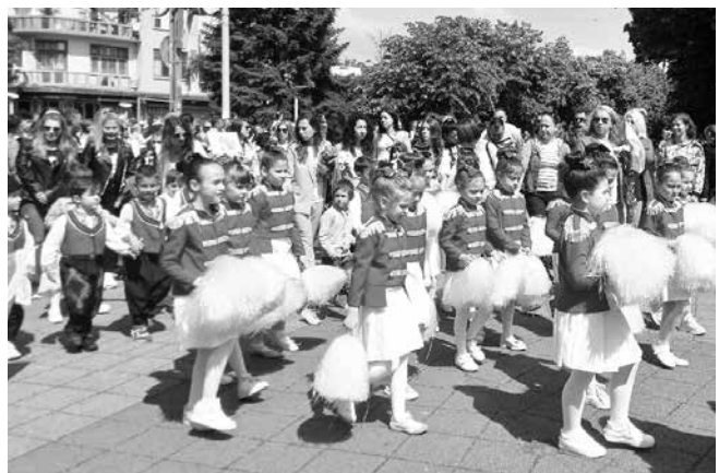
Деца от забавачките предизвикаха усмивки