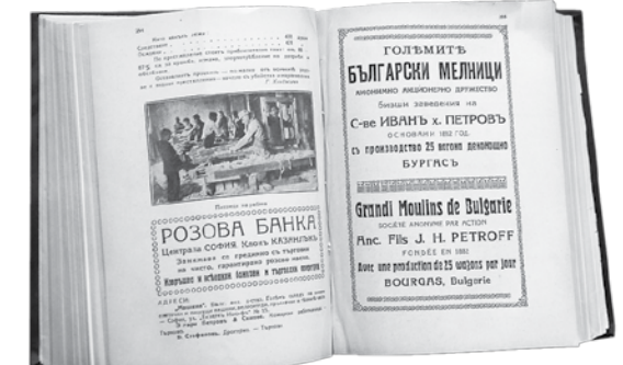
Общ годишник на България 1923/1925 г.