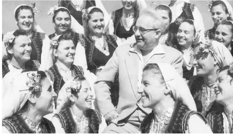
1951 г. – Ансамбъл „Филип Кутев“ – начало