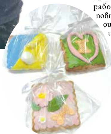
Всяко дете проявява своя творчески потенциал при изработването на украсата, без ограничения

След работилничката тя получава много отзиви на родители, което ѝ дава основание да продължи с подобни обучения по различни теми. „Имам план работилничката да се повтори и да продължи с още много издания, защото има запитвания и голям интерес“, обобщава несебърлицката.