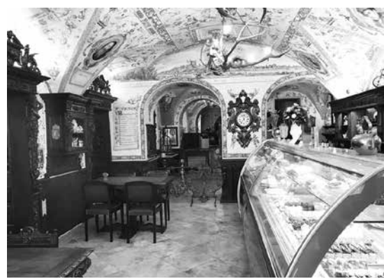
Така изглежда едно от „бижутата“ – кафе в центъра на града