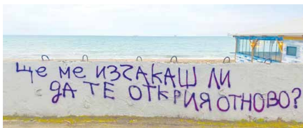
Този надпис се появи на стената на плажната ивица в Бургас, снимката е споделена в най-много бургаски групи и предизвиква голям интерес и положителни отзиви