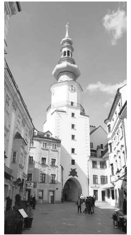
Стара часовникова кула и замък са сред местата, които туристите обичат

вата „Св. Гертруда“ и Президентският дворец.