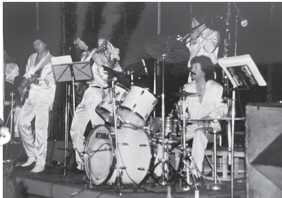
В оркестъра на Бар-вариете