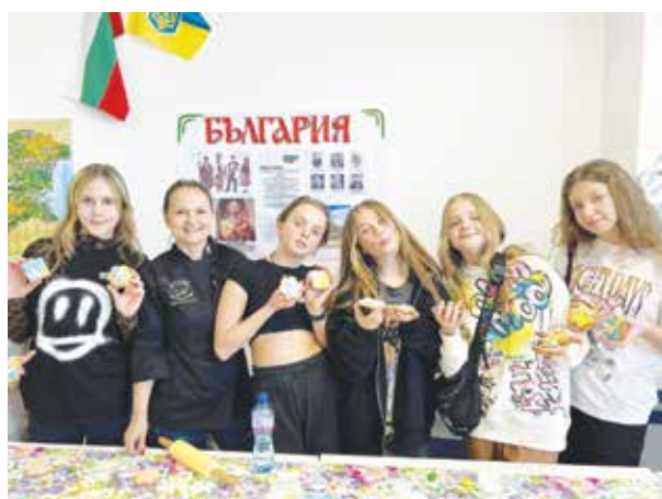
Девоичките се справиха блестящо с работата с фондан