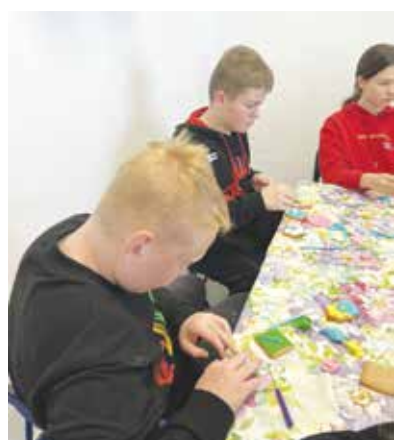
Голям брой момчета се включиха в сладкарското занимание