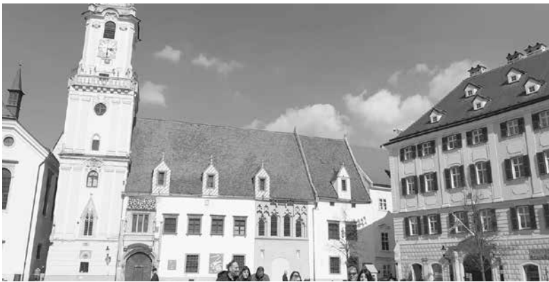
Братислава привлича с типичния си архитектурен облик за европейски средновековен град