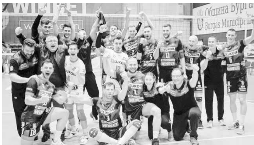
Волейболистите на „Нефтохимик 2010“ постигнаха трудния успех пред пълна зала „Младост“ в Бургас

– Аз съм си ги поздравил вече. Те много добре знаят за какво става въпрос. Аз съм им казал, че съм заг тях, без значение дали побеждават, или губят, защото когато отборът побеждава, е лесно да си го тях. Важното е, когато загубят и им е тежко, също да си го тях, за да ги успокоих. Единственото нещо, което бих искал, е да поздравя нашата публика и да ги призова на 25 и 26 април отново да напълним зала „Младост“ и да са сигурни, че тези момчета отново ще дадат всичко от себе си. Нека започват, за да стане празник. Бургас има нужда от такъв отбор и от таква победа. Бургаският спорт може само да се гордее, че има такъв отбор като Волейболен клуб „Нефтохимик 2010“.