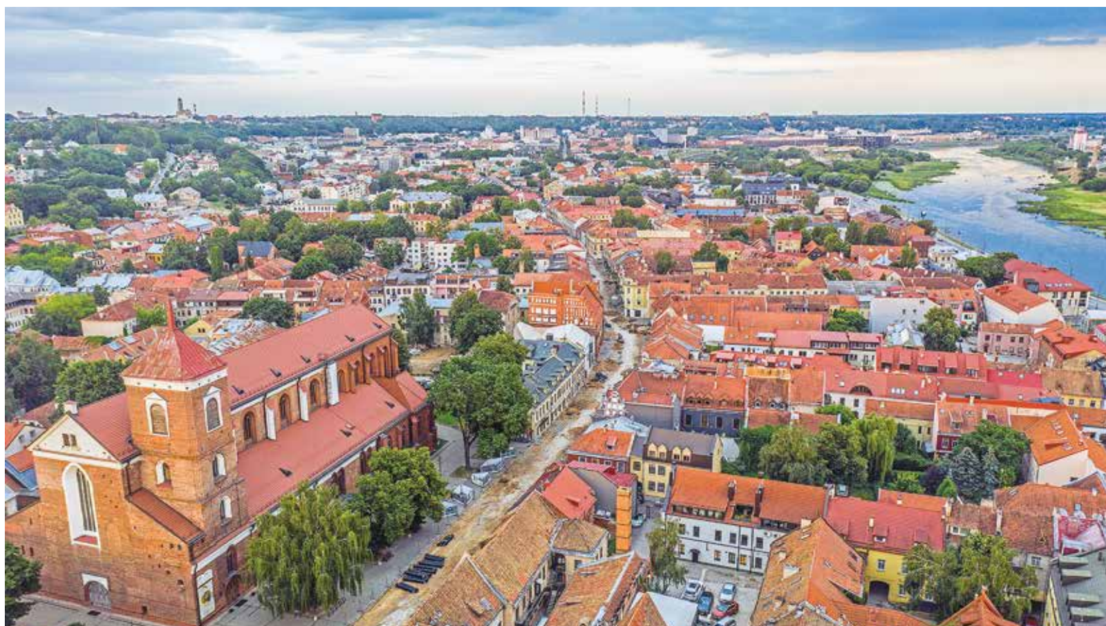
Град Братислава, Словакия

Маршрути. Използват предсезона да летят до там