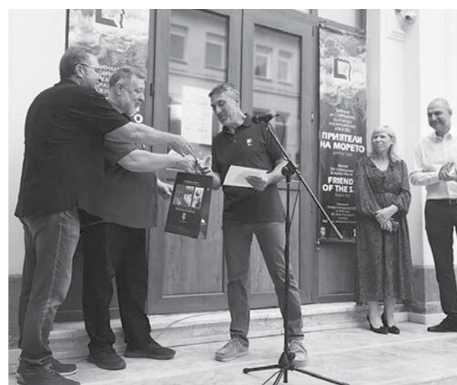
Художникът получава наградата за живопис на биеналето „Приятел на морето 2022“