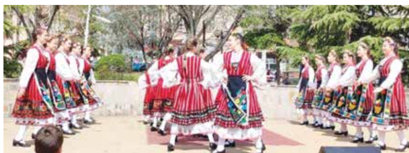
ТС „Усуканица“, НЧ „Васил Левски 1869“ гр. Айтос