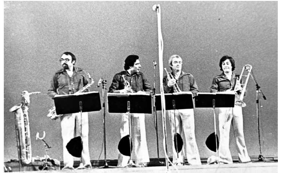
Музикантът е част от оркестър „Бургас“

„С големия музикант Христо Тодоров бяхме съседи. Помня го още от времето, когато бях ученик в музикалното училище. Свирех на тромпет и когато той минаваше покрай нашата къща, винаги поглеждаше към нас. По-късно разбрах, че е цугтромбонист и започнахме да си общуваме и говорим за музика. По-късно се явих на категория вече като бас китарист и той беше там и ме е чул като свиря. Не знам с какво съм го впечатлил, но той веднага ме покани в неговия оркестър и започнахме. Беше 1989 година. Това беше първата ми изява като професионален музикант, а бях още ученик в 11 клас. Научих толкова много неща за музиката и музикалния бизнес от него, че не бих могъл да ги изброя. Често се сецям за него и винаги съм искал да му кажа, че за мен беше голяма чест да свирим заедно. Благодаря ти, бате Ицо!“ – проф. д-р Иван Стоянов, преподавател по бас китара в Националната музикална академия „Панчо Владигеров“, бас китарист в „Куку бенд“, свирил и в Оркестъра на Тодор Колев. Скоро се навърши една година от кончината на бургаския музикант. Но той остава жив в сърцата не само на своето семейство, близки и приятели, а на всички, които са чували неговата музика. Остава име в културния живот на Бургас, града, който той избра да озари с таланта си.