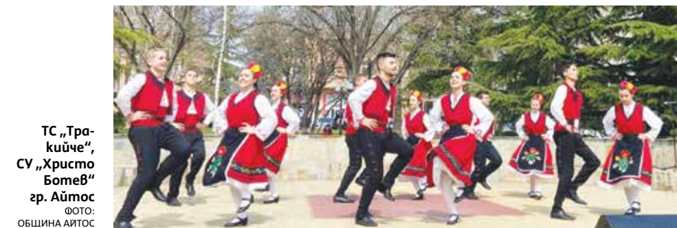
ТС „Тракийче“, СУ „Христо Ботев“ гр. Айтос

II място – Пенка Маринова – VI клас, ОУ „Христо