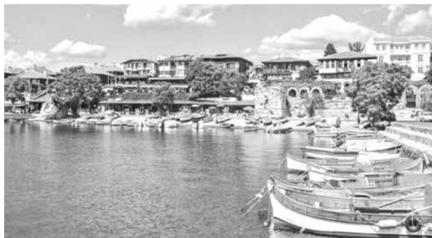
Несебър е определян в Англия като „Перлата на Черно море“

„Страната има от всичко по-малко и на много разумни цени“, поясняват те и също