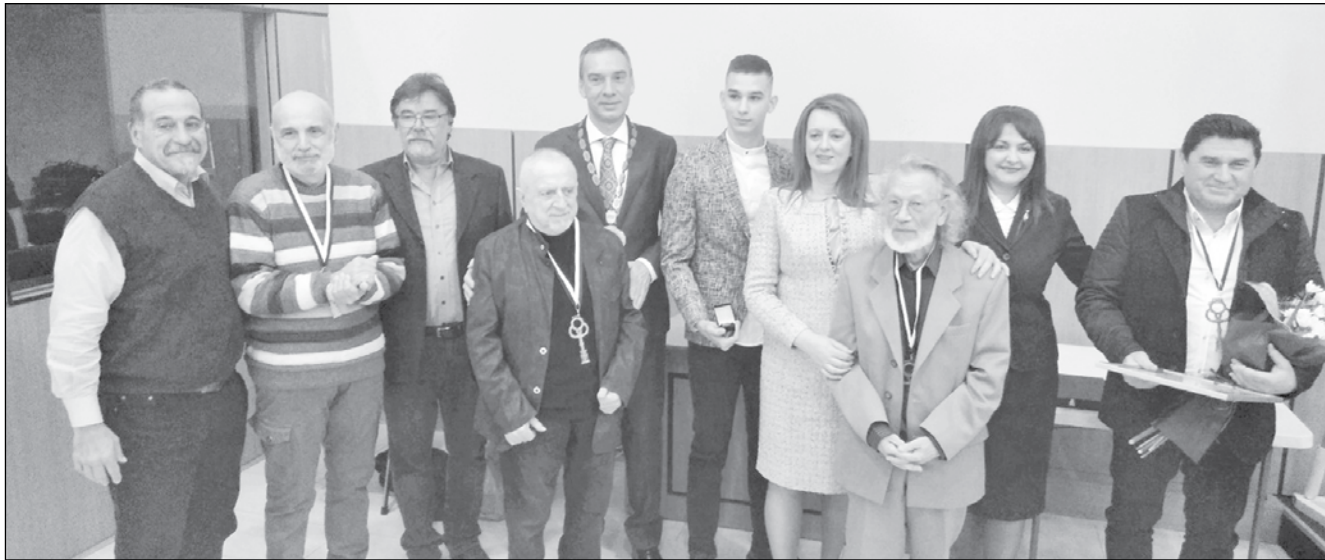
Видни бургазлии бяха отличени с различни призове

„Според прокурора, щом чл.33, ал.1, т.2 от ЗМСМА предвижда изрично, че всеки един от общинските съветници има право да предлага в дневния ред на заседанията на Общинския съвет да бъде включено разглеждането на въпроси от компетентността на съвета, следва да се приеме, че предложения за промени в Правилника могат да бъдат направени от всеки един от общинските съветници. Общинският съвет прие тези аргументи и отмени разпоредбата на §3 от Правилника“, пише Дракалиев.