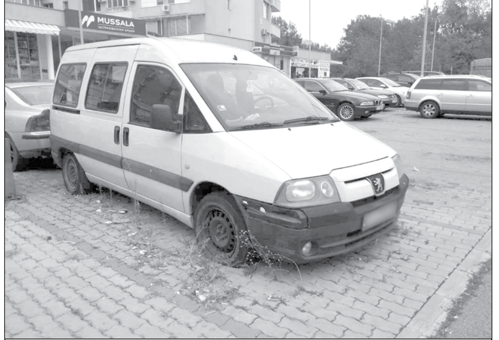
354 са проверките тази година

„Екоинспекторите от общинския отдел „Опазване на околната среда“ осъществяват ежедневна контролна дейност за нерегламентирано замърсяване с отпадъци, включително и излезли от употреба моторни превозни средства (ИУМПС) - отпадък по смисъла на §1, т. 16 от Наредбата за изискванията за третиране на отпадъците от моторни превозни средства, а именно