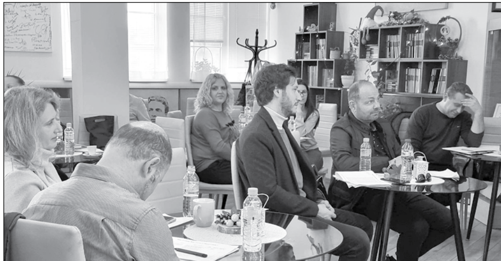
Комисията по оценяване ще реши в следващите си заседания кои проекти ще получат финансиране

се под повърхността история, за съжаление, не и без участието на българските медии, които веднага са нахлули в родното му село да разпитват хората дали са ислямисти и терористи. Така че аз реших да разкажа атентата в Бургас, връщайки се към последните 24 часа от живота на всички загинали. Благодарна съм за информацията, която имах възможност да получа от българските служби, защото през образа на атентатора и нещата, които събрах като информация, на практика ние ще възстановим как се е случил атентатът през неговата история. Всички тези седем души вървят към този миг, където съдбата ги засича в момента на смъртта им. Това е сценарият на „Парчета живот“ и аз се надявам чрез магията на кино да успя да събера обратно тези парчета живот на тези хора, които са в пълен контраст със зловещата картина на смъртта“.