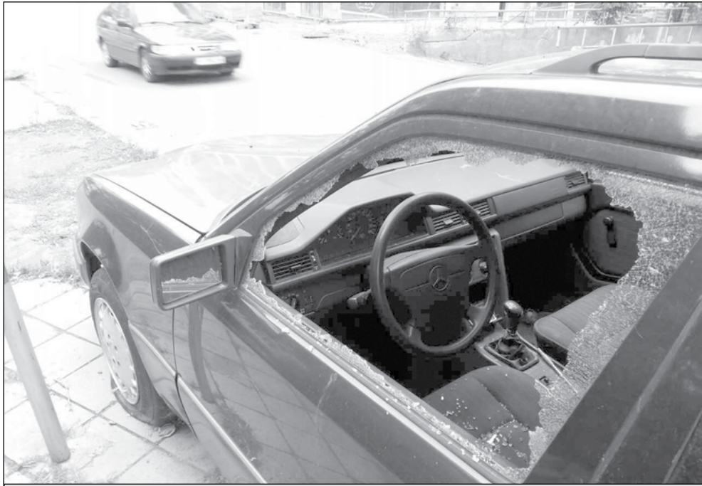
До 6 месеца отнема процедурата по принудително преместване

„В отговор на получените в Община Бургас сигнали за изоставени автомобили, екоинспекторите извършват проверка на място и маркират със стикер тези, отговарящи на споменатите критерии. Съгласно изискванията на Наредбата по управление на отпадъците и Наредбата за излезлите от употреба МПС, на техните собственици се дава 14-дневен срок за доброволното им преместване на площадка за временно съхранение или в център за разкомплектоване. След изтичане на този срок се извършват съответните контролни проверки. Ако автомобилите не са преместени, следва съставяне на акт за установяване на административно нарушение и издаване на заповеди за принудителното им преместване. За съжаление,