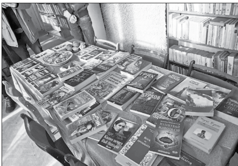
Фондът на Читалището се попълни с актуални четива