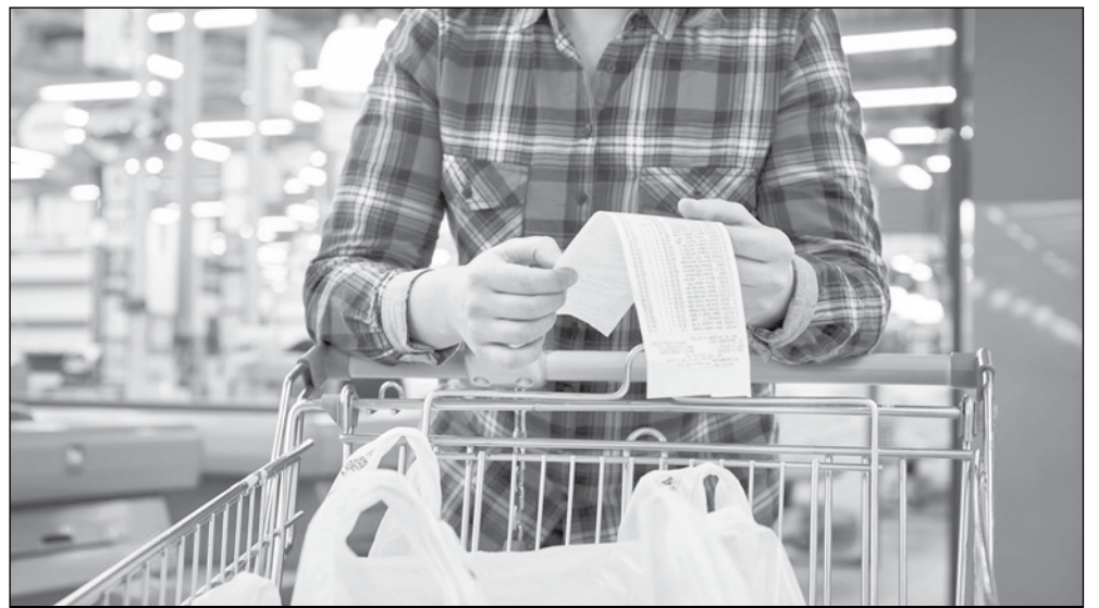
Преди Коледа и Нова година:

„Чакаме да свърши украинското зърно. Няма лошо – нека да го продават, но то е произведено при съвсем други разходи, без изпълняване на изискванията на Европейския съюз. То е по-евтино. Там ползват торове, които не плащат въглероден данък, съответно далеч по-евтини. Няма как ние да бъдем конкурентни на един и същи пазар. Това не е икономическа среда за нас. Враждебна е“, обобщава Проданов.