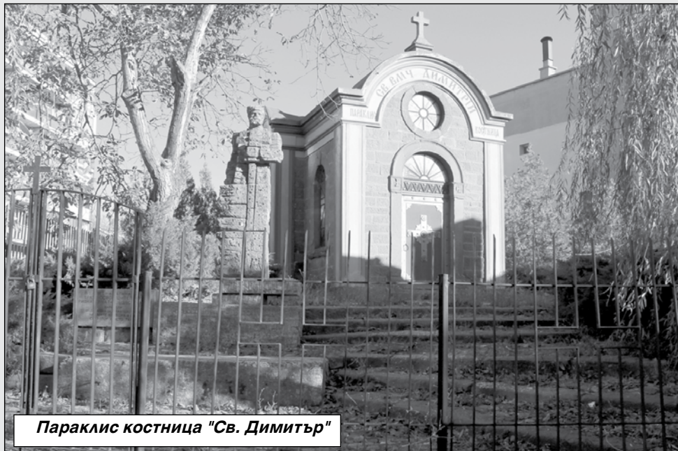
Параклис костница "Св. Димитър"