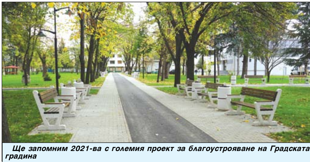
Ще запомним 2021-ва с големия проект за благоустрояване на Градската градина

на, каптирани през 1928 г. По същото време учениците от начален етап на ОУ „Светлина“ с. Тополица се включиха в проекта „Бъдещето съм аз. Предприемачество за най-малките“, с организатори „Джунйър Ачиймънт България“ (JA България) и „ПЕПКО България“ (PEPCO BULGARIA).