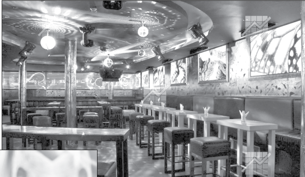
Собственици ще пускат персонала в неплатен отпусък

Изданието ни научи, че и една част от баровете в града обмислят да затворят времен-