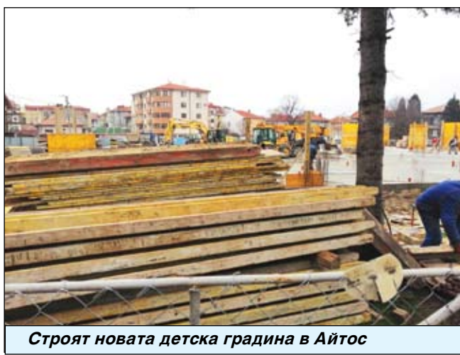
Строят новата детска градина в Айтос