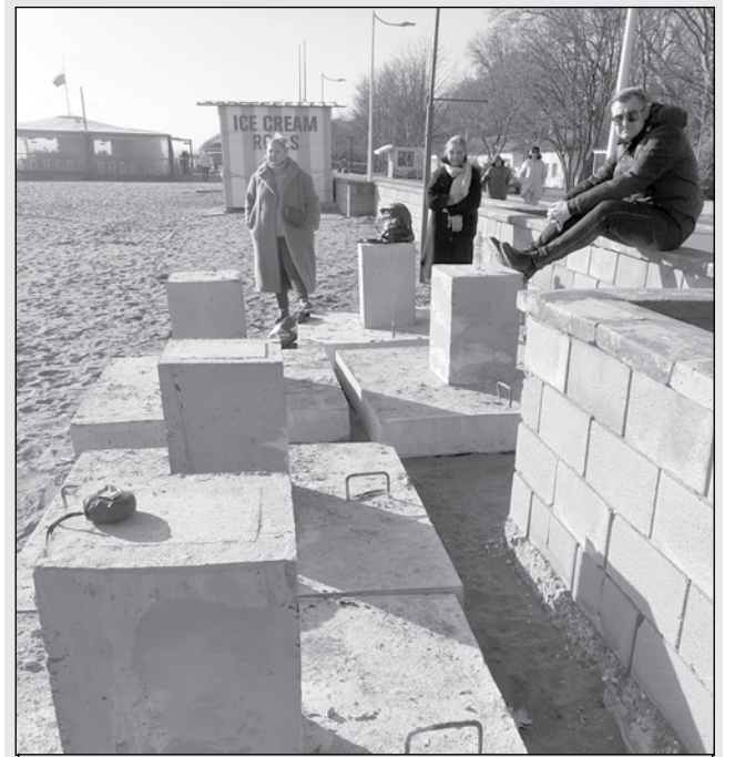
Поставянето на бетонни стъпки е обичайна практика и на други плажове

Обществото в последно време винаги реагира остро по плажни теми, особено когато има присъствие на тежка техника по ивиците. Подобни бетонни стъпки има поставени и върху други плажове.