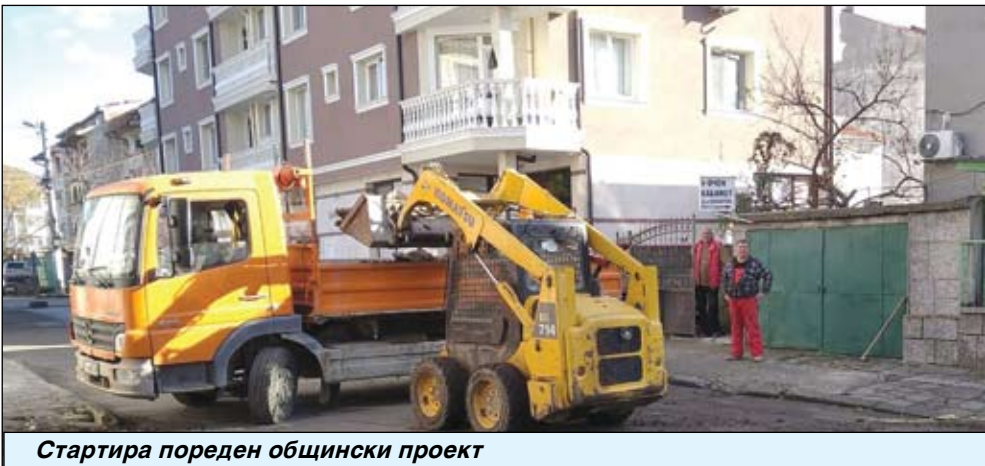
Стартира пореден общински проект