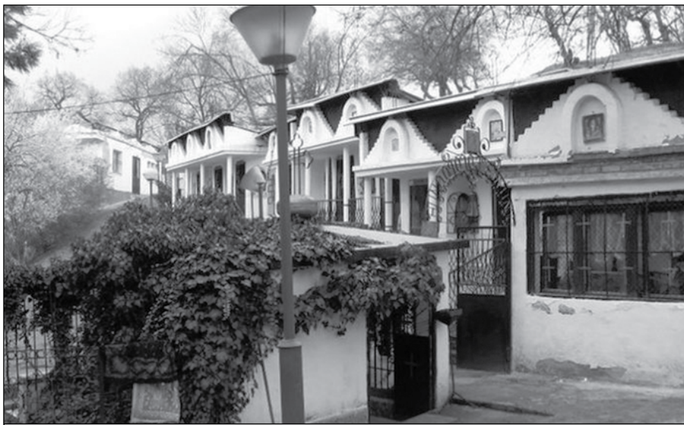
В манастирчето „Рождество Богородично“ от есента се извършват ремонтни дейности