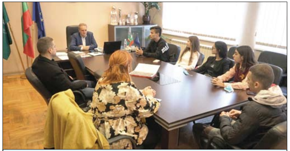
120 ботевци в патриотичен проект