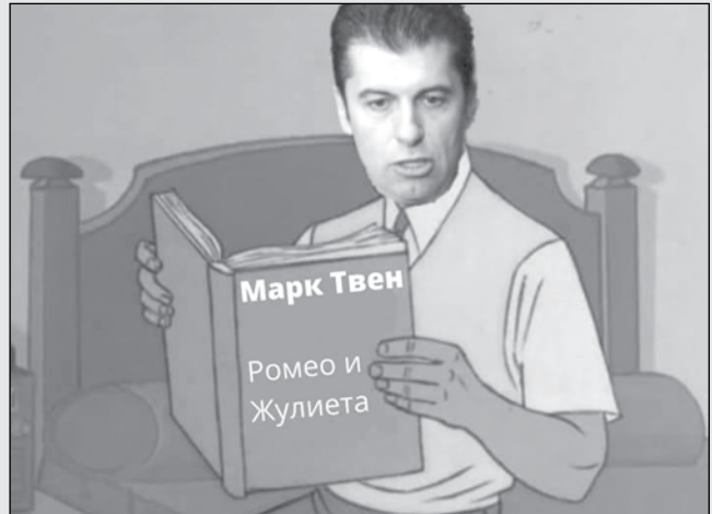
Kiril Petkov 1 d