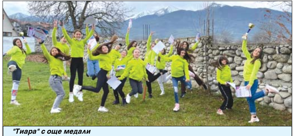
„Тиара“ с още медали

чихме, че вапцаровци са били в Италия на обмяна на опит по „Еразъм+“, а МИГ-Айтос стартира още два проекта, финансирани чрез стратегията „Водено от общностите местно развитие“.