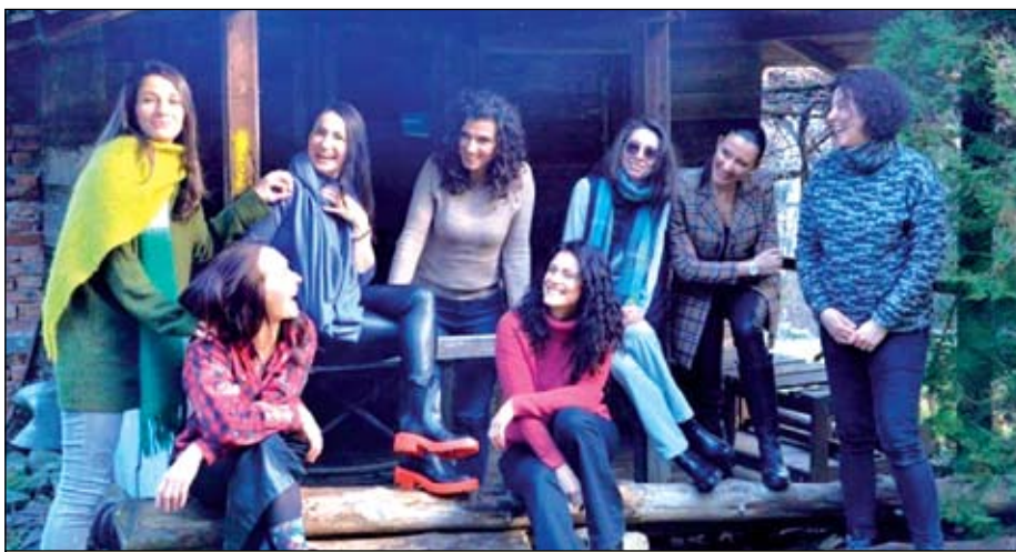
Те са осем дами, прегърнали една от каузите на Фондация #ЗаДоброто - проекта #Светулка

мите планират на място и се опитват да съберат възможно най-много информация за това какво трябва да се направи в айтоското детско отделение. За да са максимално полезни.