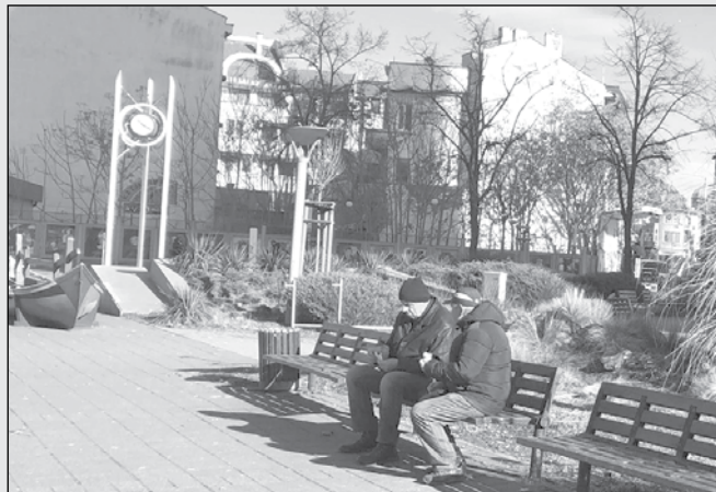
Пенсионери обсъждат повишаване на битовите сметки за ел. енергия и безумното поскъпване на цените на хранителните продукти

„Да, чувал съм и Чехов, и Толстой. И не само съм чувал, но съм и чел техни произведения. Присъстват в до-