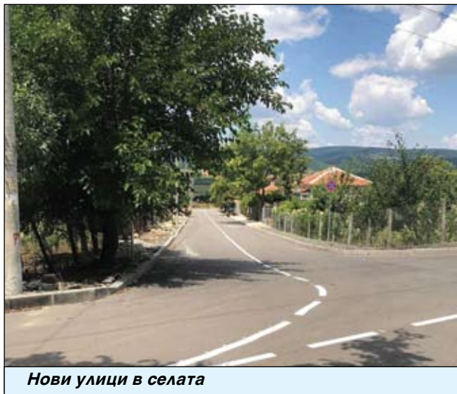
Нови улици в селата

В началото на декември стана ясно, че „МБАЛ Айтос“ ЕООД ще е сред първите детски отделения #Светулки. Айтос взе да търси се художник #Светулка, за да превърне Детско отделение – Айтос в приказен свят. Пак тогава стана ясно, че Градската градина в Айтос е на цели 128 години, а в очакване на по-добри дни за култура Съветът прие Годишна програма за читалищата - 2022 г. По това време нау-