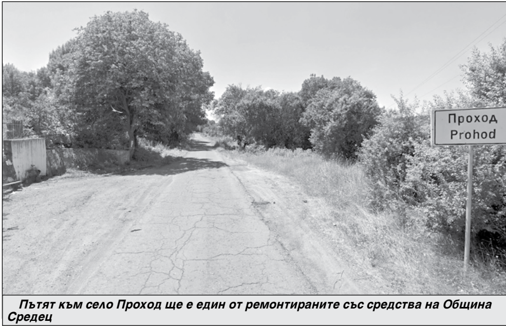
Пътят към село Проход ще е един от ремонтираните със средства на Община Средец

мация за дейностите, които ще бъдат включени в ремонтите. Това са: разваляне на съществуваща