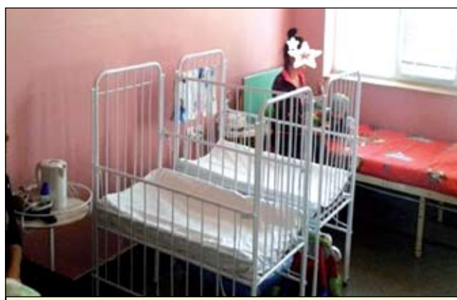
В ДО на МБАЛ Айтос

свързани със самата система в педиатрията. Една от основните мечти, която искат да осъществят, е за включването на социални работници в детските отделения. Да работят там и да помагат на родителите и децата, най-вече с тежки онкологични, генетични, неврологични и др. заболявания. Идеята е социалните работници да бъдат връзката между здравната система и това, което се случва с децата. Целта е не родителите да обикалят по болници и институции, събирайки документи, а това да правят социалните работници. И да помагат, когато има нужда от психологическа помощ.