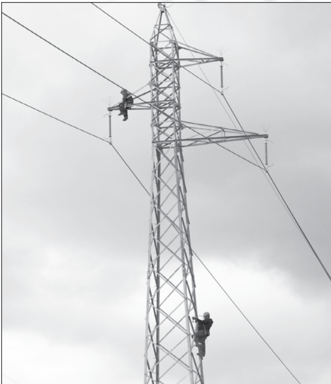
Основното захранване на подстанцията се пуска 15 дни преди предвидения краен срок за завършване на ремонта. Възстановяването на аварията е на стойност малко над 1 милион и 400 хиляди лева

Министърът на енергетиката Росен Христов обяви две национални програми, които пилотно ще стартират в града