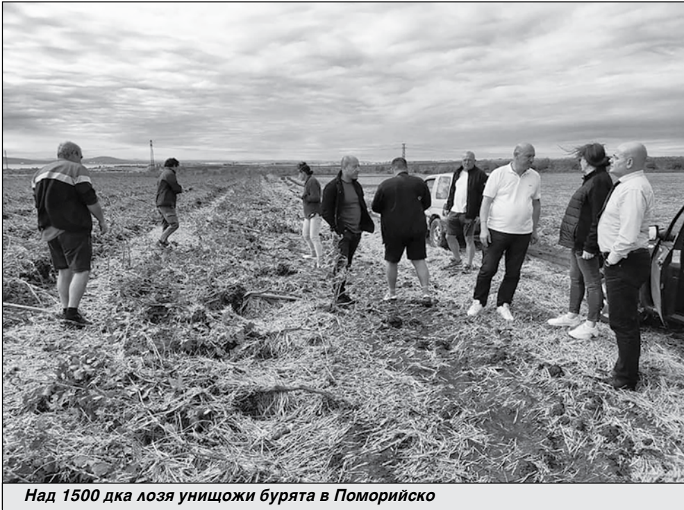
Над 1500 дка лозя унищожи бурята в Поморийско

След проверките имаме издадени протоколи от Областна служба „Земеделие“ за 100% про-