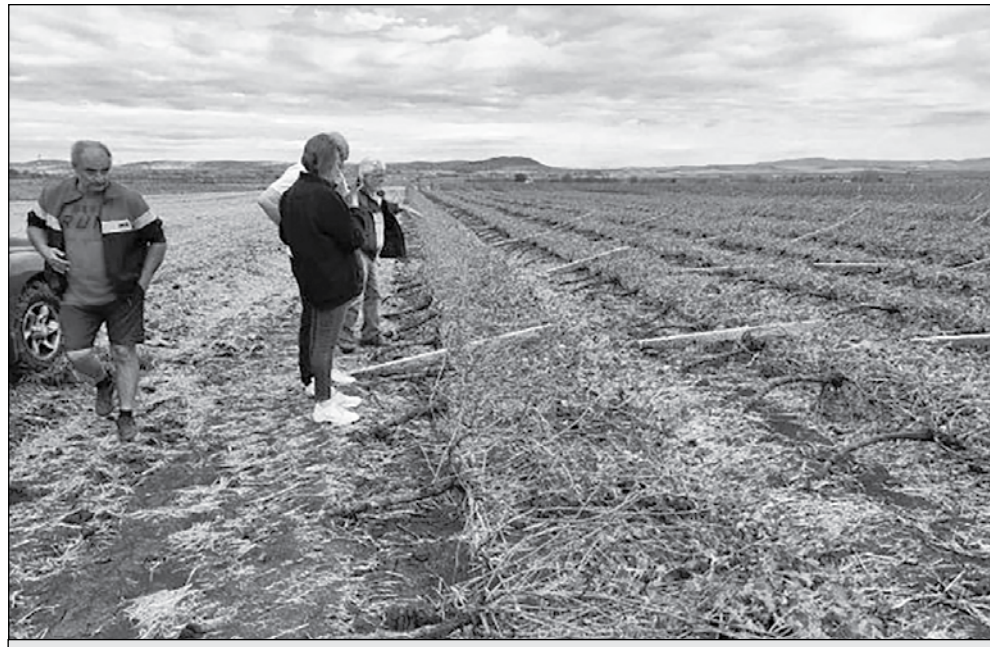
Щетите на земеделските производители са 95%, а унищожената продукция е над 1 млн. тона, според първоначалните им изчисления