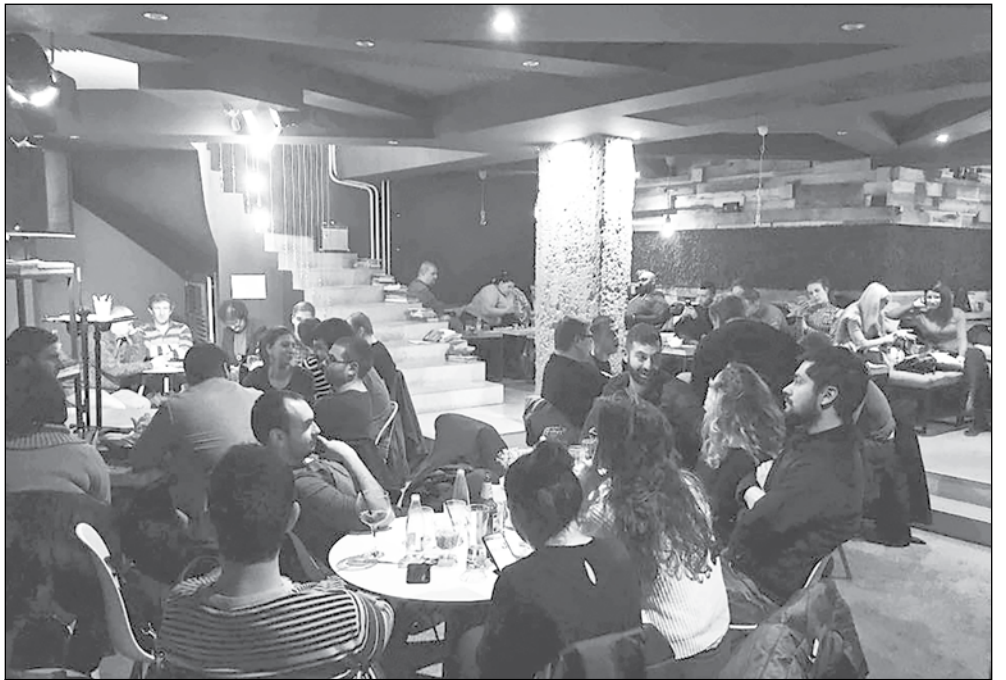
Бургаските заведения намериха добра ниша за правене на оборот в делничните дни с провеждането на куизове