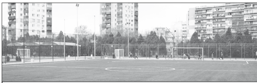
Срещата ще се състои на изкуственото игрище в „Изгрев“

„Още преди месец трябваше и ви го казах. Ако не искаете срещата да е формалност и говорилна, прецизирайте формата и участниците. Ако ме разбирате какво имам