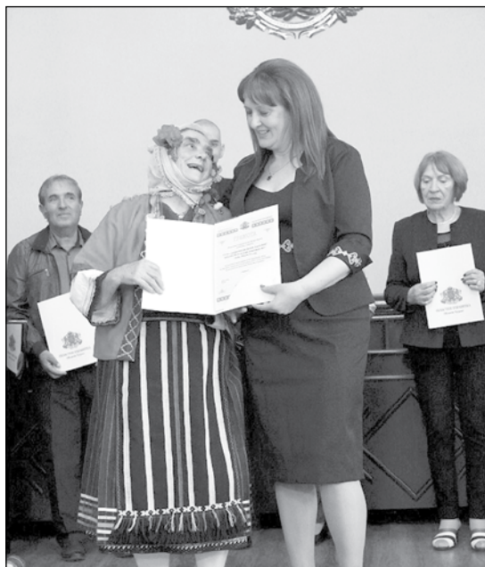
Грамота за достойно представяне на XII Национален събор в Копривщица