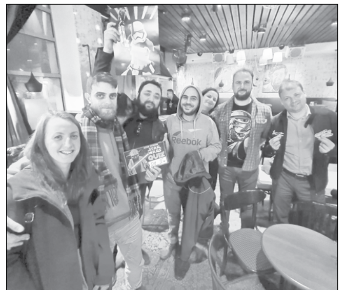
Един от най-интересните тематични куизове в Бургас е за „Междувъздушни войни“. Отбор от бургаски журналисти, сред които и наш репортер, завърши на второ място в първото издание в страната

„В големите градове, особено в София, куиз-културата е развита от доста години. Има си утвърдени отбори, утвърдени места, на които се провеждат. Понякога се правят куизове за определена аудитория. Има фирмени, свързани с тиймбилдинга. Регулярните