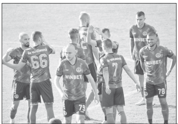
Вечните съперници „Черноморец“ и „Нефтохимик“ останаха без стадиони

В коментарите под публикацията бившият заместник-кмет на Община Бургас Костадин Марков пише: