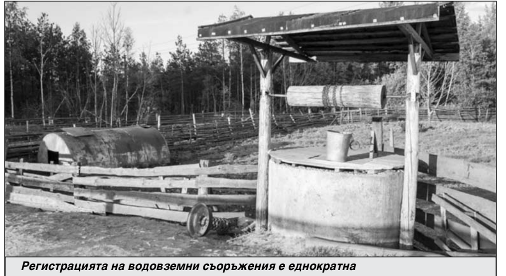
Регистрацията на водоземни съоръжения е еднократна

Собствениците трябва да подадат заявление в една от 4-те басейнови дирекции или при кметовете на населени-