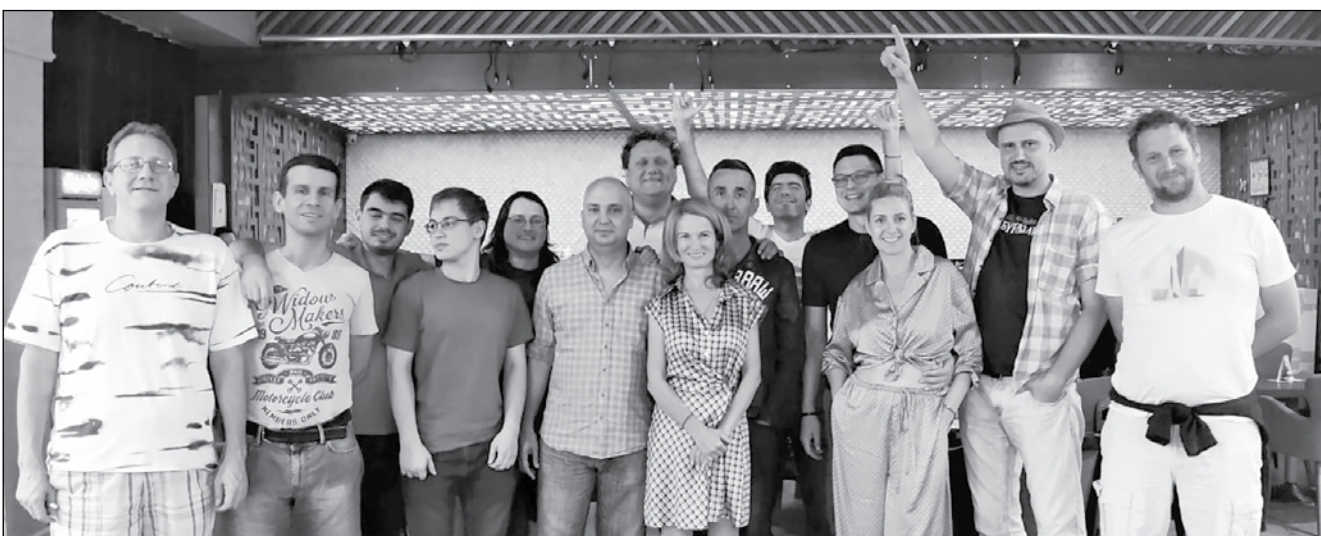
Двата бургаски отбора финалисти – „Без паника“ и „Ледените“, с обща снимка и пример за положителна конкуренция