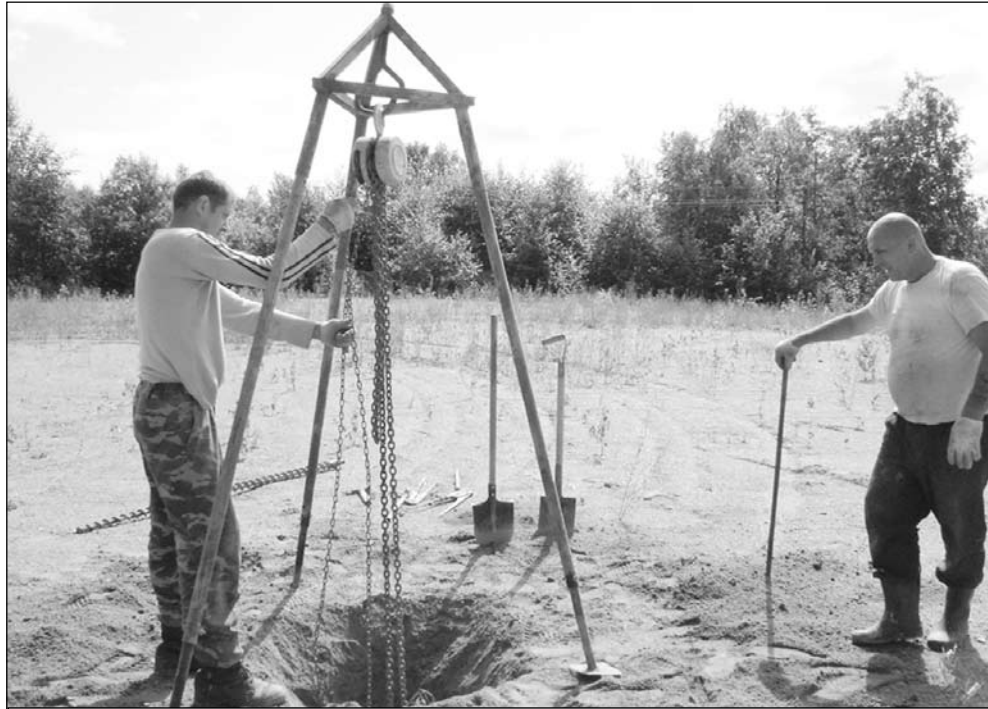
В село Кликач имат повече сонди, отколкото кладенци

Тук повечето от местните имат сонди. Сега има вече при нас заявления. У нас по традиция всичко се случва в последния месец. Така е и сега – та сега стартираме отново процедурата. А тя е такава: заявлението се подава до кмета. До 26 - 27 този месец ще трябва да ги входираме в Община Карнобат. Оттам екологът трябва да ги входира в Басейнова дирекция.