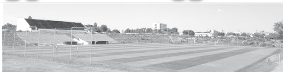
Бъдещето на стадион „Черноморец“ ще е сред най-обсъжданите теми на срещата