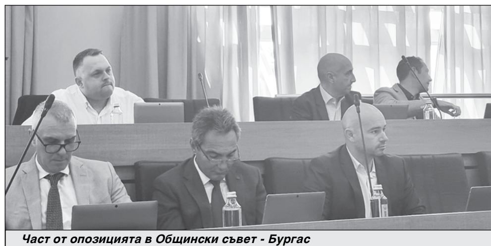
Част от опозицията в Общински съвет - Бургас

първи мандат общински съветник. Участва в три комисии. Внесени 7 собствени докладни и 8 общи.