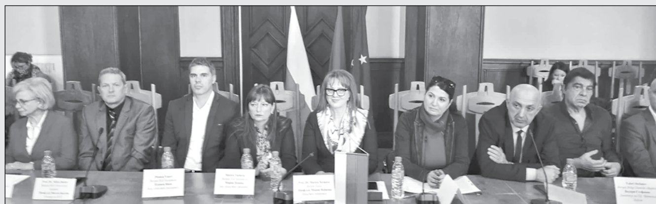
Областният управител и заместниците му са от чиновниците в държавната администрация, чийто възнаграждения се влияят от корекцията на министерските заплати

равлението на Бойко Борисов с министерско