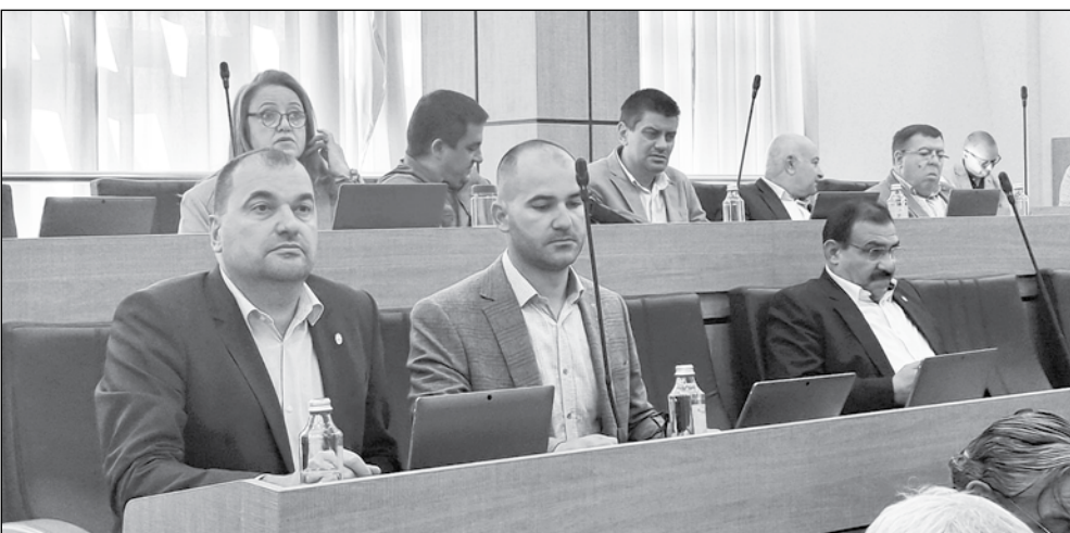
Често съветници от неуправляващите отправят питання към администрацията

„Не може да се официализира нещо гласувано от нас, без да сме запознати, защото това означава, че има риск да навредим на града“, категоричен е той.