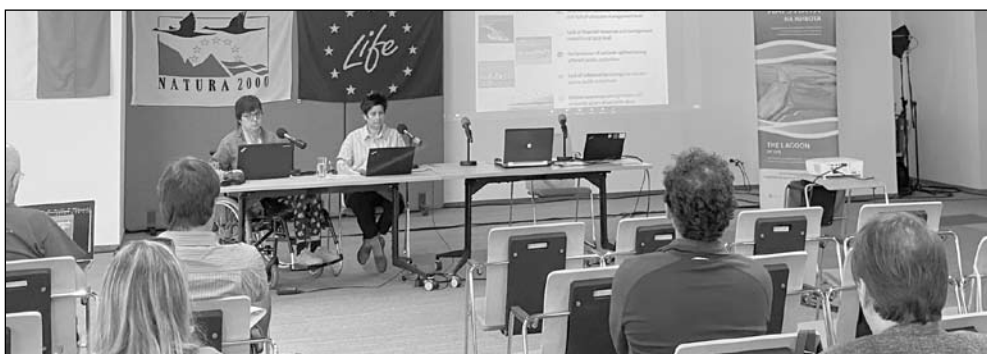
70 участници на живо в залата и онлайн, и десетки, които следиха стрийминга по социалните мрежи се запознаха с 16 презентации на експерти от Европа

В момента единствено във Франция солодобивът получава протекция от държавата под формата на субсидии, но там той се води селскостопанска дейност, в останалата част на Европа е промишлена дейност, защото е минна дейност.