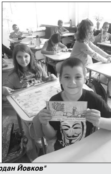
Морските приключения на третокурсниците от СУ „Йордан Йовков“