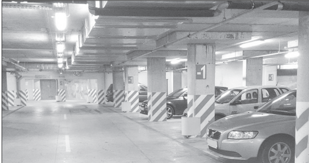
Концесионният договор е от 18.04.2007 г. и е между Общината и „Глобал технолоджи къмпани“ АД