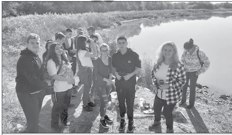
Освен теорията по време на проекта „Защитените зони - Младите хора - Климатичните промени“, ученици от ПГМКР „Свети Никола“ се включиха и в работа на терен. Взеха проби от езерото Вая и канала до училището, които свързва езерото с Черно море.

В няколко последователни уъркшопа участниците ще се запознаят с общоевропейска мрежа „Натура 2000“, защитените зони, ще изучават техните основни характеристики и значението им. Ще се запознаят с влажните зони – местоположение, обхват, характеристики, известни видове и ще работят на терен в тях. Като финал се очаква да разработят и разпространят web-базирана анкета, която ще даде информация доколко техните връстници са запознати с различните видове местообитания