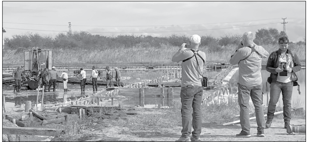
Участниците в Международната среща за иновативни подходи в управлението на крайбрежните влажни зони, която бе посветена на 30 години от стартирането на европейската програма LIFE, се запознаха на терен с Атанасовско езеро

В Бургас инфраструктурата на солниците се поддържа