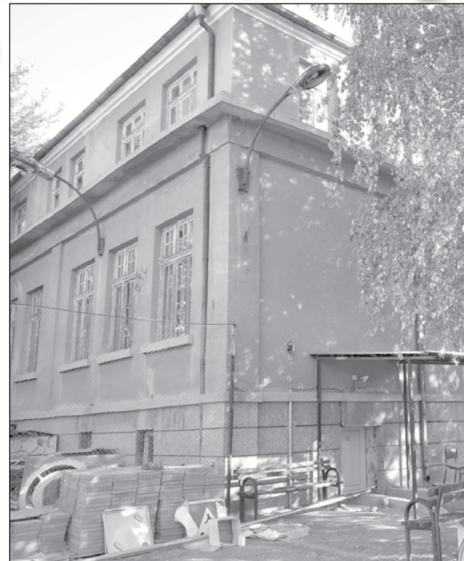
Бившето Логопедично училище в Айтос

датстване по процедура „Дейност 2: Изграждане на младежки центрове (в градове, които не са областни)“. Целта на процедурата е изграждане и осигуряване на ефективно функциониране през първите години на 10 младежки центъра, които предоставят разнообразни дейности (вкл. международни дейности) и цялостни услуги в помощ на личностното развитие и пригодността за заетост на учениците и младежите на възраст до 29 години. Общинската администрация - Айтос се оказа в списъка на 23-мата допустими кандидати. Минималният размер на помощта по процедурата е 1 400 000 лева, а максималният - 1 800 000 лева. Безвъзмездната финансова помощ за проекта е 100% от допустимите разходи, научи още НП.