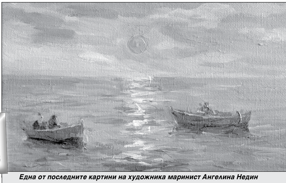
Една от последните картини на художника мариинист Ангелина Недин