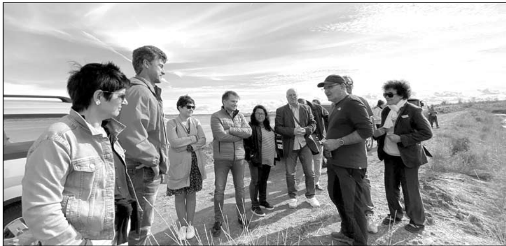
Възстановяването на минидиги и валове и почистването на вътрешните канали бе демонстрирано като инструмент за управление на водния режим и намаляване ефектите на фрагментация еутрофикация, причинени от действието на солника върху екосистемата

„Солниците са изкуствени екосистеми, те са създадени от човека и като такива се нуждаят от специфични грижи, за да могат да функционират. От една страна да изпълняват функцията на депа за природни ресурси, каквато е солта, и от друга страна - съхраняване на екосистемите като природа. Още по-ценно е, че те са свързани с населени места. Повечето от европейските солници се намират до емблематични населени места, Атанасовско езеро е чудесен пример за това, Бургас е крайбрежен, емблематичен град, което прави тази връзка между човек и природа по-