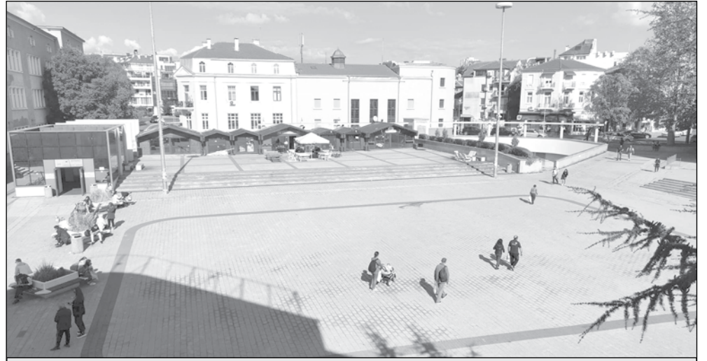
Концесионерът на паркинга под площад „Св. св. Кирил и Методий“ иска да му се позволи да погасява поетапно задълженията си

Концесионният договор е от 18.04.2007 г. и е между Общината и „Глобал технолоджи къмпани“ АД за предоставяне на особено право на ползване върху обект площад „Св. св. Кирил и Методий“, целият с площ от 3902 кв. м за изграждане и експлоатация на подземен паркинг на три нива, за около 400 паркоместа, включително инфраструктура и принадлежностите,