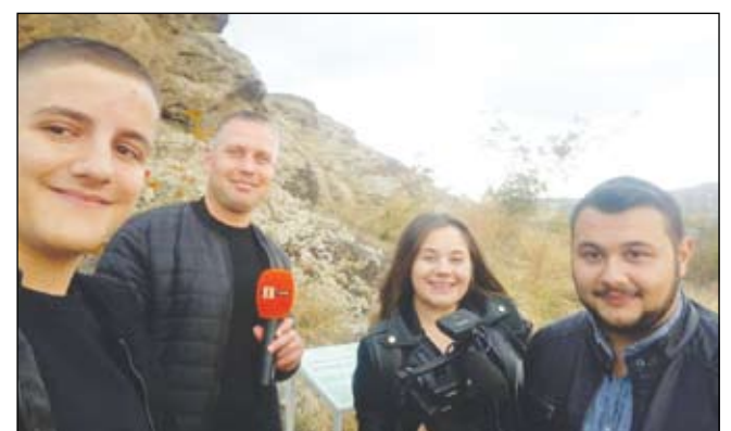
С екипа на БНТ