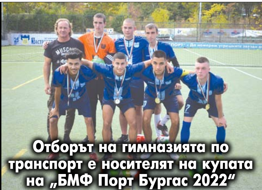
Отборът на гимназията по транспорт е носителят на купата на „БМФ Порт Бургас 2022“