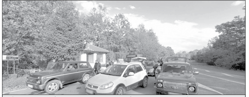
Акцията - цял „батальон“ от проверяващи брой животни, картофи и пчелни кошери