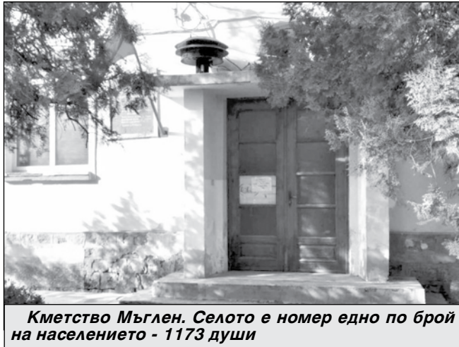
Кметство Мъглен. Селото е номер едно по брой на населението - 1173 души

Данните показват още, че към 02.12.1975 г. айтозлии са 20 949 души, към декември