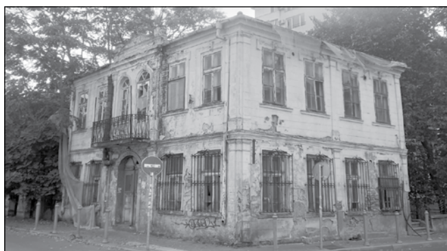
Ъгълът на улиците „Д-р Нидер“ и „Константин Фотинов“ - нехайство в действие

С европейски средства Община Бургас ремонтира, реставрира и въвежда мерки за енергийна ефективност в общо 7 сгради, 3 от които единични културни ценности, а останалите 4 са част от групови културни ценности.