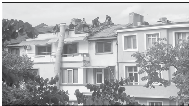
Ремонтни дейности по покрива започнаха и в друг имот в центъра