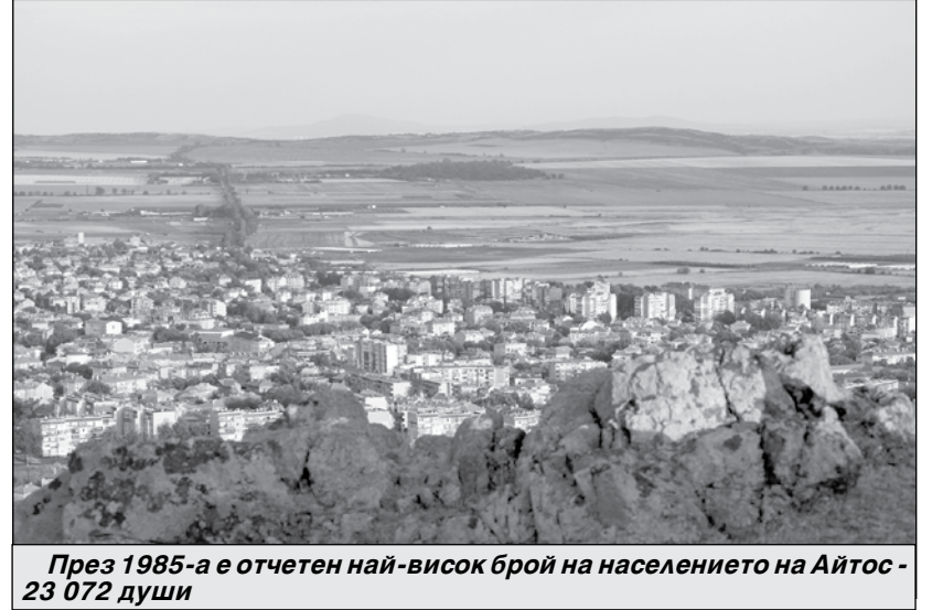
През 1985-а е отчетен най-висок брой на населението на Айтос - 23 072 души