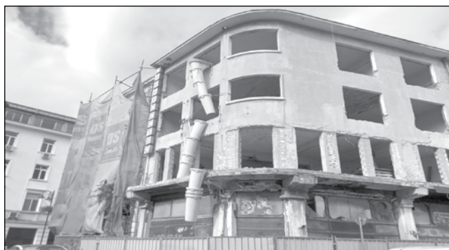
Дълго чакана реконструкция на ул. „Иларион Макариополски“. Срещу нея обаче дървета растат в изоставена красива сграда