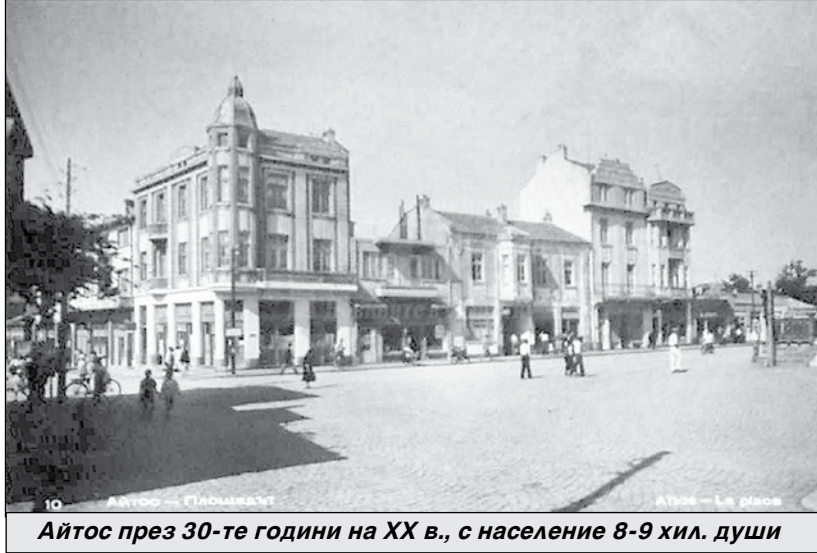
Айтос през 30-те години на ХХ в., с население 8-9 хил. души

Град Айтос е с население 17 764 души. Подробната справка на НСИ сочи, че към декември 1934 г., населението на град Айтос е наброявало 8680 души. През 1946 г. е вече 9929 души, през 1956 г. скача на 13 914, а през 1965 г. – на 17 766 души – толкова, колкото са и в момента преброяните граждани на Айтос. Оказва се, че сега броят на населението на Айтос е точно толкова, колкото и преди 57 години