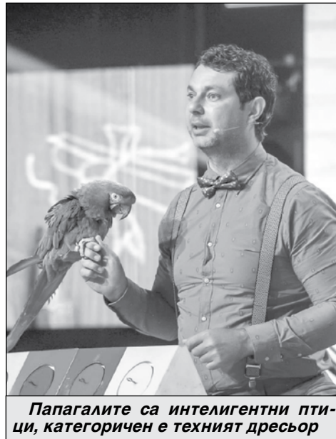
Папагалите са интелигентни птици, категоричен е техният дресьор