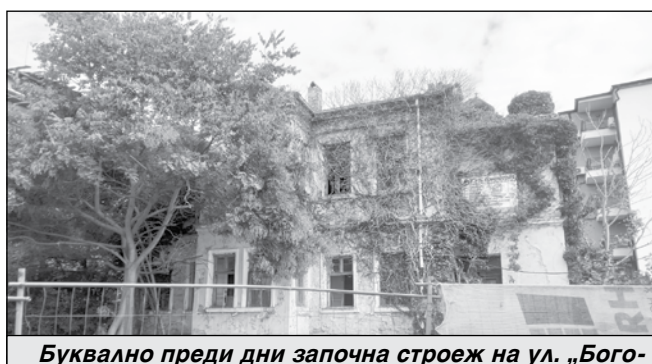
Буквално преди дни започна строеж на ул. „Богориди“, след като бяха премахнати търговските обекти, се откри стара къща, която е стояла зад тях