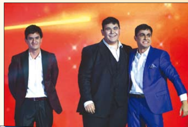
Отбор „Веселин Маринов“ продължава напред