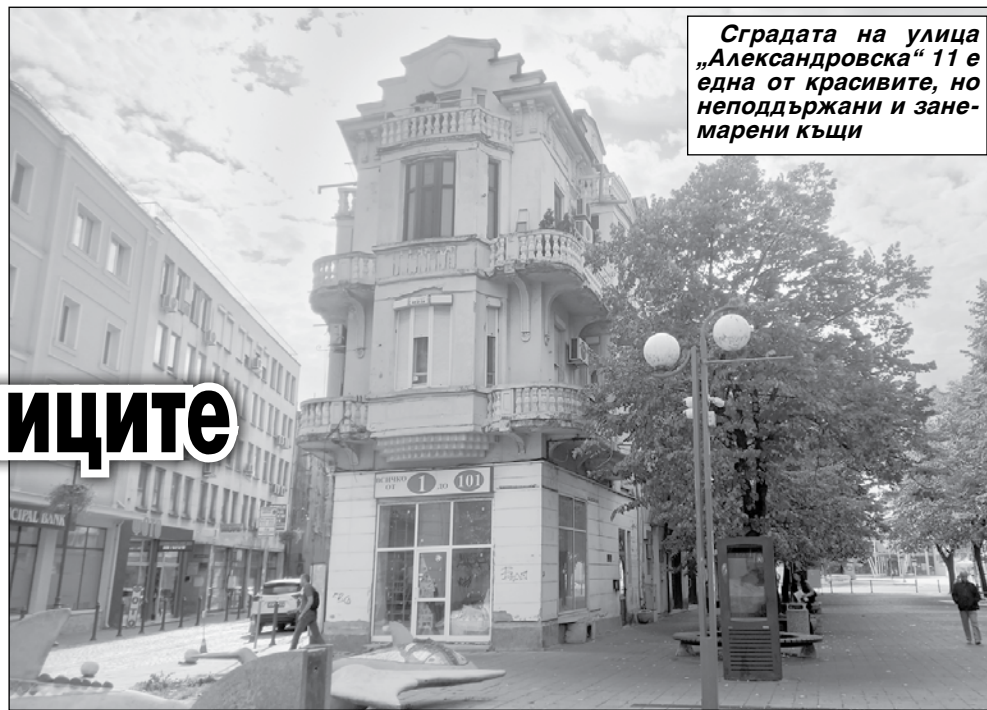
Сградата на улица „Александровска“ 11 е една от красивите, но неподдържани и занемарени къщи