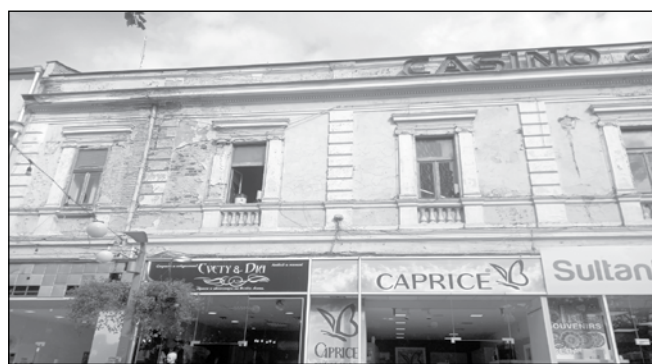
Имотът на ул. „Богориди“ 8 е един от тези със строителни книжа в ход