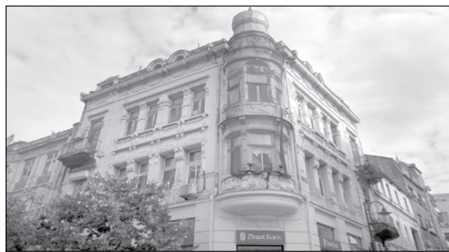
Имотът на улица „Александровска“ 15-19 също е с предписание