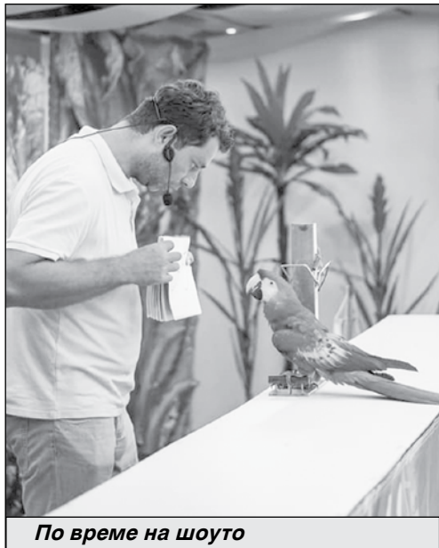
По време на шоуто

Със своите папагали той е участвал в „Турция търси таланти“ и е стигнал до финала. В българския формат пък стига до полуфинала. А с Чико има записан рекорд на Гинес. В двете си книги описва по забавен начин какво е да живееш с папагали, да имаш три деца и прекрасно семейство.