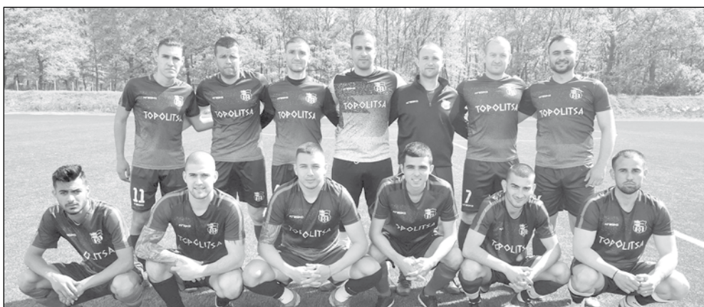
Съотборниците на стража и играчите на „Руен“ събраха част от средствата