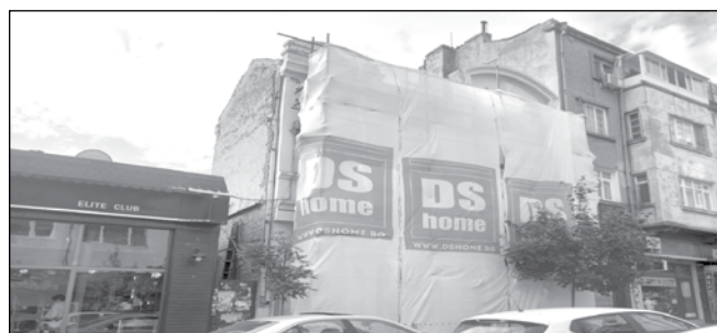
Наскоро започна ремонт на една от красивите фамилни къщи по „Фердинандова“. Без предписание и напомняне от общината, наследниците - известна лекарска бургаска фамилия, решиха да възродят родовата гордост, която датира от 1921 г.