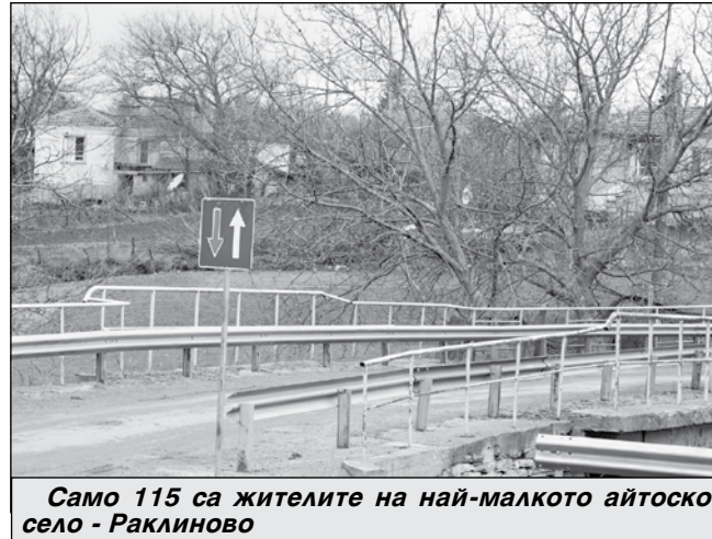
Само 115 са жителите на най-малкото айтоско село - Раклиново

1985-а пък е отчетен най-висок брой на населението на Айтос за период от 88 годи-