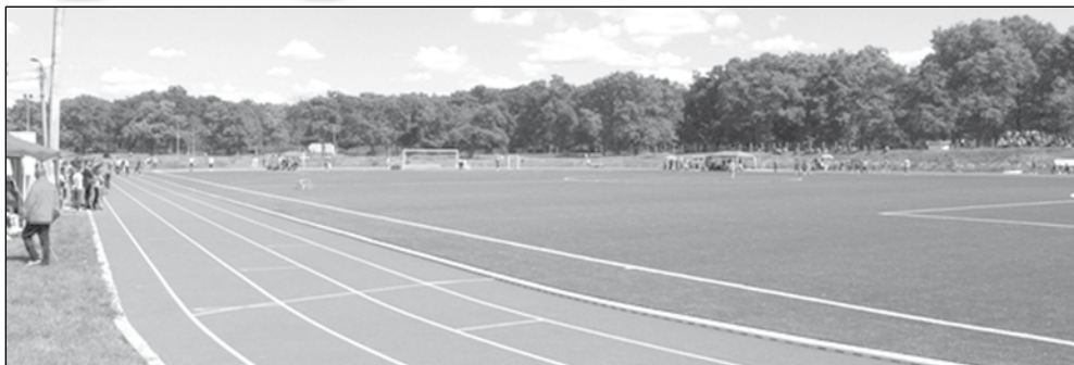
Срещата се игра на стадиона в Руен