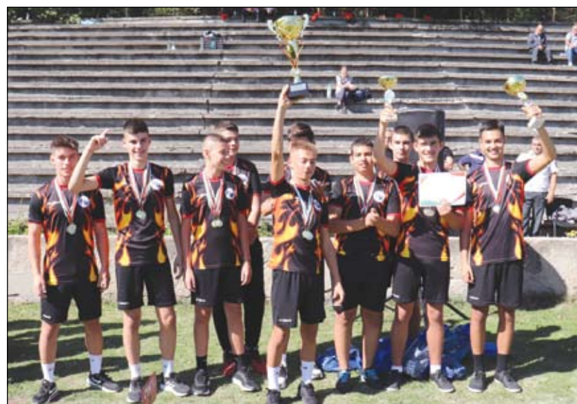
Заслужиха и златото, и купите на традиционния турнир