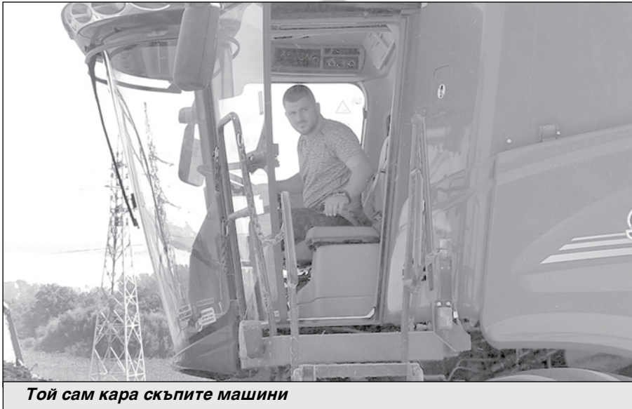
Той сам кара скъпите машини