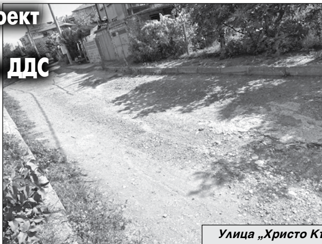
Улица „Христо Кърджилов“, гр. Айтос

Съгласно Условието за кандидатстване е необходимо решение на Общинския съвет за кандидатстване по процедурата. И Общинският съвет дава съгласие Община Айтос да кандидатства по процедурата и гласува още едно решение, според което „дейностите по проекта отговарят на