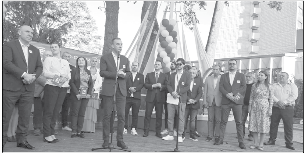
Отборът на ГЕРБ прати четирима депутати в парламента

При тези резултати ГЕРБ - СДС ще имат четири мандата, ПП - трима депутати,