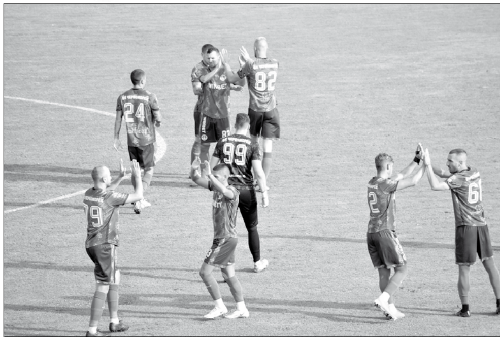
В последния си мач 10 „акули“ завършиха 0:0 с „Розова долина“