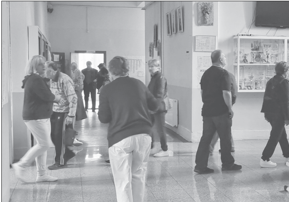
Хора пред секциите по обедно време не доведоха до висока избирателна активност

В 20:00 часа тя завърши при 37,38%. Право на глас имаха 360 394 души, а от тях правото си упражниха 134 724. Най-активни бяха в Руен - 48%, следват Созопол, Царево. Най-пасивни - в Карнобат и Айтос.