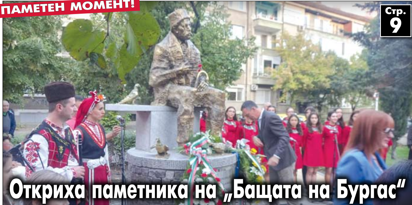
Откриха паметника на „Бащата на Бургас“