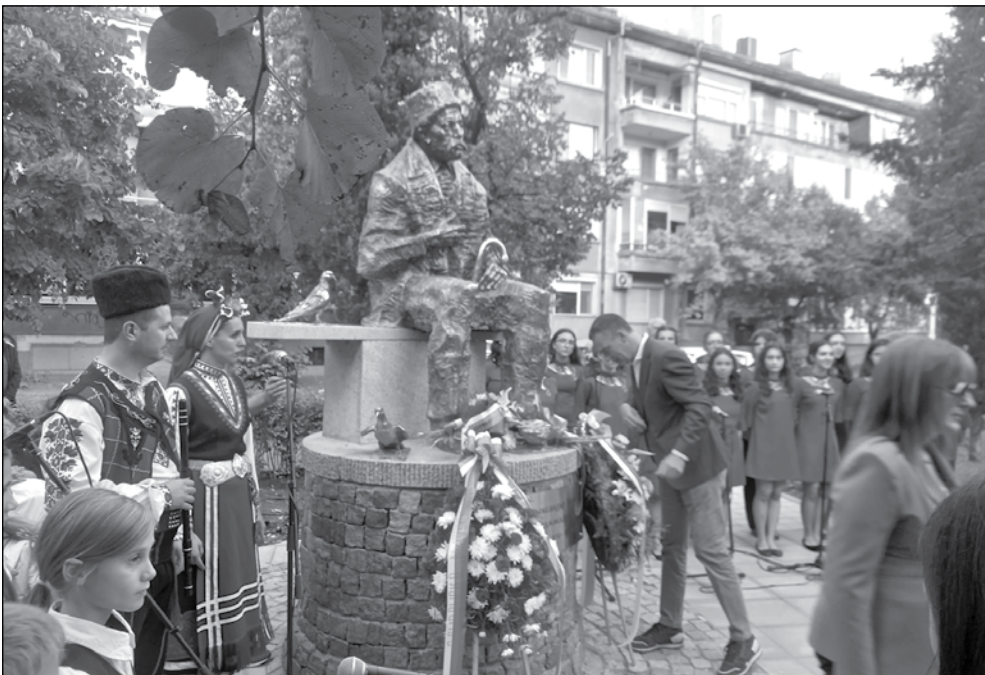
Венци и цветя и мило тържество в памет на големия благодетел

цедурата за разглеждане на неговия живот“, обясни духовникът.