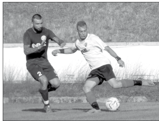
Засега карнобатлии се намират в зоната на изпадащите, но сезонът е дълъг

Другият клуб от Бургаска област, който се представя силно тази година в Трета лига – Югоизток – „Несебър“ е домакин на „Сливен“. „Делфините“ се намират на трето място, с 19 точки и също гонят класиране в професионалния футбол.