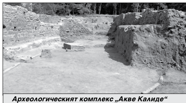
Археологическият комплекс "Акве Калиде"

Не без основание пътешественикът Евлия Челеби отбелязва в средата на XVII век, че Айтоската Лъджа (известните в древността Акве Калиде, Терми - сега музейен комплекс "Акве Калиде") е с най-добрите бани за лечение на болни и че в османските, арабските, персийските и в