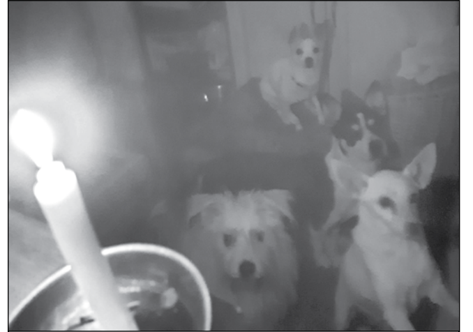
9 денонощия животните останаха без прясна храна и на тъмно

Но почти никой не ни вярва, че сме без ток. Не можем да си вършим административна-