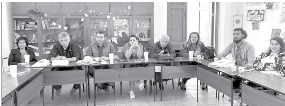
Директори и управители обединяват усилия за развитие на българските зоопаркове

Участниците споделиха своя опит и проблемите, пред които са изправени. Съобразявайки утвърдени добри практики, ръководителите на зоопаркове оч-