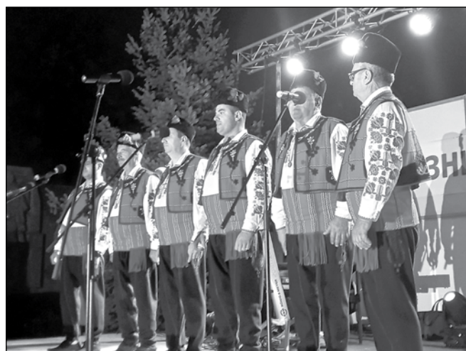
Творчески състави от цялата община се качиха на сцената