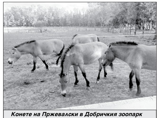
Конете на Пржевалски в Добричкия зоопарк