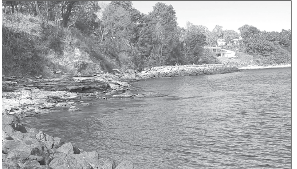
С реализирането на проекта ще се изгради пешеходна алея за жителите и гостите на града