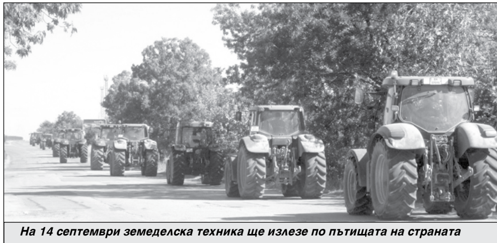
На 14 септември земеделска техника ще излезе по пътищата на страната

Недоволството на зърнопроизводителите у нас е провокирано от липсата на ефективни действия от страна на националните власти за защита на българското зърнопроизводство и българските потребители във връзка със засиления внос на зърнени и маслодайни култури от Ук-