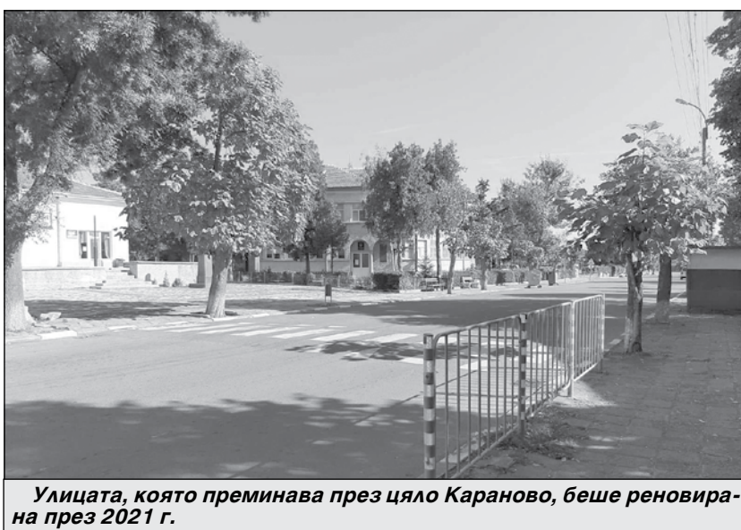
Улицата, която преминава през цяло Караново, беше реновирана през 2021 г.