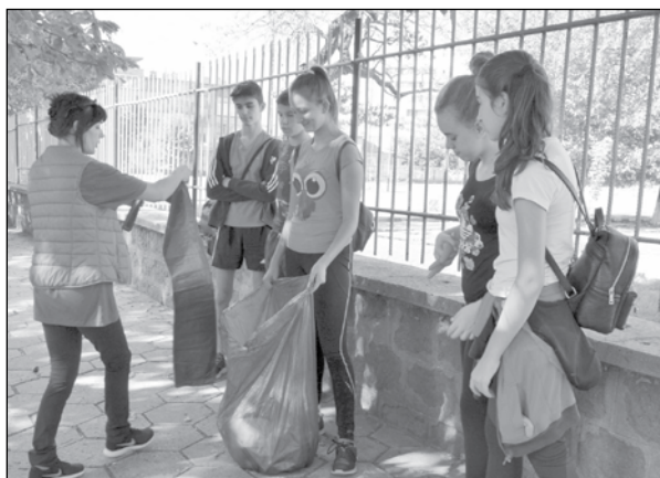
Тази година учители и ученици на СУ "Христо Ботев" ще чистят района около поликлиниката