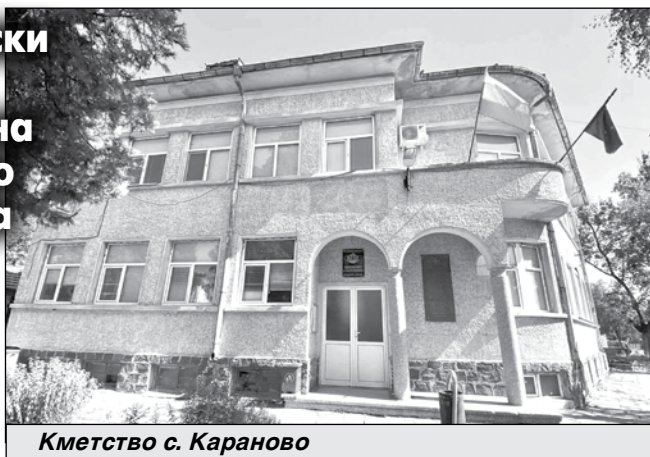
Кметство с. Караново

Другото духовно средище е читалището, открито през 1928 г. Група ентузиастични внасят по 15 лева членски внос, за да дадат начален тласък на възрожденската институция. На първото им заседание се решава читалището да носи името „Светлина“, избира се и ръководство. Председател е Не-