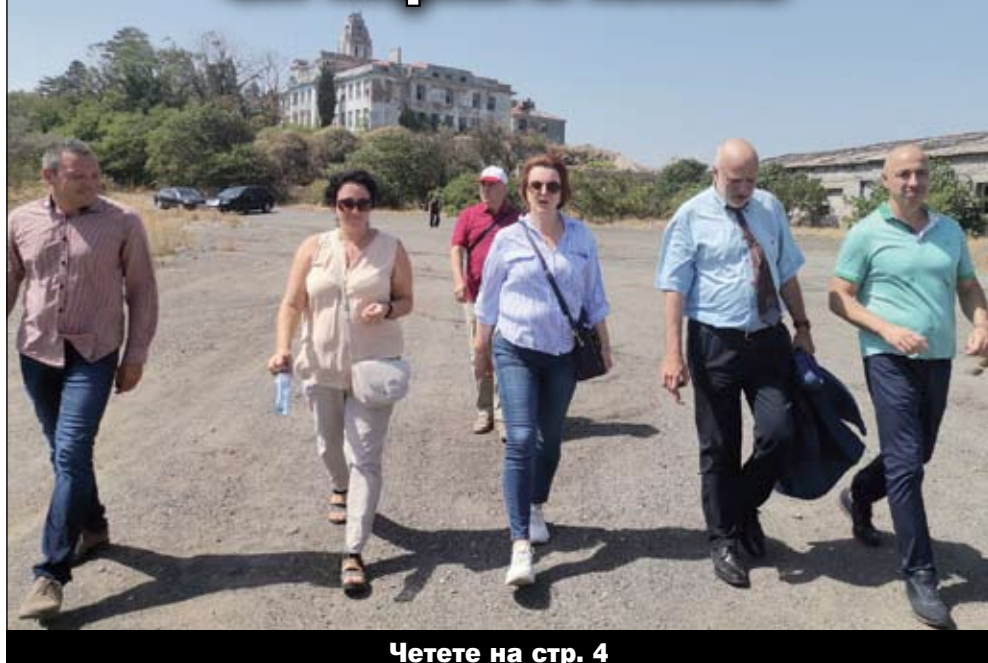
Четете на стр. 4