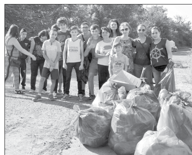
Възпитаниците на ПГСС "Златна нива" отново ще почистват нелекия район около училището