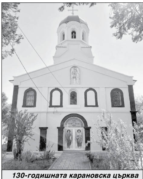
130-годишната карановска църква