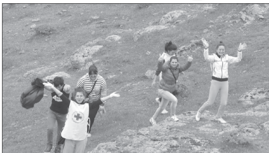
2013 г. - Младите доброволци на БМЧК-Айтос почистват околностите на града

5. Дворът и районът на Основно училище "Христо Ботев" – с. Пирне, общ. Айтос;