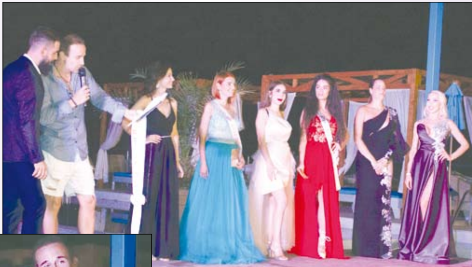
Бургазлията обявява втората подгласничка на МИСИС ВАРНА 2022

„Получих поканата в 3 часа след полунощ от MISS WORLD BULGARIA 2021 BG, която е организаторка на конкурса, и нямаше как да й откажа“, сподели специално за „Черноморски фар“ любителит-