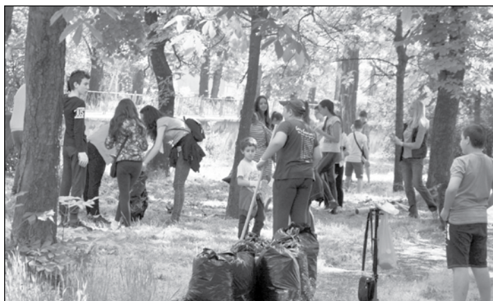
Всеки, който иска да живее на чисто, може да се включи в националната кампания

и ангажираност с каузата „Чиста околна среда за нас и следващите поколения“. За допълнителна информация и получаване на под-