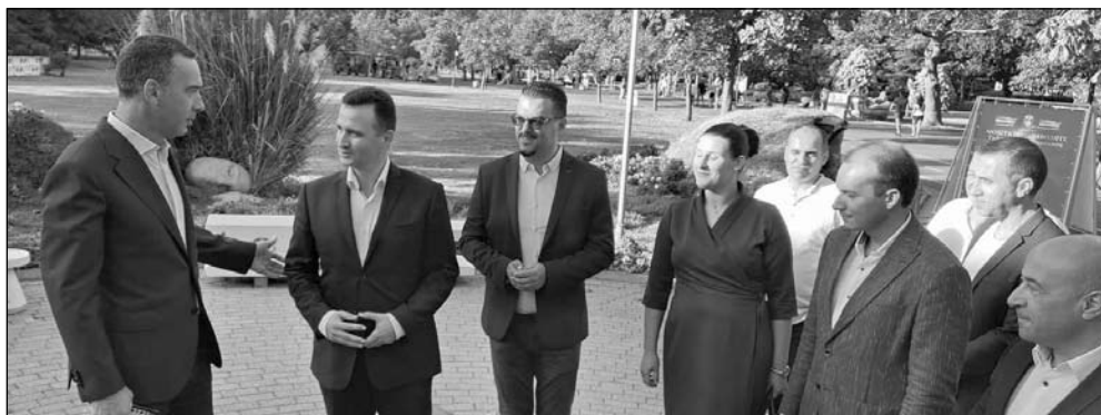
Кметът на Бургас (вляво) - категоричен, че вече няма да има кой да спира проектите на Бургас, той посрещна отбора на ГЕРБ-СДС на Флората, където бе представянето

Преди да застане пред бургаслии, групата постави венец пред паметника на Петя Дубарова в Морската градина. С този символичен акт всеки от присъстващите заяви, че пази Бургас в сърцето си и ще работи за развитието на града и областта.