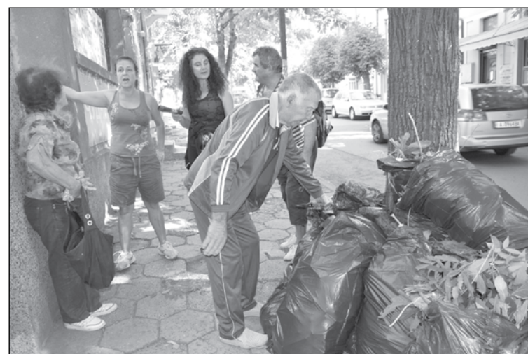
Айтоските туристи се включват във всяко издание на кампанията

С участието на всеки един от нас в кампанията ще демонстрираме своята активна гражданска позиция