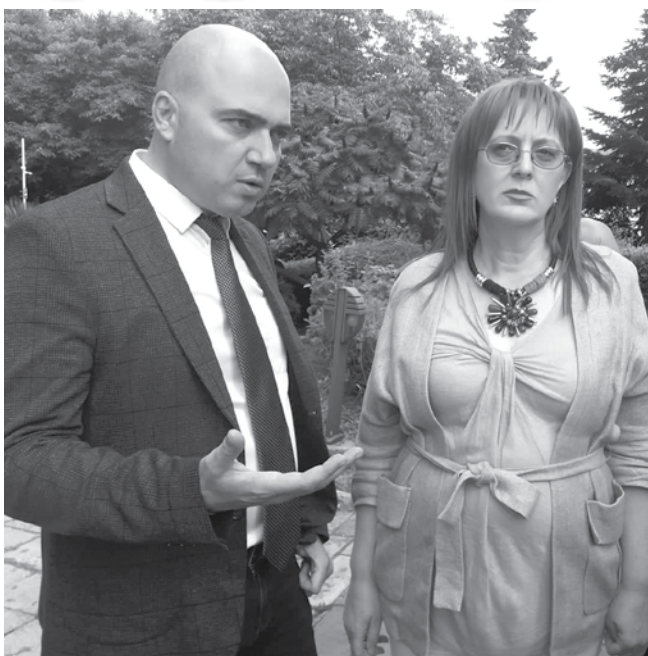
Служебният министър на туризма Илин Димитров обясни преди време от Бургас, че трябва да се активизира сериозна рекламна кампания за ваучерите

Борис Минчев, управител на хотел „Аква“ в Бургас, казва, че до момента е нулев ин-