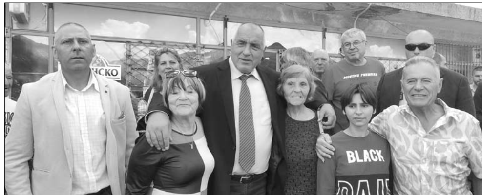
След Ахелой Бойко Борисов посети и Каблешково. Снимка за спочен с местните хора

Той добави, че в последната година 70% от хората посочват, че са обеднели и припомни поскъпванията на тока, горивата и храните.