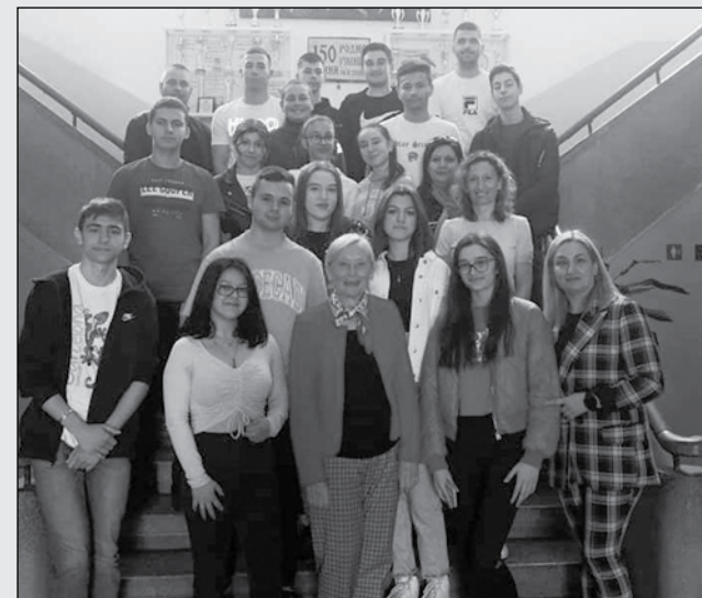
С айтоските младежи посланици на Европейския парламент