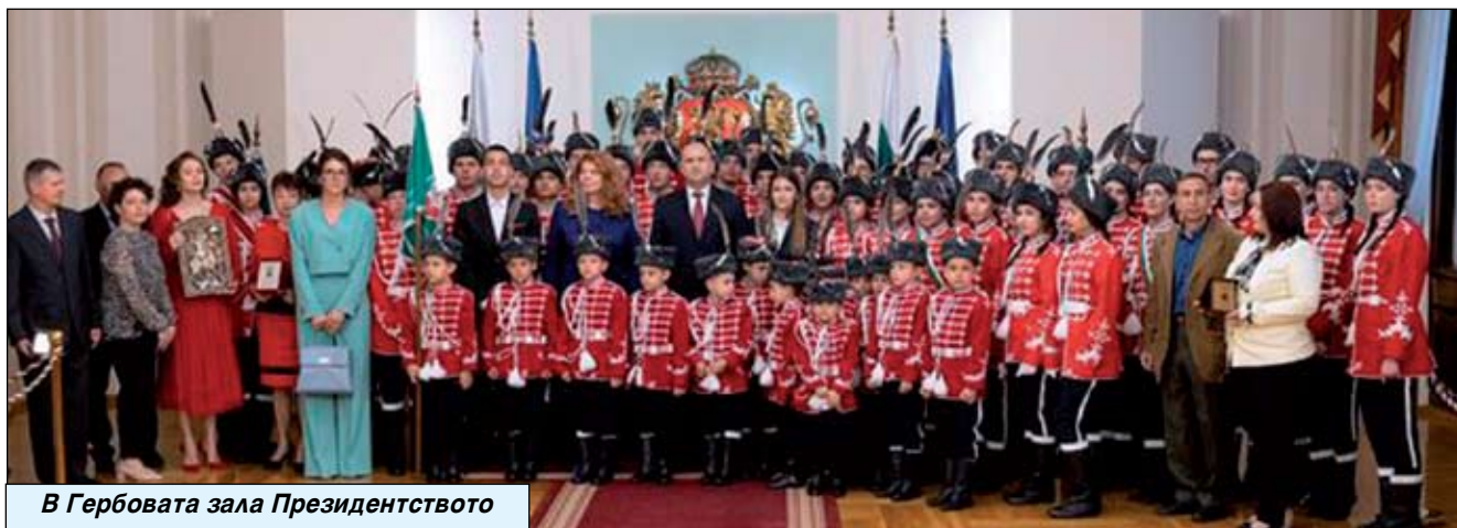
В Гербовата зала Президентството

„Щастлива съм, че по време на срещата с президента