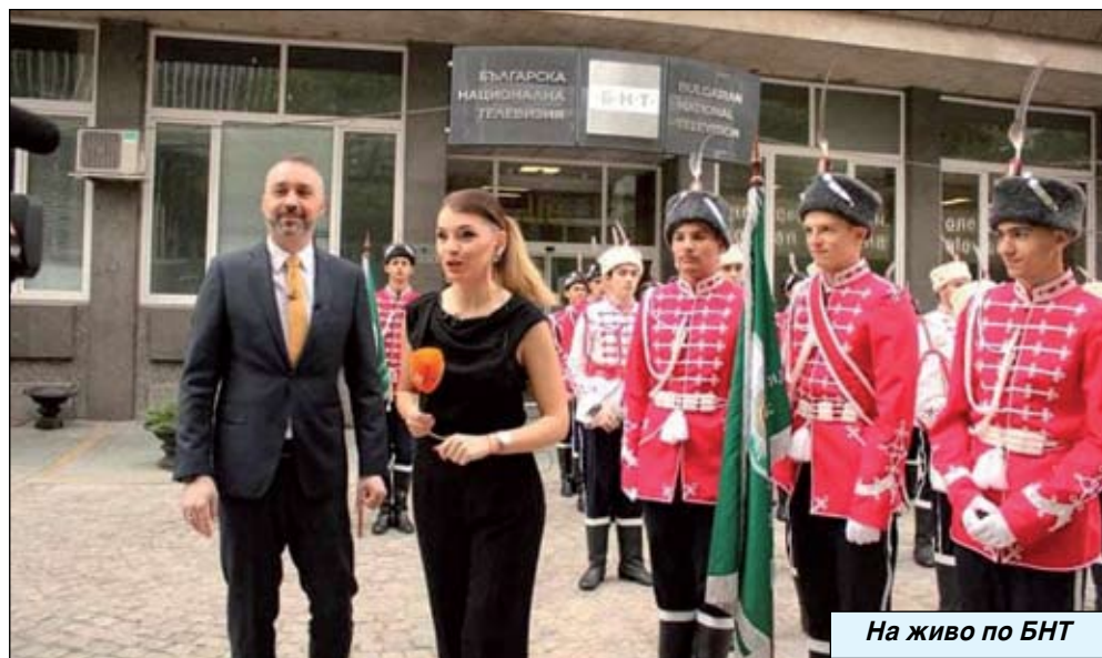
На живо по БНТ