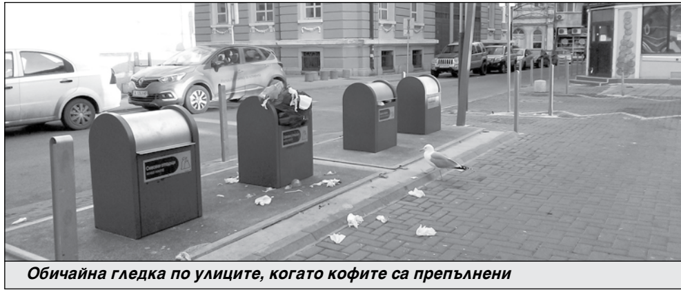
Обичайна гледка по улиците, когато кофите са препълнени