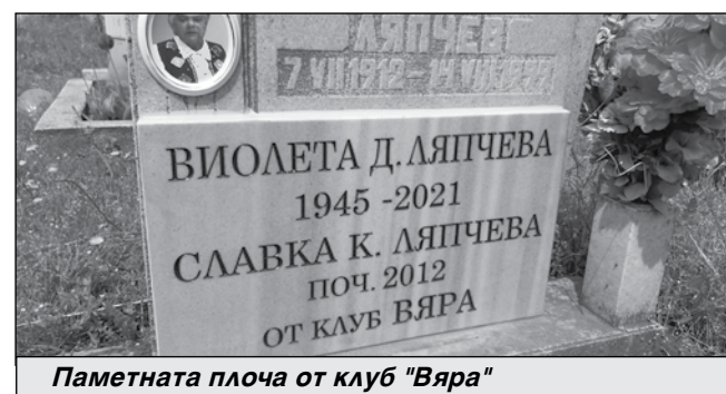
Паметната плоча от клуб "Вяра"

Била е за кратко детска учителка, а в продължение на години - библиотекар в двете близки села Лясково и Поляново. През последните десетина години се беше отдавала с много страст на самодейността. Въпреки оскъдните доходи, непре-