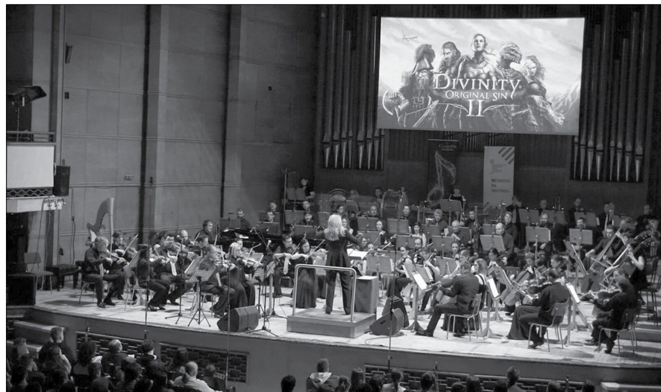
Все по-често се правят концерти със симфонични оркестри, изпълняващи саундтрак музика от игри

- Без да знам, че и Мъск е писал по темата, това е теория, с която обичаме да се шегуваме и забавляваме в екипа ми. Моята интерпретация на тази фантастична идея се базира на така наречената Камбрийска експлозия. Накратко, в така наречената Камбрийска епоха на Земята, който датира на повече от 540 милиона години назад във времето, се намират най-старите открити фосили на живи организми на земята. Интересното е, че те вече са напълно обособени като организми и са се появили по цялото земно кълбо по времето на същия този Камбрийски период. И ако