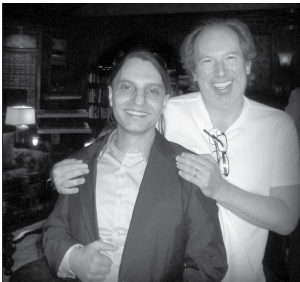
С Ханс Цимер

- Знам, че си работил с великия композитор Ханс Цимер. Разкажи повече. Кога беше това и по какъв проект? Той прави музика предимно за филми. Прави