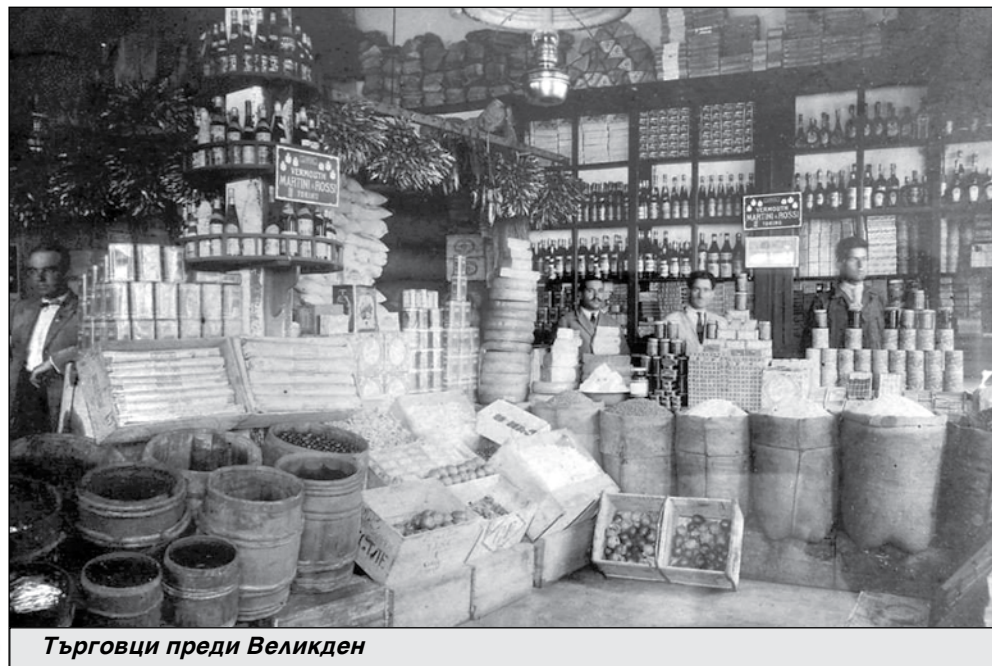
Търговци преди Великден