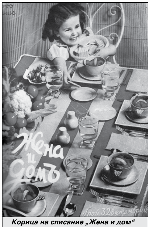
Корица на списание „Жена и дом“