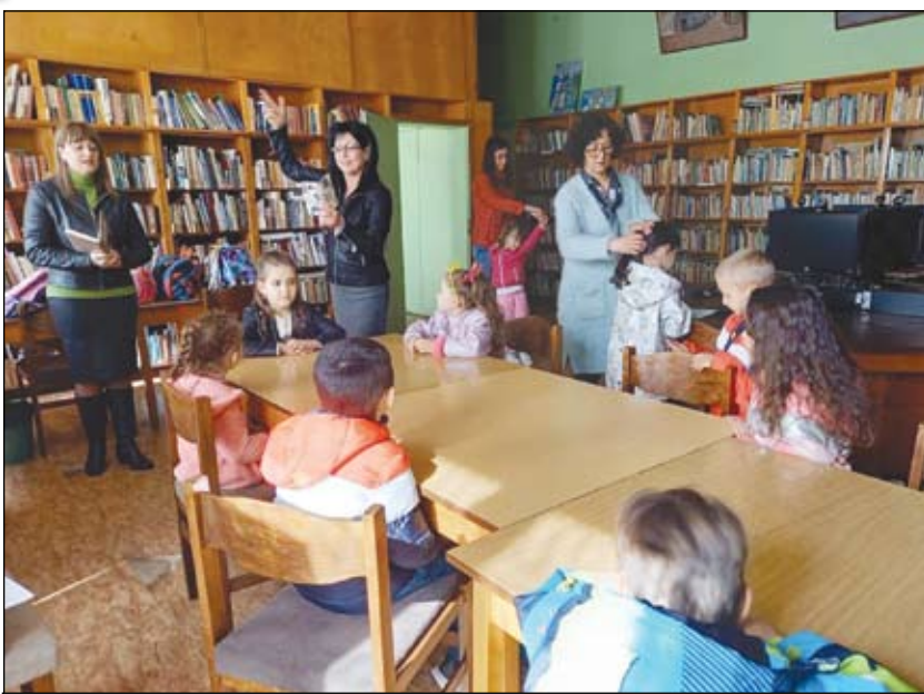
За първи път в читалнята на читалищната библиотека

Инициативата е част от мисията в подкрепа на грамотността, културата и образованието. Казулата на Асоциация „Българска книга“ е за повишаване интереса към четенето и функционалната грамотност сред подрастващите, както и да информира обществото като