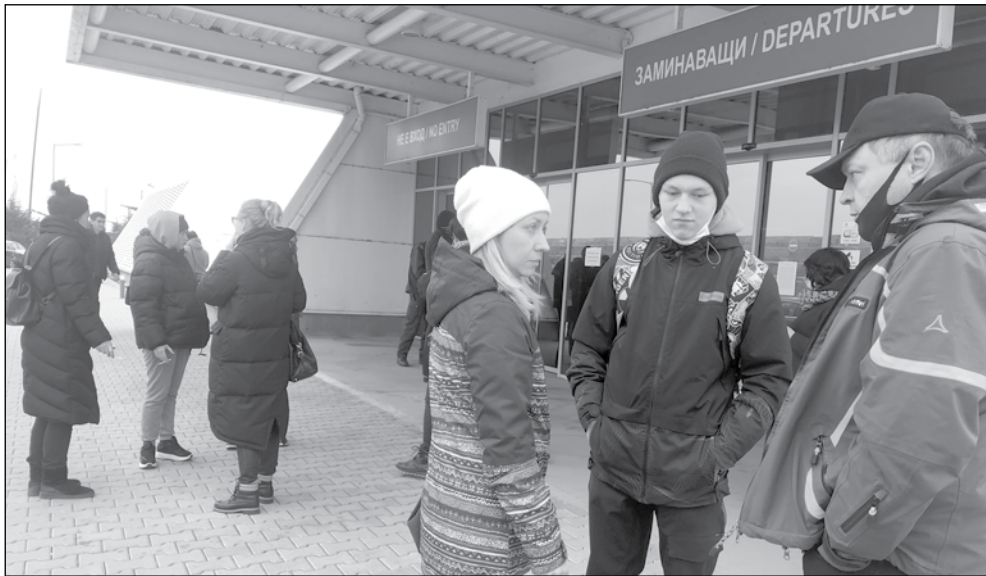
Голяма част от бежанците в общината идват точно от Николаев и другите южни градове

Бегла справка в община Бургас и останалите мор-