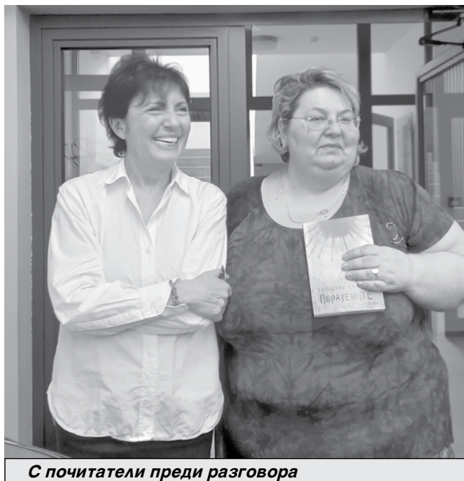
С почитатели преди разговора

краднаха телефона, взеха и дрехите и я завлякоха в последния етаж на една сграда. След два-три дни ги хванаха и те направиха пълни самопризнания. Тази случка ме поразя, тя ме премаза и си помислих: деца от нормални семейства - родители на едното са лекар и учителка, на другото - психолог и лекарка, съвсем средностатистически, нормални български