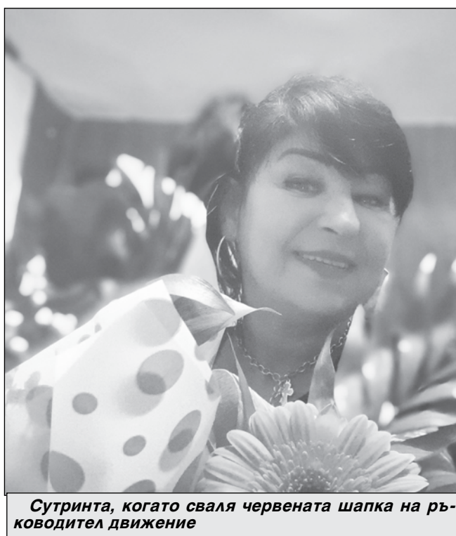
Сутринта, когато сваля червената шапка на ръководител движение

е усмивката и добрата дума. С тях пленява пътниците, които някога са изнервени, гневни. Но след няколко минути разговор се успокояват. „Има случаи, когато влакът закъснява,