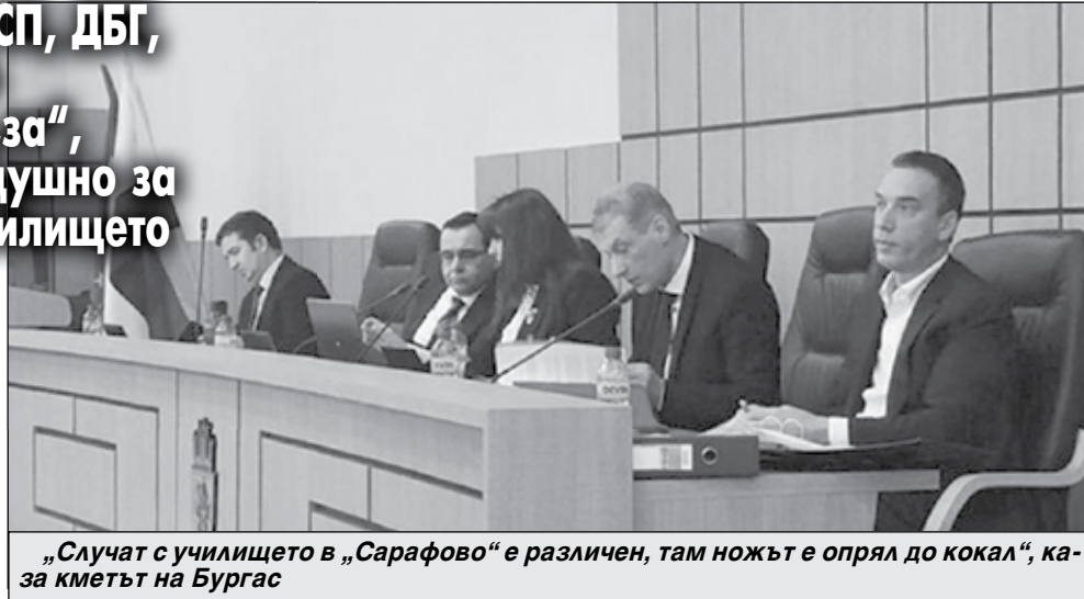
„Случат с училището в „Сарафово“ е различен, там ножът е опрял до кокал“, каза кметът на Бургас

„Случаят с училището в „Сарафово“ е различен, там ножът е опрял до кокал. Сградата е тясна и създава пречки пред нормалния образователен процес. Със заложените средства в капиталовата програма на общината за текущата година, проблемът ще се реши частично. Апелирам към вас, иде реч за градско народно дело. Говорил съм с компаниите, които ще дарят средства по сметка, която вече сме открили. Убеден съм, че с вашите усилия и с усилията на народните представители, ще успеем да съберем нужните средства за финансиране. След като могат да бъдат отпуснати средства по дарителски сметки за украинските бе-