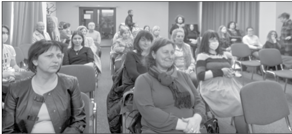
Четящи бургаслии изпълниха зала „Акад. Константин Петканов“ на библиотеката за среща с писателката