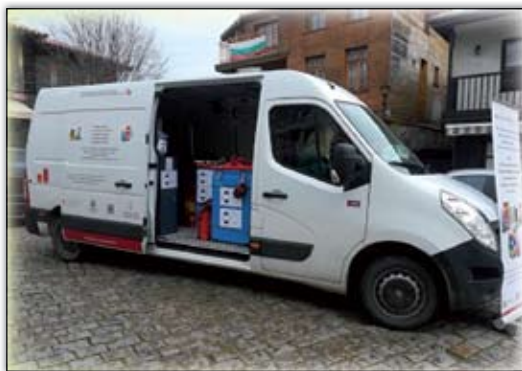
График на мобилен събирателен пункт за м. април 2022 г.