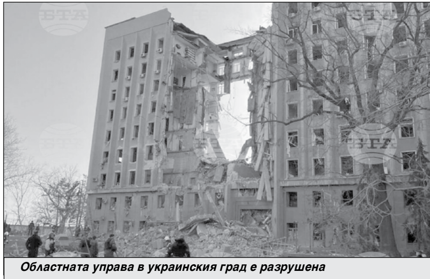
Областната управа в украинския град е разрушена

отчитат бум в продажбата на имоти. Училищата и детските градини също са препълнени. Бежанците в Бургас са хиляди - жени и деца. Наред с положителните страни, появяват се и междуличностни проблеми в града все по-често, но до сериозни конфликти не се е стигало.