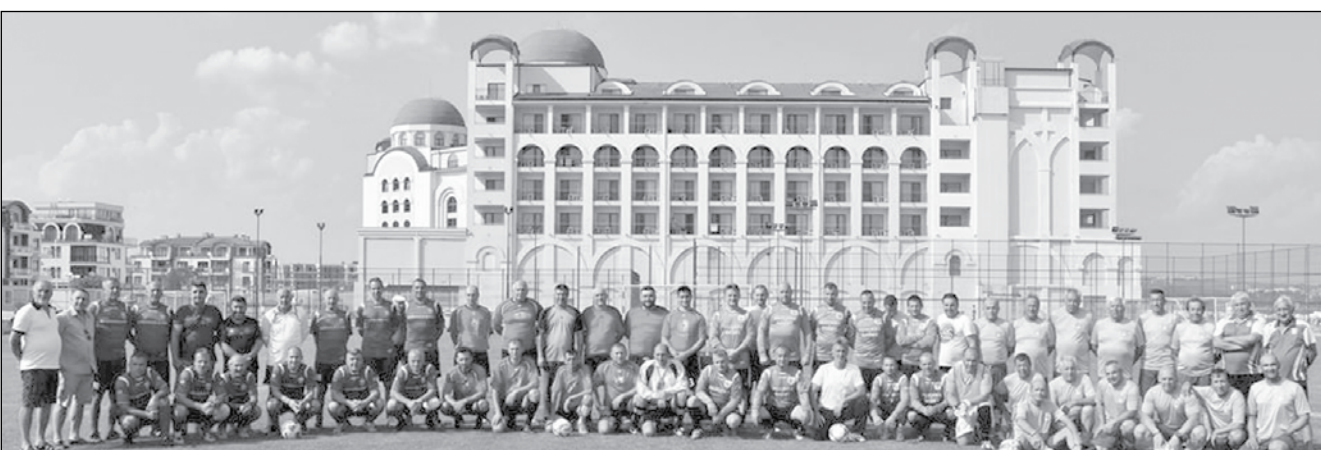
Трети турнир по футбол за ветерани. Домакин и организатор на събитието бе сдружение „Клуб Ветерани Обзор“. Участници освен българските отбори, са и от ФК „Кубей“ - с. Кубей, Украйна.