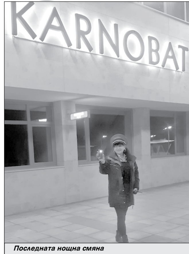
Последната нощна смяна

та си, хем е женска, хем е мъжка. Но никога не ѝ е тежало. „На нощните смени трябва да си бодър, да не заспиваш. Да мислиш“, обяснява жената. Но пък работата на смени ѝ дава повече свободно време. И понеже не може да седи на едно място, тя упражнява и другата си професия – на фризьорка – у дома си. Там залага на сръчността и уменията си да държи ножичката. А при професията на ръководител движение казва, че се опира на опита, който е придобила, тръгвайки от най-ниското стъпало на работата.