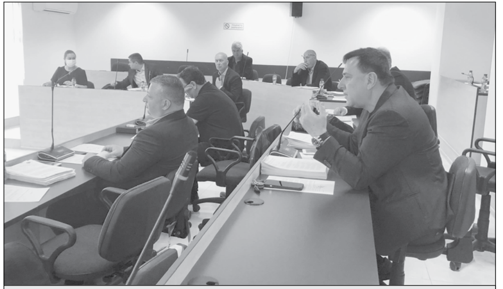
С близо 13 милиона лева повече от предходната година са заложените средства, които идват от делегирани държавни дейности

Община Несебър е сред малкото, които подпомагат със значителни средства дейността на читалищата на своята територия. Държавната издръжка за читалищна дейност е 272 217 лв., а общинското дофинансирание е в размер на 360 000 лв. За пенсионер-