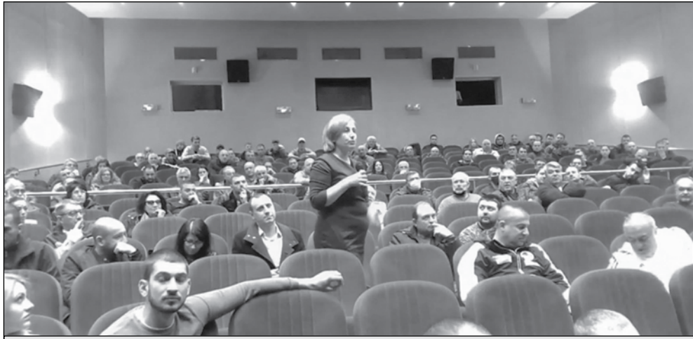
ПП, ИТН и БСП апелираха синята зона да бъде преосмислена

По време на общественото обсъждане стана ясно, че новозастроената част на града, популярна в цялата страна като Руския квартал или „Малая Россия“, не фигурира в така разчертаното платено паркиране. Според граждани, след като разполагаш със средства за инвестиция в апартамент, можеш да си позволиш да пла-