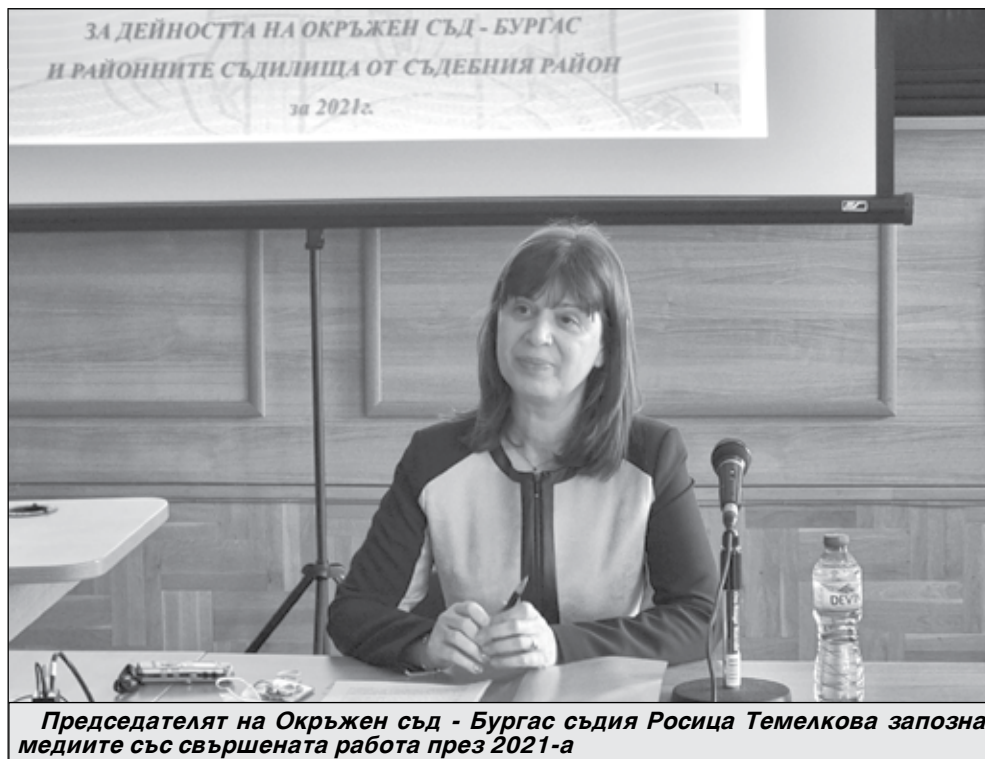
Председателят на Окръжен съд - Бургас съдия Росица Темелкова запозна медиите със свършената работа през 2021-а

„Друг проблем, който мога да ви споделя, е проблемът със съдебните служители. В Бургаския Окръжен съд съотношението между служителите и магистратите е 1.71 при средна норма 2.17. След нас са само София и Пловдив като съотношение. Разумната бройка е 1 към 2, но ние не можем да стигнем до там. Проблемът е с намирането на подходящи кандидати, защото длъжностите са съдебен секретар изисква съответни умения – бързо писане на машинопис, но и физическа и психическа устойчивост. Знаете, има заседания, които продължават много дълго. Отделно наказателни про-