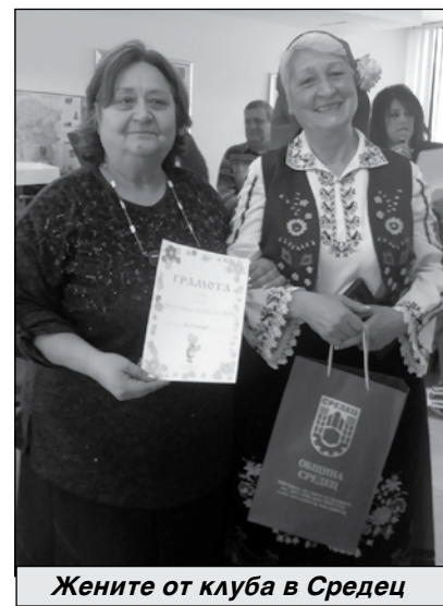
Жените от клуба в Средец

участници да участват в празниците на града през септември. Имате нашата подкрепа, подготвяйте се.