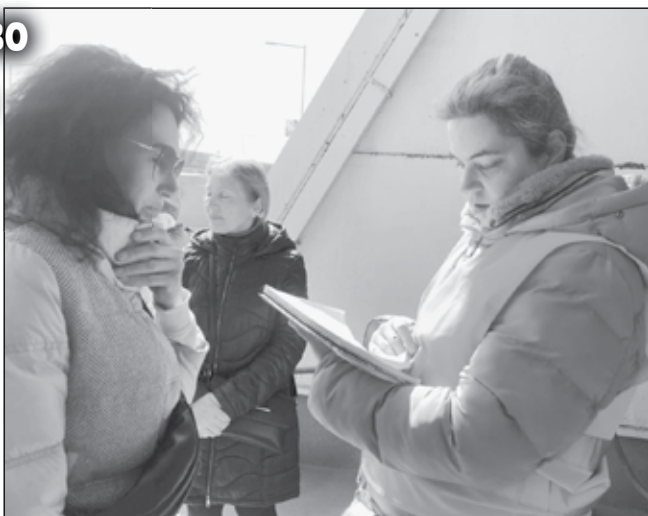
ма част от тях са с педагогическо образование и инженерни кадри.

Екипи на Агенцията по заетостта насочват желаещите да започнат работа в Бургас и областта към териториалните бюра, където се извършва същинската консултация. Присъгналите в Бургас са с квалификация над средната. Голя-