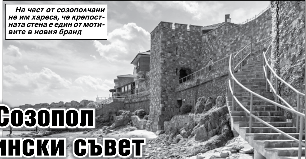
На част от созополчани не им хареса, че крепостната стена е един от мотивите в новия бранд

Наредбата за платено паркиране е качена на официалния сайт на Община Поморие. Предложения се очакват до 30 март. На 2 април, събота, е първото обществено обсъждане. Предложения се очакват до 5 април – второто. Наредбата за платено паркиране влиза в сила най-късно от 1 юли 2022 година.