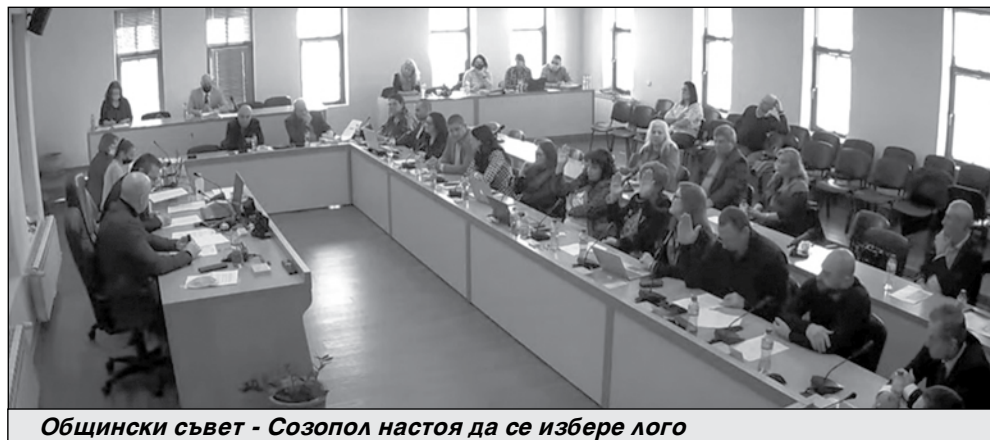
Общински съвет - Созопол настоя да се избере лого