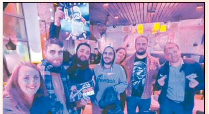
Отборът на успешните дебютанти от „01“ с награда за второ място

Депресията може да бъде безпощадна. Безсънието - също.