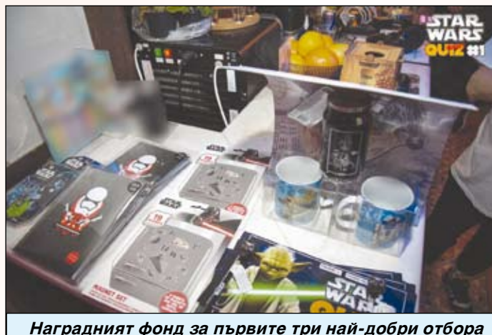
Наградният фонд за първите три най-добри отбора