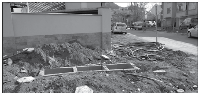
Преди да бъдат реновираны тротоарните настилки на ул. „Братя Миладинови“, „Богориди“, „Софроний“, вървят дейностите за подземно окабеляване