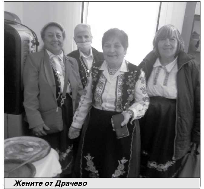
Жените от Драчево