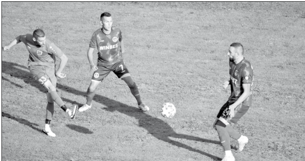
Бургаският „Черноморец“ завърши наравно при гостуването си на „Загорец“

Така след мачовете в XIX кръг на първенството в Трета лига – Югоизток „Черноморец“ запазва 4-тата си позиция. „Акулите“ са с 38 точки, на 9 от лидера „Левски“ (Крумовград). След загубата „Несебър“ е на 14-а