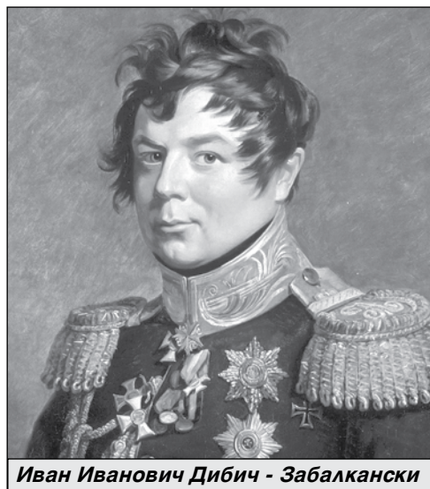
Иван Иванович Дибич - Задбалкански