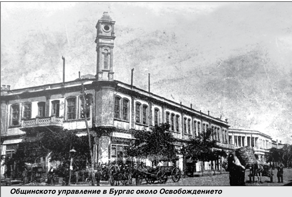
Общинското управление в Бургас около Освобождението

Освободените и изоставени от българите български села веднага са заселени от докарани от Анадола турци. Нещо повече. Русия и Турция се договарят за размяна на славянско население (основно българи и отчасти сърби) срещу изпращане на мюсюлмани и татари от територията на Руската империя. Това е била много опасна за бъдещето на България стъпка, която не е доведена до успешен край. Основните причини са, че постепенно Турция разбира, че преселените от Русия мюсюлмани не са грижовни стопани и селскостопански производители и не внасят нужните на турската хазна данъци. Нещо повече. Новодошлите преселници от Русия се считат за господари, не се трудят и не желаят да участват в преследването на гяурите по време на бунт, безредици и други подобни. Някои от преселниците не са могли да се аклиматизират и пожелават да се върнат в Русия след Освобождението на България. Руската армия оказва помощ на желаещите да се преселят българи. Типичен пример е Созопол. След превземането му от адмирал Кумани, в града се стичат отвсякъде българи, изразяващи своята радост и доверие. По нареждане на руския адмирал, се предприема извозване на хората с имуществото им от св. Николаи и св. Троица до града. Бежанците се обезпечават с храна и продо-