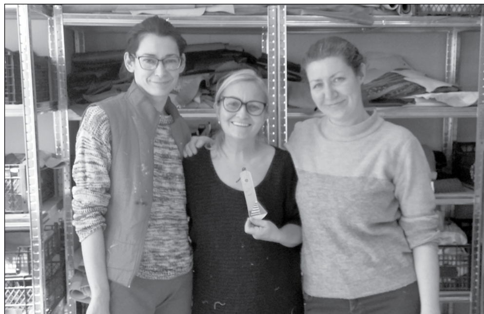
Част от екипа на „Морски знаци“

Със сигурност от „Морски знаци“ ще продължат да изненадват с дейността си и да даряват енергия, свързана с Бургас и морето. А експериментите, носещи огромен творчески заряд в предприятието, ще продължат.