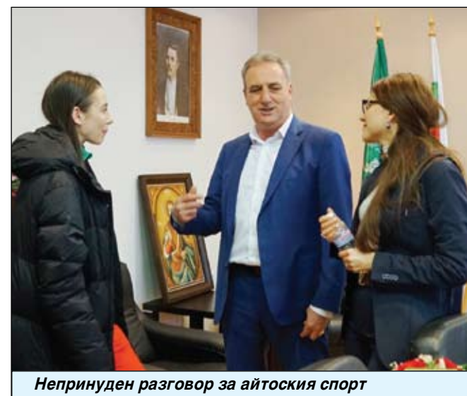
Непринуден разговор за айтоския спорт