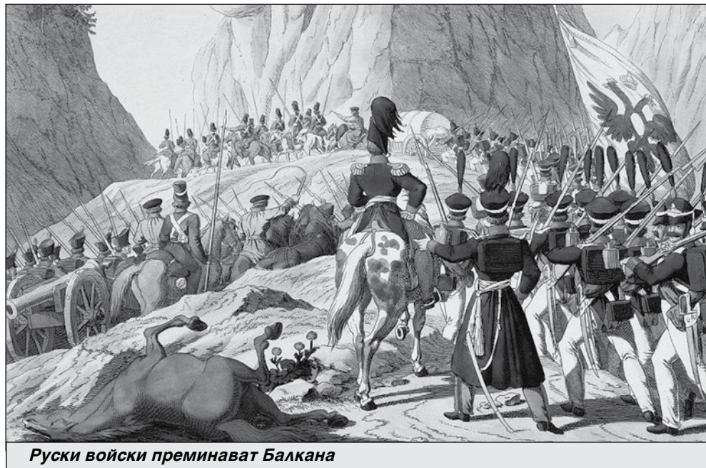
Руски войски преминават Балкана

нали през Табите. Бабини им казвали: „Кума майка, занесете на руските солдати вода и хляб“. Частите на Втората руска армия настъпват победоносно и през лятото на 1829 г. завземат цяла югоизточна България: Силистра, Варна, Несебър, Поморие, Бургас, Созопол и Сливен. Д-р Зейдлиц си спомня за ласкавия прием и доверие на българите към руските войски. „В навечерието на превземането на Несебър, пише той, в близките села, в своите изоставени жи-