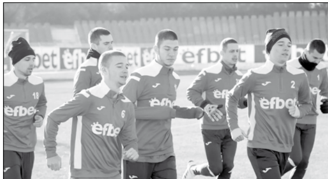
„Несебър“ изгуби от „Левски“ (Крумовград)

Юношите и девойките също са на лагери. От днес девойките са в комплекс „Диана“, младите ни борци в свободния стил от утре са в Сливен, а класиците започват подготовка в Тетевен от 1 март.