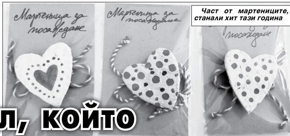
Част от мартениците, станали хит тази година