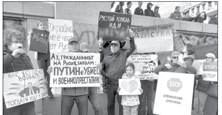
Сред протестиращите имаше и руснаци, които заявиха, че преди време са предупреждавали за случващото се в Украйна, но тогава са ги наричали „маргинали“ и не са обръщали внимание на думите им