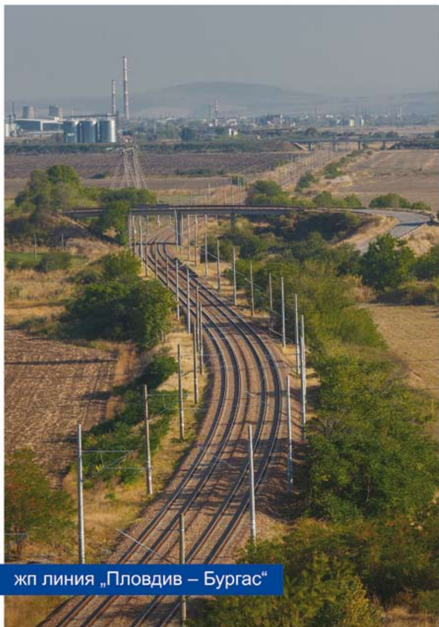
жп линия „Пловдив – Бургас“