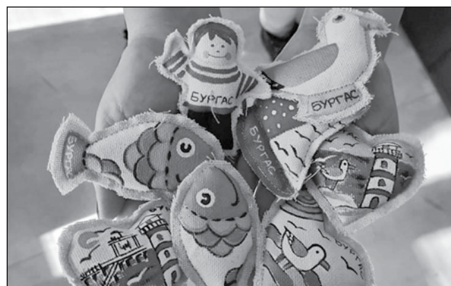
Ръчно изработените символи носят бургаска енергия

Дизайнерката говори разпалено за реалната цел – изделията да стоят стабилно на пазара, а марката, която вече девет години е на пазара, да продължи да се развива. В момента „Морски знаци“ не се издържа с европейски средства и това е важно за съществуването му. Така на всички, които са вътре в